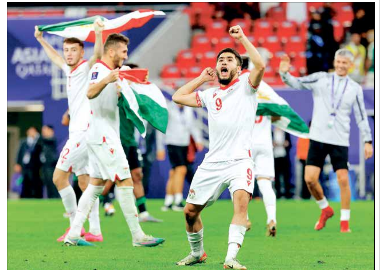
طاجكستان خطفت الأضواء بالتألق على حساب الإمارات

دي جانيرو 2016)، هؤلاء كانوا العلامة الفارقة الوحيدة، في بلد تعتبر فيه رياضة الفوتسبجيري، وهي نوع من المصارعة التقليدية التي تجمع آلاف الأشخاص في الشوارع، الاسم الأبرز هناك إلى جانب كرة القدم التي تحظى بشعبية كبيرة رغم ضعف المستوى في ما مضى. قد يصعب الوضع بعد فترة مختلفاً أكثر في طاجكستان التي تعيش حالياً لحظة المجد الأبرز، فبعد الحديث عن الإنجاز بالتأهل