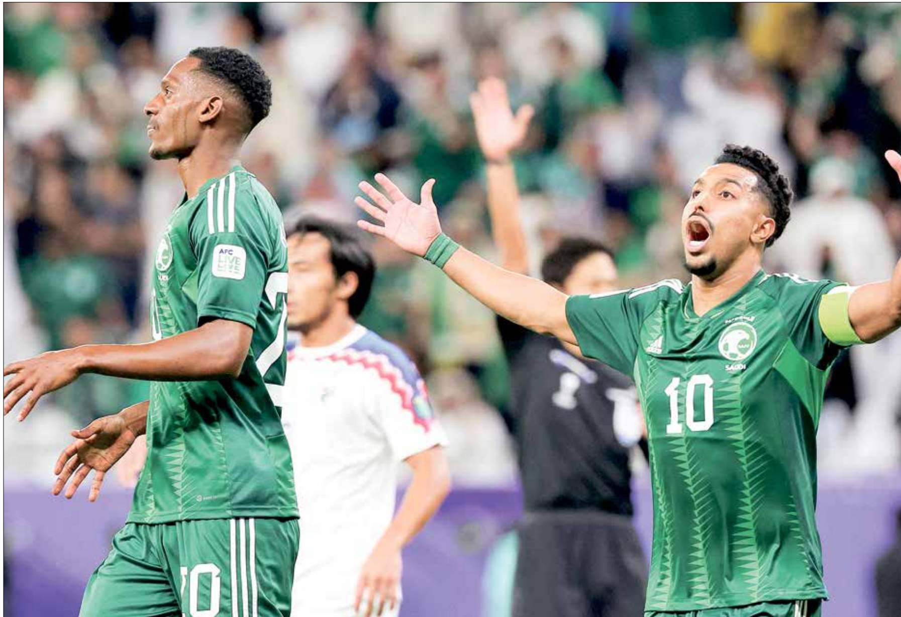
منتخب السعودية أحد المرشحين لحرار اللقب

الدوري الذي لم يسجل أو يصنع أي هدف في الدور الأول. وشارك عبد الرحمن غريب، لاعب المنتخب السعودي، في التدريبات، وذلك بعد غيابه في الأيام الماضية عنها. وفي مباراة أخرى على ملعب الجنوب، تلتقي أوزبكستان مع تاييلاند في أول مواجهة بينهما في البطولة الآسيوية. وانتهت آخر مواجهتين بين المنتخبين لصالح أوزبكستان بنتيجة واحدة 2-0. وكان المنتخب التايلاندي أحد منتخبتين لم يدخل شبكاهما أي هدف في دور المجموعات إلى جانب قطر حامله اللقب.