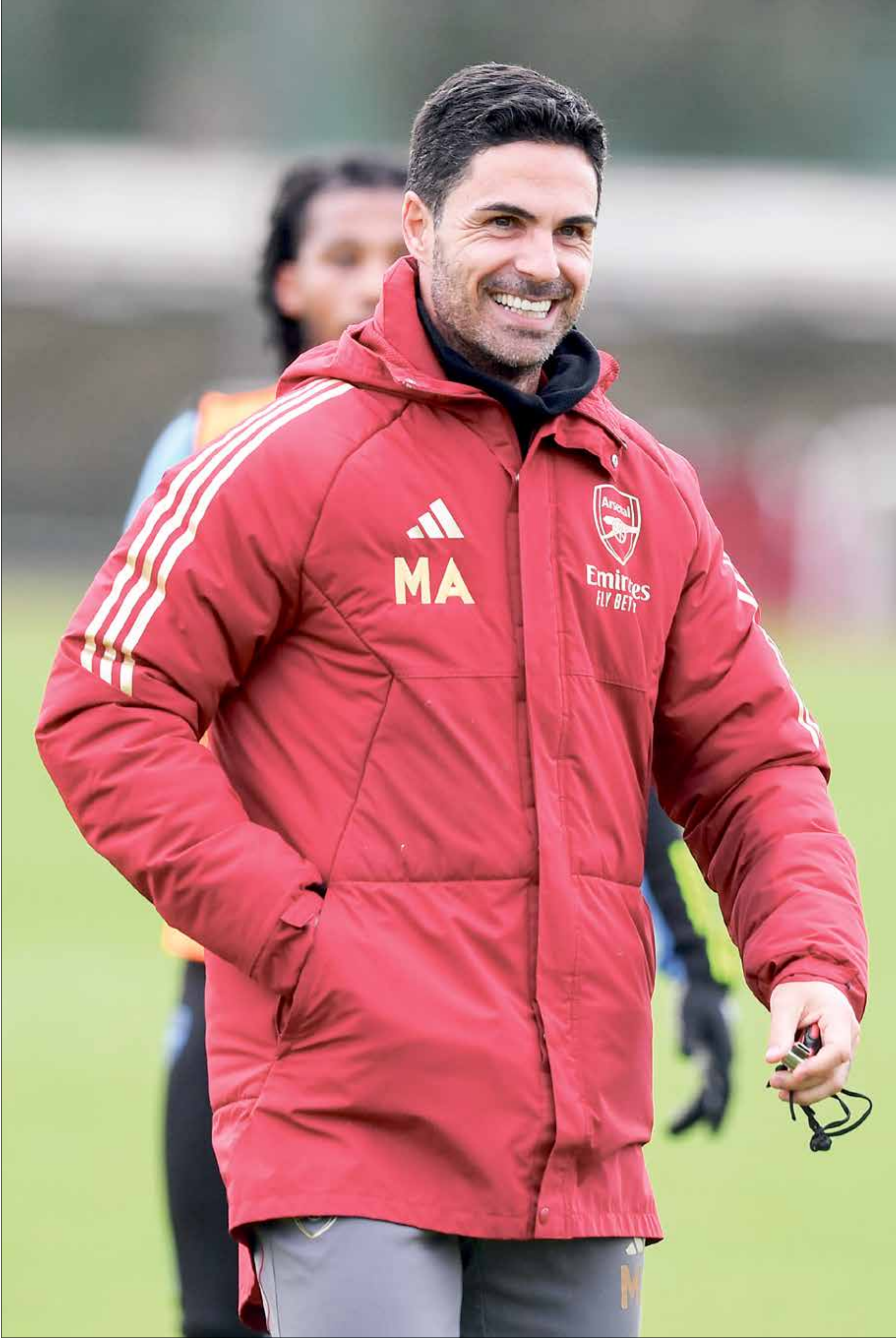
يرتقب ان يجدد ارتيتا عقده مع ارسنال

بعد انتشار خبر مغادرة المدرب الإسباني، ميكيل ارتيتا، لفريق ارسنال، نفت مصادر خاصة لقناة «سكاي سبورتس» صحة هذا الخبر، وأكدت ان ارتيتا اصبح قريباً من تجديد عقده مع «المدفعية» لسنوات مقبلة، مشيرة إلى ان المعلومات التي انتشرت كانت مجرد إشاعة تداولها رواد مواقع التواصل الاجتماعي من دون تدقيق.