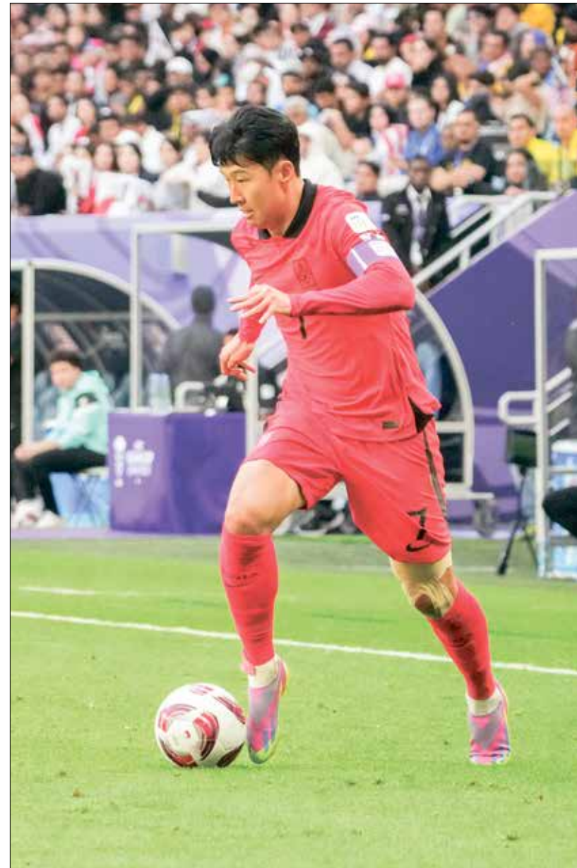
كوريا الجنوبية تملك في صفيها نجومها كيارا