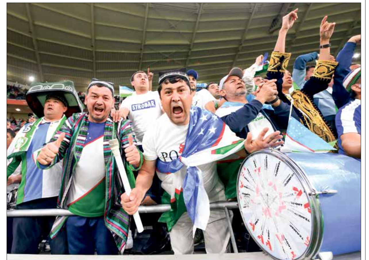
منتخب أوزبكستان مرشح للذهاب بعيداً في البطولة

سيشهد دور الـ16 لبطولة كأس آسيا 2023 مواجهةً من الصبار الثقيل بين منتخبي السعودية وكوريا الجنوبية والذين يعتبران من بين أقوى المرشحين للذهاب بعيداً في البطولة الآسيوية، ولما لا إلى المباراة النهائية يوم 10 فبراير/ شباط القادم على ملعب «الوسيل». وتاهل منتخب السعودية بعد أن تصدر مجموعته السادسة في دور المجموعات برصيد 7 نقاط من فوزين على كل من عُمان وقرغيزستان وتعادل الجنوبية إلى هذا الدور بعد حلوله وصيفاً في مجموعته الخامسة برصيد 5 نقاط من فوز وتعادلين وقبل المواجهة المرتقبة، تبرز إلى الواجهة المواجهات التاريخية التي جمعت المنتخبين في بطولة كأس آسيا والتي جعلت السعودية بمثابة كابوس لكوريا الجنوبية. المواجهة بين المنتخبين دائماً ما تكون تنافسية إلى أبعد حدود نظراً للإحصاءات التي سجلها التاريخ، ففي 19 مباراة جمعت المنتخبين في جميع اللقاءات الودية والرسمية، تفوق منتخب السعودية في 6 مباريات مقابل 7 حالات فوز لكوريا، و5مات تعادل في 6 مباريات، إلا أن التفوق يكاسح كان للسعودية في تاريخ مباريات المنتخبين في كأس آسيا. أول مواجهة جمعت المنتخبين في كأس آسيا، عام 1984، انتهت بتعادل (1 - 1) في دور المجموعات، وكان هذا التعادل من بين الأسباب التي أقصت كوريا من الدور