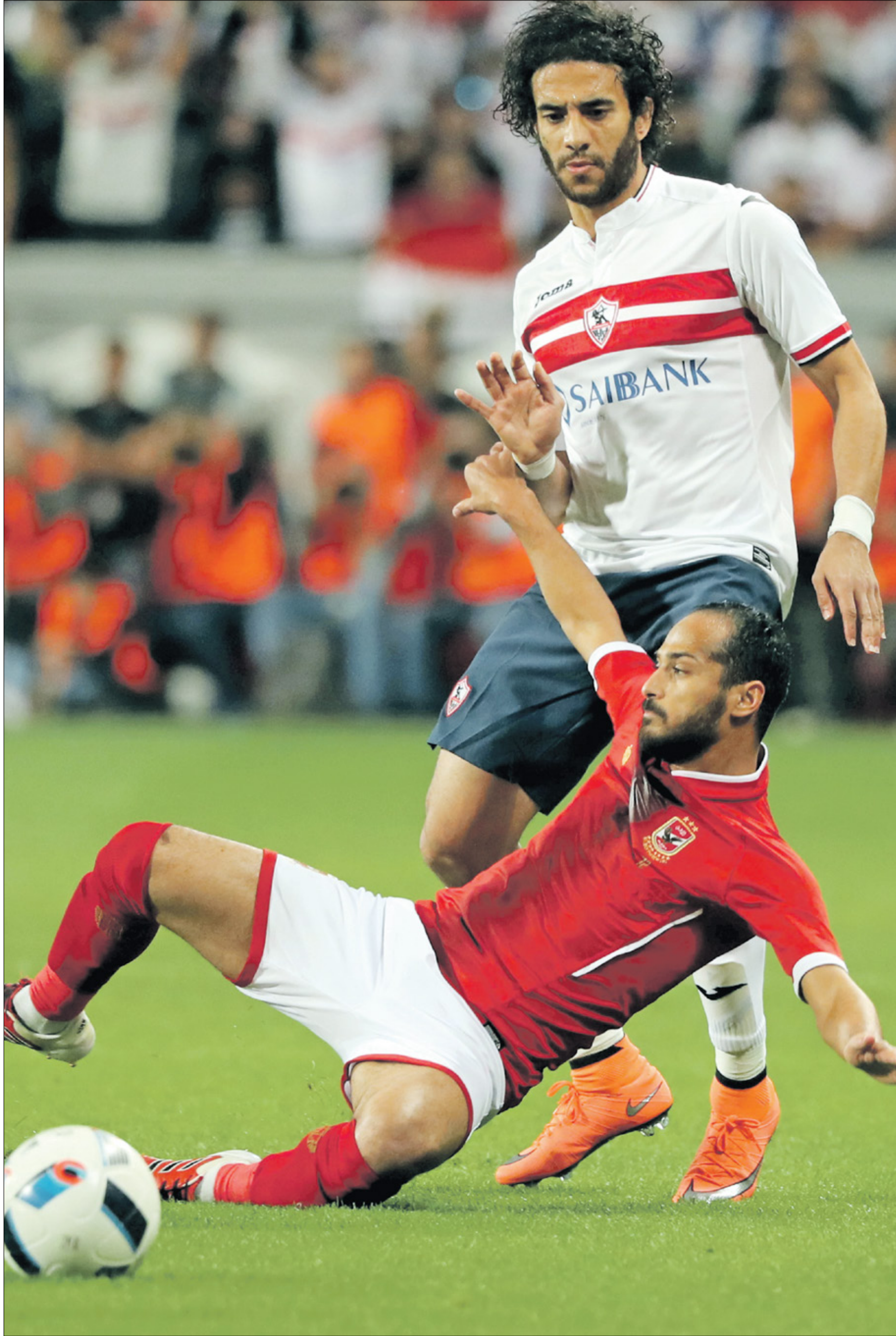
من قمة الزمالك والاهلي على ملعب الوداد ببارك يوم 8 مارس/ آذار 2024

عاقبت رابطة الأندية المصرية المحترفة، نادي الزمالك، بغرامة مالية قدرها مائة ألف جنيه مصري (2000 دولار أميركي)، بعد اعتذاره عن عدم خوض مباراة الزمالك والاهلي في الجولة الـ 27 من عمر الدوري المصري لكرة القدم لموسم 2023-2024. وأصدرت رابطة الأندية المحترفة قرارات في أحداث مباراة الاهلي والزمالك التي لم تقم لاعتذار الزمالك، تصدّرها اعتبار نادي الاهلي فائزاً بهدفين من دون رد وحصوله على ثلاث نقاط، وخضم ثلاث نقاط من رصيد نادي الزمالك حالياً في جدول الترتيب.