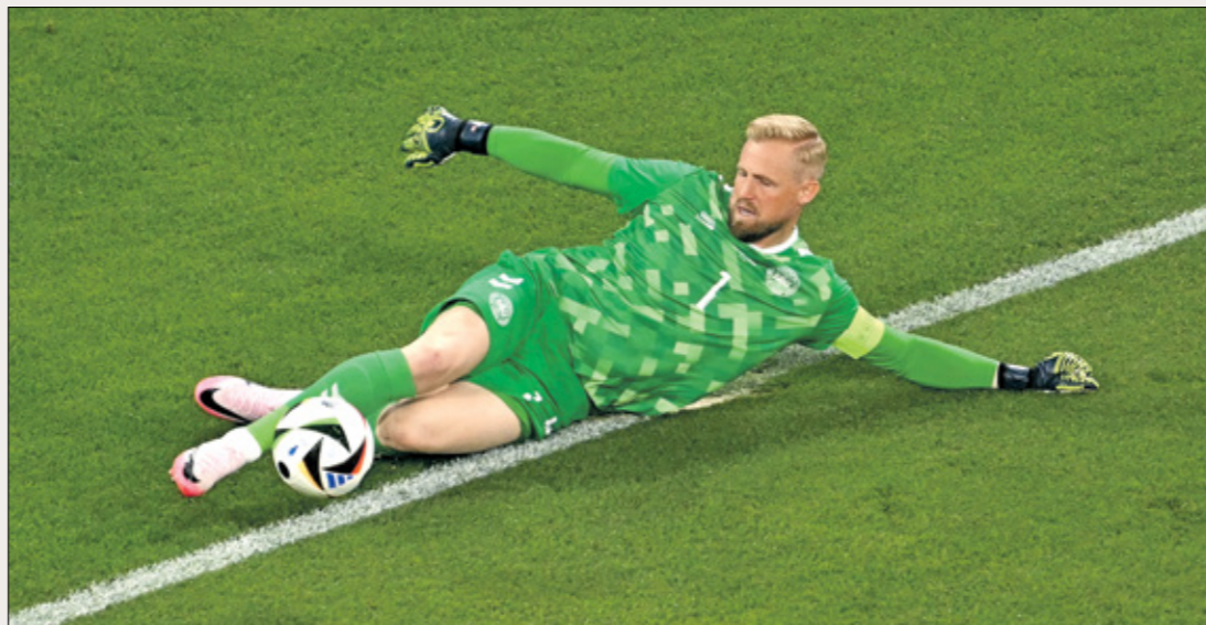
تألق الحارس كايير شفاينك في يورو 2024