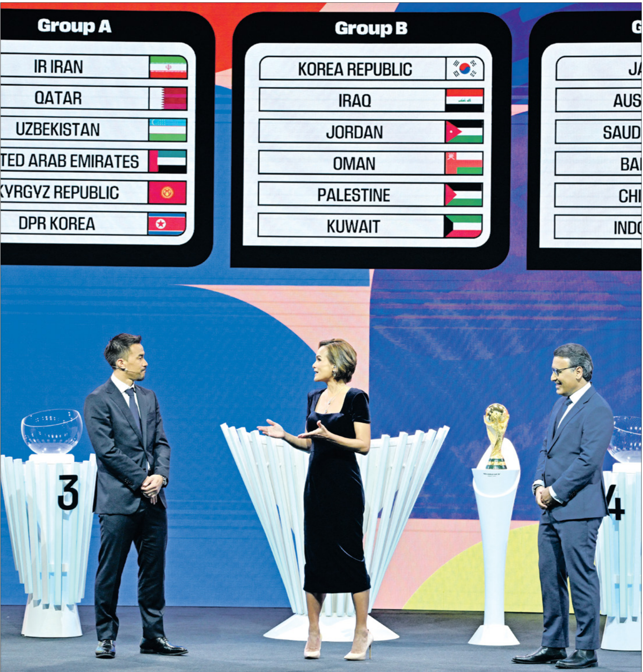
من فرعة الدور الثالث للتحفيات الآسيوية المؤهلة إلى مونديال 2026

تضم المجموعة الثانية في فرعة التصفيات الآسيوية المؤهلة إلى بطولة كأس العالم 2026 لكرة القدم خمسة منتخبات عربية، إلى جانب منتخب كوريا الجنوبية القوي الذي يأتي من المستوى الأول في التصفيات العربية الخمسة هي العراق والأردن وعمان وفلسطين والكويت، وستتنافس من أجل الحصول على البطاقتين المؤهلتين مباشرة إلى بطولة كأس العالم 2026، في وقت يمكن لمنتخب عربي ثالث أو حتى رابع التأهل بينما يمكن أن يحتل منتخبتان عربيتان المركزين الأول والثاني والتأهل معاً إلى المركزين الأول والثاني والتأهل معاً إلى