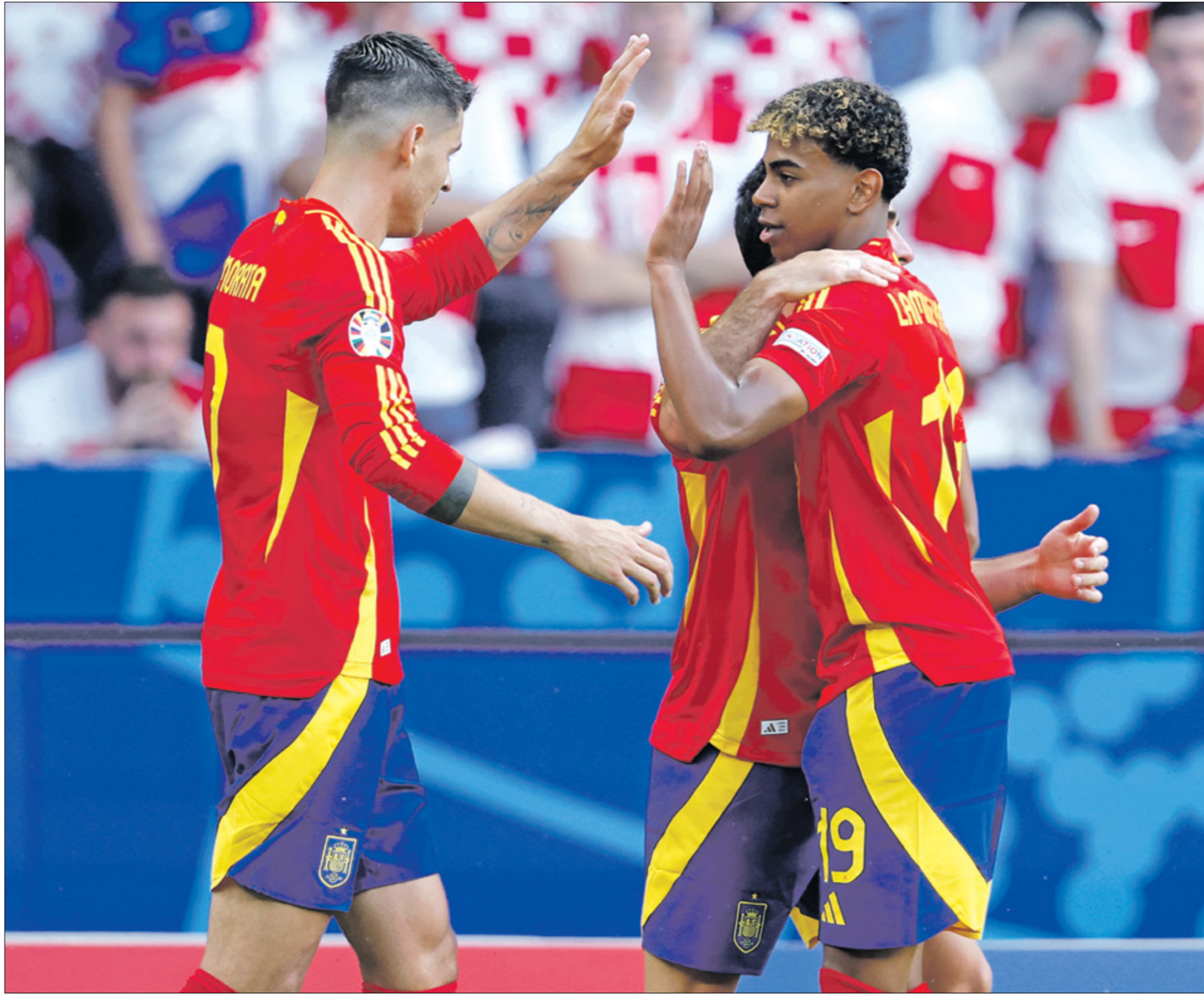
إسبانيا الوحيدة التي حصلت على العلامة الكاملة

وخاصة في نصف نهائي مونديال 2018 عندما تاهل المنتخب الفرنسي على حساب «الشياطين الحمر» في لقاء جدلاً كبيراً، وخاصة أن التنافس تاريخي بين البلدين، وبالتالي فإن اللقاء سيكون قوياً للغاية وسيجلب الاهتمام بوجود لاعبين من أعلى مستوى، ولم يقدم المنتخبات مستوى جيداً في الدور الأول، حيث حقق كل منتخب نصيباً وجاهداً، وكان المنتخب البلجيكي قريباً من وداع البطولة منذ الدور الأول، إثر بداية متعثرة أمام سلوفاكيا، ولكنه يملك الموقف أمام رومانيا بانتصار صعب، وفي اللقاء الثاني يلعب منتخب البرتغال أمام