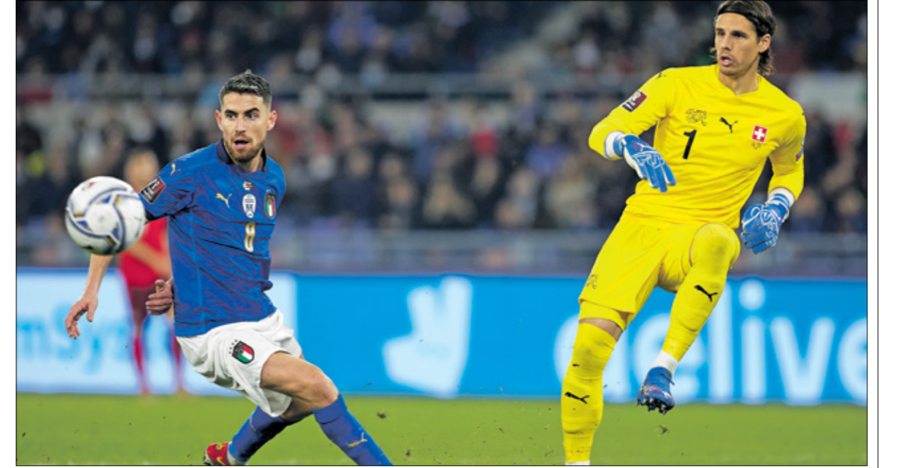
تجدد الحوار بين سويسرا وإيطاليا