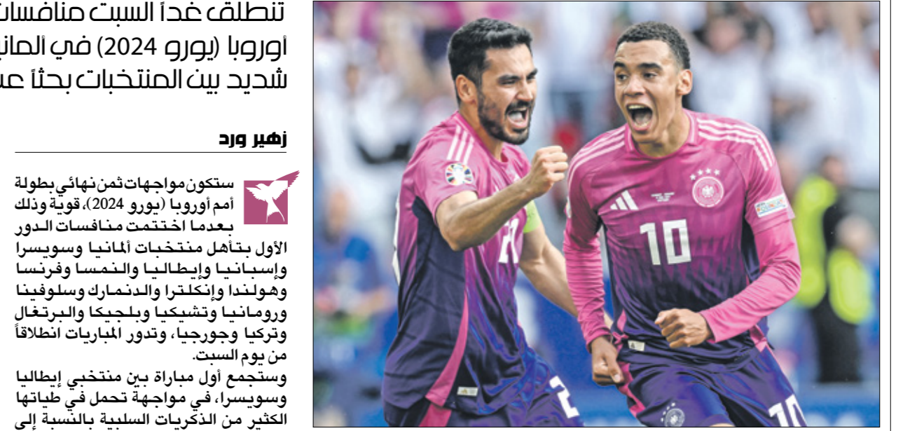
ألمانيا تملك هجوماً قوياً

كما تقام مواجهة ثانية بين إسبانيا وجورجيا، وكان المنتخب الإسباني قد ضرب بقوة في المجموعة الثانية، أقوى المجموعات في النهائيات، بعدما حصد العلامة الكاملة، وهو الفريق الوحيد الذي فاز بكل مبارياته إلى حد الآن، وقد أصبح المرشح الأول لحصد اللقب، وخاصة أنه فاز في اللقاء الثالث على ألمانيا رغم أنه اعتمد على عدد من العناصر الاحتمالية، في الأثناء حقق منتخب جورجيا إنجازاً كبيراً بالتأهل إلى هذا الدور، بعد انتصار مُنتخب على البرتغال في الجولة الثالثة، غير أن فرصه في الصعود أمام إسبانيا تبدو ضعيفة للغاية حيث