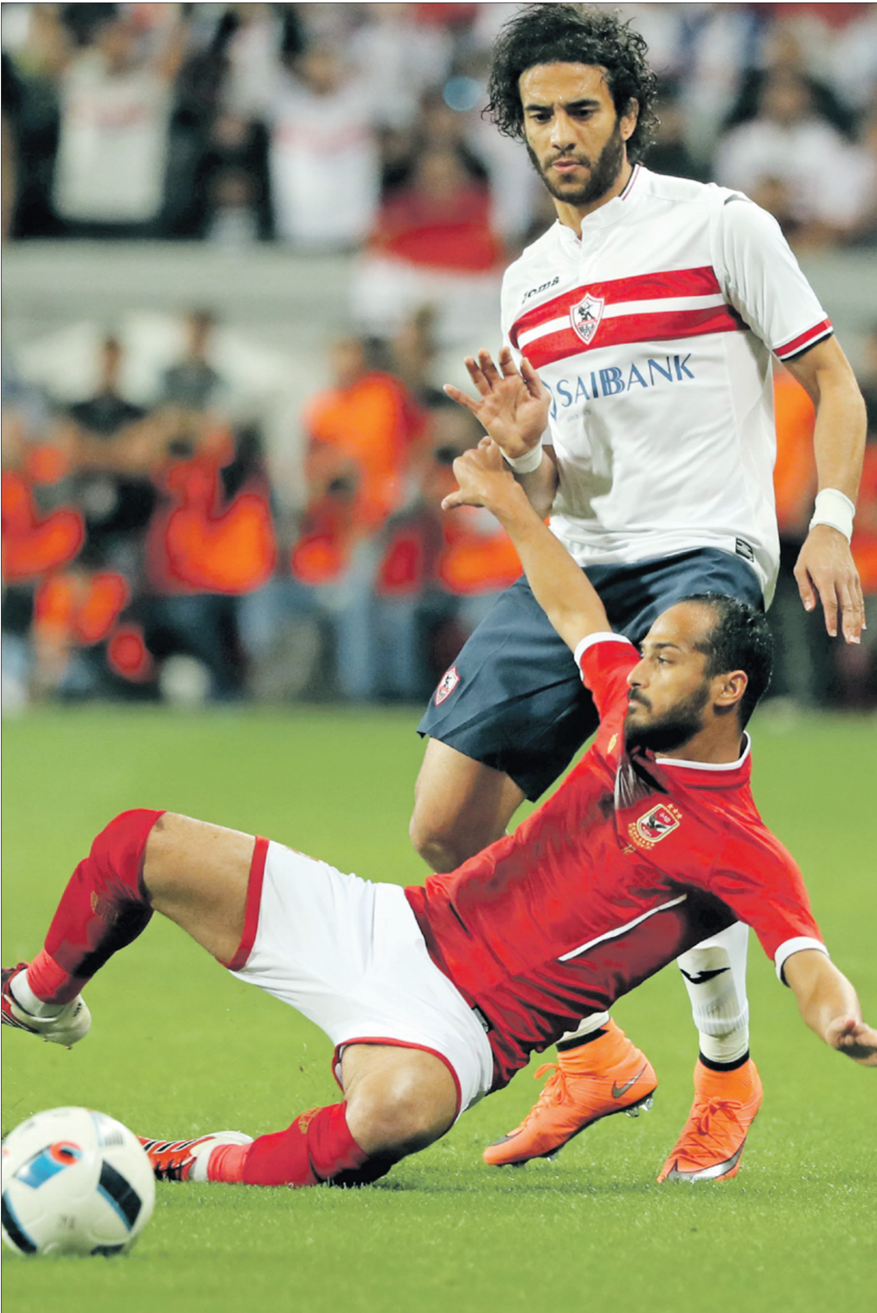
من قمة الزمالك والأهلي على ملعب الأول، يوم 8 مارس، آذار 2024 (الأنشوب)