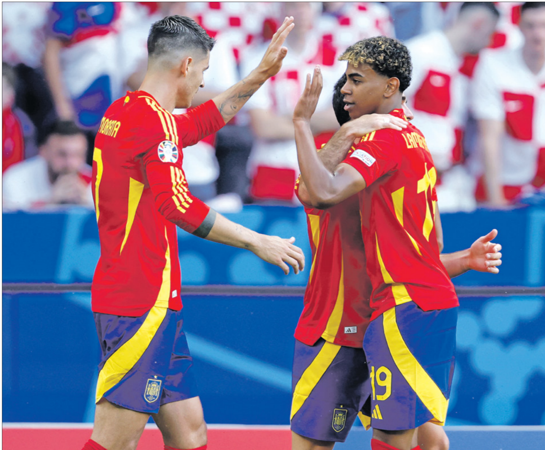
إسبانيا الوحيدة التي حصلت العلامة الكاملة

وخاصة في نصف نهائي مونديال 2018 عندما تاهل المنتخب الفرنسي على حساب «الشياطين الحمر» في لقاء أثار جدلاً كبيراً، وخاصة أن التنافس تاريخي بين البلدين، وبالتالي فإن اللقاء سيكون قوياً للغاية وسيجلب الاهتمام بوجود لاعبين من أعلى مستوى، ولم يقدم المنتخبات مستوى جيداً في الدور الأول، حيث حقق كل منتخب نصيباً من الأهداف، وكان المنتخب البلجيكي قريباً من وداع البطولة منذ الدور الأول، إثر بداية متعثرة أمام سلوفاكيا، ولكنه يملك الموقف أمام رومانيا بانتصار صعب، وفي اللقاء الثاني يلعب منتخب البرتغال أمام