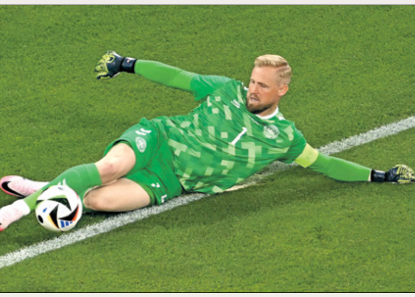
تألق الحارس كايغر شوايك في يورو 2024