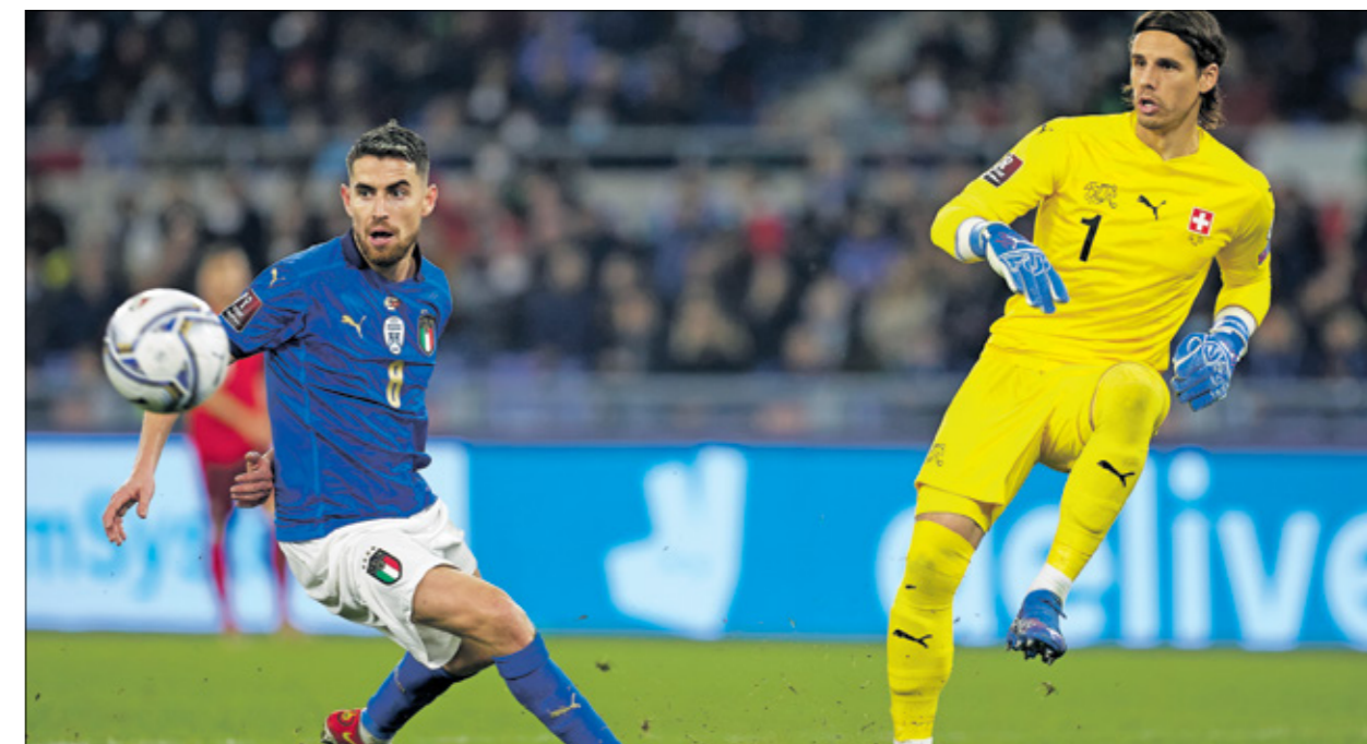
تجدد الحوار بين سويسرا وإيطاليا