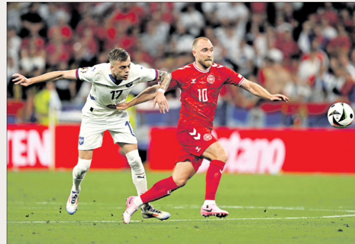
تعد إريكسن أحد أبرز نجوم منتخب الدنمارك

وسمكون على إريكسن، الذي يعد قلب منتخب الدنمارك النابض، قيادة منتخب بلاده في مباراة صعبة للغاية في دور الـ16 كاس أمم أوروبا لكرة القدم الحالية، حيث ستواجه نظيره الألماني. ويتذكر الكثيرون بالفعل نهائي «يورو 1992» في السويد، عندما نجح الدنماركيون في تعهول المباريات الألمانية، والتتويج بلقب المسابقة القارية. وفي غياب مورتن هولموند، الغائب بسبب الإيقاف، سيمون إريكسن هو اللاعب الأبرز في صفوف منتخب الدنمارك.