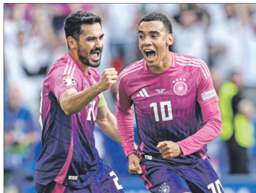
ألمانيا تملك هجوماً قوياً

كما تقام مواجهة ثانية بين إسبانيا وجورجيا، وكان المنتخب الإسباني قد ضرب بقوة في المجموعة الثانية، أقوى المجموعات في النهائيات، بعدما حصد العلامة الكاملة، وهو الفريق الوحيد الذي فاز بكل مبارياته إلى حد الآن، وقد أصبح المرشح الأول لحصد اللقب، وخاصة أنه فاز في اللقاء الثالث على ألمانيا رغم أنه اعتمد على عدد من العناصر الاحتياطية. في الأثناء، حقق منتخب جورجيا إنجازاً كبيراً بالتأهل إلى هذا الدور، بعد انتصار مُتَعَب على البرتغال في الجولة الثالثة، غير أن فرصه في الصعود أمام إسبانيا تبدو ضعيفة للغاية حيث