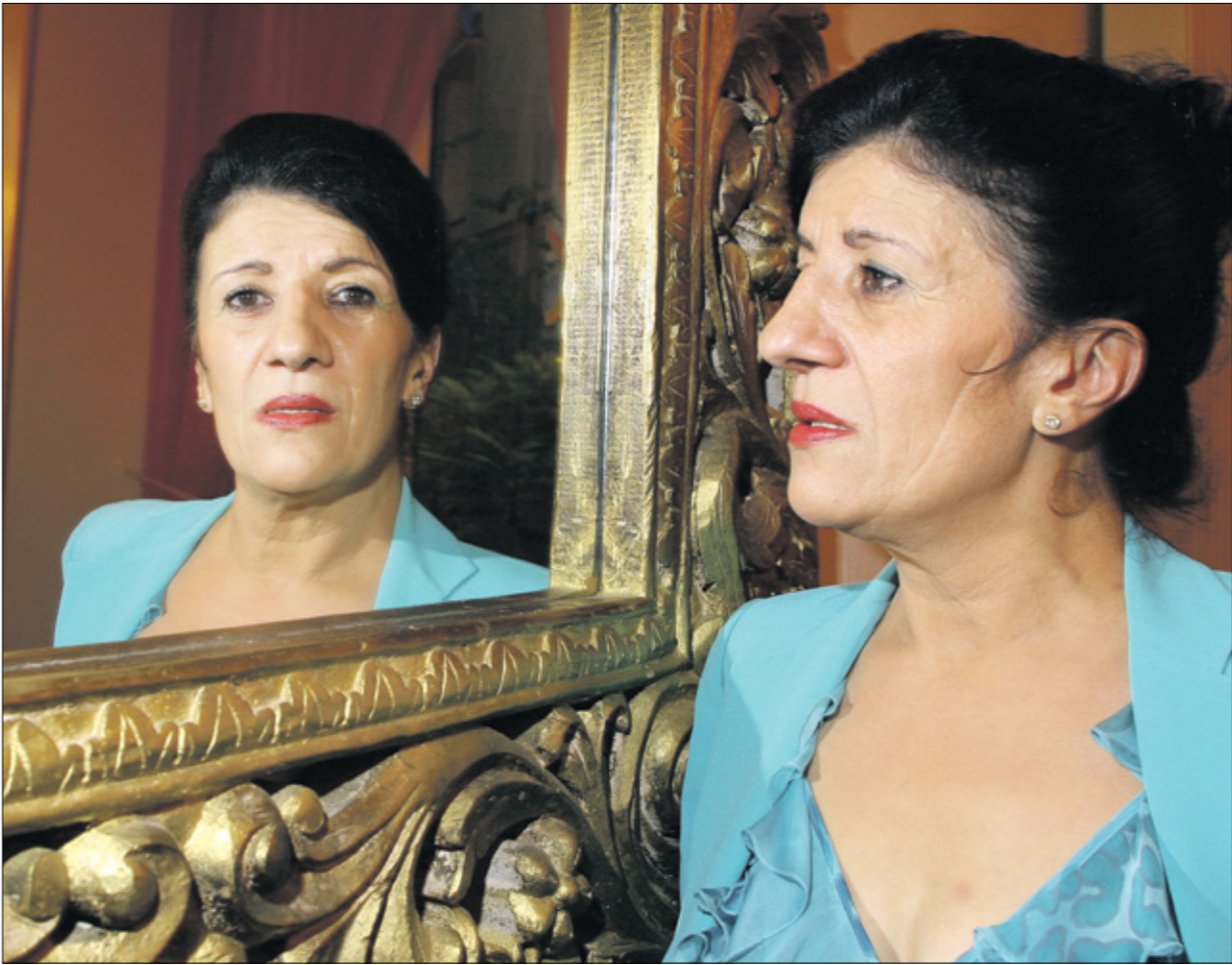
بيوتة، التلم مع ابي جوب من جوب ماسعود طاهر