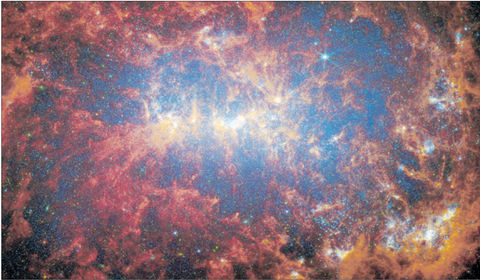
مجرة NGC 4449 التي تبعد عنّا 12.5 مليون سنة ضوئية

لاحظ علماء فلك عناقيد نجمية في الكون كثيفة للغاية، لدرجة أن كتلتها وضوءها لعبا دوراً رئيسياً في تطوّر مجرتنا عند الفجر الكوني، بحسب ما أظهرته دراسة نشرتها مجلة نيتشر أخيراً