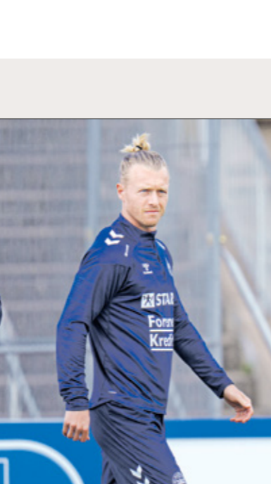
لم يشارك كايغر مع الدنمارك في المباريات