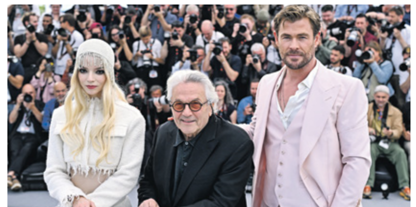
جورج ميلر بين أبا إليز جوب وكريس مفسورت مع كان (الأنشوب كارز باليه، Getty)

بإرلين، المصري الجديد «فوروسا». ملحمة ماد ماكس (2024)، لـاسترالي جورج ميلر (1945)، معروض للمرة الأولى دولياً خارج مسابقة الدورة الـ 71 (14 مايو/أيار 2024) لمهرجان Mad Max Beyond Thunderdome (1985)، ميلر، والـأسترالي جورج أولجفي (24 مايو/أيار، بعد طرد واحد فقط على بدء عروضه التجارية الأسترالية، فيلم من 148 دقيقة، تبلغ ميزانيته 168 مليون دولار أميركي، وإيراداته الدولية، بين 22 مايو/أيار و23 يونيو/حزيران 2024، تساوي 168 مليوناً و76 ألفاً و980 دولاراً أميركياً (فوكس أوفيس موجو)، في فرنسا، تعرض في اليوم نفسه لعرضه الأول في «كان»، وبين 22 مايو/أيار و19 يونيو/حزيران 2024، يُشاهده 828 ألفاً و705 مشاهد.