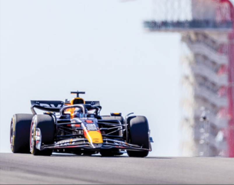
سالفريد بولر الهولندي ماكس فيرستابن

وستكون نهاية الأسبوع مهمة لكلا السائقين الآخرين لتفريقيّن: الأسترالي أوسكار بياستري (ماكلاارين) والبطل المحلي سيرخيو بيريس (ريد بول) الذي يسعى لسكات الشائعات المحيطة بمستقبله في صفوف الفريق النمساوي ومدى إمكانية بقائه أو رحيله، ولطالما كان مسبقه، موضعاً للتحقيقات منذ حصوله على تمديد عقده في مايو/ أيار. وقال بيريس: «عليّ فقط الشائعات، والتركيز على وتقنيتي، ومحاولة الحصول على منصة التتويج النفسي والفريق والجمهير». وودد ريد بول عقد بيريس حتى عام 2026، لكنه قد ينتهي قبل هذا التاريخ، بسبب الحرجين في الإداء، ويعد ليام لوسون أحد المرشحين لخلافته، وفي أول جائزة كبرى له هذا الموسم في نهاية الأسبوع الماضي عندما حل مكان الأسترالي أنطال ريكمارو مع فريق راسينغ بولنر، احتل النيوزيلندي البالغ من العمر 22 عاماً المركز التاسع، بعد أن انطلق من المركز الثامن عشر قبل الأخير (فرانس برس)