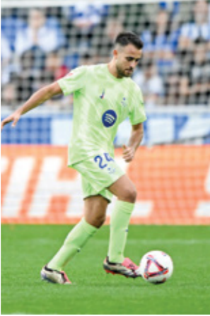
نالف حكيمى بليلك كخبر من المصائب (Gerty)

تهدف التغييرات التي أدخلتها الحكومة البريطانية على إصلاح كرة القدم الإنكليزية إلى منع الاتحاد الأوروبي لكرة القدم (يويفا) من سحب بطولة يورو 2028 من المملكة المتحدة. وقدمت خطة إصلاح كرة القدم الإنكليزية إلى البرلمان، والذي يتضمن بين إجراءات الجديدة استشارة الجماهير في جوانب مثل أسعار التذاكر وبيع اللاعبين، والسلطة على تحديد ما إذا كان سيتم منح مساعدات للهبوط، واستقلالية الحكومة في مجال التجارة عند الموافقة أو عدم الموافقة على بيع الأندية. وتعتبر هذه الخطوة الأخيرة ذات أهمية بالغة لمنع يويفا من تهديد المملكة المتحدة مجدداً بسحب بطولة أوروبا منها بعد أربع سنوات، حيث اعتبر الاتحاد الأوروبي أن تدخل الحكومة قد يحول الدوري إلى شيء يشبه نادي الدولة، وكتب ثيودور ثيودوريس، الأمين العام للاتحاد الأوروبي لكرة القدم، رسالة في شهر سبتمبر/ أيلول إلى ليزا ناندي، وزيرة الثقافة والرياضة البريطانية، حذّر فيها من مخاطر الإصلاح وأكد على أنه يجب ألا يكون هناك تدخل حكومي في كرة القدم، وبدات العلاقة بين الحكومة والأندية تتدهور عندما تم تسريب سلسلة من رسائل البريد الإلكتروني تتعلق بشراء نادي نيوكاسل يونايتد من قبل السعودية.