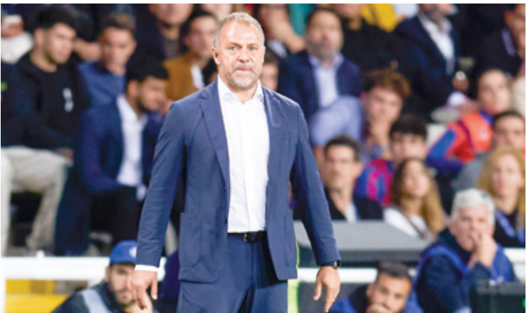
فلين سيواك وضع لكعبين يتناسب مع اهبة الفاء

أكثر من المتصدر برشلونة (27 نقطة)، فيما يدخل الزوار اللقاء من أجل محو خيبة المواجهات الأخيرة لغم الكلاسيكو. وفاز الريال في آخر أربع مباريات له ضد البرسا في جميع المسابقات، ويمكنه تسجيل خمسة انتصارات متتالية في الكلاسيكو.