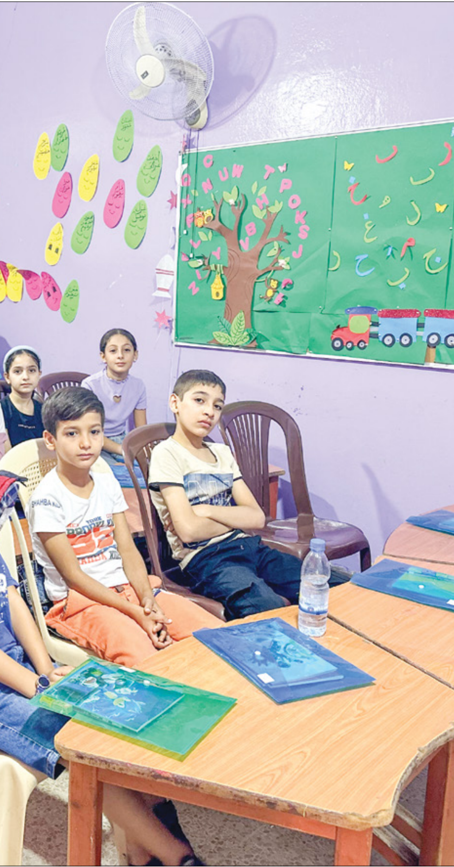
مادرة تعليمية داخل أحد مراكز الإيواء (العربي الجديد)

يضيف: «منذ جئت إلى المخيم، قدمت جمعية واحدة فقط طرّاً غذائياً لنا. هذا ذلك، لم يتصل أحد من إحدانا بنا ولم تعمل على تقديم أي مساعدة لنا. نحن اليوم في أشد الحاجة إلى تلك الخدمات بسبب فقدان الإعلان خسرت عملي، وتركت بيتي تحت وطأة التهديد». يضيف: «أحتاج إلى لادوية سكري وقلب شورية، وليس في إمكاني شرائها. توجهت إلى عبادة أونروا في مخيم عين الحلوة للحصول على الأدوية الشهرية، فأعطوني بعضها بسبب عدم توفر جميعها، فطالب أونروا بأن تقدم لنا الخدمات التي نحتاجها على غرار النازحين