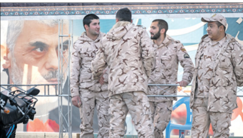
قوات من الحرس الثوري خلال مراسم في طهران، أول من أمس

في موازاة ذلك ذكرت «نيويورك تايمز» مساء أول من أمس، وفق هذا السيناريو، أن استعدت لضربة متوقعة من إسرائيل، أمرت قواتها المسلحة بالاستعداد للحرب، ولكن أيضًا بمحاولة تجنبها، في ظل ما يشهده «حلفاؤها في لبنان وغزة». ونقل الصحيفة عن أربعة مسؤولين إيرانيين بزشكبيان، في تصريحاتهم أن إيران لا تريد الحرب، وذلك وسط ضغوط أميركية على إسرائيل لتفادي مزيد من التصعيد في المنطقة. ودفع الإدارة الأميركية باتجاه الإنكفاء بضربة إسرائيلية محدودة. وكانت طهران قد نفذت عملية «الودع