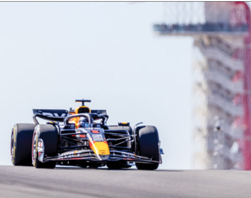
سالفريد بولر الهولندي ماكس فيرستاب (ريد كوبيلاز/Getty)

وستكون نهاية الأسبوع مهمة لكلا السائقين الآخرين لتفريقيّن: الأسترالي أوسكار بياستري (ماكلارين) والبطل المحلي سيرجيو بيريس (ريد بول) الذي يسعى لسكات الشائعات المحيطة بمستقبله في صفوف الفريق النمساوي ومدى إمكانية بقائه أو رحيله، ولطالما كان مسبقه، موضعاً للتحقيقات منذ حصوله على تمديد عقده في مايو/ أيار. وقال بيريس: «عليّ فقط الشائعات، والتركيز على وتقنيتي، ومحاولة الحصول على منصة التتويج النفسي والفريق والجمهير». وودد ريد بول عقد بيريس حتى عام 2026، لكنه قد ينتهي قبل هذا التاريخ، بسبب التحرشن للإصابة، وفي أول جائزة كبرى له هذا الموسم في نهاية الأسبوع الماضي عندما حل مكان الأسترالي أنثاليل ريكمارو مع فريق راسينغ بولنر، احتل النيوزيلندي البالغ من العمر 22 عاماً المركز التاسع، بعد أن انطلق من المركز العشر عشر قبل الأخير (فرانس برس)