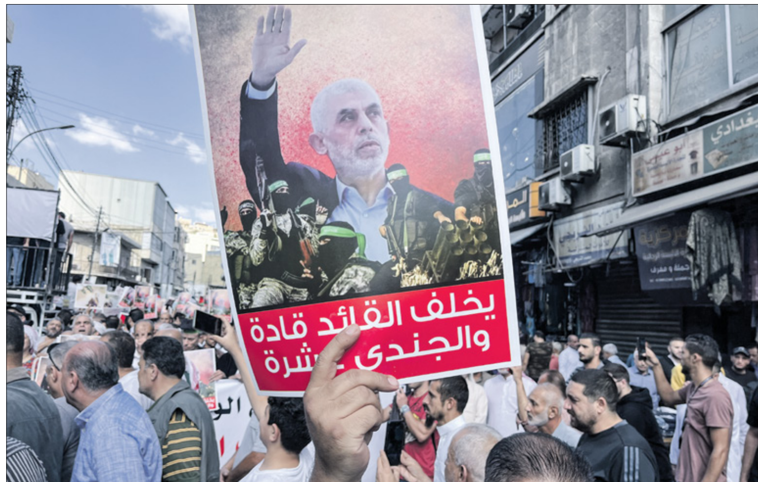
تقدير ليحيى السنوار (بيت الجديدي، الناظول)