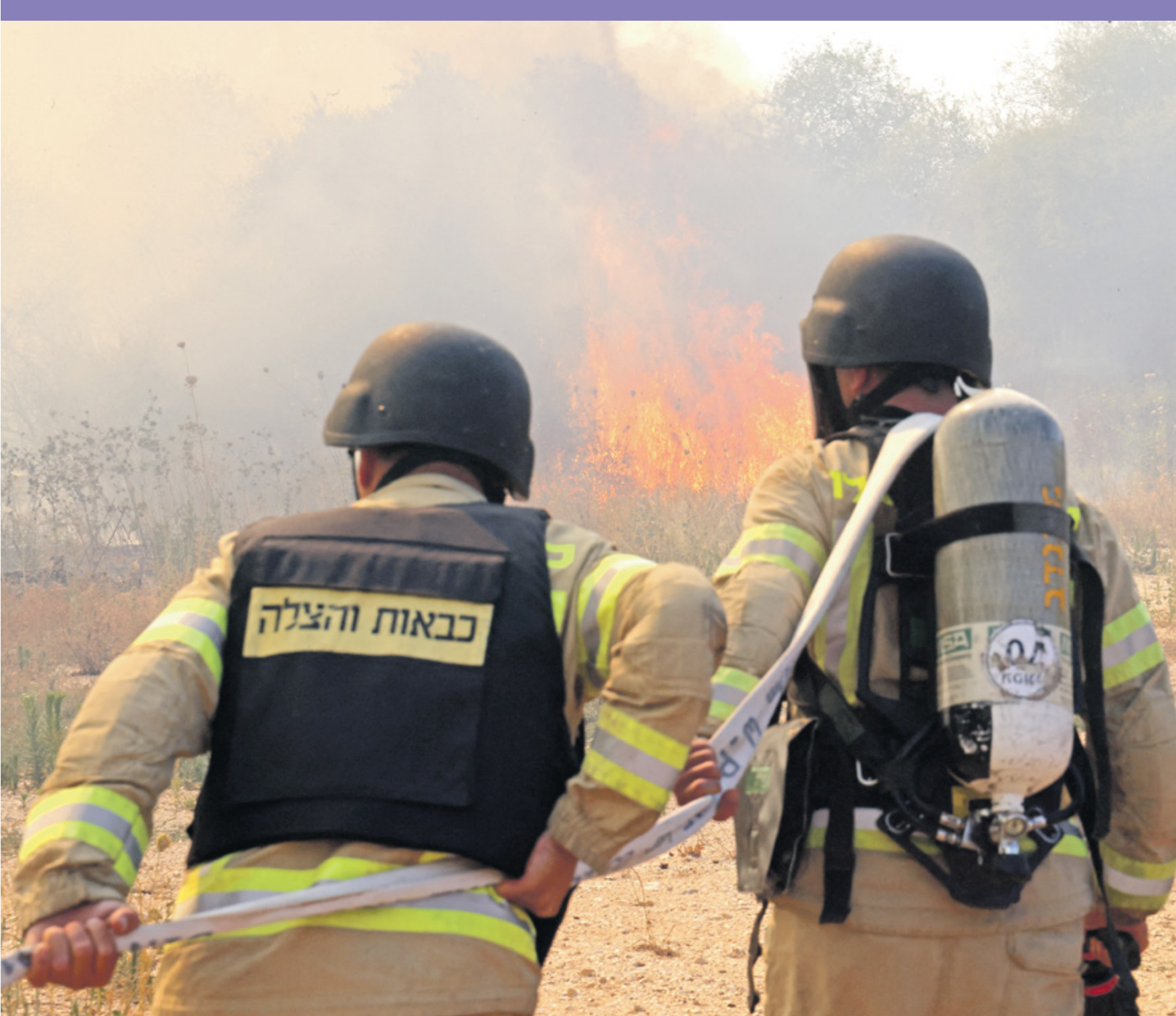
السلفاطين الطول 25 الجليله عامه، 2024

سنتتهي قبل نهاية العام 2024. لكن في الوضع الراهن هناك مخاوف من استمرار الحرب لفترة طويلة، وهو ما يعني إلحاق ضرر اقتصادي أكبر من التوقعات السابقة. في هذا السياق، نشر معهد هارون للسياسات الاقتصادية في جامعة «إرخمان» في هرتسليا، تقريراً جديداً في نهاية سبتمبر الماضي، يعدل فيه التقديرات السابقة للألمان الاقتصادية للحرب منذ التسعينات في الحرب وأتساعها. فقد بُنيت التوقعات والتحايل على غرضية أن الحرب