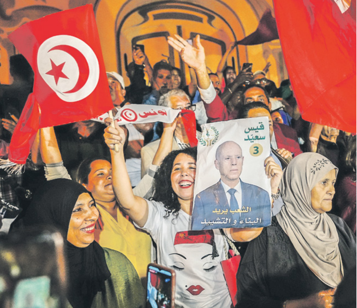
ملابسون سعید يحتفلون بوزار، 6 أكتوبر 2024

لا تزال المعارضة التونسية تتلزم صمغًا تشبه مطبق بعد الانتخابات الرئاسية التي حقق فيها الرئيس قيس سعبد انتصارًا واضحًا على خصومه، وهو ما يعكس على الأرجح صدمتها، على الرغم من أنها لم تكن تعلق امالًا كبيرة عليها. وشهدت انتخابات السادس من أكتوبر/تشرين الأول الحالي مشاركة تقارب المليونين والنمائثة ألف ناخب (من بين تسعة ملايين وسبعمئة ألف ناخب مسجل)، الذي يقصر هذا العزوف وهذه مليونين وأربعمائة ألف لسعيد، فيما تقاسم منافسوه السجين العياشي زمال، والأمين العام لحركة الشعب زهير المغراوي، بقية الأصوات. من العلم أن سعبد كان حصل في الدور الأول من انتخابات 2019 الرئاسية على 620711 صوتًا. ولكنها كانت انتخابات بتناقسية