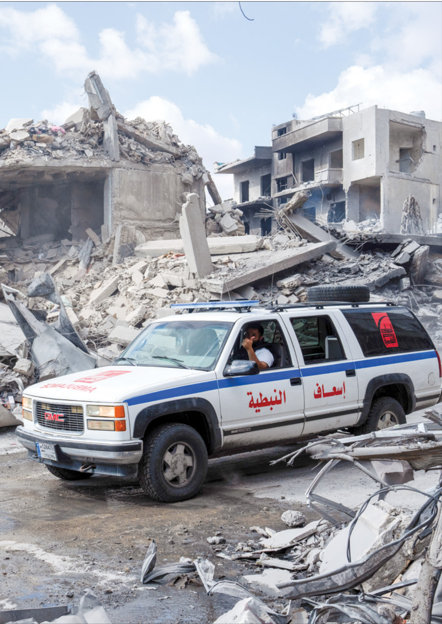
استهداف الاحتلال 158 سيارة إسعاف لبنانية (كان كورنر/ Getty)

أدت فيضانات وانهارات أرضية واسعة النطاق، ناجمة عن العاصفة الاستوائية «ترامي» التي ضربت شمال شرقي الفلبين إلى مصرع ما لا يقل عن 23 شخصاً بحسب الشرطة. وأغلقت الحكومة مدارس ومكاتب للووم الثاني في جزيرة لوزون لحماية ملايين الأشخاص بعد أن ضربت العاصفة الاستوائية مقاطعة إيزابيلاً في شمال شرقي البلاد. بعد منتصف ليل الخميس، وهبت العاصفة فوق بلدة أجويتالدو في مقاطعة بوجواو الجميلة مصحوبة برياح تصل سرعتها إلى 95 كيلومترا في الساعة وعواصف تصل سرعتها إلى 160 كيلومترا في الساعة. (أسوشيتد برس)