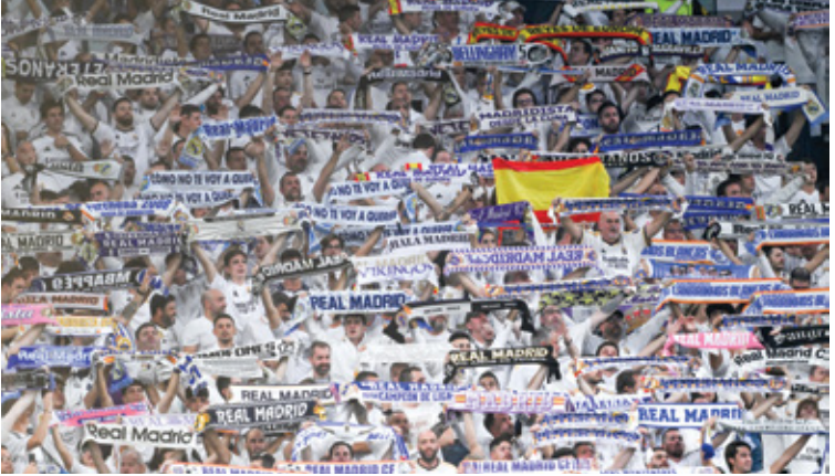
ريال مدريد تلاف هذا الموسم على ملعب «برنابيو»

من أجل حصد نقاط اللقاء، خصوصاً أنه منذ عام 2020، خسر برشلونة عشراً من أصل 14 مباراة له في الكلاسيكو في جميع المسابقات (فاز في أربعة لقاءات)، وهذا هو نفس عدد الهزائم التي تكديها في 39 مباراة سابقة، والتي يعود تاريخها إلى أول مباراة لليب غوارديولا مدرباً في ديسمبر/ كانون الأول 2008 (فاز في 19 لقاء وتعادل في عشرة وخسر مثلها)، وفاز ريال مدريد بأربع من آخر خمس مباريات على أرضه ضد برشلونة في الدوري الإسباني (خسر مرة واحدة)، وفاز في آخر مباراتين، ولم يحقق الملكي ثلاثة انتصارات متتالية على أرضه أمام البلاوغرانا في المسابقة منذ سلسلة من أربعة انتصارات بين عامي 1988 و1991. وخاض الريال حتى الآن 42 مباراة متتالية من دون هزيمة في الدوري الإسباني (فاز 31 مرة وتعادل 11) ويمكنه معادلة أفضل سلسلة من دون هزيمة لفريق في تاريخ المسابقة، التي حققها نادي برشلونة بين إبريل/نيسان 2017 ومايو/أيار 2018 (فاز في 34 لقاء وتعادل في تسعة)، وخاض برشلونة 26 مباراة متتالية من دون تعادل في جميع المسابقات (فاز في 21 وخسر في خمس منذ مارس/آذار الماضي)، ويمكنه معادلة أطول سلسلة له منذ أكتوبر/تشرين الأول 2005 - مارس/آذار 2006 تحت قيادة فرانك ريكارد (خاض 27 لقاء، فاز في 24 منها وخسر في ثلاثة).