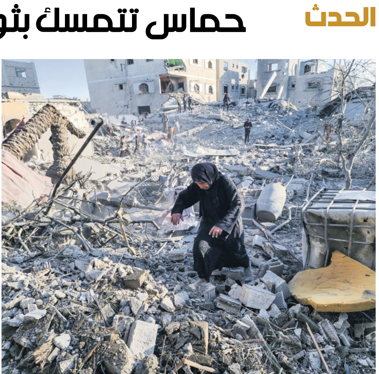
دمار في خانونس أمس (هابان للتلخ) (الناضول)

لم تحد حركة حماس، قبل ساعات من استئناف الحرب على غزة، في الدوحة غدا، عن خطوطها الحمراء، وعلمت الكامل لقوات الاحتلال من القاهرة، فيما استقبلت القاهرة وإسرائيل