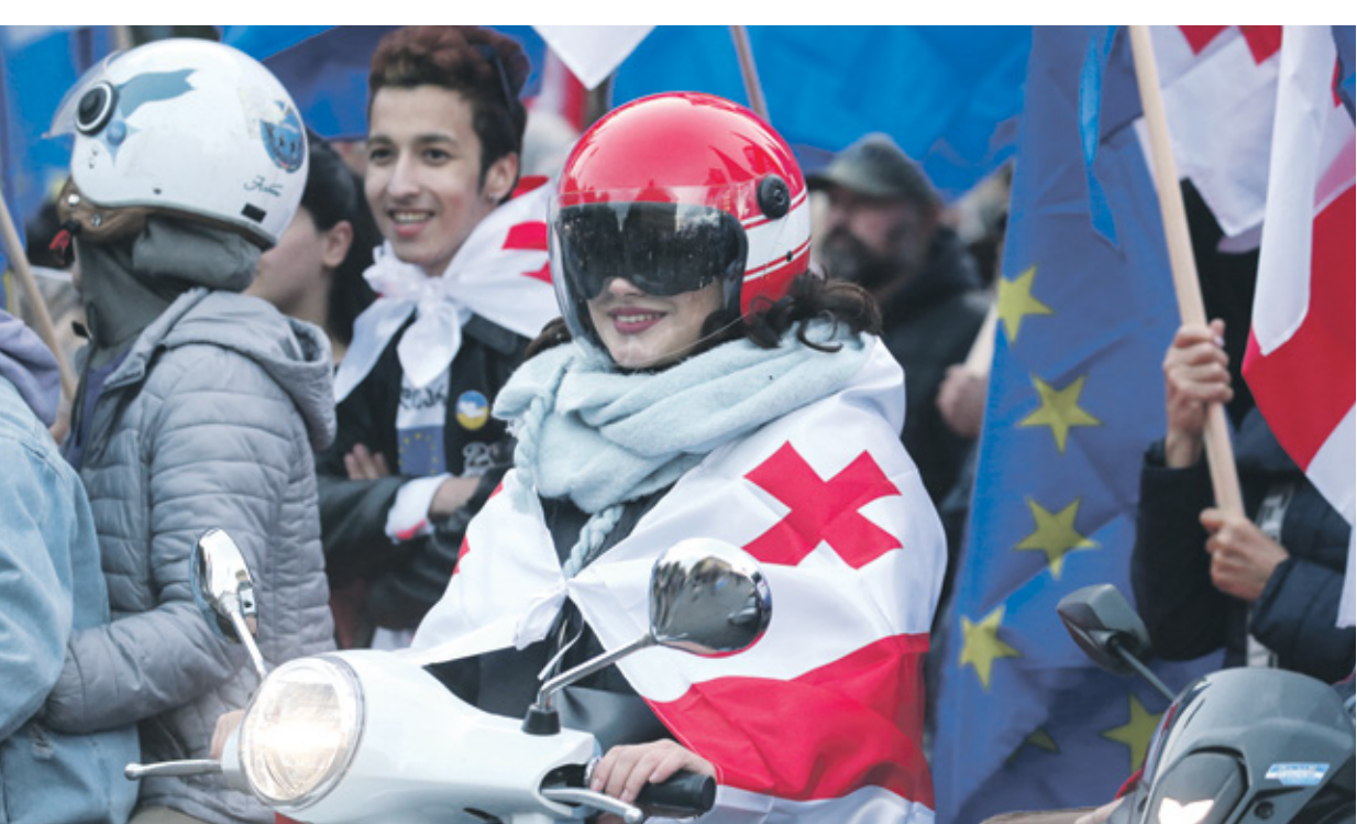
انصار المعارضة خلال تجمع في تلبسي، 20 أكتوبر 2024

حالة من الانقسام العميق في مجتمعات الجمهوريات السوفيتية السابقة، إذ لم تتمكن الرئاسة مايا ساندو من الفوز من الجولة الأولى، بينما تم إخراج التكامل