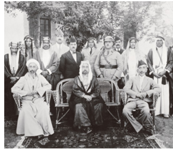
ملوك الأسرة الهاشمية، فيصك وعبد الله وصلي

آخرين عند نشرها، ومع ذلك تبقى وثيقة مهمة تصد عن رجل سجن 17 مرة وعمل مع ملوك الأردن عبد الله وطلال وحسين، وصادق الرئيس جمال عبد الناصر وقمادات البعث في سورية وترك بصمة في تاريخ المنطقة.