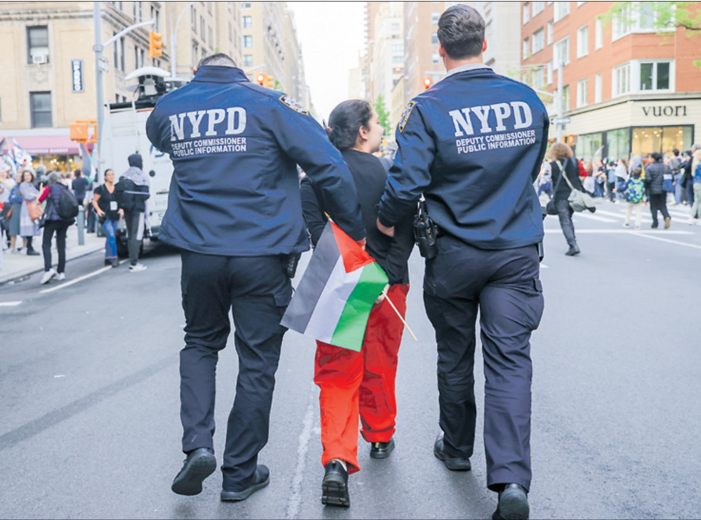
الشرطة الأميركية تصطف لحظاهرة مؤيدة لمسلطين، نيويورك، 6 ايار، مايو 2024

وغالباً ما يُصنّف غريب ومتنظّل وسارق ومجرم ولص ومينافس ومسؤول عن دمار اقتصاد البلدان، وغير معترف به، ومرفوض، وغير مرغوب به، وهو متنافس وسارق للوطنائف وغريب، و«إرهابي»، و«باكل قطننا وكلابنا»، وما لا ينتهي من التسميات والقوالب والتصنيفات التي يصنّفها الوعي السائد ضمن معادلة تحنّ الحقيقتة والآخر هو الزيف، نحن الخير وهو الشر، نحن الحضارة وهو البربرية.