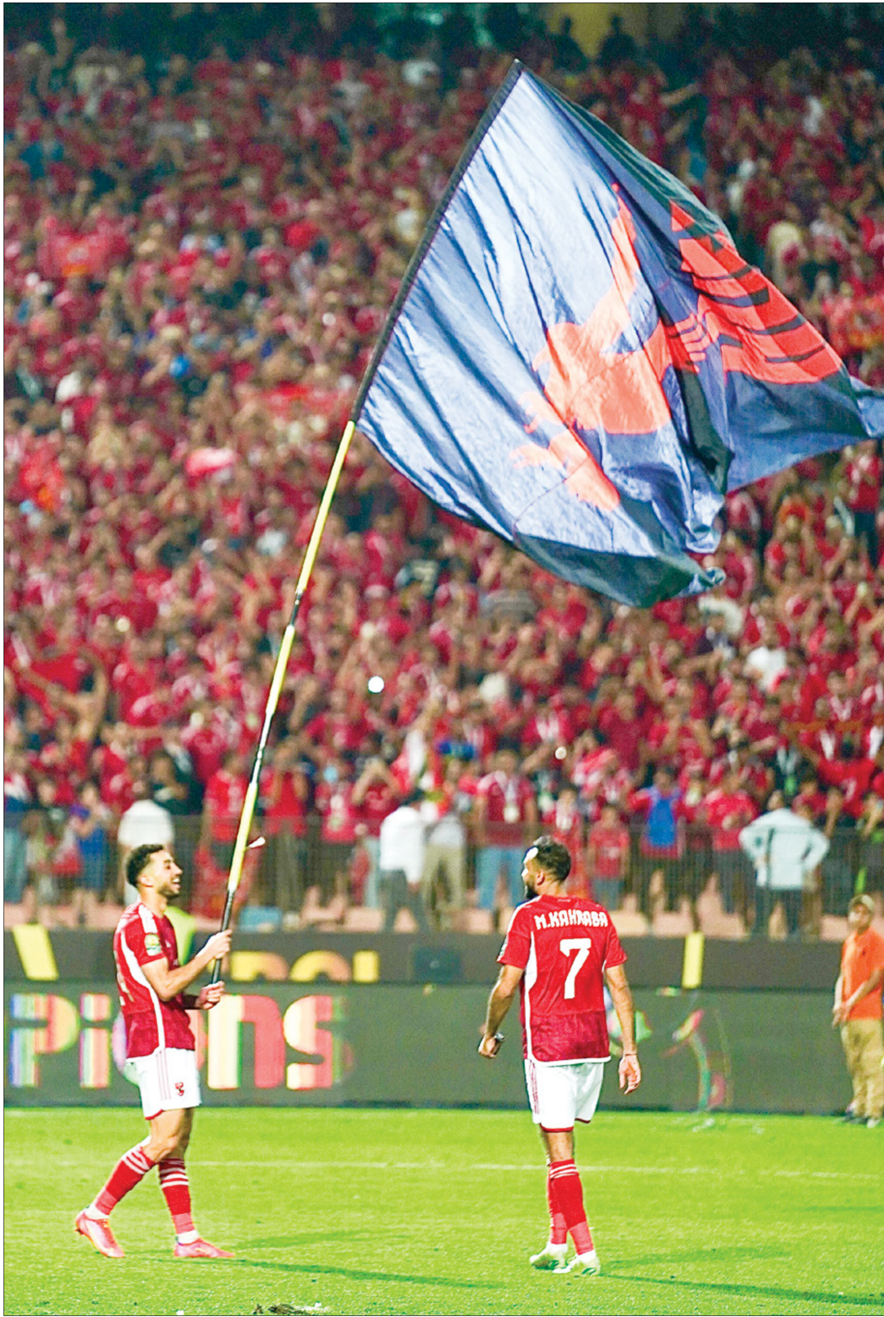
خطف الاهلي لقب بعدما تفوق في ركلات الترجيح على منافسه الزمالة

اقتنص الاهلي لقب كاس السوبر المصري بفوزه على غريمه التقليدي الزمالة بركلات الترجيح بنتيجة (6-7)، وهذه هي المواجهة التاسعة بين الفريقين في نهائي السوبر المحلي، إذ فاز الاهلي في سبع مقابله منها، انتصارين فقط للزمالة، ويُعتبر الاهلي الأكثر تتويجا بلقب السوبر المصري بواقع 15 مرة، وبالبطولة اربع مرات.