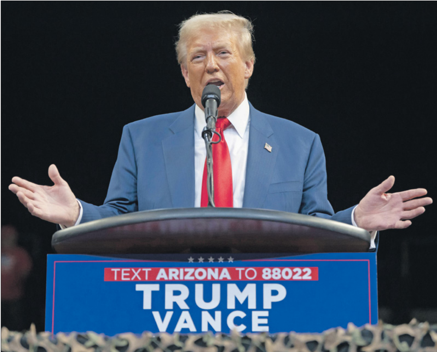
ترامب خلال تجمع الناخبين في أريزونا، 13 أكتوبر 2024

سبتيمبر/ ايلول الماضي، كان لدى المرشد الجمهوري دونالد ترامب على مدار ثماني سنوات في تحويله من تيار محافظ إلى حركة شعبية معينة من مناهضة حتى للسياسات التي بذى فيها الرئيس الأميركي الأسبق رونالد ريغان (1981-1989) النسبة الحالية من الحزب. نجح ترامب في إقضاء جميع معارضيه، بمن فيهم القادات التقليدية التاريخية، مثل ميشا ماكونيل، زعيم الأغلبية في مجلس الشيوخ السابق، وميت رومني، المرشح الرئاسي السابق، وآخرين، لذا ليس غريباً تعديل المؤتمر الوطني الجمهوري الأخير برنامجه للسنوات المقبلة، بحيث أزال لأول مرة ما قرره ريغان منذ أكثر من 40 عاماً، عندما قرر الجمهوريون أن الحق في الحياة واستهداف قانون فيدرالي يمنع الإجهاض يجب أن يكونا دائمي الأولوية في سياسات الحزب. لكن تأثير ترامب لم يقصر على الحزب الجمهوري وتحويله إلى تيار شعوبي معيّن، إذ نجح على مدار السنوات الماضية في إحسان الحزب الديمقراطي، صاحب السياسات الليبرالية الذي نتج أكثر من 100 شخص من المنتمين إلى اليسار في الفوز بتمثيله في مجلس النواب عام 2018، ليس فقط على تجاهل تيار اليسار، بل على الانحراف إلى اليمين في سياسات رئيسية.