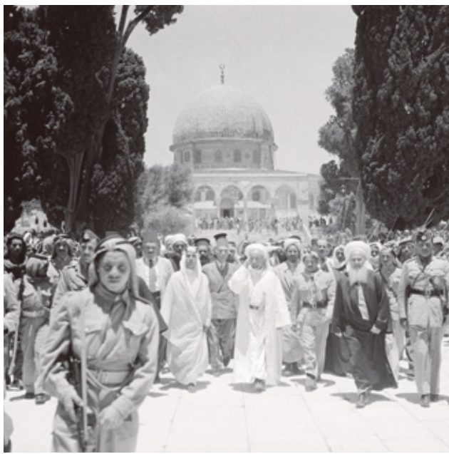
الملك عبد الله الأول قبل الفدس

شكلت حكومة النايبي بين تشرين الأول/ أكتوبر عام 1956 وحتى إبريل/ نيسان 1957 سابعة في تاريخ الأردن، إذ كانت أول حكومة برلمانية وتتميزت بانفتاحها تقدمي عروبي واجهت بعد سنة أشهر فقط بفعل التدخل الأميركي بالشان الأردني لصالح المشروع الغربي الصهيوني كما يرى انصارها. فيما يرى خصوصاً أنها تعبير عن عدم نزوح المجتمع الأردني لتقبل الديمقراطية، وايضاً تعبير عن ارتهاض القوى التقدمية