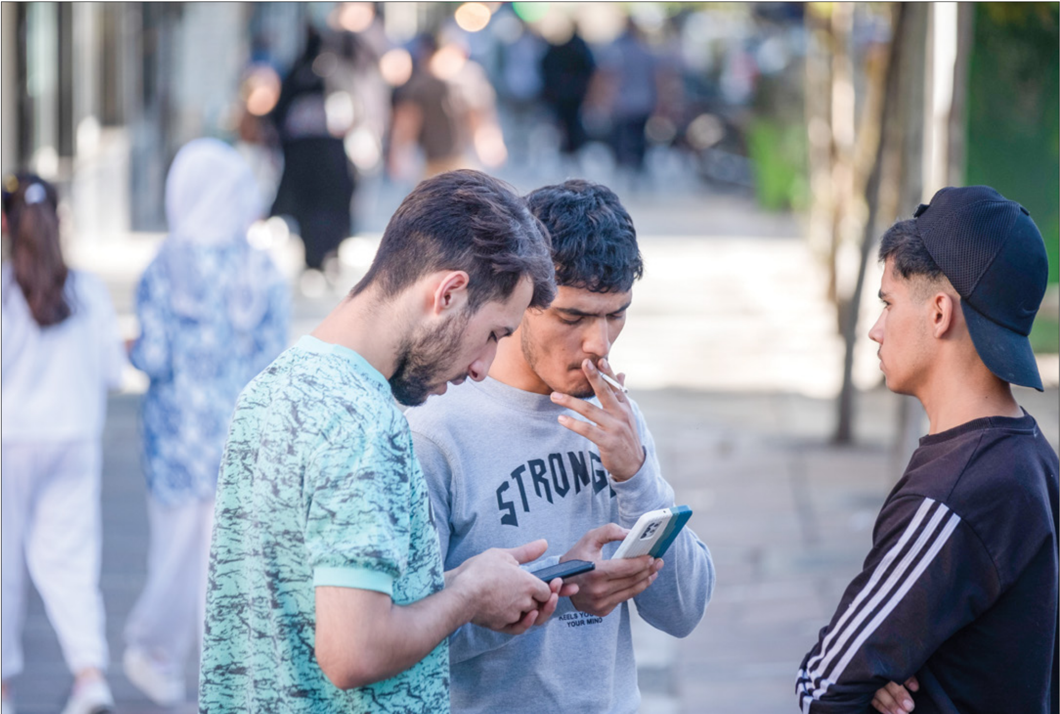
يونس شاسع بين الجيل زد وقيم الجمهورية الإسلامية

تتسع الهوة بين الجيل زد والدولة الإيرانية، وتظهر معالم الشرخ في أحداث محفلة بالدلالات، كالانتخابات الرئاسية والبرلمانية، والاحتجاجات على مقتل واحدة من هذه الفئة الديموغرافية، والتي لديها قيمها وتطلعاتها الخاصة