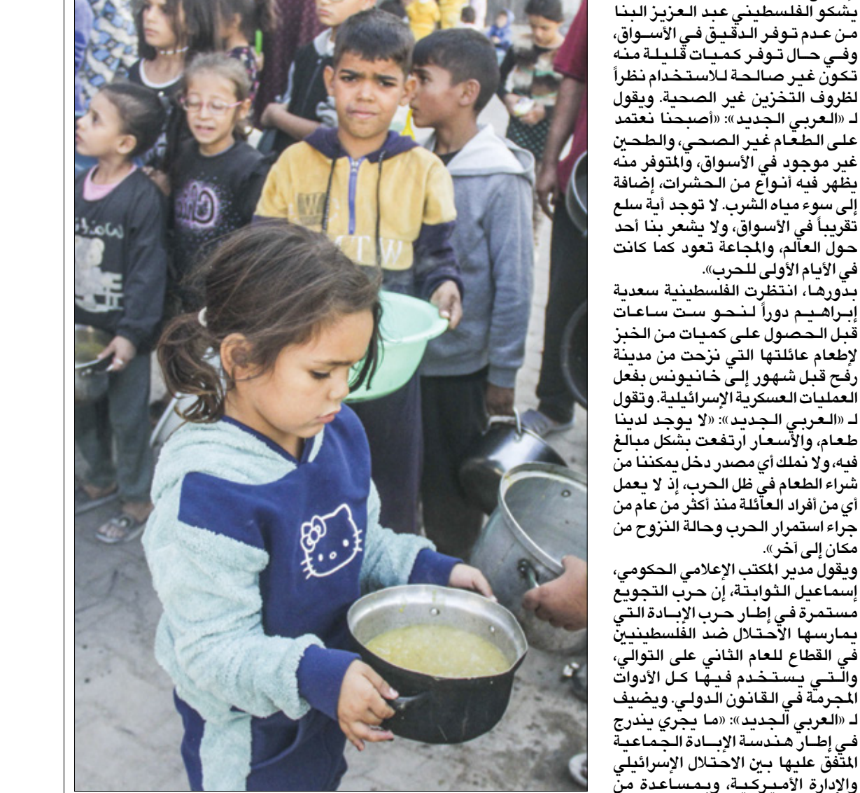
اطفال في طوابير الطعام بحدية غزة المحصود (عيسى الاضول)

وحسب تقديرات الجهات الحكومية في قطاع غزة، فإن جيش الإحتلال منع إدخال أكثر من ربيع مليون شاحنة تحمل مساعدات وضاع منذ بدء الحرب في أكتوبر/تشرين الأول 2023، كما تواصل تعزيز سياسة التجويد. وخلال الشهر الأول من الحرب، انتشرت المجاعة بشكل واضح في أنحاء القطاع، ووصل الشلل بالسكان في مناطق الشمال إلى إعادة تدوير أعلاف الحيوانات لصناعة الخبز، وطهي بعض الأعشاب للحفظ على حياة أسرهم، فيما سجلت جهات حقوقية أكثر من 50 حالة وفاة بفعل الجوع وسوء التغذية.