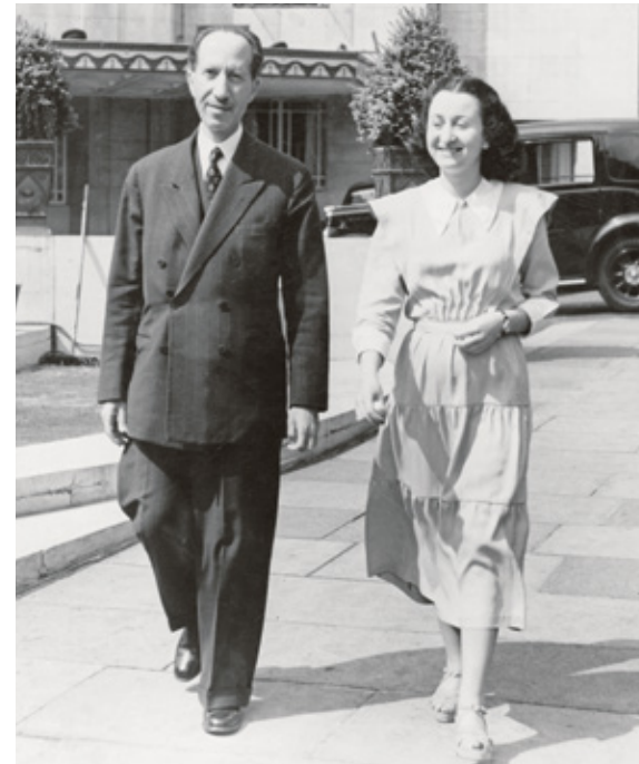
رئيس وزراء الأردن توفيق أبو الهدى مع زوجته