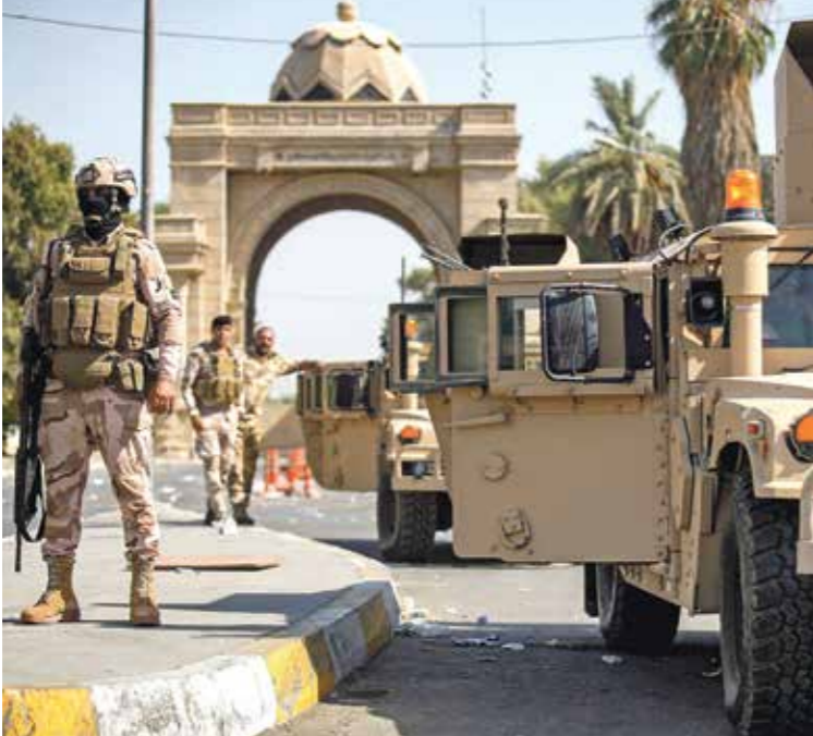
النشار عسكري عراقي في بغداد، 30 أغسطس 2022