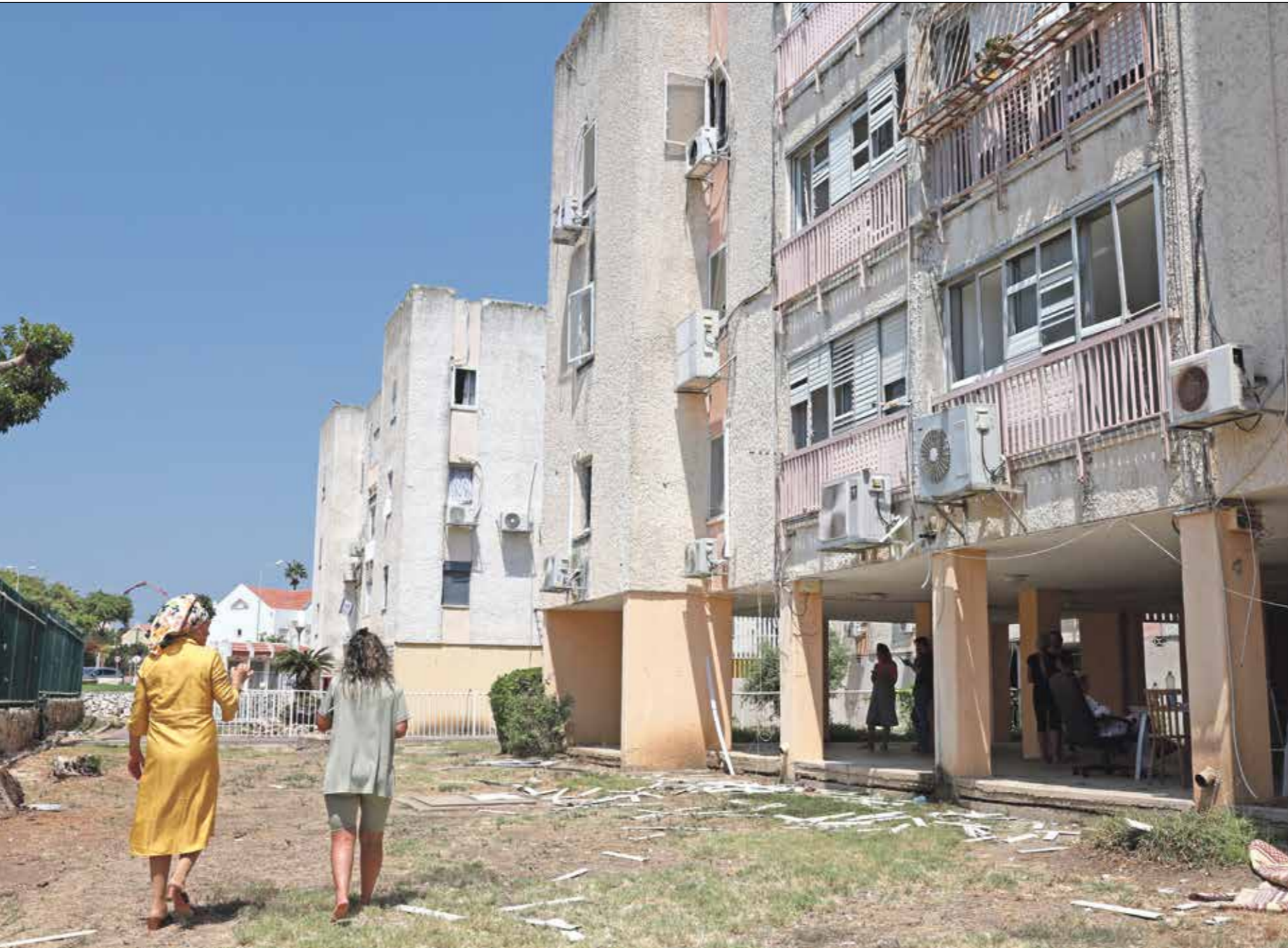
منظر من عكا يصفص حزب الله امس اجانب فوجير امس (س)

من الصلحة». وأوضح أن ما حصل «عملية مرحلتيّ، الأولى إطلاق 340 صاروخ كاتيونوشا، والمرحلة الثانية عبور عشرات المِسيّرات باتجاه الأهداف العسكرية في العمق وهذه العملية اليوم أنتهت». وتابع: «سنستابع نتيجته نكتدم العدو عما جرى في هاتين القاعدتين (المستهدفتين)، إن كانت العملية فرضية لنا نعتبر أن عملية الرد على اغتيال الحاج محسن (شكر) قد تمت وإذا لم تكن النتيجة في نظرنا كافية وسنحتفظ بحق الرد حتى وقتٍ آخر». وإن سُمي نصرالله الّرد بـ«عملية الأربعين»، نسبةً لذكرى الأربعين لإمام الحسين، أوضح أن من «عوامل تأخر العملية العسكرية لردّ على اغتيال شكر هو حجم الاستفزاز الأمني والاستخباري والغني والماديّ والجوي والبحري الإسرائيليّ والأميركي». وأيضاً «معاينة العدو والحاجة إلى بعض الوقت