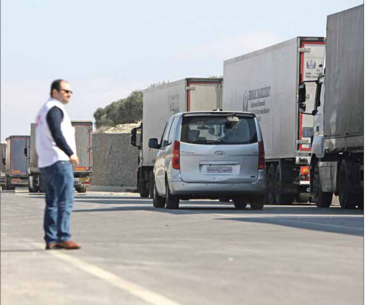
من المعابر في الشمال السوري، 19 فبراير 2023.

يرى مراقبون أن انفتاح تركيا على النظام السوري من البوابة الاقتصادية قد يفشل، بعد التراجع عن فتح معبز ابو الزنديت في الشمال، إثر ضغوط شعبية، فيما كانت مثل هذه الخطوة لتنعش خزينة النظام المتهاكئة بعد نحو 13 عاماً من الحرب