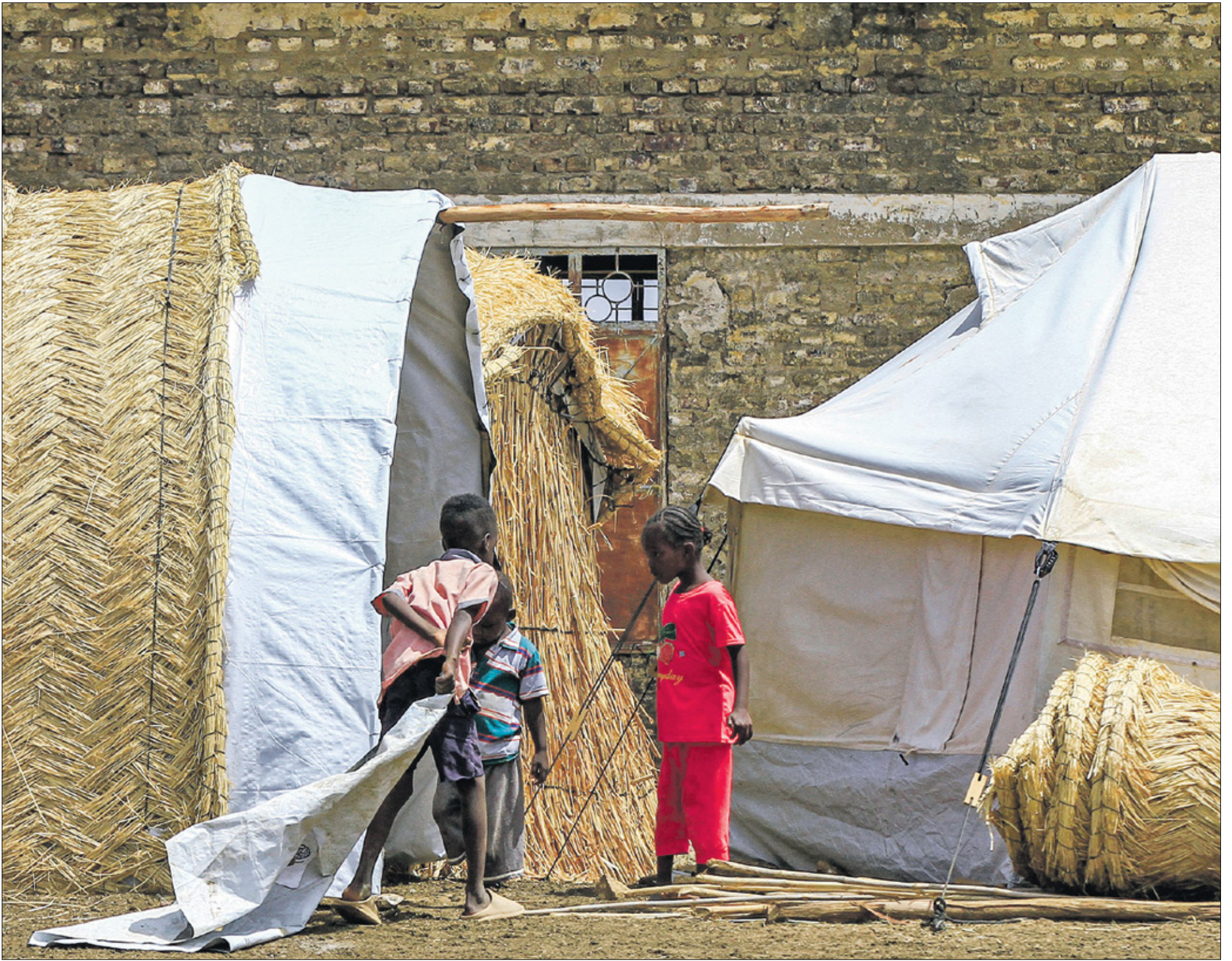
سودانيون صغار مهجرون في أحد مخيمات البلاد

تمضي الحرب في السودان لتتواصل معها معاناة الأطفال هناك... تلك المعاناة التي تُترجم بأشكال مختلفة، لعل أولها اضطراب هؤلاء إلى عيش النزاع المسلح القائم منذ منتصف إبريل/ نيسان 2023. وتؤكد منظمة الأمم المتحدة للطفولة (يونيسف) أن السودانيين الصغار يقاسون منذ مدة طويلة معاناة لا يمكن تصوّرها، وقد سلّبوها طفولتهم بسبب العنف والتهجير والحرمان. بالنسبة إلى