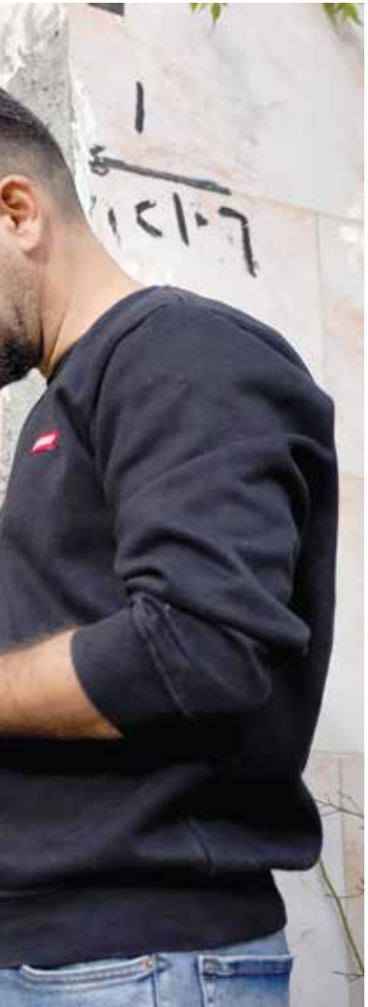
منة عملية التعداد في السليمانية أمس