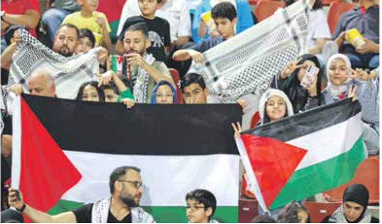
الفدائي لقب دهما قيريا فيما حققت هيلم