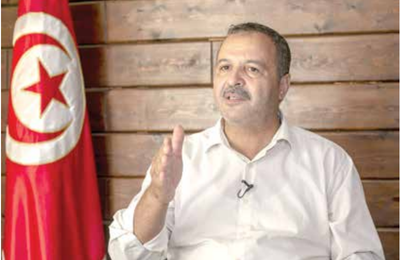
المكي في تونس، أكتوبر 2021