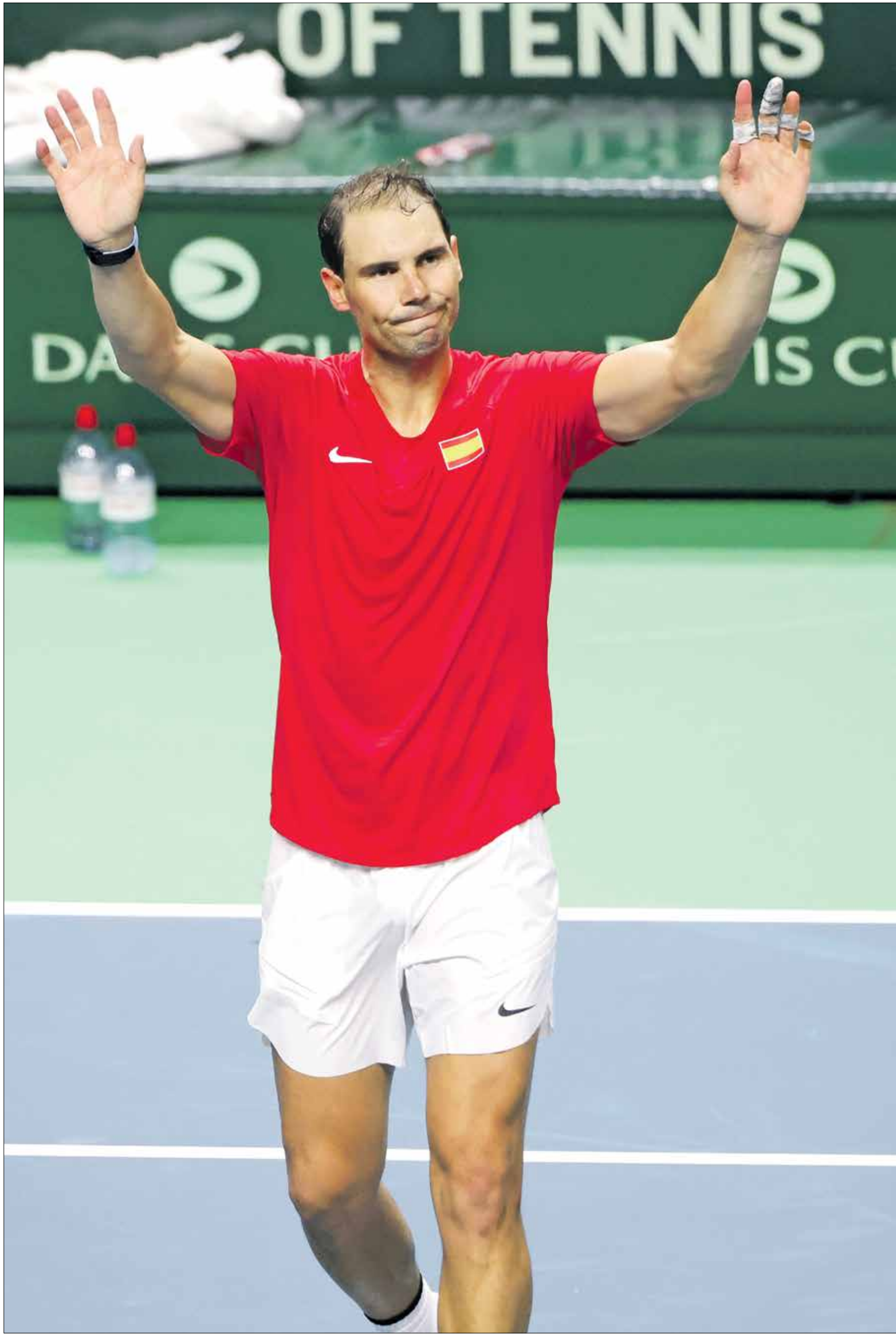
رافاييل نادال يوجه تحية إلى الجماهير في ملعب ماريا مارايلث كاررينا

انهى النجم الإسباني، رافاييل نادال، رحلته الأسطورية في عالم التنس، بعد أن اقصى المنتخب الهولندي نظيره الإسباني في الدور ربع النهائي لبطولة كاس ديفيس للتنس. وخسر نادال صاحب سنة 38 والمنتوج بـ22 لقباً كبيراً، في المباراة الأولى ضمن منافسات الفردي أمام بوتيك فان دي زاندسجولب (6-4، 6-4). وبدأ نادال عاطفياً في أثناء عزف النشيد الوطني، فيما هتفت الجماهير بحضور أكثر من 10 آلاف شخص «رافا، رافا» عند انتهاء النشيد.