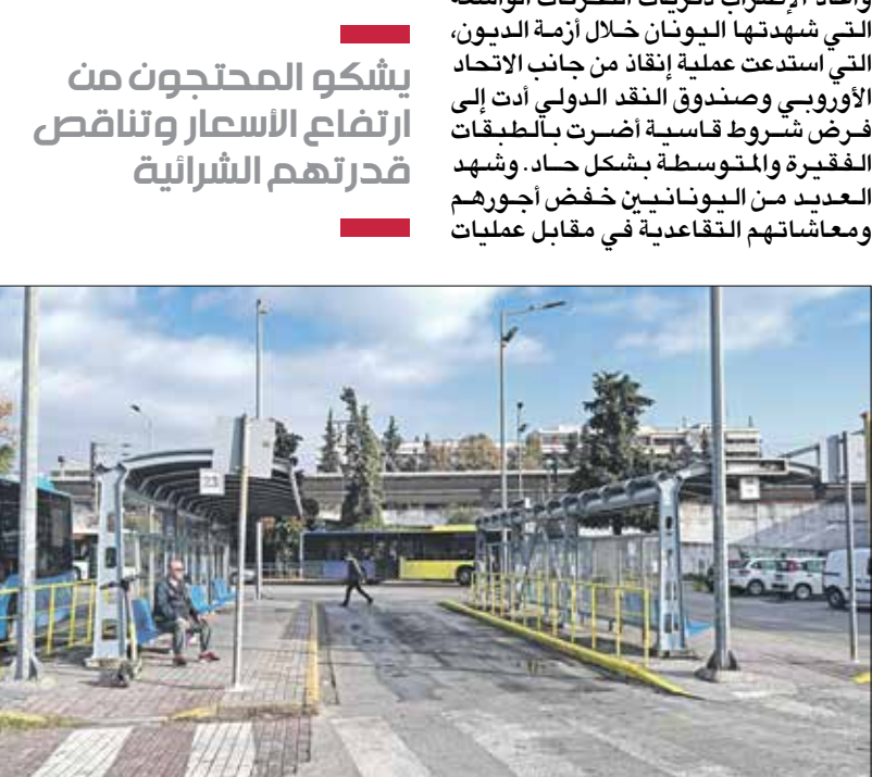
محطة صافى في اليونان، 20 نوفمبر 2024

شهدت اليونان إضراباً عاماً ضخماً الأربعاء 297 مليار يورو (297 مليار دولار) وقلصت ربع الناتج الاقتصادي اليوناني ودفعت البلاد تقريبا إلى الخروج من منطقة اليورو. وقال ستراتيس دونيانس وهو مؤلف في المحكمة انضم إلى الرفع، في أسيرة في أتينأ الخطلية بتحسين الأجور ومستويات المعيشة. انضم الأطباء والمعلمون والبنائون وعمال النقل من أكبر نقابات القطاعين الخاص والعام إلى الإضراب، حقيقفة ضد ارتفاع الأسعار». وتجمع الذين بدأ جزئيا سبب التأثير المستمر لأزمة الطاقة والغذاء والأسكان لا تزال تتجاوز الوعا والضراب تجريبات التحركات الواسعة التي شهدتها اليونان خلال أزمة الديون، التي استمدت عملية إنقاذ من جانب الاتحاد الأوروبي وصندوق النقد الدولي أدت إلى فرض شروط قاسية اضرت بالطبقات الفقيرة والمتوسطة بشكل حاد. وشهد العديد من اليونانيين خفض أجورهم ومعايشاتهم القاعدية في مقابل عمليات ولووحا بلافتات كتب عليها «إضراب عام