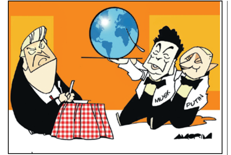
بوتين وماسك وترامب والعالم في الطيف (مورير، كار تون موفمننت)