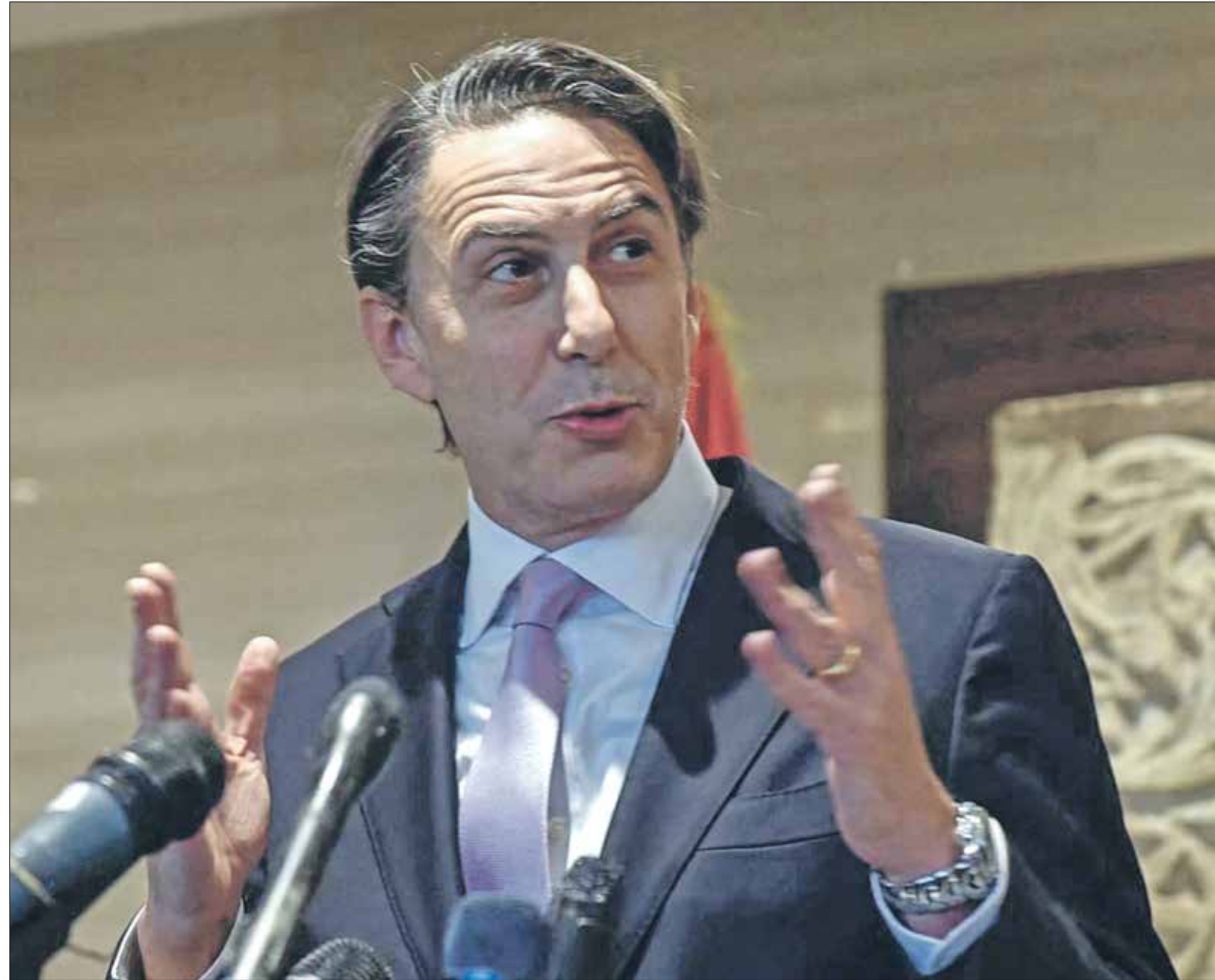
هوكشتاين في بيروت أمس