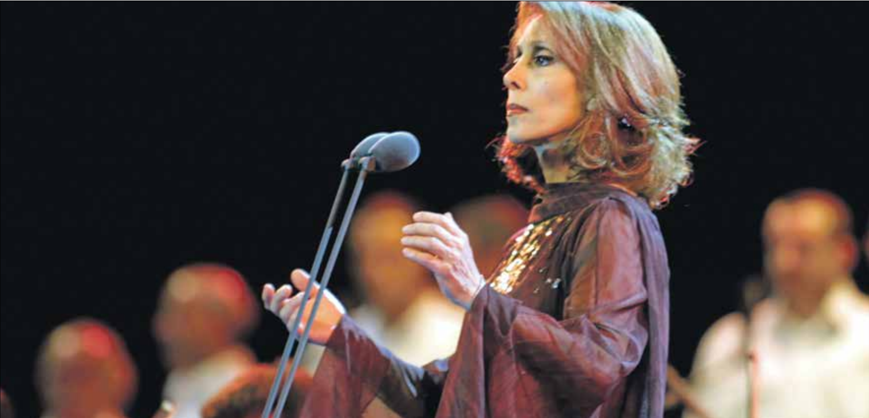
من بيت الحبه 31 يوليو 2001

صخرة جبل عامل.. اللي حامل وراق شعرا وعشاق.. ونشو ما إجا شعوب. ونشو ما راح شعوب.. كلن راح يظفو ويبيغي الجنوب.» ويتضك حبيبي يا تراب الجنوب.» اللي حامل ع كتافو فيلمون وهي لحنًا يجمع بين الأناقة