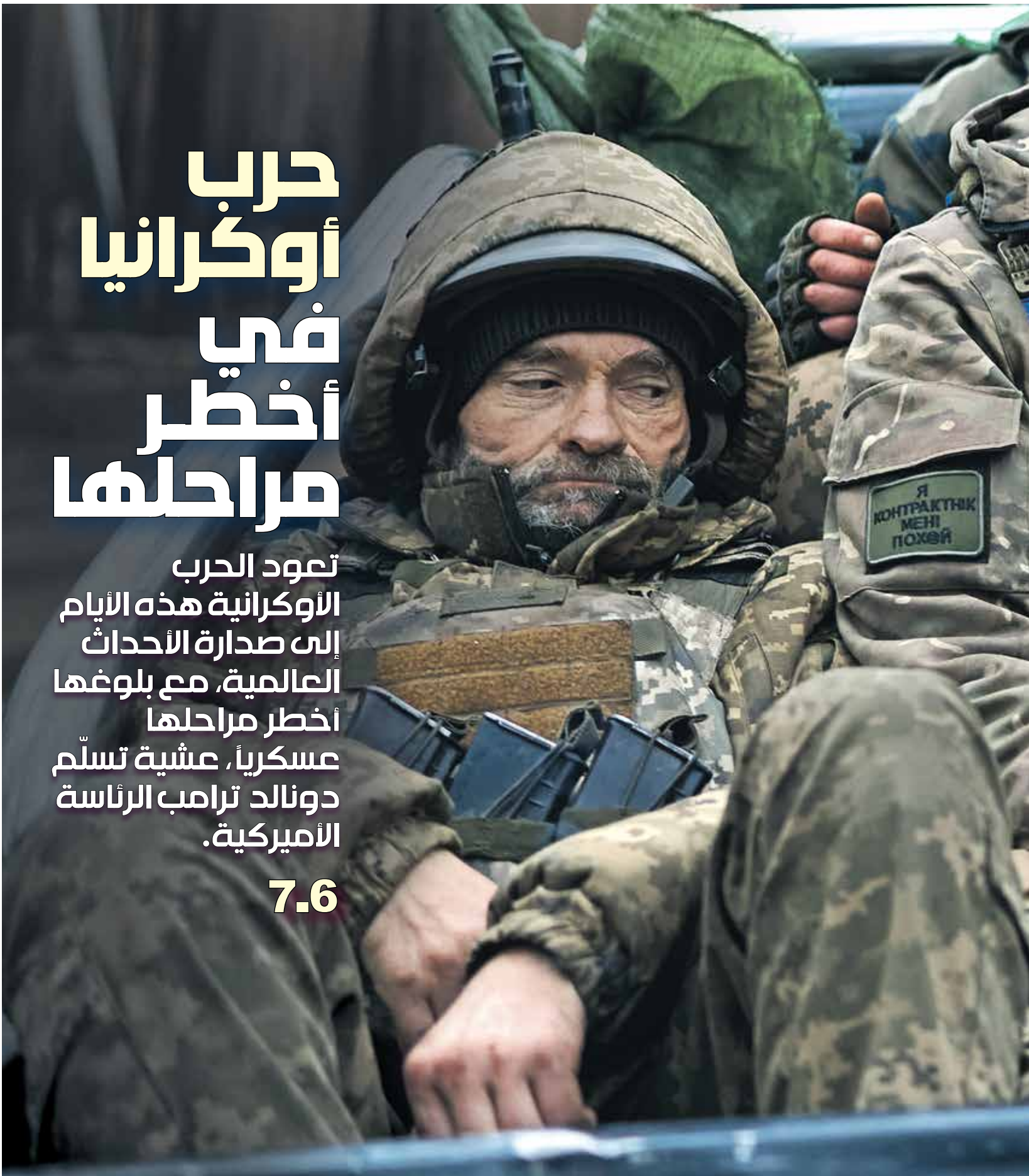
استراحة جندي أوكراني في منطقة كريمينا، 10 نوفمبر 2024

تعود الحرب الأوكرانية هذه الأيام إلى صدارة الأحداث العالمية، مع بلوغها أخطر مراحلها عسكرياً، عشية تسلّم دونالد ترامب الرئاسة الأمريكية. 7.6