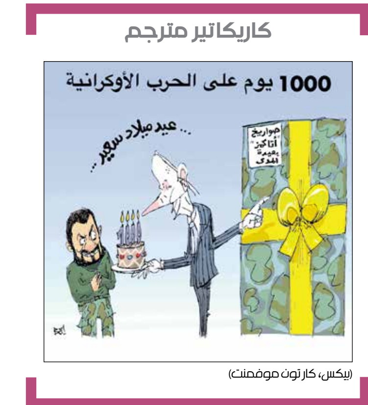
ليكس، كار تون موفمننت