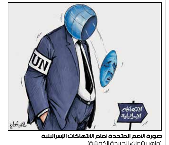
صورة الأمم المتحدة أمام الانتهاكات الإسرائيلية (ماهر رشوان، الجريدة الكويتية)