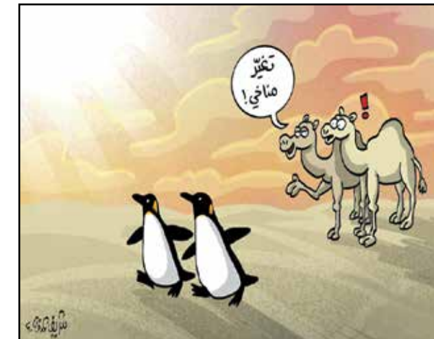
مف عجائب التغيير الملاحظ (شريف عرفة، الاتحاد الاماراتية)