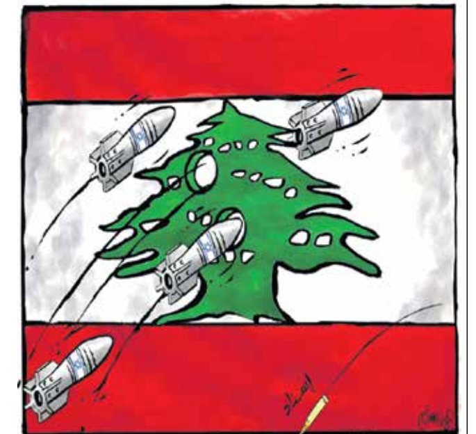
التصعيد الإسرائيلي في لبنان (علاء رشم، انبندنت عربية)