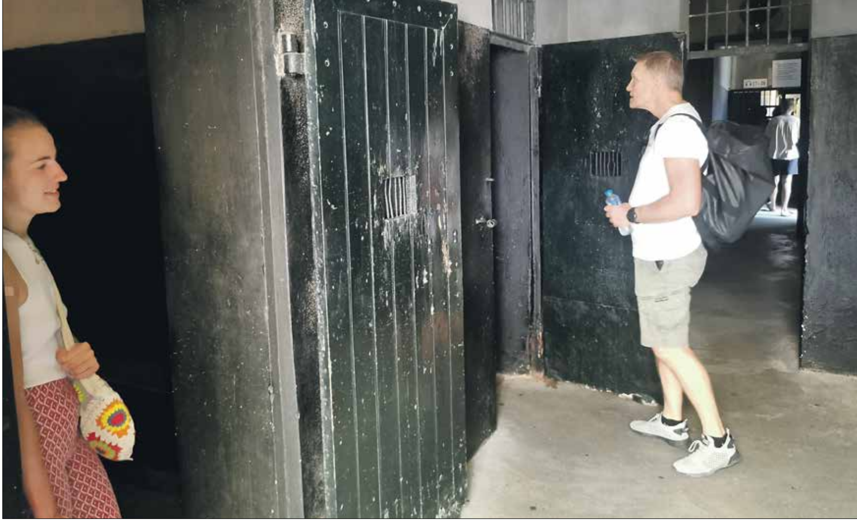
المتحف شاهد على معاناة الفيتناميين

يعكس سجن هانوي فصلاً من القمع والمعاناة والصمود رغم قهر الاستعمار الفرنسي، هو الذي تأسس عام 1896 لاحتجاز السجناء السياسيين الذين قاوموا الاحتلال