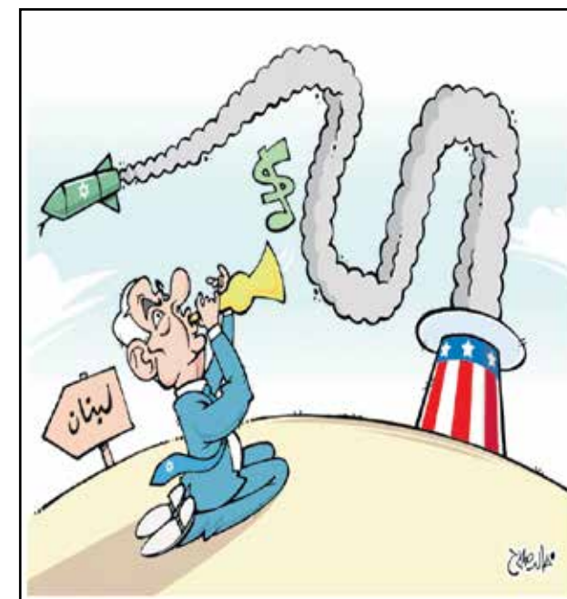
تتياهو حاوي الخراب والتوسع (خاد صلاح، المصري اليوم)