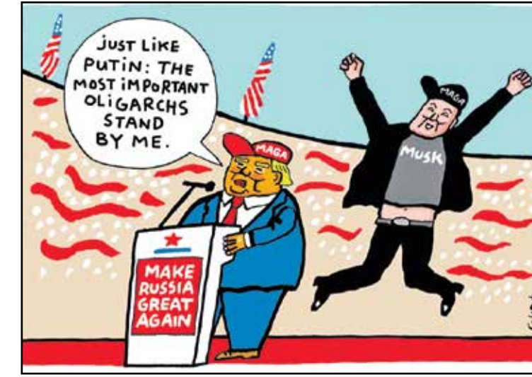
لترامب ملك بوتين مدعوم من الوليغارش ماسك (شوتوت، كيهل كار تونز)

رب قائل أن لا اختلاف بين قمة «المتابعة» العربية الإسلامية التي عقدت قبل أيام بشأن غزة، ونظيرتها قبل عام للهدف نفسه. والحقيقة أن المشككين بسلامة الموقف العربية والإسلامية، سامحهم الله، لا يدركون أن القمة الثانية سميت توصيات القمة الأولى، أي أن «جماعة القمة» ما زالوا «متابعين» ما يحدث وللتذكير، كان أهم ما خلصت إليه القمة الأولى، صياغة 31 بنداً أبرزها مطالبة الأعضاء بـ«كسر الحصار على غزة، وفرض إرخال قوافل مساعدات إنسانية عربية وإسلامية ودولية»، والثاني: «إدانة العدوان الإسرائيلي على غزة». أما القمة الثانية، فجاءت للوقوف على ما تم «إنجازه» بشأن التوصيات، أي أن «الجماعة»، على اعتبار أن كسر الحصار لم يحصل، فسيفقون الدنيا ويقعدونها، بلا شك، لحاسبة المتقاعسين، الذين لم يمتثلوا لأوامر كسر الحصار، ولن تأخذهم رافة، خصوصاً أنهم كانوا قد أمروا بتشكيل لجنة تجمع وزراء خارجية عربياً ومسلمين، لهذه الغاية، من ضمنهم وزراء في دول «الطوق» المحيطة بإسرائيل، التي تستطلع بلدانهم «كسر» الحصار مباشرة، لكنهم، أبوا إلا أن يجهدوا أنفسهم بتنظيم جولات عالمية، شملت دولاً بعيدة، للمطالبة بـ«كسر الحصار»، نيابة عنهم، ولأصحاب الظنون السوداء، أيضاً، ثمة فرق وجبه بين القمطين، لم ينتبه إليه غير الأتقياء الذين ينجحون دوماً بمعرفة الفرق بين الصور المتشابهة... فالقمة الأولى دانت الحرب على غزة فقط، أما الثانية فدانت الحرب على غزة ولبنان!