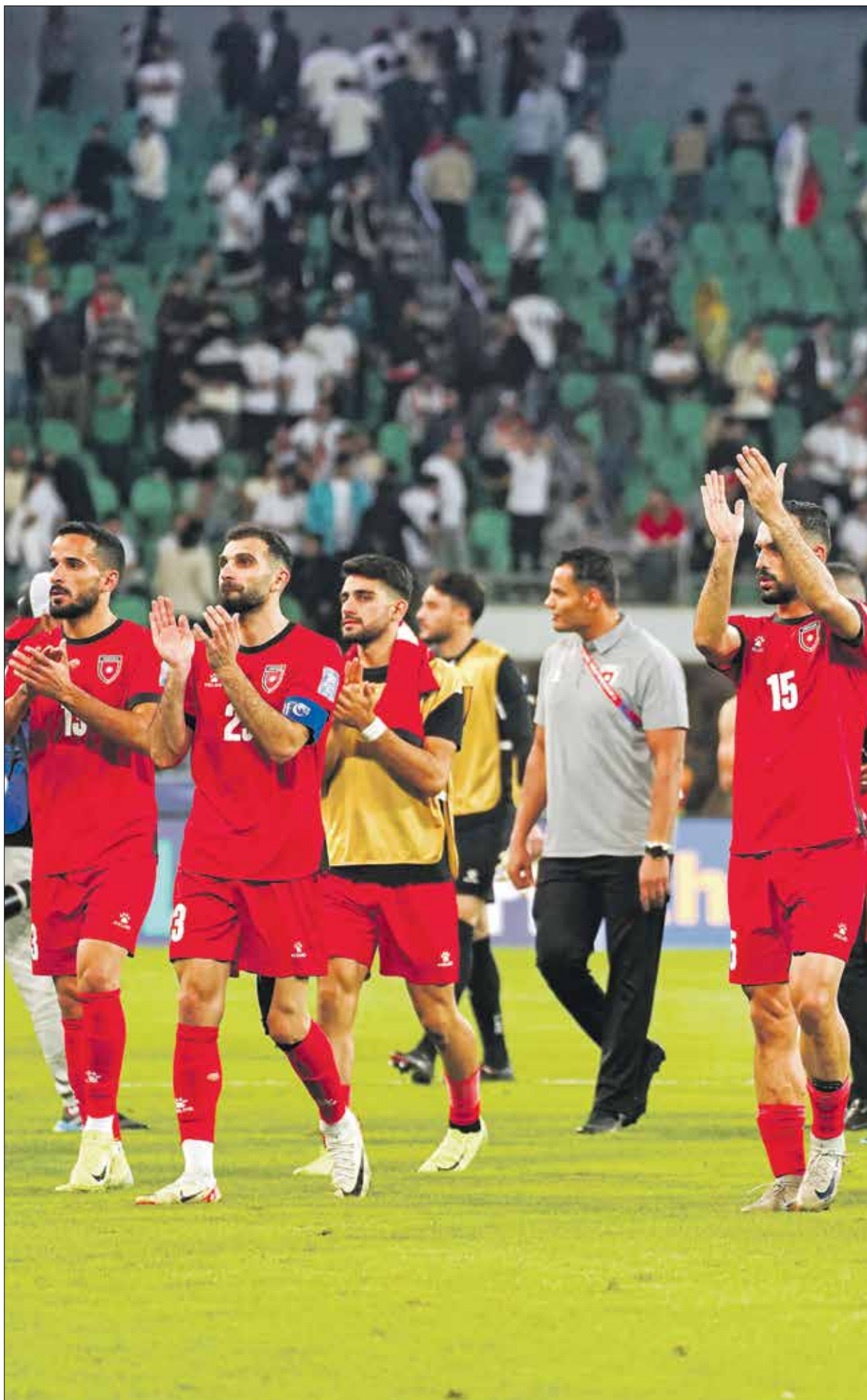
منتخب الأردن سيقابل فلسطين في اللقاء القادم

وقال فالفيردى، في تصريحات أبرزتها صحيفة ماركا الإسبانية: «لقد عرس والدي البرتغالي الواعد، وذلك مع العديد من الأقباط، منتخب فرنسا الأولمبي، «بيزيري دوي، التعاقد مع النيجيري فيكتور أوسيمين، كذلك فإن الأندية الفرنسية تخضع للرباية إلى كواليس انضمامه إلى التدريب مع والدي، وأنا لم أكن معهم، كانت إحدى كبرى الصدمات في مسيرتي، إلى جانب غيابي عن نهائيات كأس العالم في روسيا 2018، شعرتُ بالاعراض لدى عودتي إلى المنزل، لأنني لم أحقق ما أراه والدي وأخوتي وأصدقائي، شعرت بأنني خذلت إليهم، والعكس من ذلك، عندما كنت لاعباً في فريق بنارول كان غاضبا حقا بعد أن