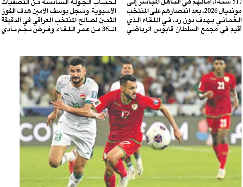
منتخب العراق في فوز مره على عُمان

العودة - العربي الجديد خرجت المنتخبات العربية بنتائج متباينة من الجولة السادسة من التصفيات الآسيوية، في الوقت الذي كان فيه المنتخب العراقي والإماراتي أبرز المستفيدين واستعاد أسود الراهلين بقيادة المدرب الإسباني خيسوس كاساس (51 سنة)، أمالهم في التأهل المباشر إلى مونديال 2026 بعد انتصارهم على المنتخب العُماني بهدف دون رد، في اللقاء الذي أقيم في مجمع السلطان قابوس الرياضي