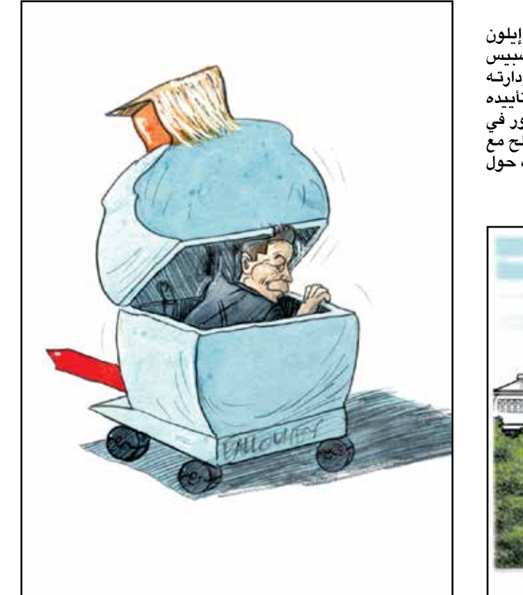
ماسك قطب فذ سيغود الزعيم الخاوي لرامب (بير باوبه، كيهل كار تونز)