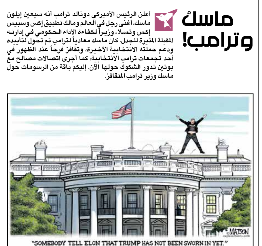
ماسك يتقافز فرحا بمنصبه الجديد فوق البيت الأبيض (ار جي هانسوت، كيهل كار تونز)