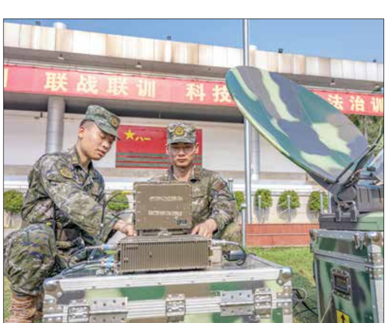
جنديان صينيان يانان تحريات جويوه الصين. ١٧ أبريل 2024

بكين - علي ابو مرعيان بلغت الأبحاث في معهد الدراسات الاستراتيجية في أياب، «حد السياربروهات التي يقدتها الصين الاميركي، امكنة ان تقوم قوات خاصة، تابعة للجيش الصيني، باختراق تاوان، وتنفيذ هجمات على البيئة الطبيعية للتحلية، من خلال استخدام الصواريخ والغارات الجوية الدقيقة، وذلك «لهداف مثلات هوموسلات حكومية عسكرية رئيسية في الجزيرة، بما في ذلك المطارات ومرافق الاتصالات».