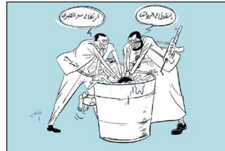
معاناة اليمنيين بين الحوثيين والشرعية