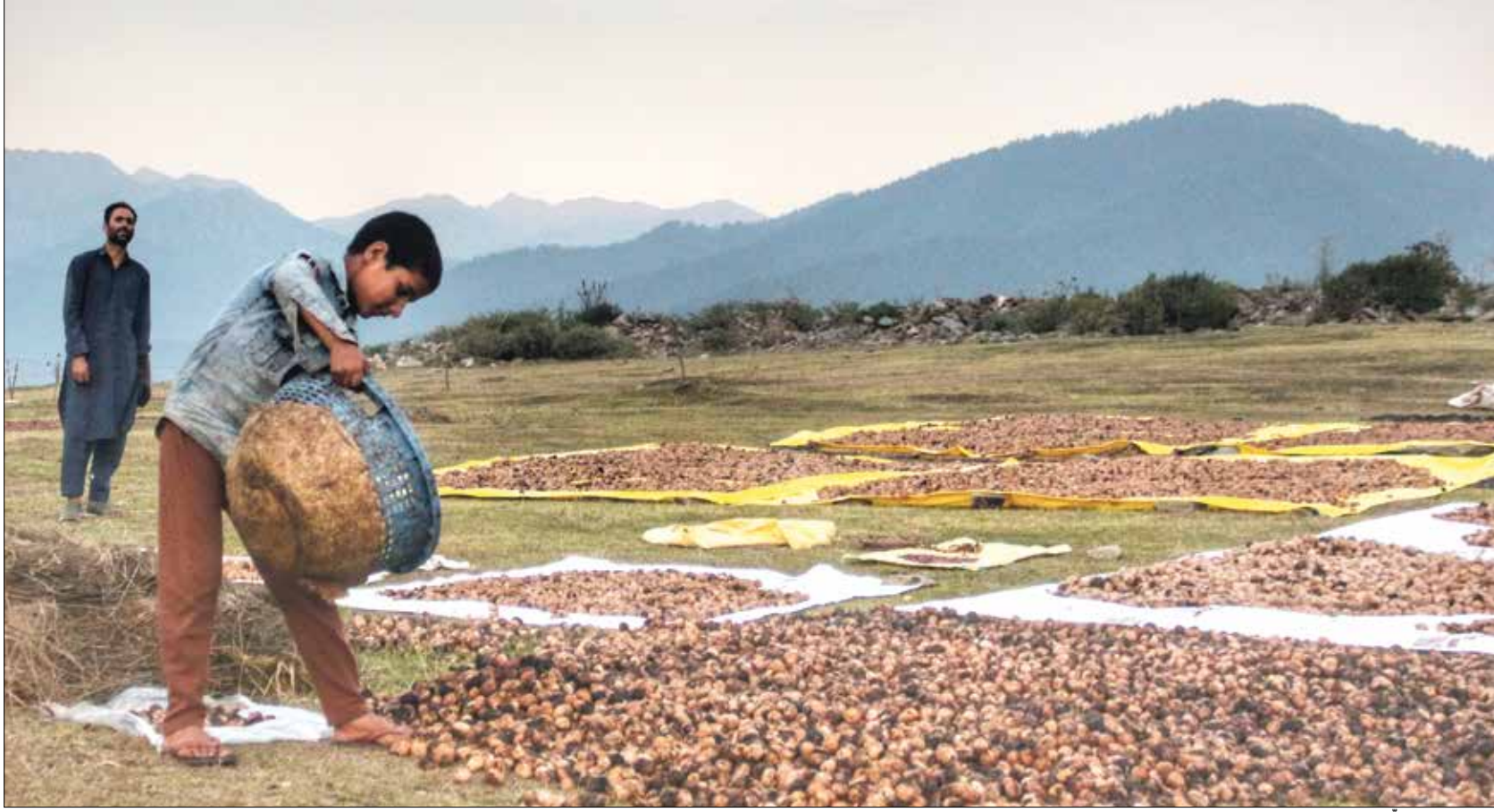
تناول الجوز يمثل طريقة صحية لزيادة كمية البروتين المتناولة

لا يقتصر وجود البروتينات المفيدة لجسم الإنسان على اللحوم والخضراوات وحسب، بل يحتوي كثير من المكسرات على بروتينات مهمة تحسّن من صحة الإنسان، هنا أبرزها