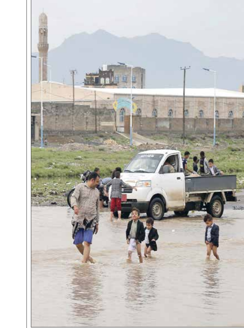
عيار، تام لذلك الجهات الحكومية في اليمن

التحميل، لكن تبين أنها كانت خدعة من المهربين الذين ظلون من كل شخص دفع مبلغ 1000 دولار لتقلتنا بالسيارة إلى العاصمة صوفيا، كنا مجموعة من تسعة أشخاص، لم يزيد أعدد الضحايا المهربين فوقها فيضانات البلغاري الذي وصل خلال وقت قصير». ويشير إلى أن «ما حدث لدى قدوم جنود الجيش البلغاري لا يحدث، إذ تعرضنا لضرب بطرق بشعة، حتى أنهم داسوا على صدورنا بأحذيتهم العسكرية وضربوا بينهم شقيق، في أسلعة الصدرية عند عودتنا إلى إسطنبول. أجبرونا على السير بعدما نقلونا بسيارة عسكرية نحو ساعة للعبور إلى الأراضي التركية، وهناك تمنا أيضا تحت رحمة مهربين ظلوا من كل شخص دفع مبلغ 25 ألف ليرة تركية (720 دولارا) لتأمين سيارة، حالما يتعالي شقيق من الكسور التي تعرض لها، وأنا