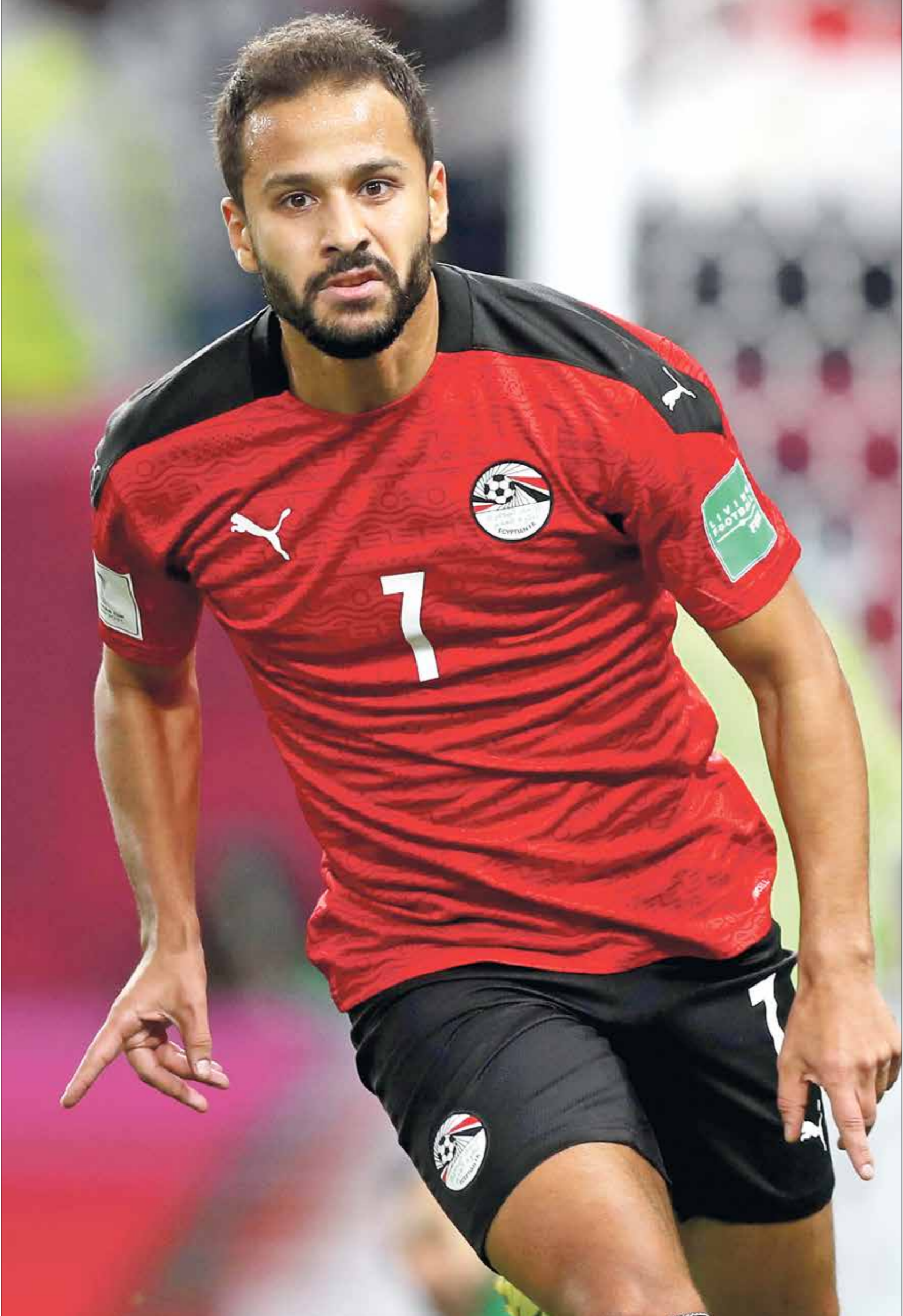
ملث وفاةأحمد رفعت صدمت في كرة القدم المصرية

وفي تصريحات سابقة لجريدة الصباح التركية، أكد موريكى أنه عندما كان في السادسة من عمره، تعرض منزله لانتحام من قبل جنود الجيش المصري خلال حرب كوسوفو، وكان الجنود قد قتلوا عدداً من الأشخاص في القرية التي يقم فيها، ولكن عائلته أسعفها الحظ، واستطاعت الفرار إلى البانيا، وعند عودته بدأ يلعب كرة