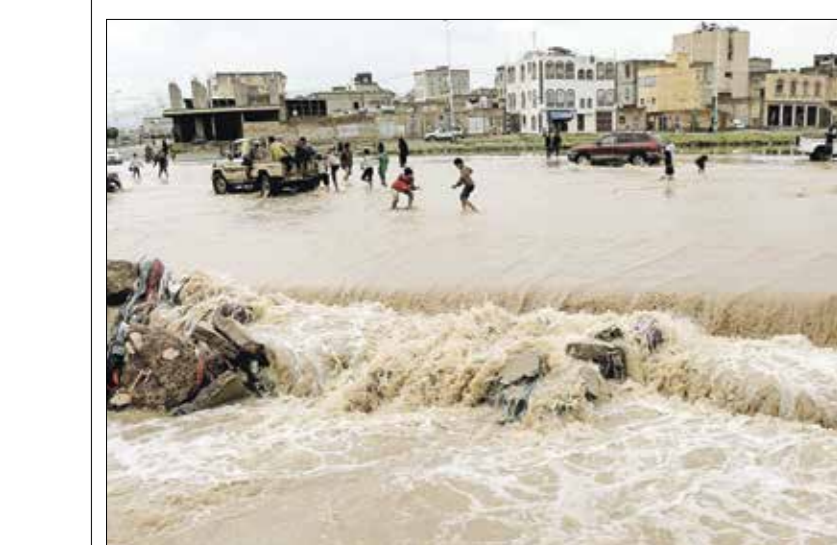
اغرقت السيول شوارع المدن اليمينية الرئيسية (محمد حمود)