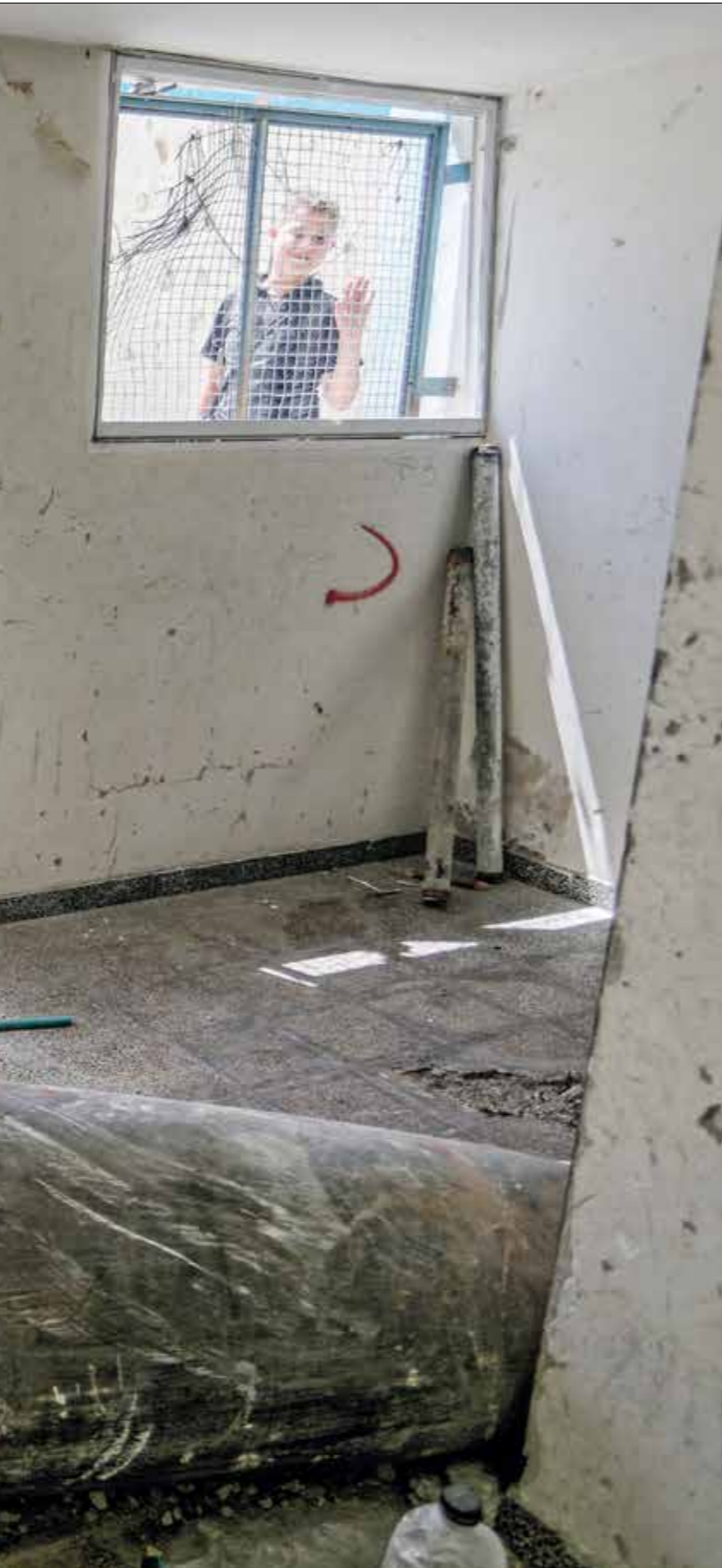
لثكنة الذئاب غير المنفجرة مخاطر على سكان غزة (عبد الرحيم الخطيب)

أصيب حمود الطار (40 سنة) وزوجته والثتان من أطفاله أثناء رحلة النزوح، والثنان بدأت من منطقتهم إلى المخيم جباليا، ثم إلى بلدة بيت لاهيا، ثم حي الكرامة، وحي النصر، ومحيط مجمع