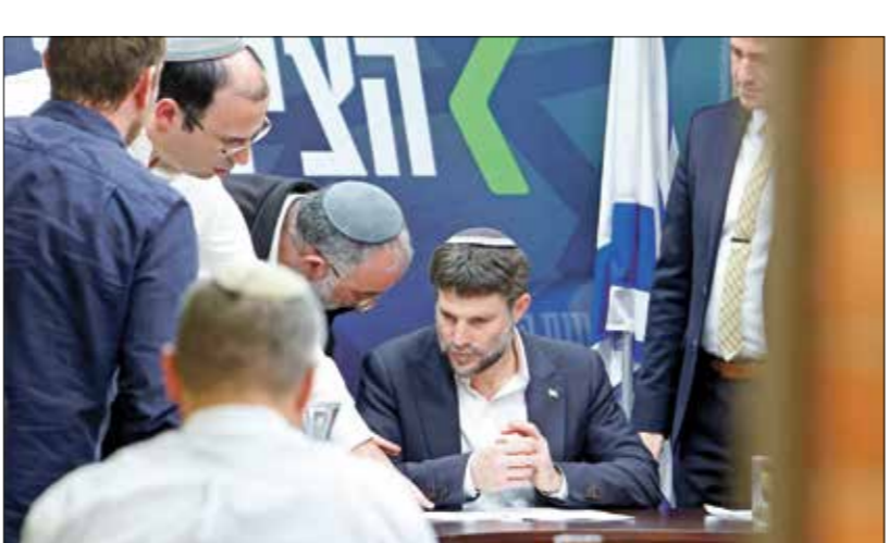
وزير المالية الإسرائيلي يتسلك سموريتش، 20 مارس 2023

أن غيردوس حتى نهاية العام، ووفقاً له، فإن فتح إطار الميزانية «يمكن أن ينقل اعتماد المسؤولية المالية إلى الأسواق» ويريد سموريتش اخراق إطار الميزانية بمبلغ 4.4 مليارات شكيل، من أجل تمديد تحويل إعادة توطين الإسرائيليين الذين