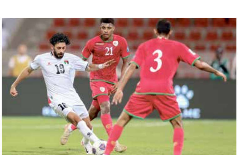
منتخب فلسطين في لقاء الفرصة الأخيرة

بعد الانتصار الصعب على نظيرهم الأوزبكستاني الماضي، بثلاثة أهداف في الدوحة، وهو فوز جاء، بعد سلسلة من النتائج غير المتفجرة، منها الخسارة أمام الإمارات ذهاباً بثلاثية