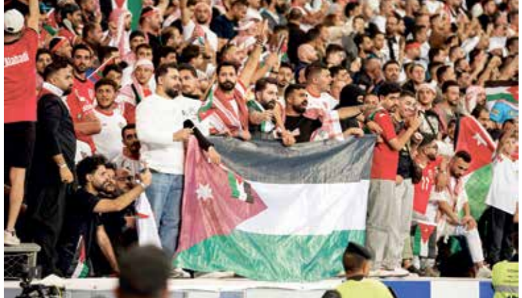
جماهير منتخب الأردن سادت فرقهها في البصرة