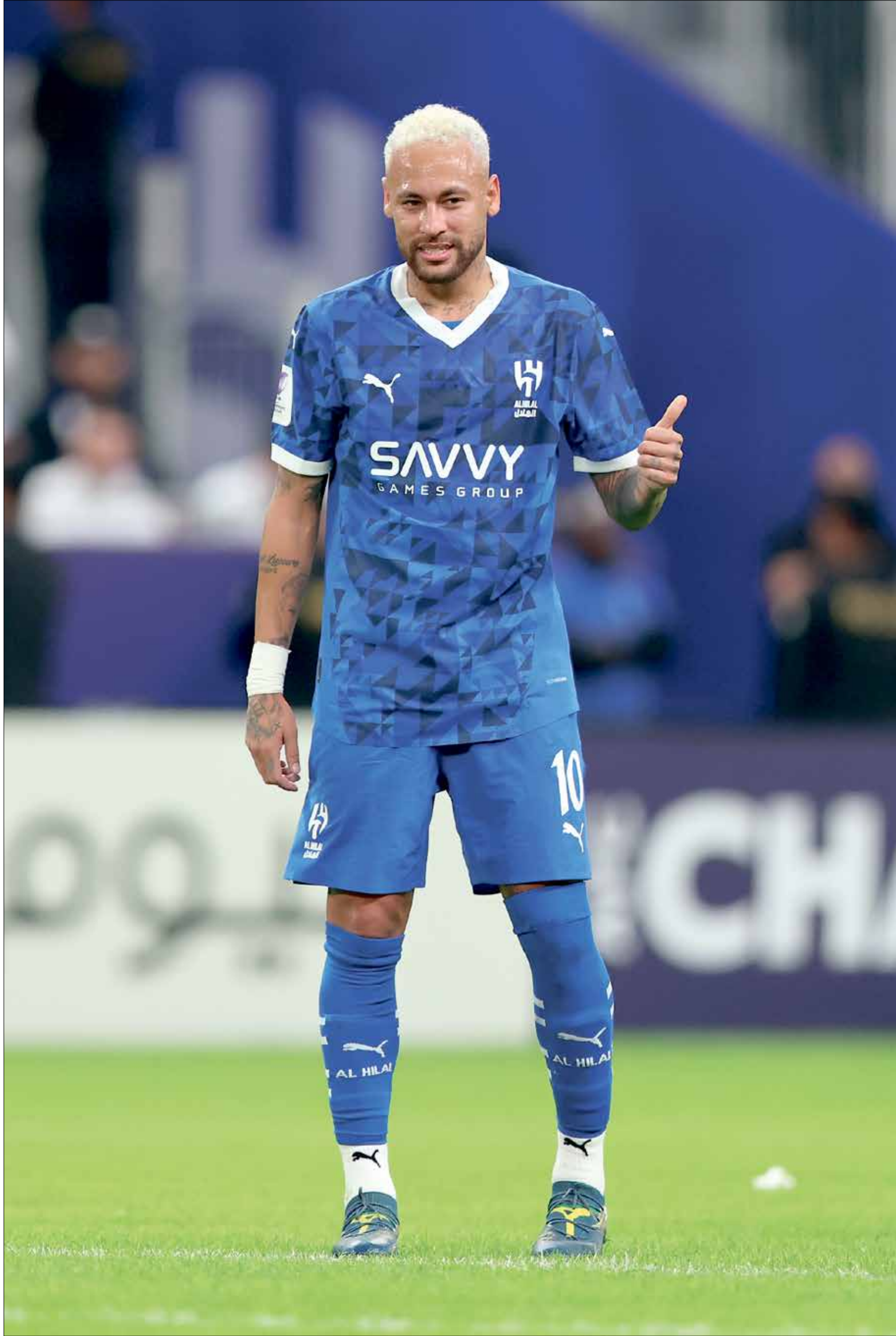
يعيش نيمار أيامه الأخيرة مع نادي الهلال السعودي في هذا الموسم

لا تزال الصفقة المتداوله بشأن عودة المهاجم البرازيلي نيمار إلى فريق سانتوس البرازيلي الذي نشأ فيه صفوفه واشتهر من خلاله، قيد التفاوض، وذلك وفقا لتصريحات أدلى بها رئيس نادي سانتوس، مارسيلو تيكسيرا، لقناة إي إس بي إن الرياضية. وقال تيكسيرا بعد تتويج سانتوس بلقب دوري الدرجة الثانية: «الصفقة تسير بشكل جيد، سنتظر انتهاء البطولة وبعد ذلك، وبكل هدوء، سنخطط لموسم 2025».