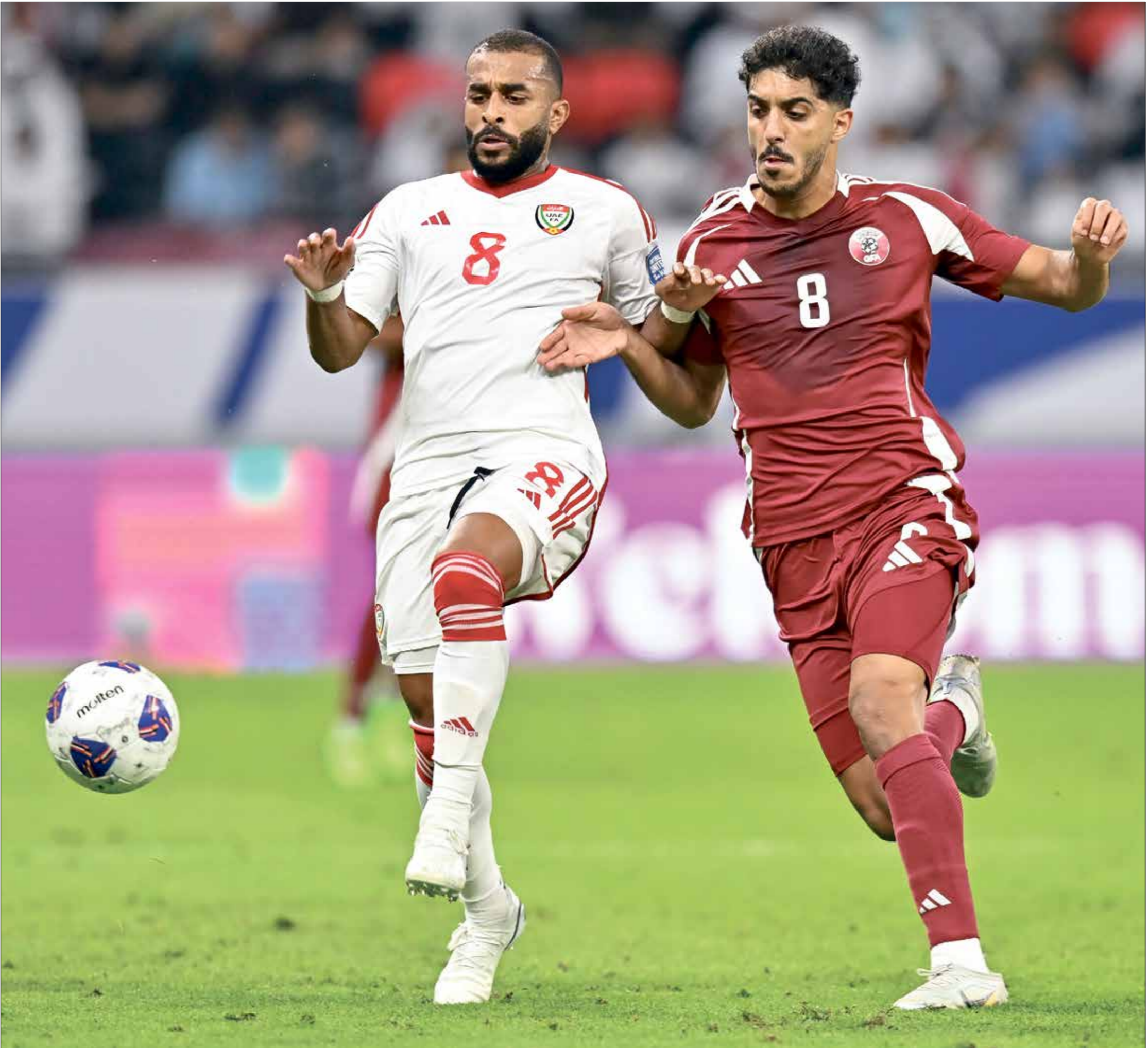
منتخب قطر يحك المراكز الرابع

من المهم عندهم الانتصار في هذه المواجهة، في ظل المنافسة القوية في المجموعة التي تضم منتخبات قوية للغاية وكل نقطة لها قيمة مضاعفة. كما أن التهديف في الدوري الفرنسي وسيزيد من رغبة التعمري في التناقل مع فريقه الفرنسي، الذي يُصارع الأردنية تلقً بقدرته على قيادة «النشأسي» نحو انتصار جديد، بينما تخشى الجماهير من أجل لقاء مع فريقه لكنه لم يترك أساسياً في آخر لقاء مع فريقه الحالي، من صصمته، وهو من الأسماء التي يعتمد عليها الفريق من أجل تصحيح مساره في الدوري الفرنسي، ولكن المهمة لن تكون سهلة في مواجهة منتخب الكويت، الذي سيضع