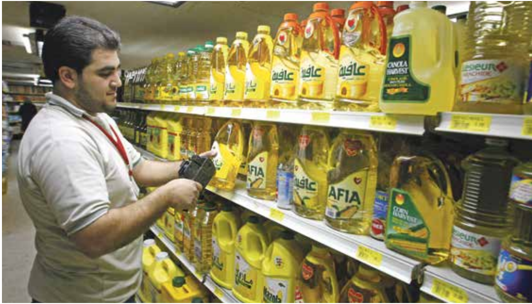
توفد السلع الأساسية بالأسواق (مصرف جدر/فارس رس)

بروز الاقتصاد الكفدي، وتراجع المضاربة على سوق القطع، وغيرها من الأسباب، علما أنّ هؤلاء يؤكّدون في المقابل أن سعر الصرف لا يزال وهما، ومصطنعا ويمكن أن يتغير في أي وقت، واجتمع رئيس حكومة تصريف الأعمال نجيب ميقاتي أمس الأربعاء مع منسّق «لجنة تنسيق عمليات مواجهة الكوارث والأزمات الوطنية»، الوزير ناصر ياسين والأمين العام للمجلس الأعلى للدفاع اللواء الركن محمد المصطفى واطلع منهما على نتائج اجتماع اللجنة الذي عقد في السرايا.