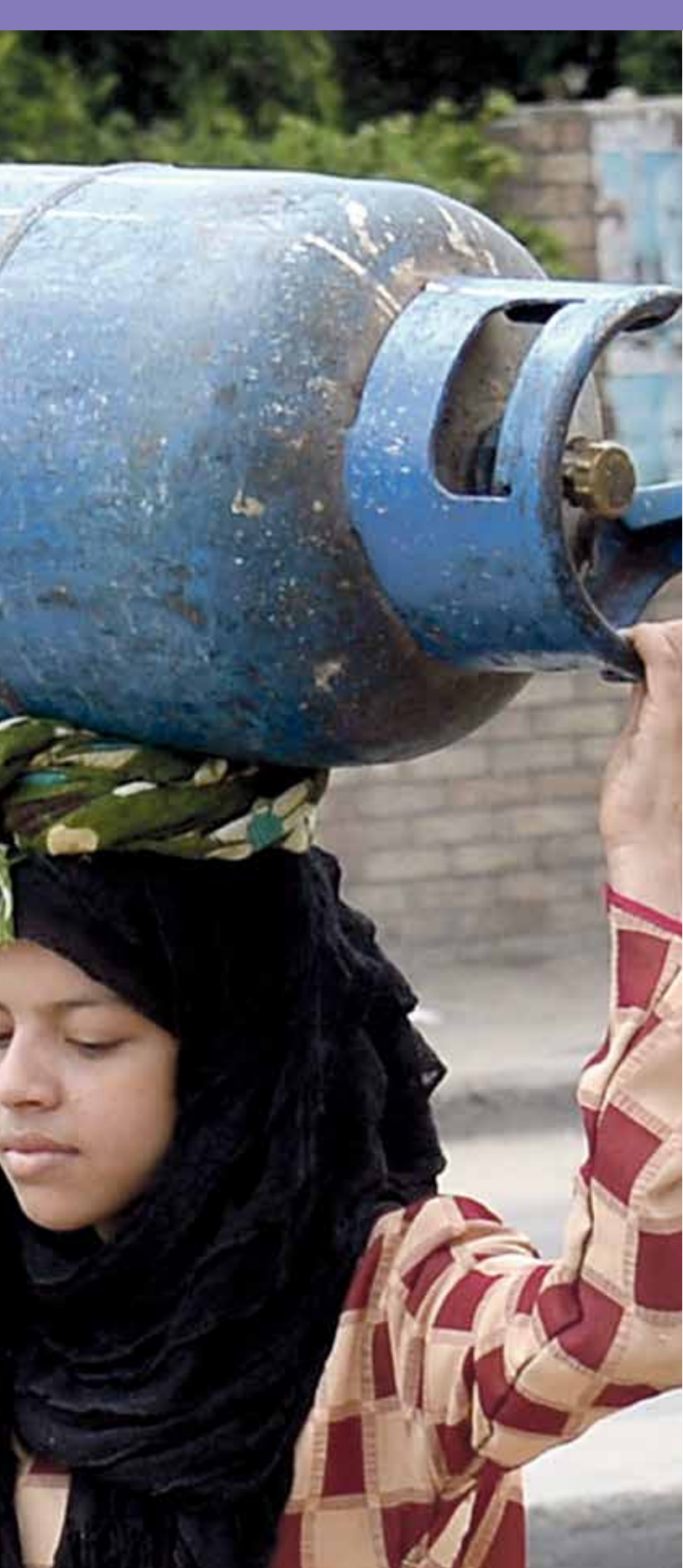
مواطنة تحمله اسطوانة غاز ظهرها فإفئة لإعادة نصلها