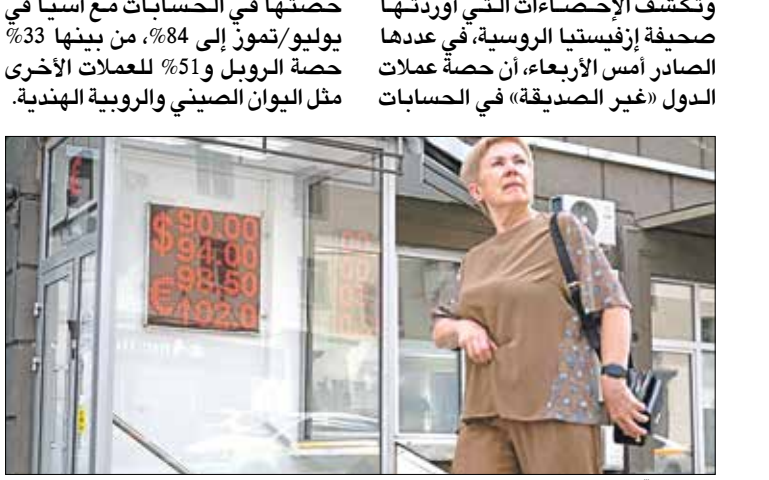
امرأة تزم امام لوحة تعرض أسعار صرف الدولار واليورو مقابل الريف في موسكو، 6 يوليو 2023

إجراء المعاملات بالعملات الغربية مع روسيا وإقدام الكرملين على إلزام الدول (غير الصديقة) (أي الدول التي انضمت إلى العقوبات بحق روسيا على خلفية حربها في أوكرانيا) بدفع قيمة الغاز الروسي بالروبل منذ ربيع عام 2022، وتكشف الإحصاءات التي أوردتها صحيفة إيفستينجا الروسية، في عددها الصادر أمس الأربعاء، أن حصة عملاّت الدول (غير الصديقة» في الحسابات المصرفية تراوحت بين 21,6% في بوليو/تخمون الماضي، بينما بلغت حصة الروبل 66,7% و11,7% للعملاّت الأخرى. وفي ما يتعلق بالحسابات مع بلدان آسيا وأفريقيا، ارتفعت حصة العملاّت الوطنية (أي الروبل وعملاّت الدول الشريكة) إلى 80% و84% على التوالي، بعدما ساهمت العقوبات الغربية في إحداث التغيير بهيكل التحويلات وتراجع حصتي الدولار واليورو في التجارة مع روسيا. وتكشف الإحصاءات زيادة حصة العملاّت الوطنية في الصادرات إلى الشركاء الرئيسيين أيضاً، إذ ارتفعت حصتها في الحسابات مع آسيا في بوليو/تخمون إلى 84%، من بينها 33% حصة الروبل و51% للعملاّت الأخرى مثل اليوان الصيني والروبية الهندي.