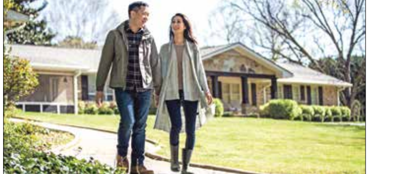
بعثيات منزل، مكلّنة البناء، في مدينة سلون مونتس بولاية جورجيا، 4 أبريل 2021