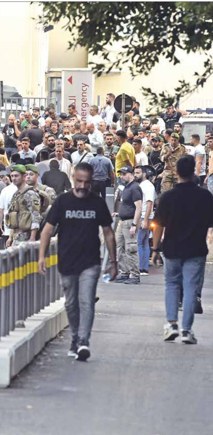
اسطول امني وطني في بيروت بعد انفجارات الطائرات التي طاولت أجهزة الاتصالات

INSTITUTE البحثية التايوانية، توجد بالفعل برامج مشتركة مختلفة للتعاون في مجال البحث والتطوير الصناعي، تتعمول من إدارة التكنولوجيا الصناعية في تايوان وهيئة الابتكار الإسرائيلية، التابعة لوزارة الاقتصاد في دولة الاحتلال. وتشمل الخطا عات الرئيسية للتعاون التكنولوجي الخفيفة، والاتصالات، والإنترنت، وتكنولوجيا المعلومات وبرامج المؤسسات، وعلوم الحياة، وأشياء الموصلاّت، وتكنولوجيا النانو، والدفاع، والتكنولوجيا الصناعية.