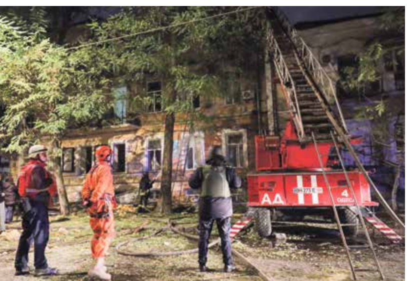
عمليات الإنقاذ في أوديسا فجر امس (اليمين)وكييف(الصورة)فترانس برس)

وفقا للحاكم العسكري للمنطقة، أوليه كبير، الذي أضاف على منصة لتدوير اميركي، أمس، أن إسرائيل ذكرت خلال هجومها على إيران الماضي، وقال إن حرائق اندلعت في عدة مواقع نتيجة الحزبات، وتم استهداف أنبوب التدفئة في المنطقة. كذلك أعلن الجيش الأوكراني، أمس، أنه أسقط 25 طائرة مسيرة من أصل 29 وصاروخا واحدا من صاروخين موجهين من طراز «كيه إتش-69»، خلال هجوم شنته روسيا ليل الخميس، الجمعة. في، التي وجهه الأخرى، كان وزير الخارجية الأوكراني أندريه سيبيها، قد كتب بل للعلم، أمس، على منصة إكس، أنه يتطلع للعمل على رغمت أوكرانيا المتغيرة.» وأضاف أن أوكرانيا «ستستخدم باستمرار أداة في أيدي الدول الغربية، بما يخص بالمصالح الوطنية لتلميحتي إلى السلام من خلال القوة» في أوكرانيا وحول العالم.» وسبق أن أشار في تهنئته لترامب الذي عينه انتخابه من جهته بعزمه زيلينسكي الكشف عن خطة من 10 نقاط، الأسبوع المقبل، تتناول قضايا إمدادات الطاقة وإنتاج الأسلحة من