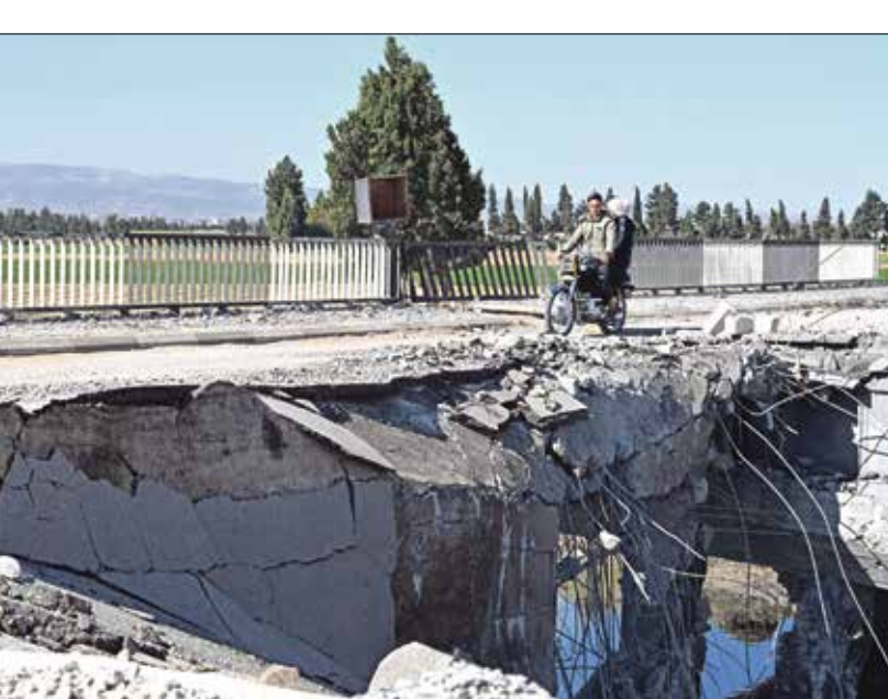
جسر استهدفته إسرائيل بريف القصر، 28 أكتوبر 2024

في موازاة ذلك أقادت مصارم «العربي الجديد»، بأنه إلى جانب حزب الله تنتشر في المنطقة مجموعات تنمّع للفرقة الرابعة، التي يقودها اللواء ماهر الأسد، شقيق رئيس النظام السوري بشار الأسد، وهي مجموعات