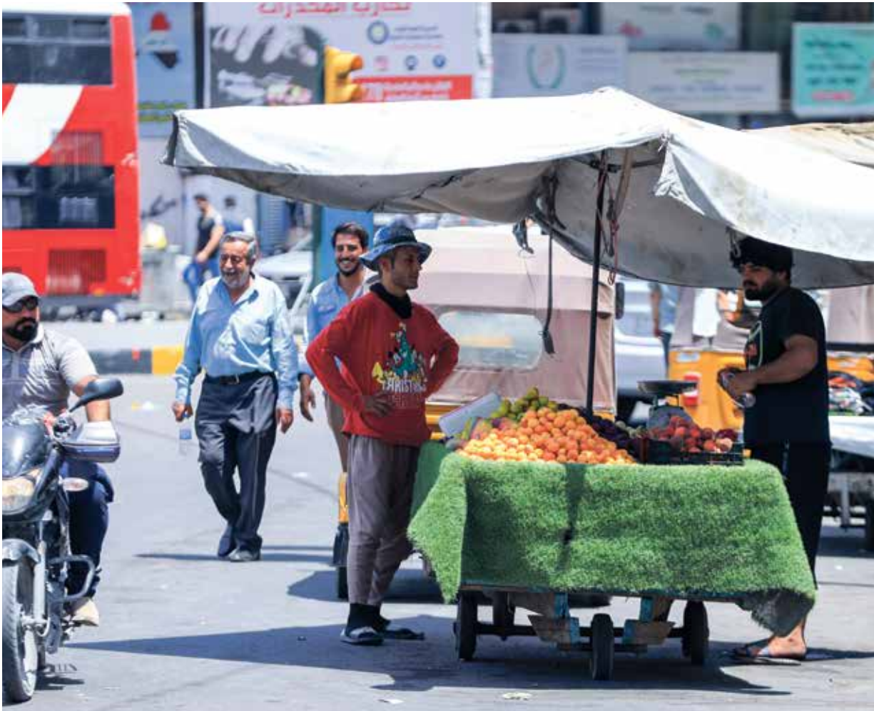
في أحد شوارع بغداد

الأولية ثم بقية المعلومات عن أفراد الأسر، والتي ترتبط بالصحة والعمل والإعاقة. تستكمل في مراحل لاحقة لتجرى مطابقة المعلومات مع دوائر الأحوال الشخصية». وقال إن «التعاون يجري حالياً مع معظم دوائر الخدمية والكهرباء والوزارات، وبالتالي فإن البلاد كلها مستعدة ومناهية لإجراء التعداد وإنجاحه». بين المتحدث باسم وزارة التخطيط العراقية عبد الزهرة الهنداوي، في حديث لـ«العربي الجديد»، أن «العراق يشهد زيادة سكانية بنسبة 2,6%، كل عام، يعني ذلك بلغة الأرقام أن عدد سكان العراق يزيد نحو مليون نسمة كل عام»، مضيفاً أنه «في آخر التقديرات التي وضعت عام 2023، تجاوز عدد العراقيين 43 مليون نسمة، ونُتوقع أنه وصل إلى 44 مليون نسمة خلال العام الحالي، فيما سنصل إلى رقم أكثر دقة خلال التعداد السكاني». ولفت الهنداوي إلى أن أحد الأهداف من التعداد السكاني في العراق «هو مسألة معالجة الفقر، خصوصاً في ما يتعلق بشبكة الحماية الاجتماعية التي وفرت مصادر مالية للأسر الفقيرة وتوفير الغذاء»، مشيراً إلى أن «التعداد السكاني الذي تتأهب كل دوائر ومؤسسات والقوات الأمنية في البلاد لإجرائه، سيكون النقلة الحقيقية على كل المستويات، وسيوفر معلومات لدى الحكومة من أجل توزيع الموارد، ويسهم في خفض مستويات الفقر». وكان رئيس تيار الحكمة عمار الحكيم قد دعا «إلى دعم وزارة التخطيط والمؤسسات الساندة لإنجاح التعداد السكاني»، مشدداً على أهميته في تقديم الخدمة للمواطنين، كونه «يساهم في تغيير عدد مقاعد المحافظات في مجلس النواب». وذكر الحكيم، خلال زيارته وزارة التخطيط، الأسبوع الماضي، أن «العراق لا يعرف عدد مواطنيه منذ نحو 28 سنة»، وأن «نجاح التعداد يعني إعداد خطط استراتيجية مهمة ستعود بالنفع على المواطنين».