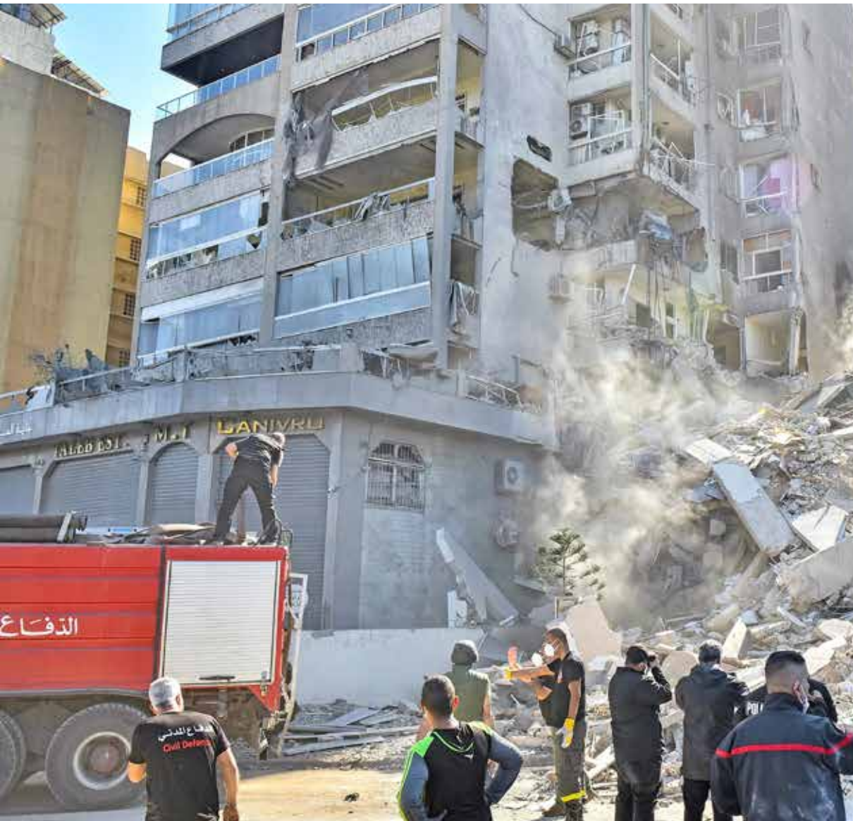
حطمت طائرات الاحتلال في الضاحية الجنوبية لبيروت أمس قطار حيفا

تحت الخط «أ»، وستعيّن على إسرائيل سحب قواتها من جنوب لبنان خلال سبعة أسابيع، وسيحل محلها الجيش اللبناني، الإسرائيلي على خاتمته إلى بري، وشددت عليه أن الهدف الأساس والربح لزيارتنا كي نقول بمرء فمنا إننا سنقف إلى جانب جمهورية لبنان حكومة وشعباً وفي كل الظروف، ونمننى حلحلة كل هذه المشكلات والمصاعب التي يعيشها لبنان وحكومته بأسرع وقت ممكن»، مؤكّداً أن «أي قرار