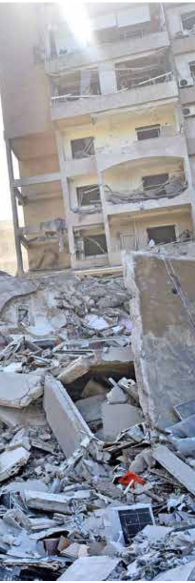
حطمت طائرات الاحتلال في الضاحية الجنوبية لبيروت أمس قطار حيفا

إذاً لزم الأمر، وباستثناء قوات اليونيفيل، سيكون الجيش اللبناني الرسمي هو القوة المسلّحة الوحيدة على الخط (أ) في جنوب لبنان (من دون تحديد ما إذا كان اللبناني لتنفذ القرار، والإنشراف على خط ترسيم وهمي حديثة الأمم المتحدة عام 2000 بغرض التحقق من انسحاب القوات الإسرائيلية من جنوب لبنان)، وبسوجب القرار 1701، ولعم إعادة بناء وتسلّح الجماعات المسلحة غير الرسمية في لبنان،