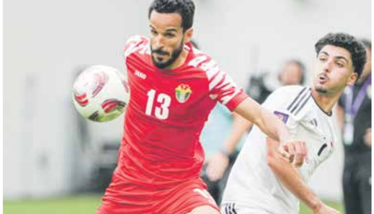
الأردن يخطئ الوصافة بشارف المصافح عن العراق الثالث