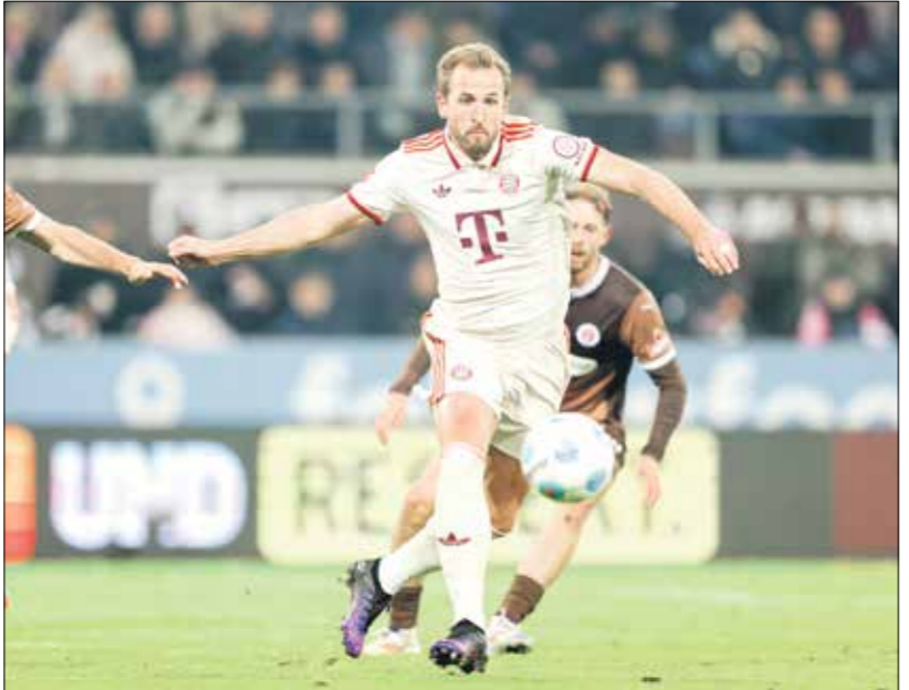
بولابله يرضع بعزيز صفوفه ثم خلل كل حين

ومانستستر يونايتد الإنجليزي، فيما يستعد الفريقان لتقديم عرض ضخم يبلغ 130 مليون يورو للعرض على خدمات لاعب منتخب الأسود الثلاثة، في خطوة المقبلة، إذ يتنافس نادبان عملاقان على كسفت صحيفة ديلي ميل البريطانية،