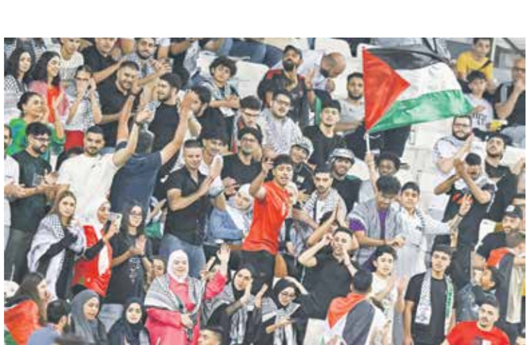
يخطئ منتخب فلسطين بحجم جماهيره كبير

تخوض المنتخبات العربية، مواجهات مهمة في التصفيات الآسيوية المؤهلة إلى كأس العالم 2026، من خلال الجولة الخامسة التي تقام اليوم الخميس، وفي هذا السياق سلط الموقع الرسمي للاتحاد الآسيوي لكرة القدم، الضوء على أبرز المواجهات المرتقبة. وفي المجموعة الأولى، يستقبل منتخب قطر نظيره الأوزبكستاني، وهو يأمل في الخروج بنتيجة إيجابية بعد سلسلة من النتائج غير المرضية مع المدرب الإسباني ماركيز