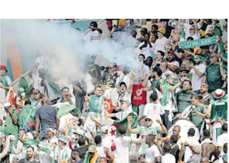
جماهير الجزائر ينظر الظهور بملابسهم مميز

من دون توقف، تعود عجلة التصفيات المؤهلة إلى نهائيات كأس الأمم الأفريقية لكرة القدم 2025 للدوران سريعا، عبر انطلاق الجولة الرابعة، وبداية رحلة الأيام، والأمطار الأخيرة في رحلة البحث عن بطاقات التأهل إلى النسخة المقبلة في المغرب. وتنتجه الانتظار العربية صوب منتخب الجزائر، صاحب البداية القوية في التصفيات، أملا في إعلان أول المنتخبات العربية رسميا المتأهلة إلى كأس الأمم الأفريقية. ويدخل منتخب «محاربي