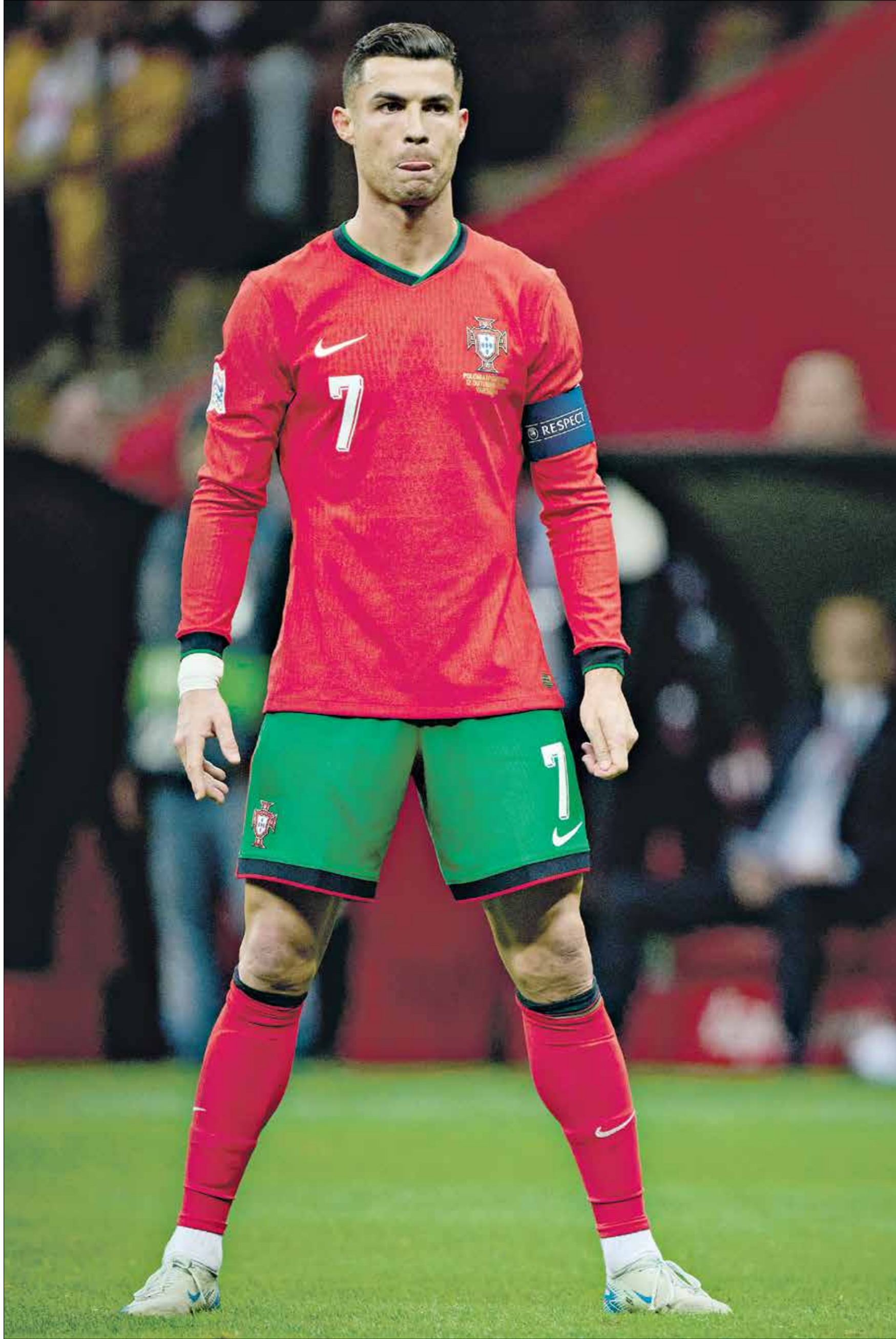
سجده رونالدو احد اهداف فوز البرتغال على بولندا

واصل قائد منتخب البرتغال، كريستيانو رونالدو، تحقيق الأرقام القياسية، بعدهما ساهم بالفوز على منتخب بولندا (3-1)، ضمن منافسات بطولة دوري الأمم الأوروبية. وعادل رونالدو رقم الإسباني سيرجيو راموس القياسي، بعدما وصل «صاروخ ماديرا» إلى 131 انتصاراً دولياً.