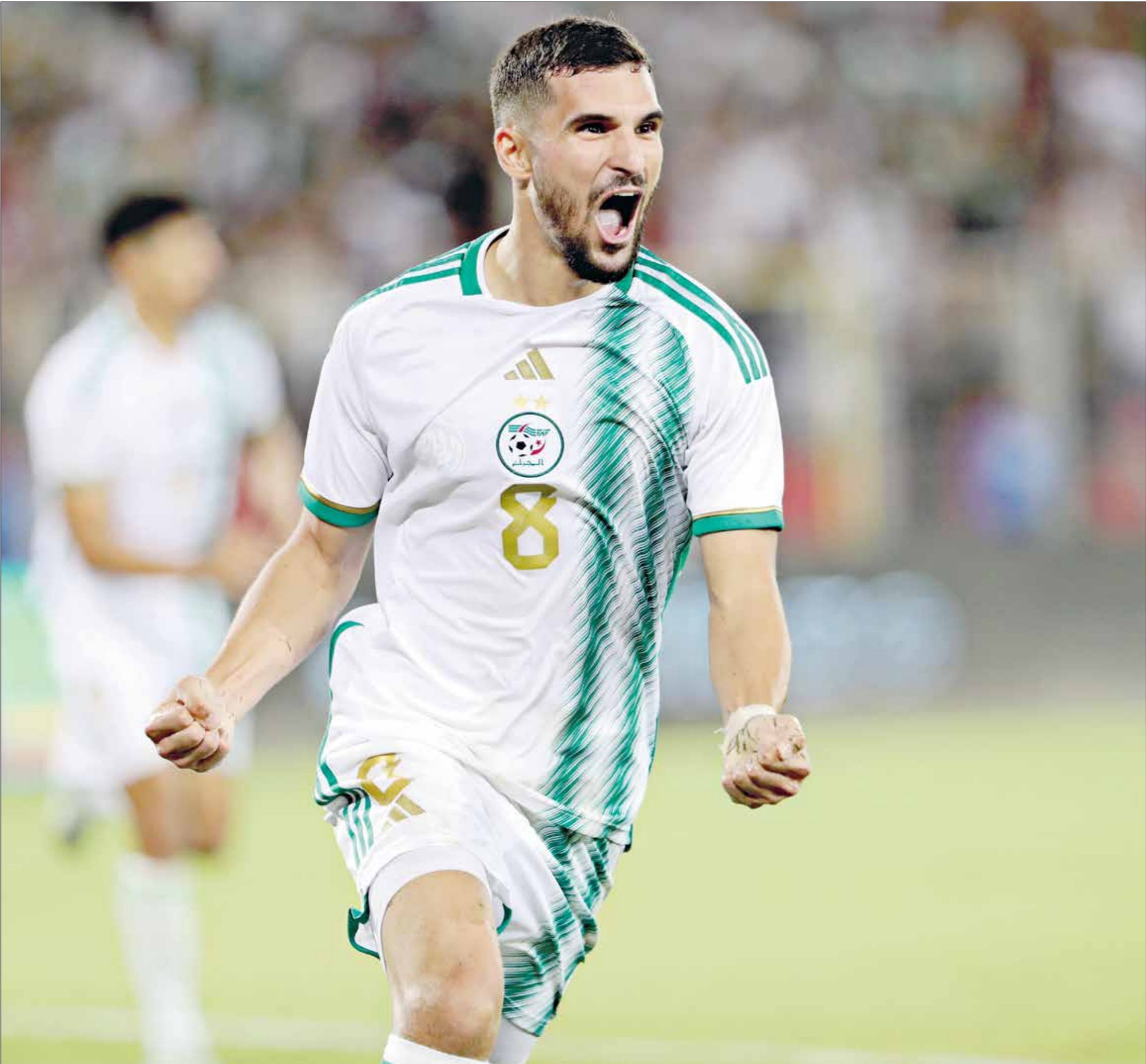
يسعى منتخب الجزائر للتأهل فور حديد على نظيره لونغو

كبيرة على مرمى الجزائر، وتعداها 1-1 في الشوط الأول قبل أن نعدل الطريقة، ونتأقفي الإخطاء في النصف الثاني، ونقدم 45 دقيقة متالية، وسجلنا فيها أربعة أهداف، وحققنا الفوز الكبير، وهو الأمر الذي يجب وضعه في الحسابات جيدا خلال اللقاء المقبل». وأضاف بيتكوفيتش: «سيناريو المباراة الأخيرة كان مذهلا، وحققنا الهدف الأهم بالنسبة لينا، وهو تصدُر المجموعة، بل نوسعى الآن لتكرار التفوق، وحسم التأهل إلى كأس الأمم الأفريقية مبكرا»، وأشار