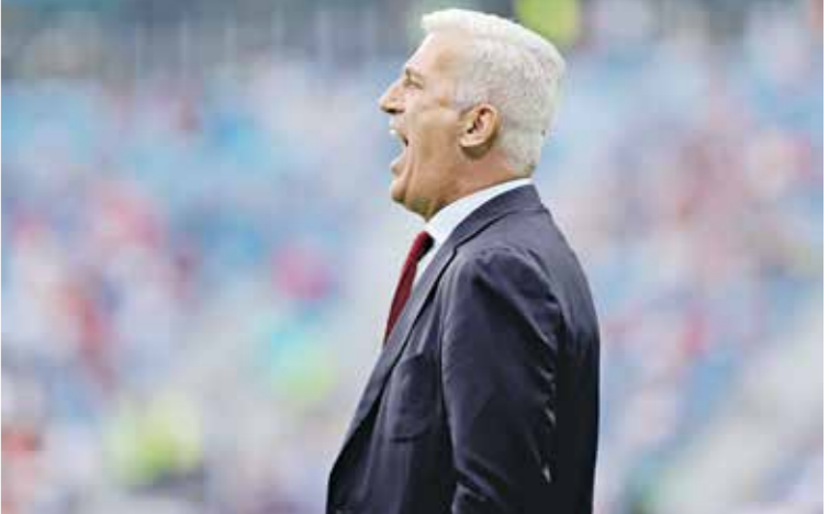
بيتكوفيتش يريد قيادة الخطر إلى اعم إفريقيا

الإصابة التي تعرض لها، وحاجته إلى فترة أخرى من العلاج، وذلك بعد مشاورات مع المدرب بيتكوفيتش. ومن جانبها، أكد فلاديمير بيتكوفيتش، المدير الفني للمنتخب الجزائري، في تصريحات صحافية، جاهزية لاعبيه لموقعة تنوغو، وطى صفحة الفوز الكبير بخمسة أهداف لهدف في الجولة الماضية. وقال: «المباراة الماضية لم تكن سهلة، بل صعبة للغاية، وعندما تركنا مساحات للمنافس شكلت تحركات لاعبيه خطيرة