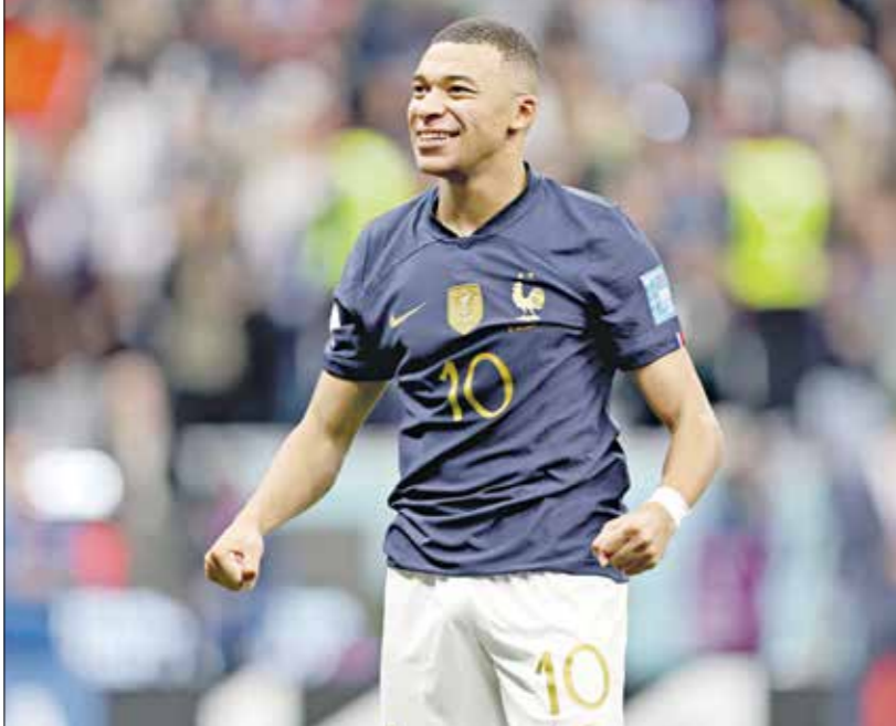
غاب مبابي عن قائمة فرنسا الأخيرة

نظراً إلى أن مبابي كان يفترض به تدعيم رفقة في المنتخب، لتعويض البداية الفاشلة، بعد الخسارة أمام إيطاليا في الجولة الأولى بعد أسبوعين، في السويد، خلال خوض منتخب بلاده مباراة ضمن الجولة الثالثة بدوري الأمم الأوروبية، أمر أثار غضب الفرنسيين،