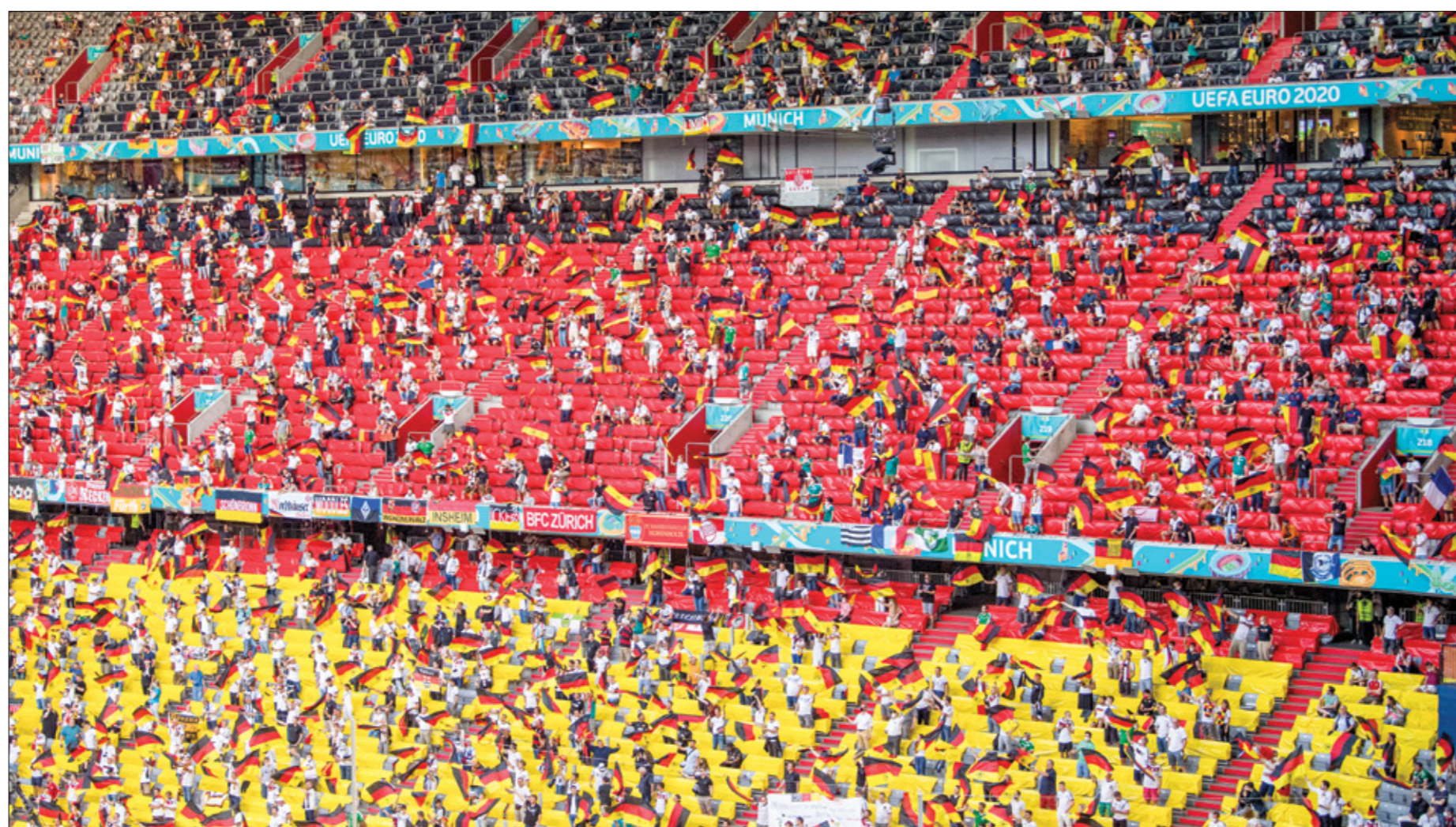
يسعد ملعب ألينز أرينا في ميونخ لحوالي 75 ألف متفرج

المباراة الافتتاحية في نسخة عام 2024، هي السبب لصعوبة المواجهة فقط، إذ إن منتخب اسكتلندا واجه صعوبات كبيرة عندما واجه منتخب ألمانيا تاريخياً في المواجهات الرسمية ولم يُسجل أي فوز. ويواجه منتخب اسكتلندا منافسة منتخب ألمانيا في ثماني مواجهات رسمياً سابقاً (التصفيات المؤهلة إلى بطولة كأس العالم، التصفيات المؤهلة إلى بطولة المونديال)، وفازت المنافسات في ست مواجهات، بينما انتهت مباراتان بالتعادل، وهو ما يؤكد الصعوبات الكبيرة التي يواجهها المنتخب الاسكتلندي عندما يلعب أمام ألمانيا في المباريات الرسمية.