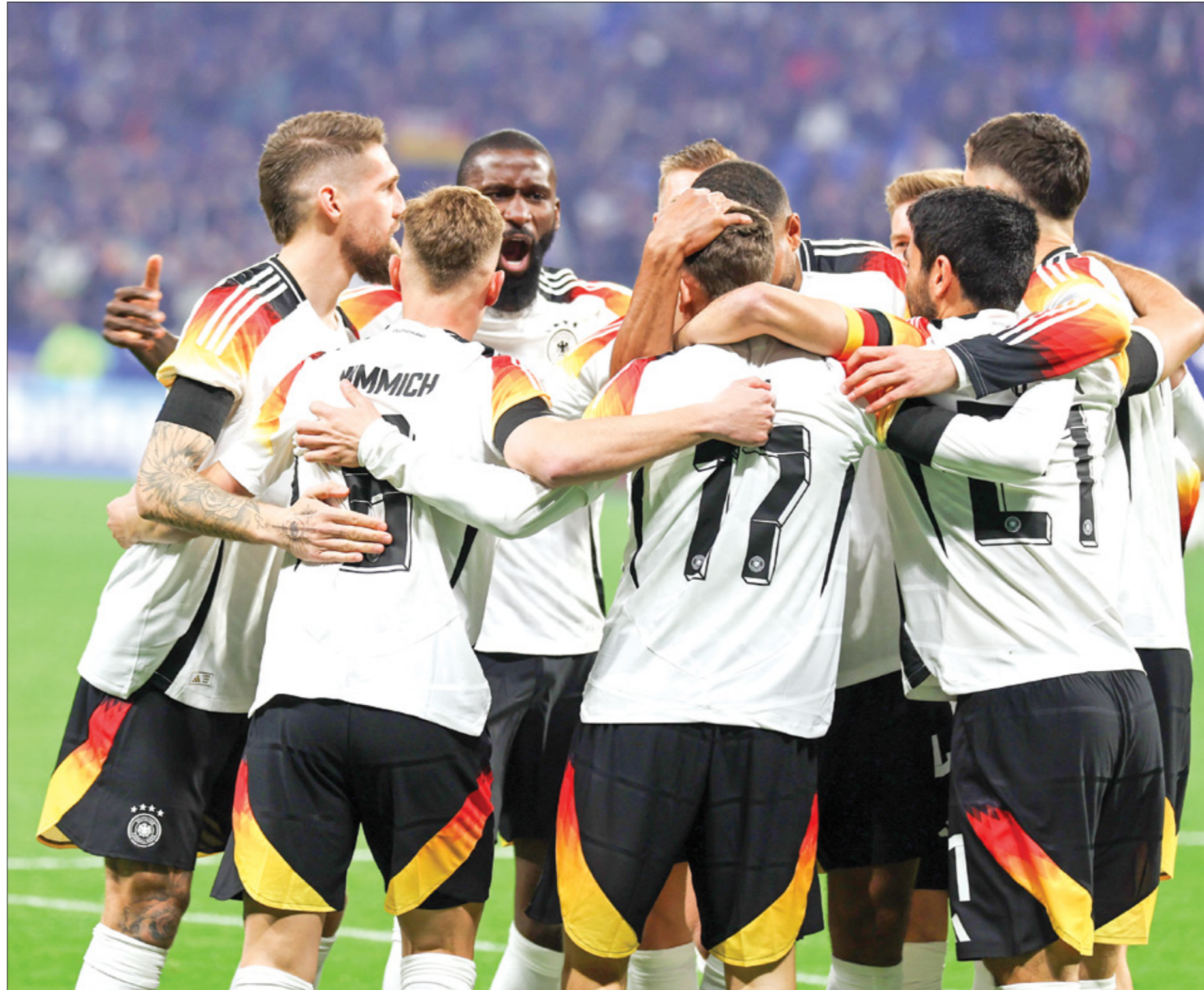
يعتبر المنتخب الألماني من أقوى منتخبات المجموعة الأولى

من دون خسارة، وتحقيق الفوز ضروري للبدء برحلة جمع النقاط للتأهل إلى الدور الثاني من المنافسات، ومن المهم أن يُنهى المنافسات دور المجموعة من الصدارة، من أجل مواجهة منافس يحتل المركز الثاني في المجموعة الثالثة.