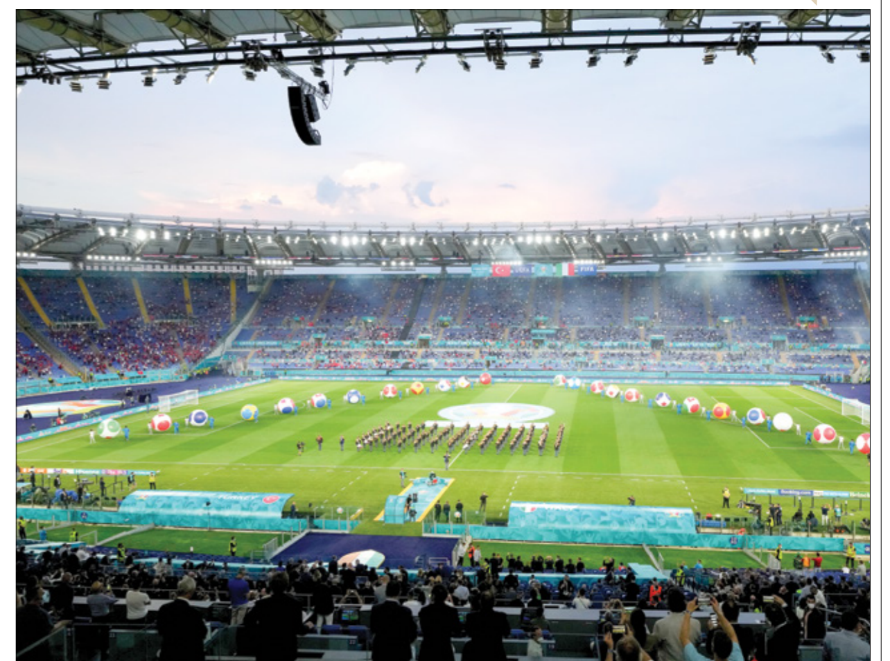
شهد افتتاح يورو 2020 في إيطاليا حضور 12 ألفاً فقط بسبب إجراءات فيروس كورونا

تنتقل منافسات بطولة يورو 2024، مساء الجمعة، بمباراة افتتاحية ستجمع بين منتخبي ألمانيا وإسكتلندا ضمن منافسات المجموعة الأولى، وستلعب على استاد ألينز أرينا في مدينة ميونخ، الذي يستوعب حوالي 75 ألف متفرج. وعليه من الممكن أن تصبح المباراة الافتتاحية لبطولة يورو 2024 ثاني أكثر المباريات الافتتاحية حضوراً للجماهير في تاريخ البطولة الأوروبية. وفي عرض لتاريخ المباريات الافتتاحية لبطولات اليورو بين سنوات 1960 و2020، يتضح أن المباراة الافتتاحية لبطولة يورو 2024 ربما تصبح ثاني أكثر المباريات حضوراً جماهيرياً في تاريخ المنافسات، خصوصاً مع سعة مدرجات تصل إلى حوالي 75 ألف متفرج، إذ إن أعلى حضور جماهيري كان في افتتاح بطولة يورو 1996 في إنكلترا بسعة وصلت إلى 76 ألف متفرج على ملعب ويمبلي. وفي افتتاح بطولة يورو 1960 في فرنسا، شهدت المباراة الافتتاحية حضور حوالي 26 ألف متفرج، فيما شهدت أول مباراة في نسخة يورو 1964 في إسبانيا حضوراً جماهيرياً ناهز الـ 34 ألف متفرج، أما في نسخة يورو 1968، فحضر المباراة الافتتاحية حوالي 68 ألف متفرج، فيما حضر أول مباراة في يورو 1972 في بلجيكا حوالي 55 ألف متفرج. فيما شهدت المباراة وحضر إلى ملعب المباراة الافتتاحية في بطولة يورو 1976، التي استضافتها