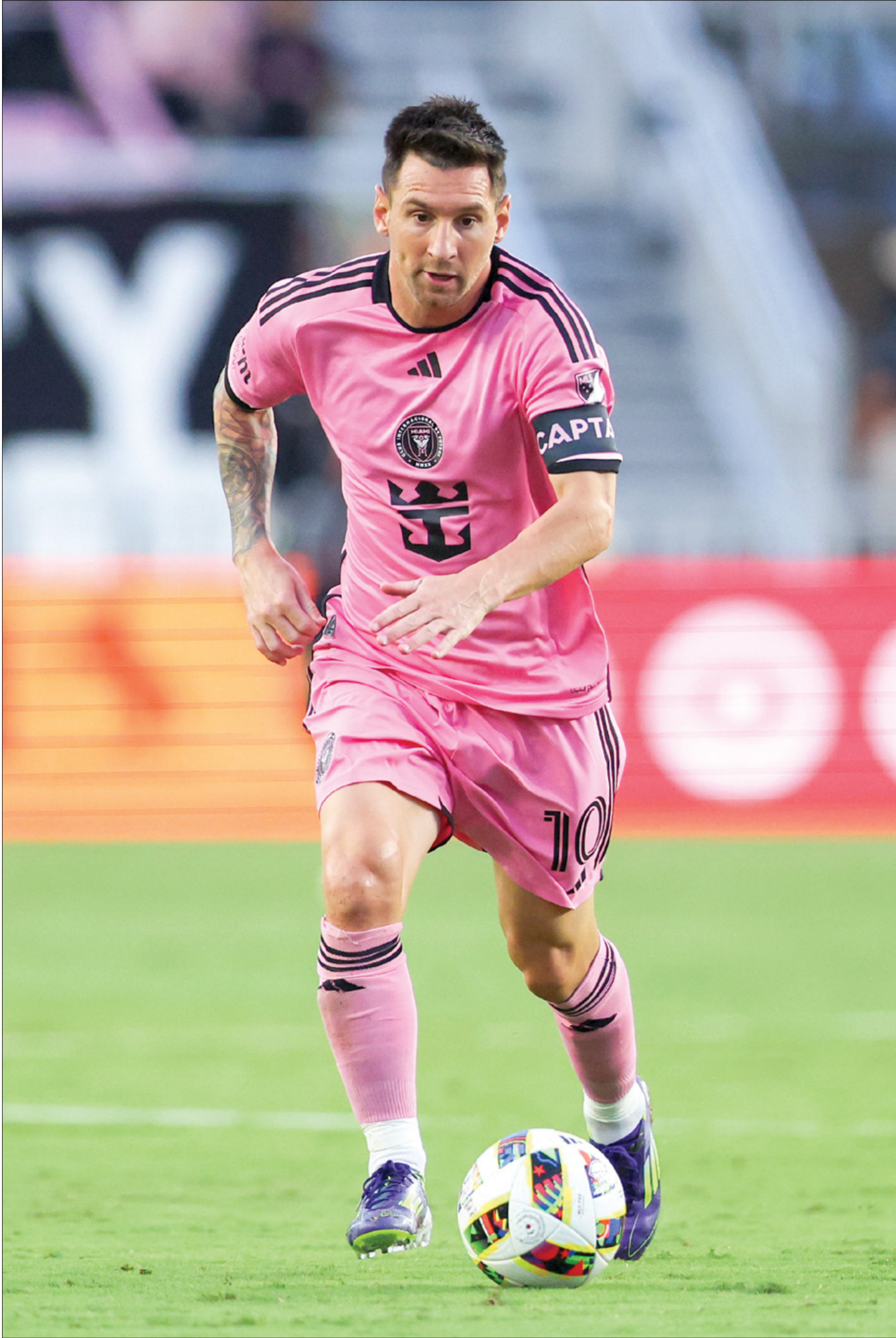
يقدم ميسي مسلوباً فميراً مع إنتر ميامي منذ وصوله

أكد ليونيل ميسي أن نادي إنتر ميامي الأميركي سيكون فريقه الأخير قبل أن يختتم مسيرته الاحترافية، وذلك في مقابلة مع شبكة ESPN. سأل النجم الأرجنتيني عن المرحلة الأخيرة من مسيرته وإن كانت كرة القدم غير جاهزة لمغادرته فقال: «أنا لا أتحيد ذلك أيضاً. فعلت ذلك طوال حياتي، أحب لعب الكرة، واستمتع بالتدريبات، والحياة اليومية للمباريات. نعم، أشعر ببعض الخوف من أن كل شيء سينتهي. اعتقد أن إنتر ميامي سيكون فريقتي الأخير».