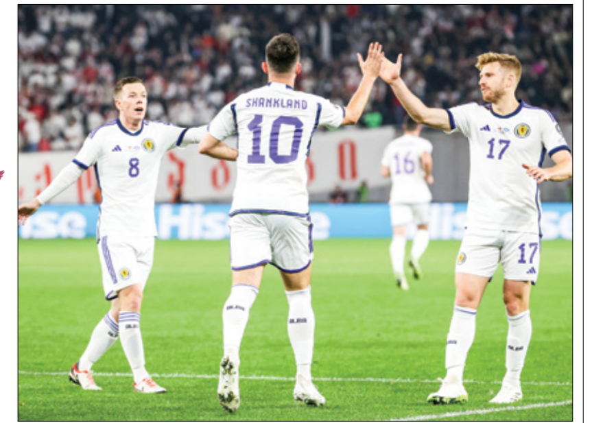
يعلق المنتخب الاسكتلندي المكافئ لمفاجأة

ألمانيا لا تخسر المباراة الافتتاحية خاض المنتخب الألماني سابقاً أربع مباريات افتتاحية في بطولة اليورو تاريخياً، والافتتاحية في نسخة يورو 1988، عندما كانت أول مرة في نسخة يورو، وكانت أول مرة يدخل المنتخب الألماني واجه المنافسات منافسة منتخب إيطاليا على أرضه في مدينة وسيدور بحضور حوالي 62552 متشجعاً، وانتهت المباراة بالتعادل (1-1)، وفي تلك النسخة تأهلت ألمانيا من الصدارة برصيد خمس نقاط وإيطاليا من الوصافة بنفس رصيد النقاط. وفي المرة الثانية خاض منتخب ألمانيا أول مباراة في بطولة يورو 1972، عندما كان نظام البطولة آنذاك مجرد مباراتين في الدور نصف النهائي ولعبت المباراتان يومي 14 يونيو/حزيران 1972، وافتتحت ألمانيا المباراتين عبر اللعب ضد منتخب بلجيكا والفوز (2-1)، لتتاهل إلى المباراة النهائية التي شهدت فوز المنافسات الثلاثية نظيفة على منتخب الاتحاد السوفيتي، لتتوج ألمانيا باللقب الأوروبي. كما وخاضت ألمانيا المباراة الافتتاحية لبطولة يورو 1980 على استاد الأولمبيكو في مدينة روما الإيطالية، ولعبت حينها في مواجهة منتخب تشيكوسلوفاكيا، وتفوقت بهدف نظيف في المباراة الأولى، وساهم هذا الفوز في تأهل ألمانيا إلى الدور الثاني بعد جمع خمس نقاط. وفي نسخة يورو 2000، افتتح المنتخب الألماني البطولة أمام منتخب رومانيا على استاد موريس دورفراسني في مدينة ليجي، البلجيكية، وانتهت المباراة بالتعادل (1-1)، ليكون المنتخب الألماني خاض أربع مباريات