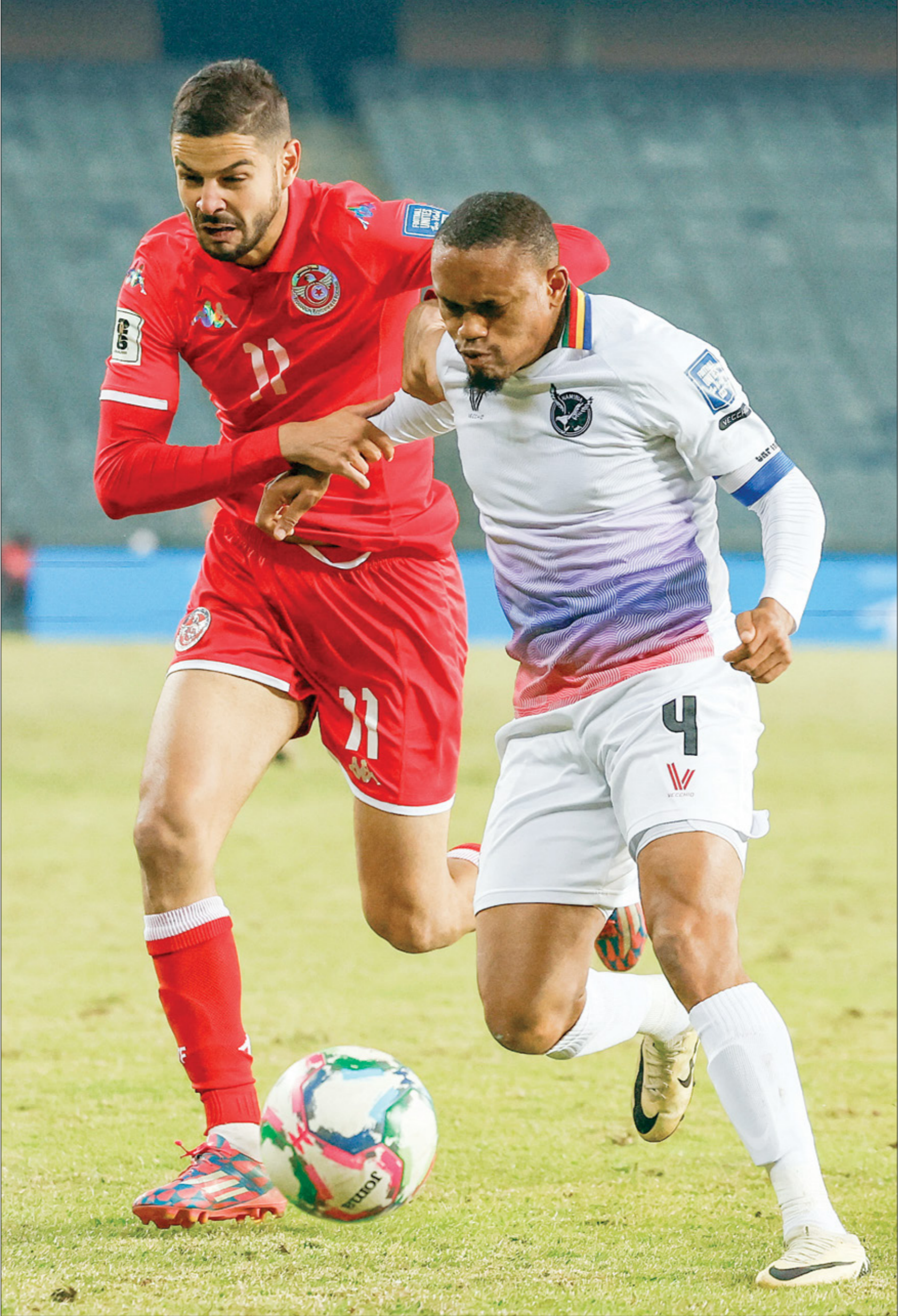
بريد ملخكح تونس مواصلة للفوز الجيدة بالتصفيات

وسار المنتخب المغربي، بقيادة مدربه ولید البركازي، على النوازل نفسه في التصفيات الأفريقية، بعدما نجح في تحقيق الفوز مرتين خلال الجولتين، وحصد العلامة الكاملة وتخطى عقبة منتخب زامبيا بهدفين مقابل هدف، ثم هزّم منافسه منتخب الكونغو سدة أهداف نظيفة، ونال ست نقاط في سياق المجموعة الخامسة. وتنوعت ضربة بداية المديرين الجُدد في ثلاثة منتخبات عربية كبرى، إلى صدارة مستحقة وفوز وتعادل وهزيمة في سياق الجولتين الثالثة والرابعة، يتصدرهم حسام حسن المدير الفني المنتخب مصر، الذي حقق أربع نقاط في أول ظهور له بالفوز على منتخب بوركينا فاسو (2-1) والتعادل مع منتخب غينيا بيساو (1-1) ووصل إلى النقطة العاشرة. في المقابل، سار على الخطى نفسها، متصدر حقيق الفوز على منتخب غينيا الإسوائية (0-1)، ثم تعادل مع منتخب ناميبيا سلبيًا، ليحصد أربع نقاط وفوز «سور قرطاج» إلى صدارة المجموعة الثامنة في التصفيات الأفريقية، فيما اكتفى فلاديمير بيتكوفيتش المدير الفني منتخب الجزائر، بالحصول على ثلاث نقاط فقط في سياق المجموعة السابعة، وحقّق الفوز الغالي على منتخب أوغندا (2-1) في عقر دارها، لينجو من انتقادات كبرى انفجرت ضده، عندما خسر لقاءه الرسمي الأول مع منتخب الجزائر ضد منتخب غينيا (1