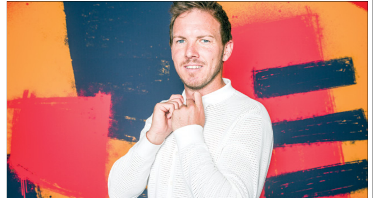
يريد مدرب منتخب ألمانيا المور فيدو إله مباراة وتجنب الضغوط الكبيرة