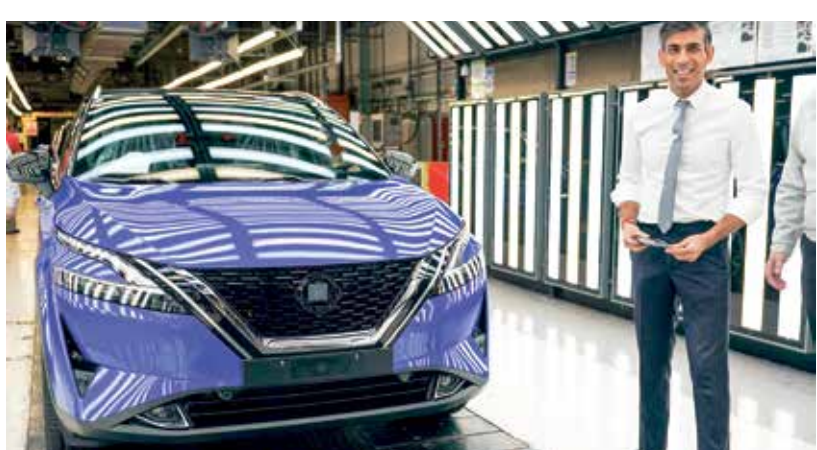
سيارة كاشقاي في مصنع نيسان في سندرلاند، إنكلترا، 24 نوفمبر 2023

1 - فورد بوما 38944 دولاراً: إنها متفوقة بسهولة على أحدث سيارة نيسان جوك وسيارة فولكسفاغن تي كروس الباهتة، وتجلب جاذبية السائق إلى فئة غير مثيرة للاهتمام من السيارات. 2 - كيا سورنيج 37582 دولاراً: إذا كنت تبحث عن سيارة كروس أوفر عائلية