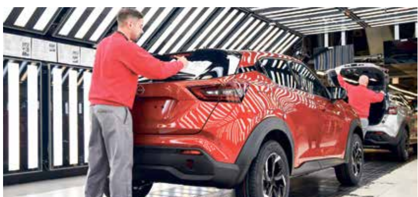
نيسان جوك في مصنع سندرلاند، إنكلترا، 24 نوفمبر 2023

عن المحرك وعلبة التروس والعماد وجميع تجهيزات خزان الوقود، انظر إلى مدى اتساع المقصورة وإلى مقدار التخزين الذي يمكن توفيره في صندوق السيارة. 10- إم جي موتور يو كيه أتش إس 23115 دولاراً: تمثل سيارة HS الجديدة خطوة مفيدة إلى الأمام، فقد تحسّن مظهرها وناقل الحركة ومستوى الجودة، إلا أن شخصيتها لم تتغير كثيراً، في حين أن معظم تعقيدها سطحي.