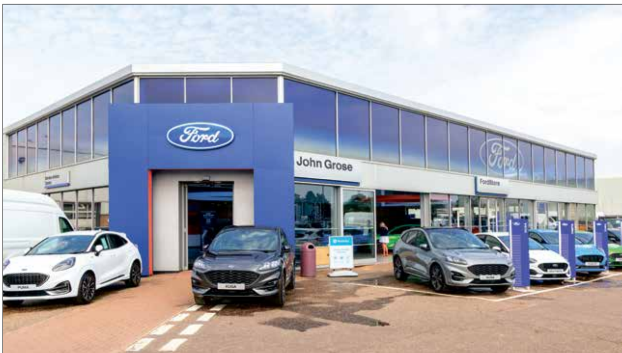
وكالة فورد للسيارات، منطقة راسومر الصناعية، إنكلترا، 23 أغسطس 2023 (جيتي)