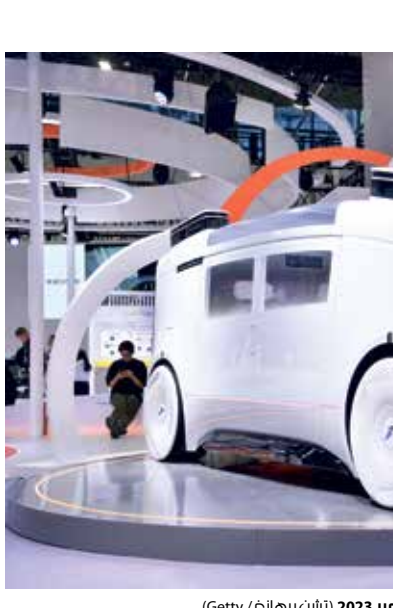
سيارة ديجي نيورون ذاتية القيادة، فونالغشو، الصبة، 17 نوفمبر 2023

شركات تتخلص عن «الذاتية»، بينما تواصل أخرى جهودها