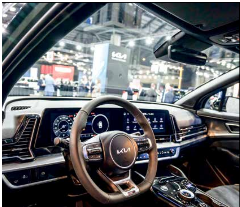
كيا سورنيج جيب تي لايث برشلونه، 30 سبتمبر 2021