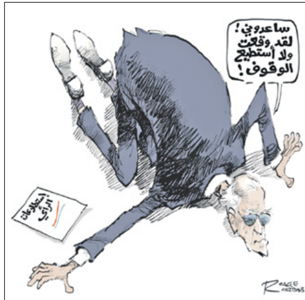
ريفرز، كيفك كار تونز