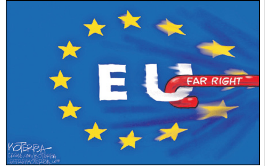
عصا اليمين تجر أوروبا إلى اليمين (جيف كتربا، كيفك كار تونز)

مع إعلان نتائج الانتخابات الأوروبية نتاجت ردود فعل وتصدعات سياسية وصدمة في كل أوروبا، فاليمين المتطرف واليمين الشعبوي حققا مكاسب بارزة في عدة دول أوروبية، وهو ما يندرج تحت تحولات سياسية على عدة صعد، وجو من التبرم والتشاؤم واستحضار للنازية خيمت على المشهد الكاريكاتوري العالمي. إليكم باقة من الرسومات حول انتخابات أوروبا.