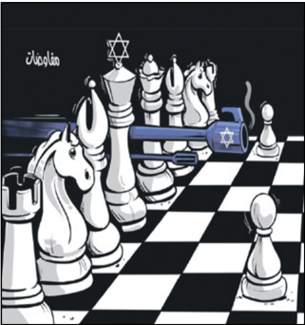
مفاوضات مع إسرائيل (يوسف الملا، البلاد البحرينية)