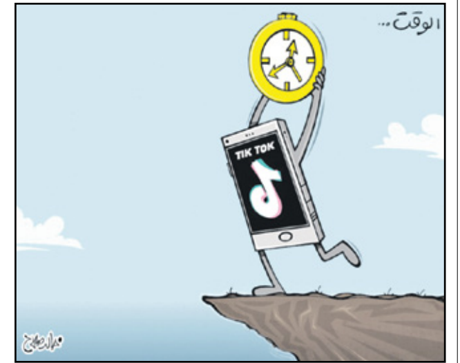
تيك توك قاتل الوقت الوله