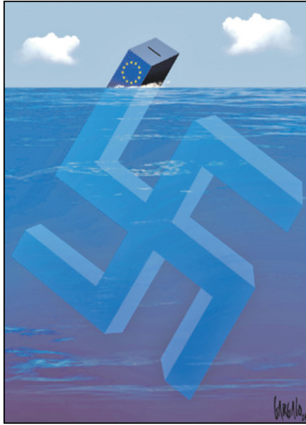
الانتخابات ليست إلا قمة جبل الجليد (فالسكو غارغالو، كار تون موفمنت)

مع إعلان نتائج الانتخابات الأوروبية نتاجت ردود فعل وتصدعات سياسية وصدمة في كل أوروبا، فاليمين المتطرف واليمين الشعبوي حققا مكاسب بارزة في عدة دول أوروبية، وهو ما يندرج تحت تحولات سياسية على عدة صعد، وجو من التبرم والتشاؤم واستحضار للنازية خيمت على المشهد الكاريكاتوري العالمي. إليكم باقة من الرسومات حول انتخابات أوروبا.