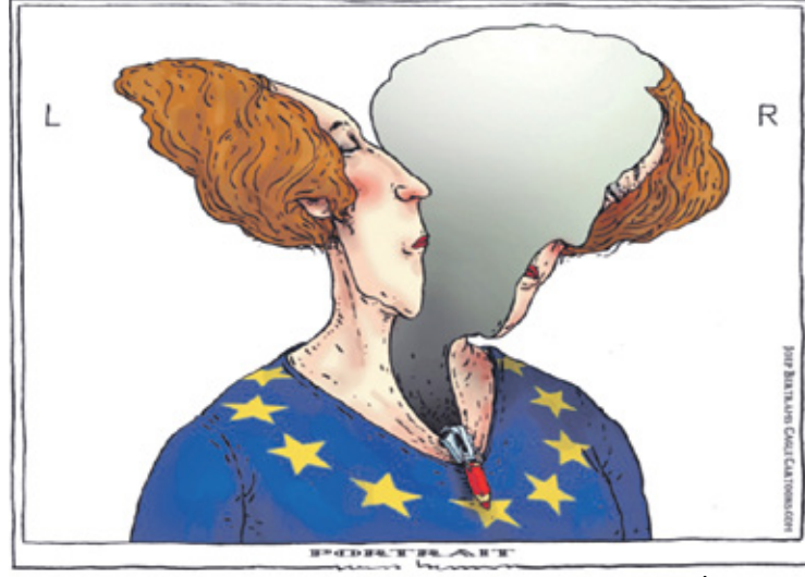
أوروبا المنشطرة إلى نصفين متناقضين (جويو بر تراهر، كيفك كار تونز)

لا أحد يعلم سبب اختفاء الدجاج في الفترة الأخيرة، إلا الراسخين في شؤون «التدجين». صحيح أن بعض المصادر الإخبارية «اجتهدت» عندما عزت السبب بتصدير أفواج منها إلى إسرائيل التي باتت تعاني نقضاً حاداً في سلة غذائها، لكن بعض الاجتهاد «إنهم»، وحتى إن صح ذلك، فهو ما بحسب من باب «النخوة»، لأن «الجار للجار». أما وزير الزراعة، فكان أكثر دقة، عندما عزا سبب ارتفاع أسعار الدواجن إلى موجة الحز الأخيرة. صحيح أن الموجة لم تستمر سوى يومين، لكنها كانت كفيلة بالقضاء على حشود عارمة منها، ولا سيما دجاج المزارع الذي يفترض أنه يتمتع بحماية كبيرة من الظروف الجوية، لكن على ما يبدو، أن الدجاج قرر أن يغادر مزارعه في ذروة الحرارة، فلقبي مصرعه. عموماً هي محض اجتهادات، لكن الرواية الحقيقية، جاءت على لسان إحدى الدجاجات التي قادت عملية «الاختفاء»، فقد كانت، بحق، دجاجة ذكية، عندما اقنعت أخواتها، بأن الوقت مناسب للحصول على «إجازة»، على اعتبار أن العرب منشغلون هذه الأيام بـ«الأشقاء» الخراف، فالتركيز كله منصب عليهم مع اقتراب عيد الأضحى. استقبلت حشود الدجاج هذا النبا بفرح عارم، واعتبرت نفسها «محتلولة»، وأن العيد عيدها هي، لا لشيء سوى لأن موعد السكنين تأخر قليلاً. أكثر من ذلك، تفاقم تمرد الدجاج عندما أدرك أن «الأقفاص» لم تعد معياراً للتمييز بينه وبين كثير من عرب المزارع.