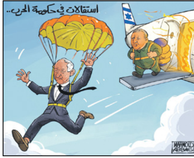
غانس يفر من طائرة تنيهاو