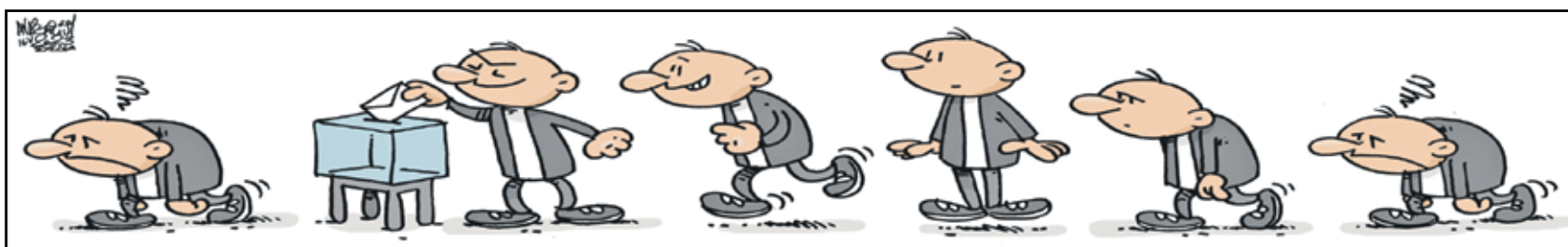
شريط تاسوس اناستاسو كار تون موفمنت