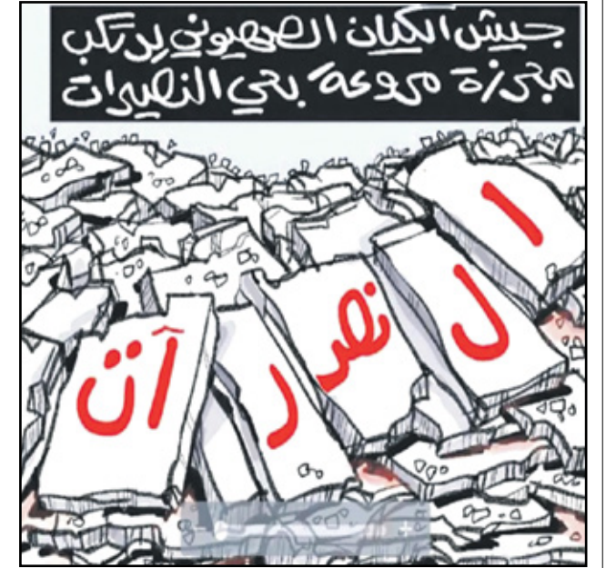
مجزرة مخيم النصيرات