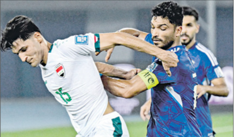
لقاء العراق والكويت شهد إثارة كبيرة

ربيعين سولاقا في الدقيقة السابعة من عمر اللقاء. وبعد اللقاء، أكد خوسوس كاساس، مدرب العراق، أن المباراة منذ بدايتها كانت مفيدة فنياً بالنسبة لنا بسبب قرار تحكيمي أعده قاسيا بعد الرجوع لتقنية الفار. وتابع: «بعدها كنا على الأقل نستحق من فرصة للتسجيل، وعموما الحصول على نقطة واحدة أفضل من أن نخرج بالخسارة». وأضاف: «منتخب الكويت لعب بشكل جيد، وكانت لديه بعض المحاولات لكنها لم تشكل