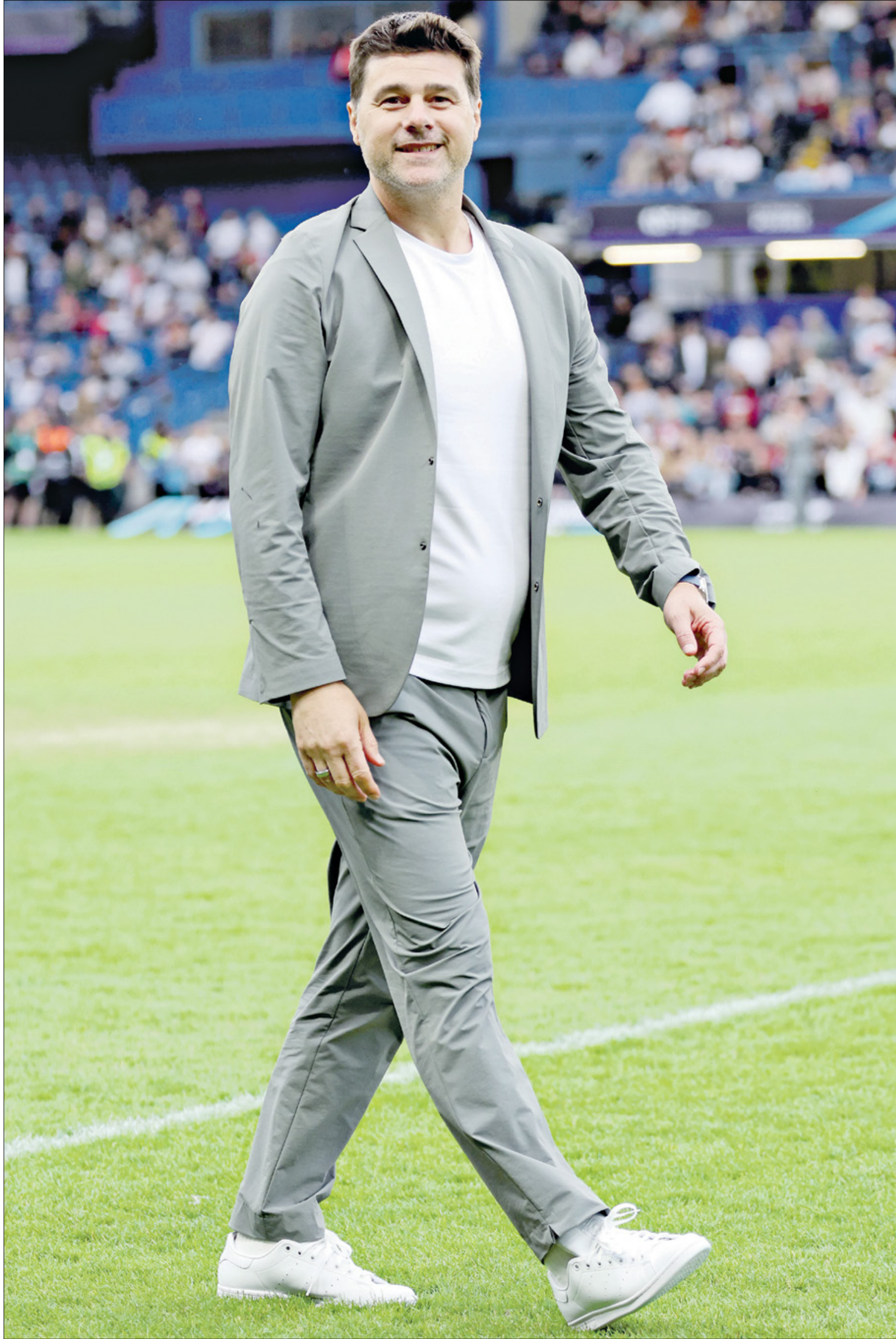
ماوريسيو بوكيتينو على ملعب ستامفورد بريدج مع تشلسي

اعلن الاتحاد الاميركي لكرة القدم تعيين الارجنتيني ماوريسيو بوكيتينو مديراً فنياً للمنتخب الأول ليتولى مهمة قيادة الفريق الوطني لخوض بطولة كأس العالم المقرر 2026، إقامتها في الولايات المتحدة والمكسيك وكندا. وذكر مات كروكر، المدير الرياضي للإتحاد الأميركي لكرة القدم، أن ماوريسيو لديه «شغف شديد بتطوير اللاعبين وبراعة مثبتة في بناء فرق متحدة وتنافسية».