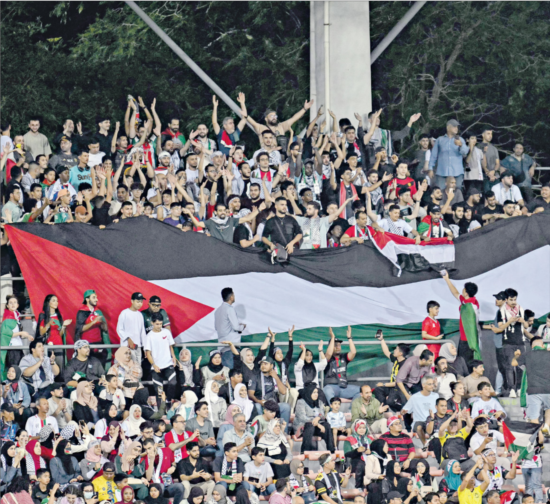
منتخب فلسطيني يحتف على دعم كبير في ماليزيا