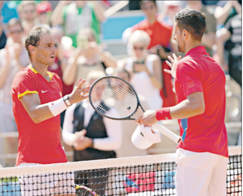
نادال يتحدث لوفان بعد هزيمة المباراة في الأولمبياد

وتابع نادال: «إذا كان لاعب التنس يتبع نظاماً غذائياً خالياً من الغلوتين أو نظاماً