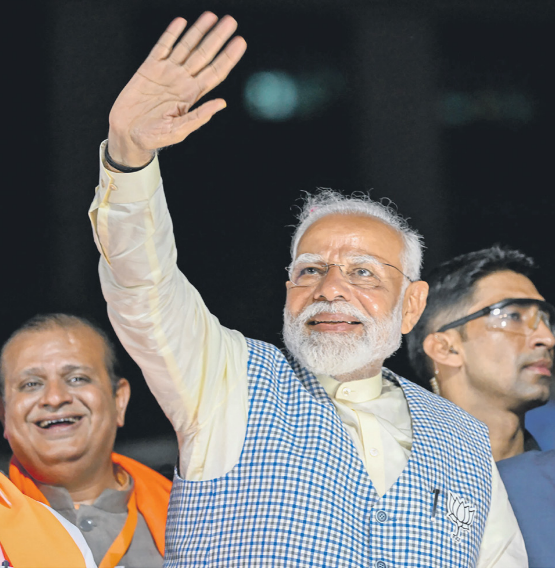
تراجع عدد نواب حزب تومون (اليمين) والناشط/مراسل وشي

يعملون في أعمال هامشية ووظائف يومية وباجور متدنية. وفق بيانات صندوق النقد الدولي، بلغ حجم الاقتصاد الهندي في العام الماضي 3,57 تريليونات دولار ونما بنسبة 7,8%، كما بلغ دخل الفرد من الناتج المحلي في الهند 2,73 ألف دولار. ويبلغ عدد سكان الهند 1,441 مليار نسمة.