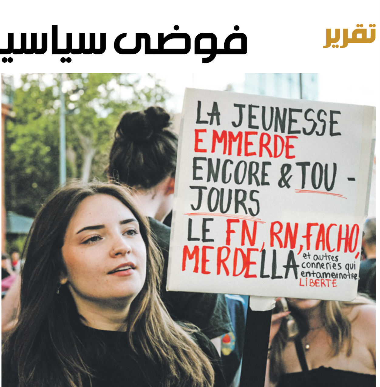
من تظاهرة ضدّ اليمين المتطرف في ناورل أول من أمس

تسود الفوضى السياسية في فرنسا مع تصد اليمين المتطرف نتائج الانتخابات البرلمانية الأوروبية، وسط بحث كل طرف سياسي خاسر عن كيفية بناء تحالفات لصدّ اليمين المتطرف في الانتخابات التشريعية المبكرة التي إيمانويك ماركون