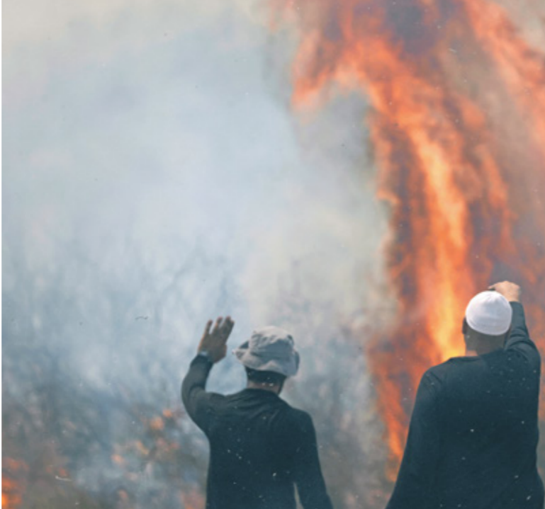
حرقه فيم الجولان المحتل جراء قصف حزب الله، الأحد الماضي

كما أعلن حزب الله أمس، استهداف «معارضات صواريخ كاتوشا» تكفة يردن الواقعة في هضبة الجولان المحتل ردّاً على اعتداء العدو الصهيوني الذي ي طاول منطقة البقاع، كما نعى حزب في بيانات منفصلة 3 من مقاتليه، قائلًا إن كلاً منهم «ارتقى شهيداً على طريق القدس»، وأكد مصدر مقرب من الحزب أن المقاتلين الثلاثة قضاوا في الضربات الإسرائيلية على منطقة الهرمل، وبالإضافة إلى قصف الجولان، إن جيش الاحتلال أمس، أنه اعترض صاروخاً تابعاً لسلاح الجو، (وصف في العادة للمسيّرات) قبالة شواطئ حيفا، مضيفاً أنه لم تُفعل الإنذارات كما لم تقع إصابات أو أضرار وفق روايته، وهذه هي المرة الأولى منذ بداية الحرب، التي يعلن فيها جيش الاحتلال اعترض هدف جوي فوق البحر في هذه المنطقة، مشيراً إلى أن الاحتلال اعترض مسيّرة قال إنها تسفلت من لبنان باتجاه المغرب العربي قرب الحدود بين المابين «حيث قُتل الإنذار في منطقة عرب العراشة».