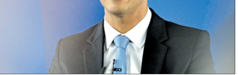
سوناك يستخدم أحر خطابات الإغراء

العملية الانتخابية لحزب المحافظين على سوناك، حيث أطلق حملة الحزب أمس الرابع من يونيو/تموز، إذ يستخدم سوناك وحزب المحافظين عادة « بطاقة الضرائب» التي تخيف حي المال والطبقة الوسطى من صعود حزب العمال إلى الحكم. وسعى سوناك بذلك إلى تشكيل خط فاصل مع المعارضة العمالية وتغيير شعار حزب في الانتخابات العامة قبل الانتخابات العامة التي باتت على الأبواب. ووفق تقرير في وكالة بلومبيرغ، ستكون السياسة الأساسية التي ستبناها المحافظون في حالة فوزهم هي خفض ضريبة رواتب التامين الوطني بمقدار نقطتين مؤبدتين، وهو ما يمثل الإجراء الذي اتخذ وزير