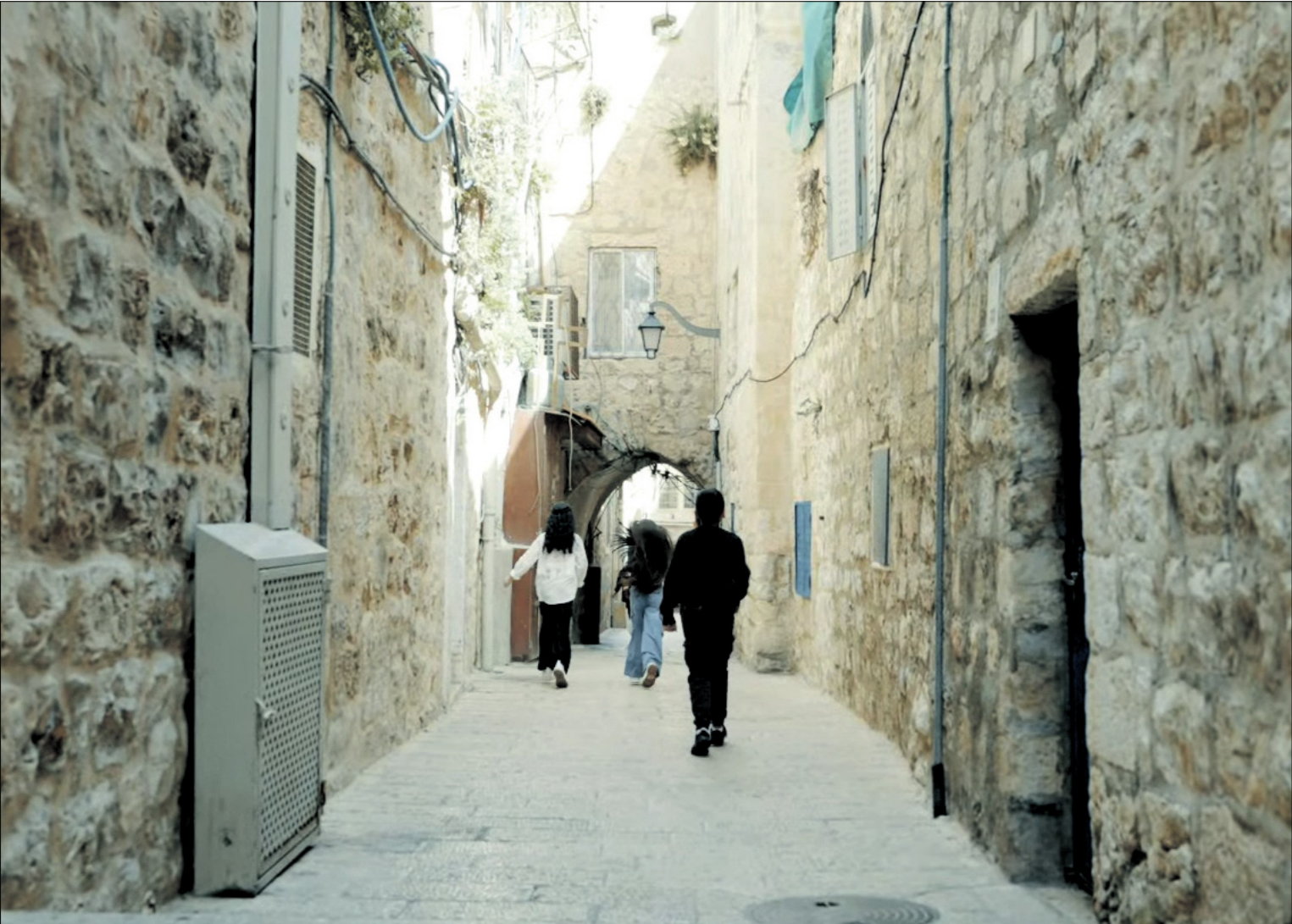
من فيديو كليب الأغنية