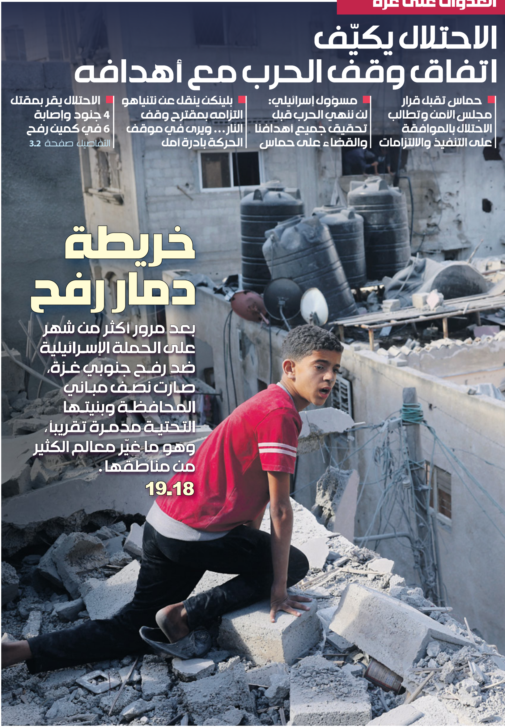
حبي لك السلطان، رفح، 7 مايو 2024