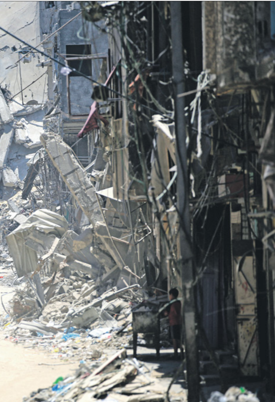
فلسطينيون يسيرون وسط الدمار في خان يونس، أمس (إيد (بال/فرانس برس)

جود اسرائيليون خلك جنازة (مهمهم، بنابر المتاحصين (المر (نص/ Getty) جود اسرائيليون خلك جنازة (مهمهم، بنابر المتاحصين (المر (نص/ Getty)