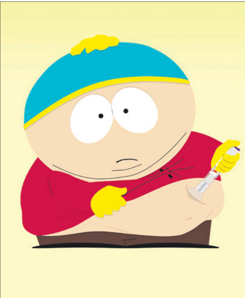
لقطه من مسلسل الكارتون (زو تويوز)

لم يعد مسلسل الكارتون الساثيري «ساوث بارك» (South Park) يبحث على شكل موسم فقط منذ بداية جائحة كوفيد-19، إذ قدّم أيضاً صيغة الحلقات الخاصة، التي تتمثل بحلقة طويلة كل فترة، تناقش مشكلة ما، وتأخذ أشكال السخرية في كل مرة إلى أبعاد جديدة، آخر الحلقات الخاصة تحمل عنوان «نهاية البدانة» (The End of Obesity)، ترسم هذه الحلقة، منذ بدايتها، الألق المتوقع للصحك والانتقاد السياسي، فتناقش أدوية تخفيف الوزن، خصوصاً أوزيمبيك (Ozempic)، الذي تحول من دواء لسكري، إلى دواء لحرق الدهون، انتشر بين المشاهير والناس العاديين على حد سواء بصورة مرعبة، انتشرت إذ استخدم أوزيمبيك ظاهراً تُعرف به «وجه أوزيمبك»، والمضروب بهذا المصطلح غيبت الدهون من الوجه فأة، في حالة مشابهة لـ«كوكايين شيك» (Cocaine Chic)، والمقصود به شكل الجسد الذي ارتبط بعراضات الأرباء اللاتي أدمن الكوكايين، الحلقة تبدأ باختلاف هذا «الدواء» ومحاولات إيريك كارتمان خسارة وزنه الذي لمال كان مغط الحنك لسنوات طويلة، لكنه ليس الصواب بالسكري، والدواء غال، فلا يمكن له علاجاً عليه، والبديل فيديوهات «الرضا عن الذات» وإيجابية شُكّل الجسم»، وهذا بالضبط ما تحاول الحلقة انتقاده، تكشف الحلقة عن إدمان الأمهات على أوزيمبيك، وعوضاً