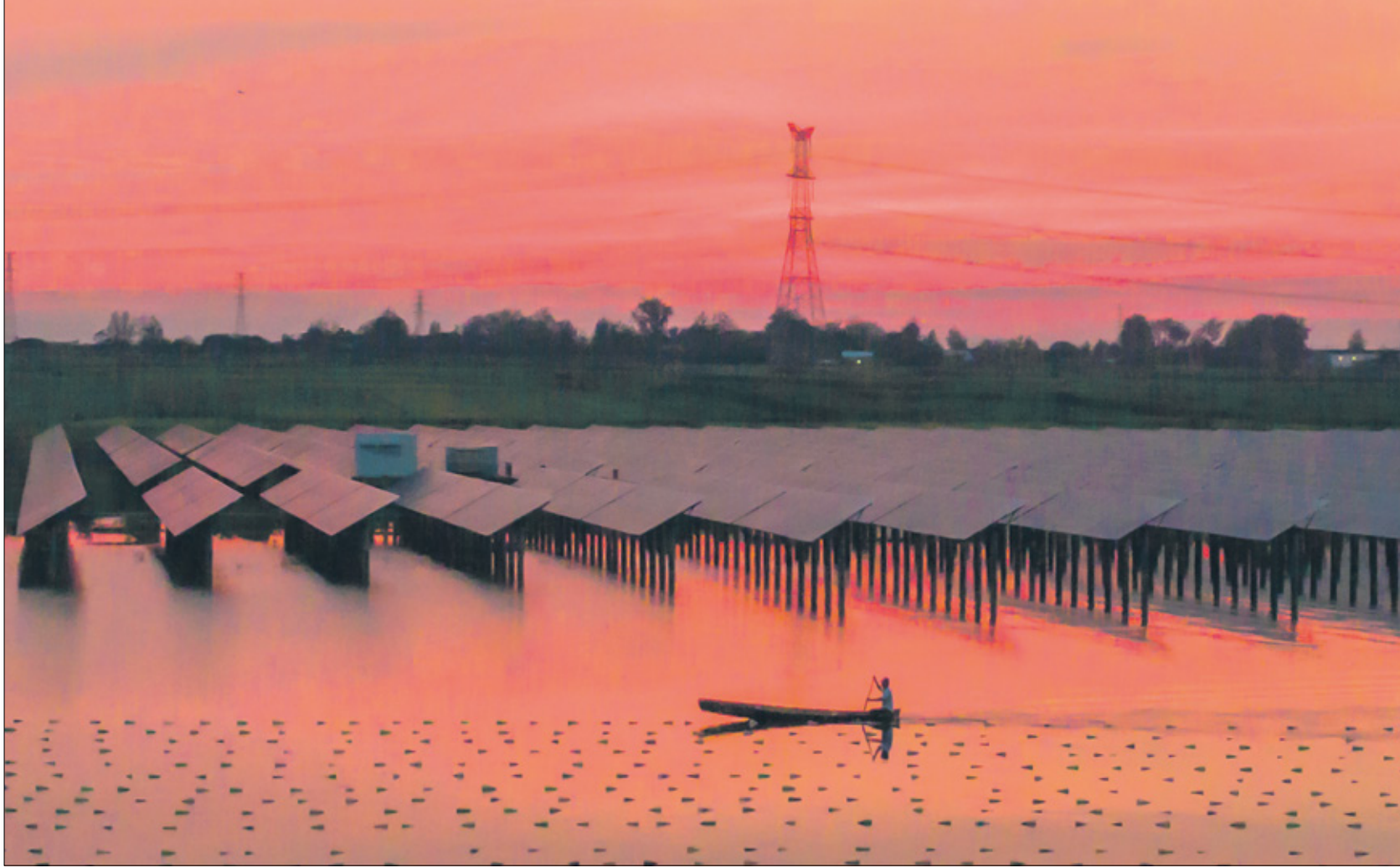
الواح عائمة في بحيرة في الصين

يمكن للألواح الشمسية الكهروضوئية العائمة أن توفر جميع احتياجات الكهرباء لبعض البلدان، وفقاً لدراسة جديدة نُشرت يوم الرابع من يونيو/حزيران في مجلة Nature Water