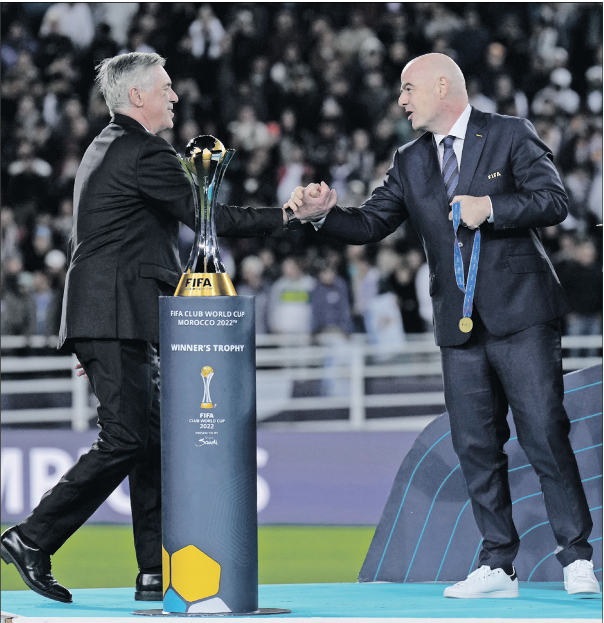
الافتتاحية فقط على أهمية مونديال الأندية الذي الترجي

وكان رفع عدد الأندية المشاركة في كأس العالم للأندية إلى 32 نادياً، الخطوة التي أفاضت الكأس، إذ أرسلت نقابات اللاعبين المحلية والسوية الاتحاد الدولي للعبة «فيفا»، من أجل تخفيفه عن القرار، لما يشكله من أضرار على صحة اللاعبين، وتأثيره في المنافسات المحلية. وقد عارضت بقوة المخوضون عدداً كبيراً من المباريات في كل موسم، ما يعرضهم إلى خطر التعرض لإصابات باستمرار مع الالتزامات المحلية في الدوريات وكذلك مع المنتخبات الوطنية، كما هددت رابطة الدوري الإنكليزي الممتاز