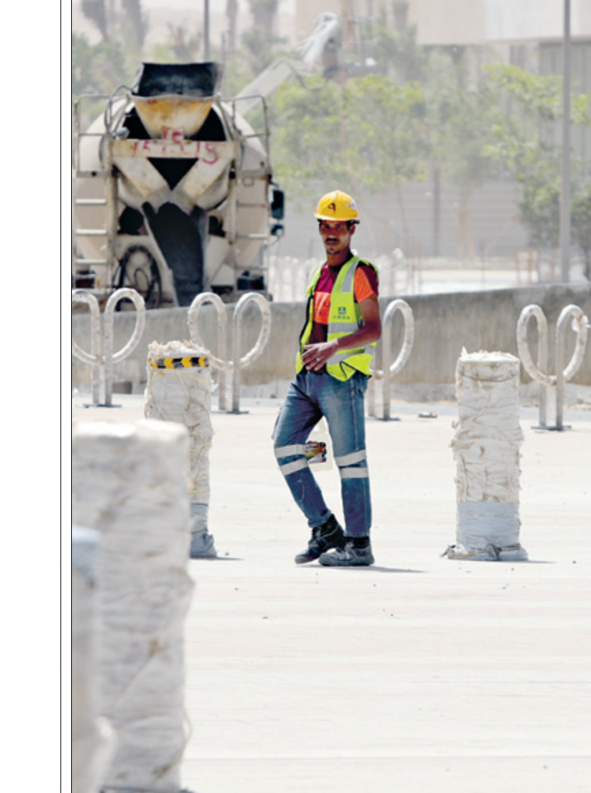
مشق قانون العمل المصري في حارة ودمع عمال المهن الشاقة

لذا يمنع على الأساتذة استخدام أي أجهزة الكترونية، خاصة الهاتف النقال، داخل الديوان الوطني للامتحانات، وهناك كاميرات مراقبة على مدار اليوم، فيما تصل أسئلة الامتحانات إلى مديريات التربية بالولايات قبل موعد الامتحان بثلاثة أيام»، وعلى الرغم من العزلة الطويلة التي يعيشها الأساتذة والموظفون المعنون، يشعرون بالفخر للمشاركة في إعداد أسئلة أهم امتحان تربوي في البلاد.