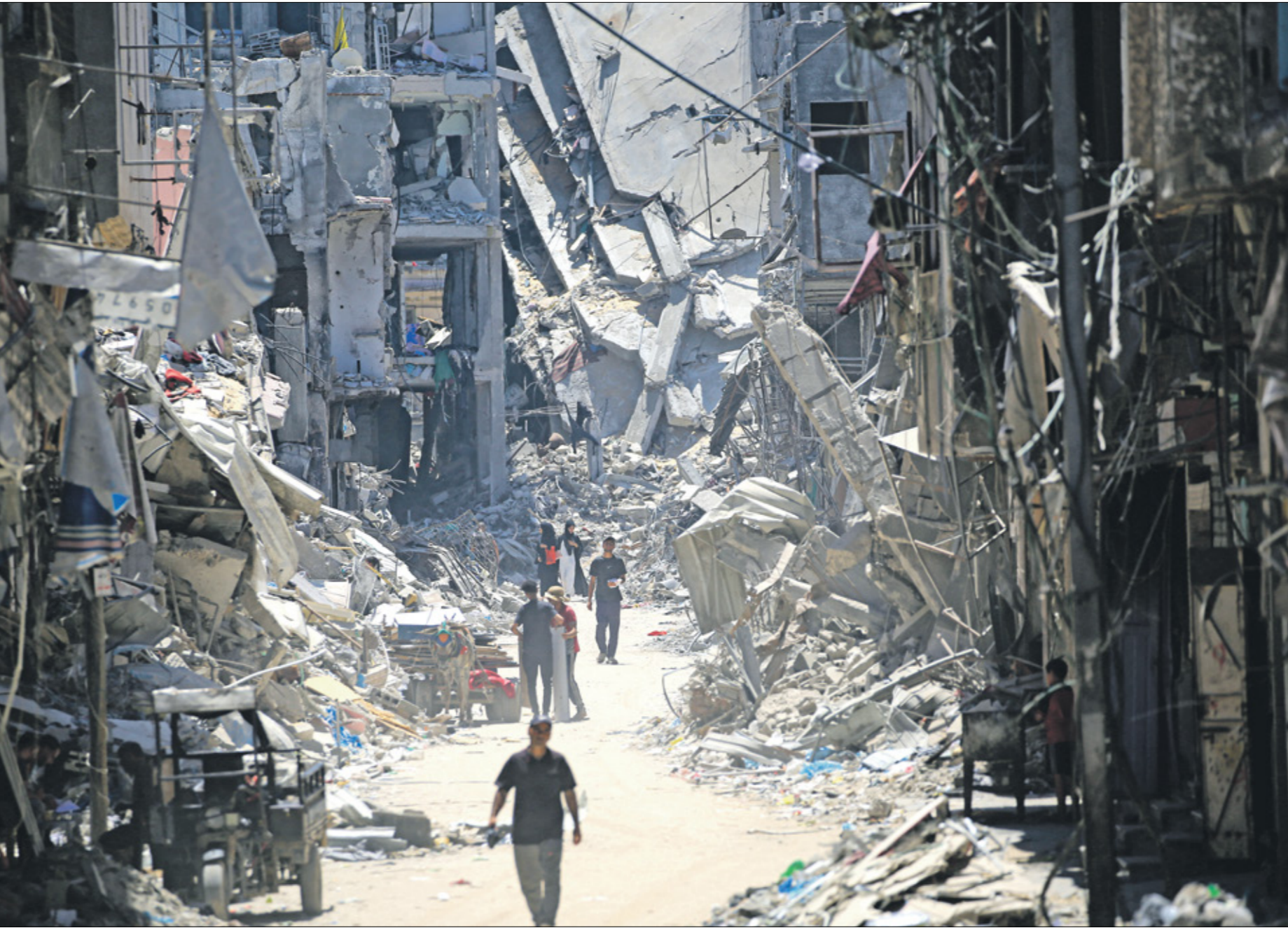
فلسطينيون يسيرون وسط الدمار في خان يونس، أمس (إيد (بال/فرانس برس)

أبرز ما جاء في نص القرار تأكيد «اهمية الجهد الدبلوماسي المستمرة التي تنفذها مصر وقطر والولايات المتحدة بهدف التوصل إلى اتفاق شامل لوقف إطلاق النار على ثلاث مراحل». وخبّ القرار «بإقترح وقف إطلاق النار الجديد الذي أعلن عنه في 13 مايو/ أيار (الماضي، والذي قبلته إسرائيل، ويدعو حماس إلى قبوله أيضاً، ويحث الطرفين على التنفيذ الكامل لشروطه من دون تأخير ومن دون شروط». ولأحق «أن تكون هذه المحادثات» ومن الضروري أن تكون لدينا هذه الخطة». وعُثر عن أمهه أيضاً زالت في غزة، إلى عائلاتهم، وأكد «أنه في التالية موزعة على ثلاث مراحل». والمرحلة الأولى بحسب القرار هي «وقف فوري وكامل لإطلاق النار مع إطلاق سراح الرهائن، بمن فيهم النساء والسجون والجرحي، وإعادة فرات بعض الرهائن الذين قتلوا، وتبادل الأسرى الفلسطينيين». واستحاب القوات الإسرائيلية من المناطق المحاطة بالسكان في غزة، وعودة المدنيين الفلسطينيين إلى منازلهم وأحيانهم في جميع مناطق غزة، بما في ذلك الشمال، فضلاً عن التوزيع الأمن شدد فيه المنموية الأميركية لبندا تواسم ترغيبك على ضرورة أن تقبل «حماس» بالصفقة وإن يقوم الطرفان بتنفيذها. من أبرز ما جاء في نص القرار تأكيد «اهمية