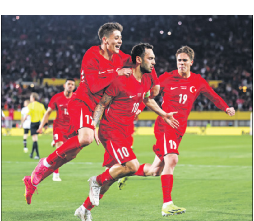
يسهع منتخب تركيا لتهليل بلطف في بطولة يورو 2024

في المقابل، اختار عدد من الألمان من أصل تركي اللعب للمنتخب الألماني، أشهرهم مسعود أوزيل، بطل العالم 2014 الذي تخلى عن جواز سفره التركي عند بلوغه