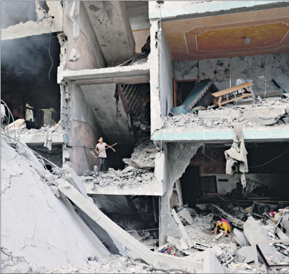
اطفال فلسطينيون في القاص مزلاهم الذي دقرتله الغارات الاسرائيلية على مدينة غزّة. 9 حزيران/ يونيو 2024