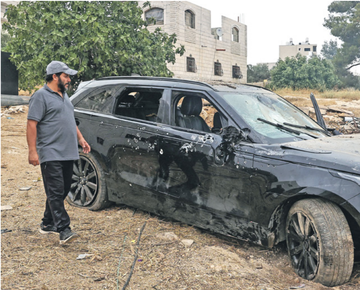
احدث السيارات للثلاث شهداهما الاطلاق في كفر نعمة، أمس

شدة الإضراب الشامل مناحي الحياة في محافظة رام الله والبيرة أمس غداة اغتيال الاحتلال الإسرائيلي أربعة مقاومين في عملية عسكرية في بلدة كفر نعمة، فيما قُلت قوة خاصة ثلاثة فلسطينيين في جنين ليرتفع العدد إلى سبعة شهداء خلال 24 ساعة