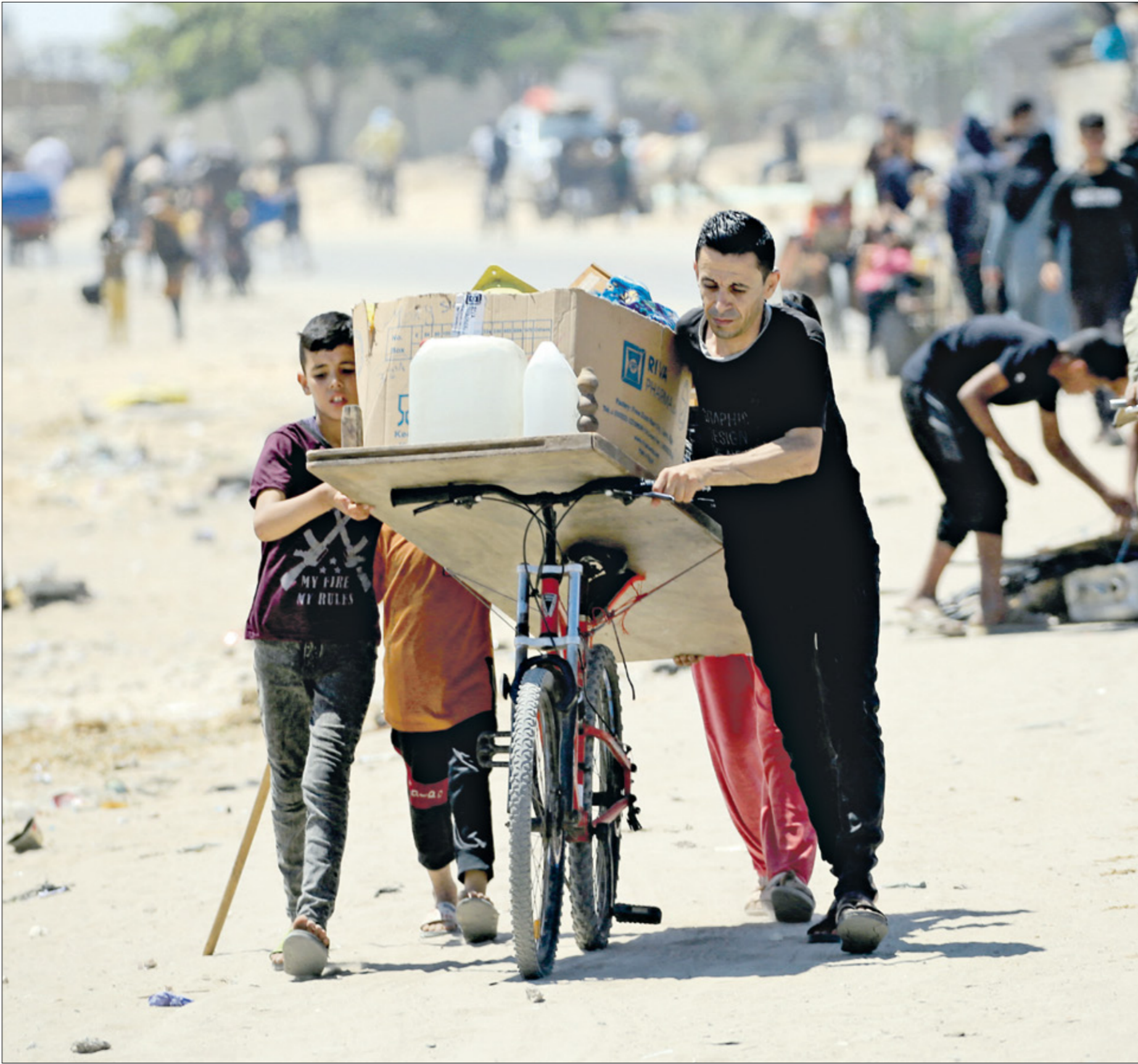
المهجير مسلم من رفح (إد البيا) فرانس برس

عدد الذين بقوا في رفح حتى التاسع من يونيو الجاري، بحسب وكالة غوث وتشغيل اللاجئين الفلسطينيين «ونروا».