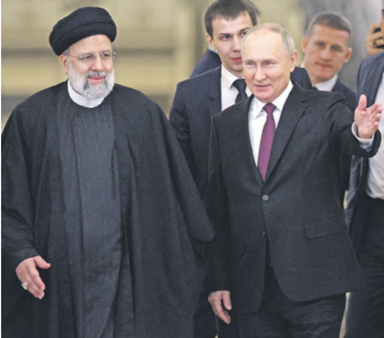
بوتين ورئيس عبد الحميد مشور، 7 ديسمبر 2023