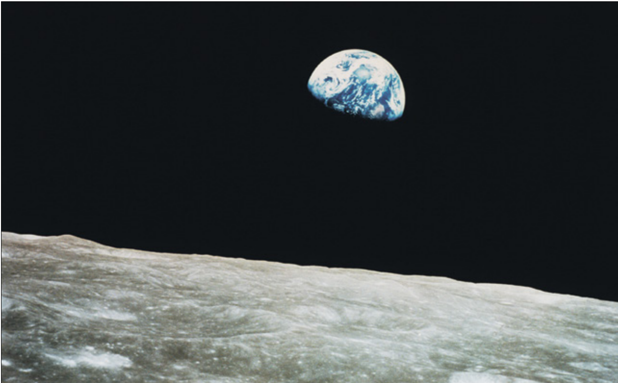
المحاولات السالفة للحفر في صخور الوشاح كانت صعبة

نطاق من درجات الحرارة المختلفة، وربطها بالملاحظات التي يجريها علماء الأحياء الدقيقة لدينا حول كآنواع الأحياء الدقيقة الموجودة في الصخور، والعق الذي توجد فيه الأحياء الدقيقة تحت قاع المحيط». ويقع موقع الحفر بالقرب من حقل المدينة المغقودة.