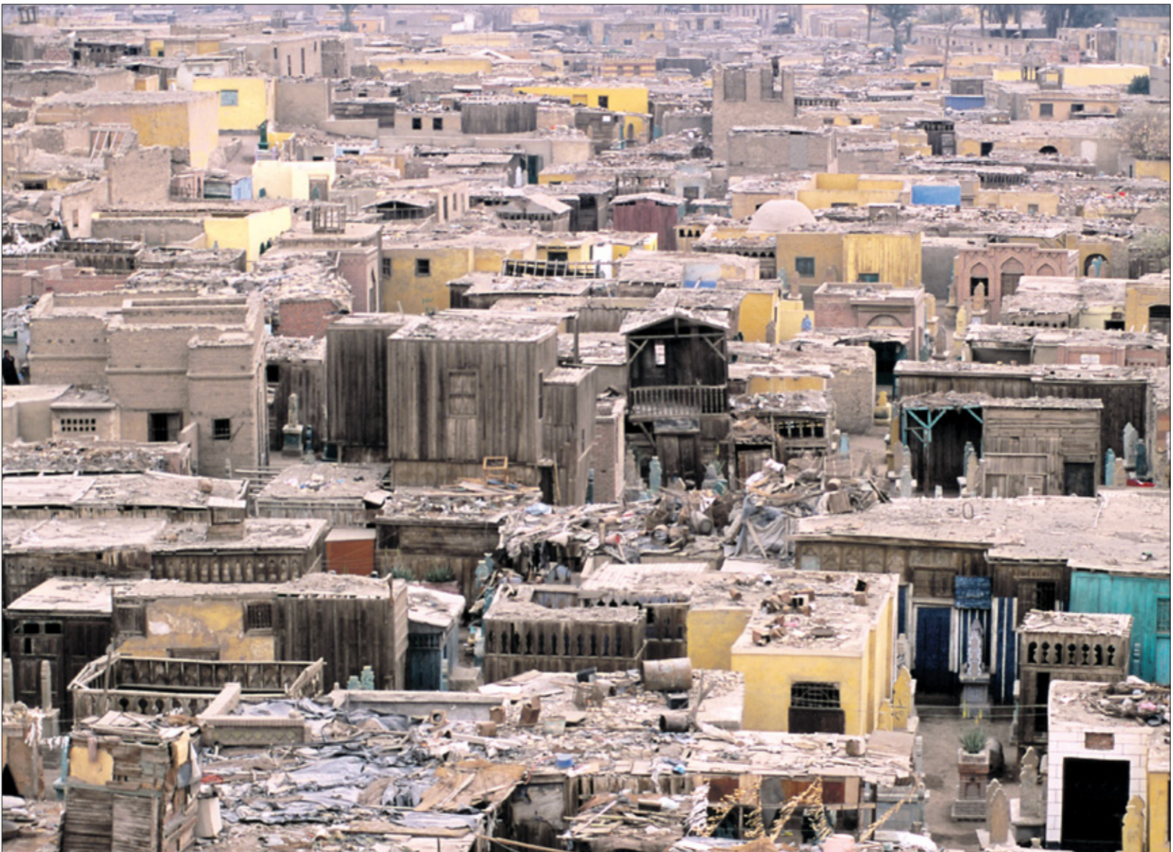
يزيد عمر الجبانة عن ألف عام