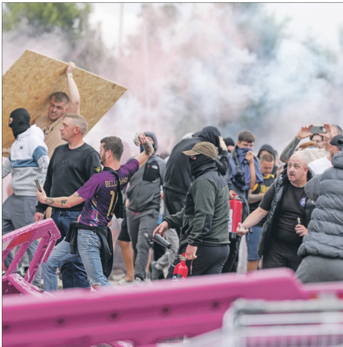
اشتباكات بين الشرطة واليمينيين المتطرفين في روترهام، 4 أغسطس 2024

وما يثير قلقه، من منظور أمني، هو أن وسائل التواصل الاجتماعي تسهل بشكل كبير عمليات تعبئة المجموعات المتطرفة في مختلف أنحاء البلاد، ما يساعدها على تنظيم صفوفها بشكل أكثر فعالية. وفقاً لبحث أجراه معهد الحوار الاستراتيجي (ISD) بالتعاون مع هيئة مراقبة الاتصالات في المملكة المتحدة «أوفكوم»، تمكنت الجماعات اليمينية المتطرفة في بريطانيا من الوصول إلى مئات الآلاف من المستخدمين عبر هذه المنصات. ويبين البحث أن العدوان الإسرائيلي المتواصل على غزة أدى إلى تنشيط العديد من هذه الجماعات وانقسام الآراء داخل البلاد، إذ دعم القوميون المدنيون الاحتلال وروجوا مواقف معادية للإسلام، بينما أبدى القوميون البيض دعمهم حركة حماس في رد فعل مضلل على كراهيتهم اليهود. وتشير بيانات حديثة إلى أن 95% من القاصرين المتهمين بجرائم تتعلق بالإرهاب في المملكة المتحدة مرتبطون بأيدولوجيات يمينية متطرفة.