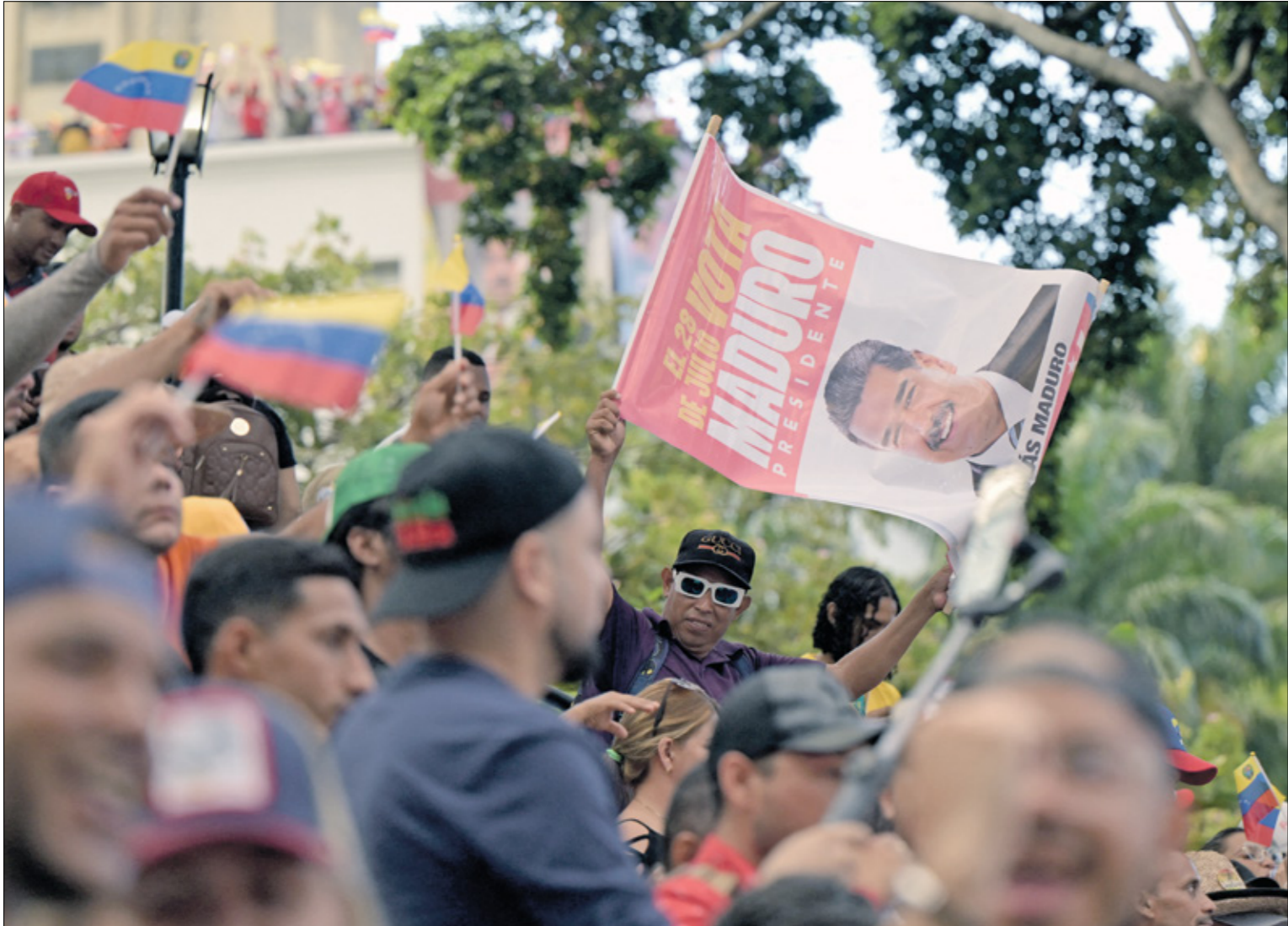
انصار مادورو امام القصر الرئاسي في كاراكاس، 7 أغسطس 2024

في ظل هذه الأجواء ظهر العديد من المصممين الذين تجاوزوا مع التجارزات العلمية والتكنولوجيا وبشكل الوشاح أكثر من قطع الأثا وأدوات المائدة إلى عناصر الديكور المستلهمة من قصص الخيال العلمي. تميزت أغلب هذه التصميمات بأشكالها العضوية واسطحها الأملعة وتجاوزها للتصورات التقليدية في التصميم. وقد زود هؤلاء المصممون مخرجي الأفلام بالآلات الخيالية لأفلام الخيال العلمي.