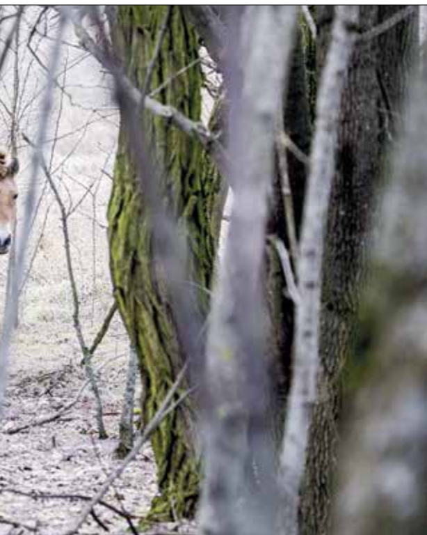
الزهر استخدام هذه الخيول قبل 4200 عام في السهوب الغربية لروسيا (الاصول)

وكان لمشاركة أكثر من مئة عالم من 113 مؤسسة من مختلف أنحاء العالم دور في تحديد حلقة أولى من تسارع تكاثر الخيول قبل 5500 عام في سهوب آسيا الوسطى التي كانت تسكنها مجموعة بوتاني. لكنّ الجينات بنتحت أن هذا الخط القديم من الخيول المحلية انتهى بالانقراض، ولا يعيش رهاضاً إلا في البرية مع حصان برس، يقول عالم الحفريات القديمة والمُشرّف على الدراسة التي نُشرت هذا الأسبوع في مجلة نيتشر لوفوبوك أورلاندو إنّ «البشر لم يكتشفوا الخيول للتسلق أسرع وأبعد»، وكان فريقه قد توصل، باستخدام الأساليب الجينومية عام 2021، إلى أنّ المهة العالمي لهذا التدجين هو في سهوب بوتنيك التي تشكل مساحة شاسعة تمتد شمال سلسلة القوقاز، من البحر الأسود إلى بحر قزوين. وأكدت الدراسة الجديدة هذا الموقع، ومع البيانات الجينومية الخاصة بالخيول الحديثة وعدد أكبر من الخيول القديمة،