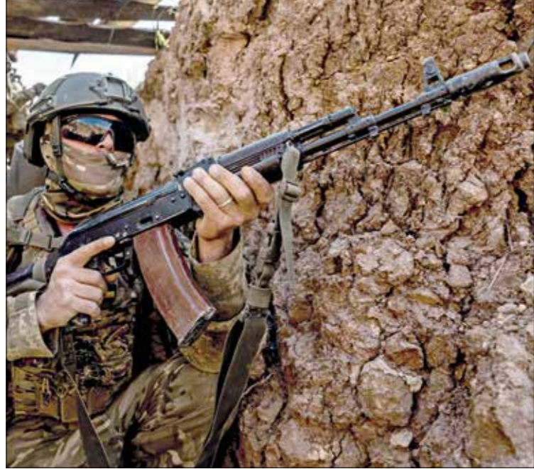
جندي أوكراني خلال تحريات في حوبيسك، أمس الأحد، بحربه كونهن، (الناضوا)