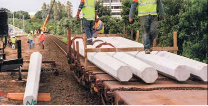
مكاف في موضع التركيب تجهيزات لتصف شبكة الكهراء، بمدينة أوكلاند