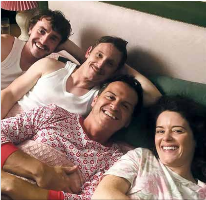
«جميعنا غرباء» دقة وسحر يصلجان فهما عبر بسطة العنكبوت المحبّات

الكثرة موجودة منذ اندلاع أحداث «الريف»، واعصامات عمال الفوسفات واعتقالهم عام 2008. حينها، أي قبل 2010، كان التصوير ممنوعاً لكنّ البعض صوّر الأحداث خلسةً بهواتف جوالية. لم تكن جودتها عاليةً وصورها نقيّة. كنت لذي تجارب في سينما «اندرغراوند» التي أنتجتها أيضاً. في سينما هذه الأحداث في إطار السينما الاحترازية، فبقية الأفلام تظهر لاحقاً واستمررت حتى حين استطيع تصوير الفيلم الذي أضع عليه. قامت الثورة، وبدا مخرجون عديدون تصوير