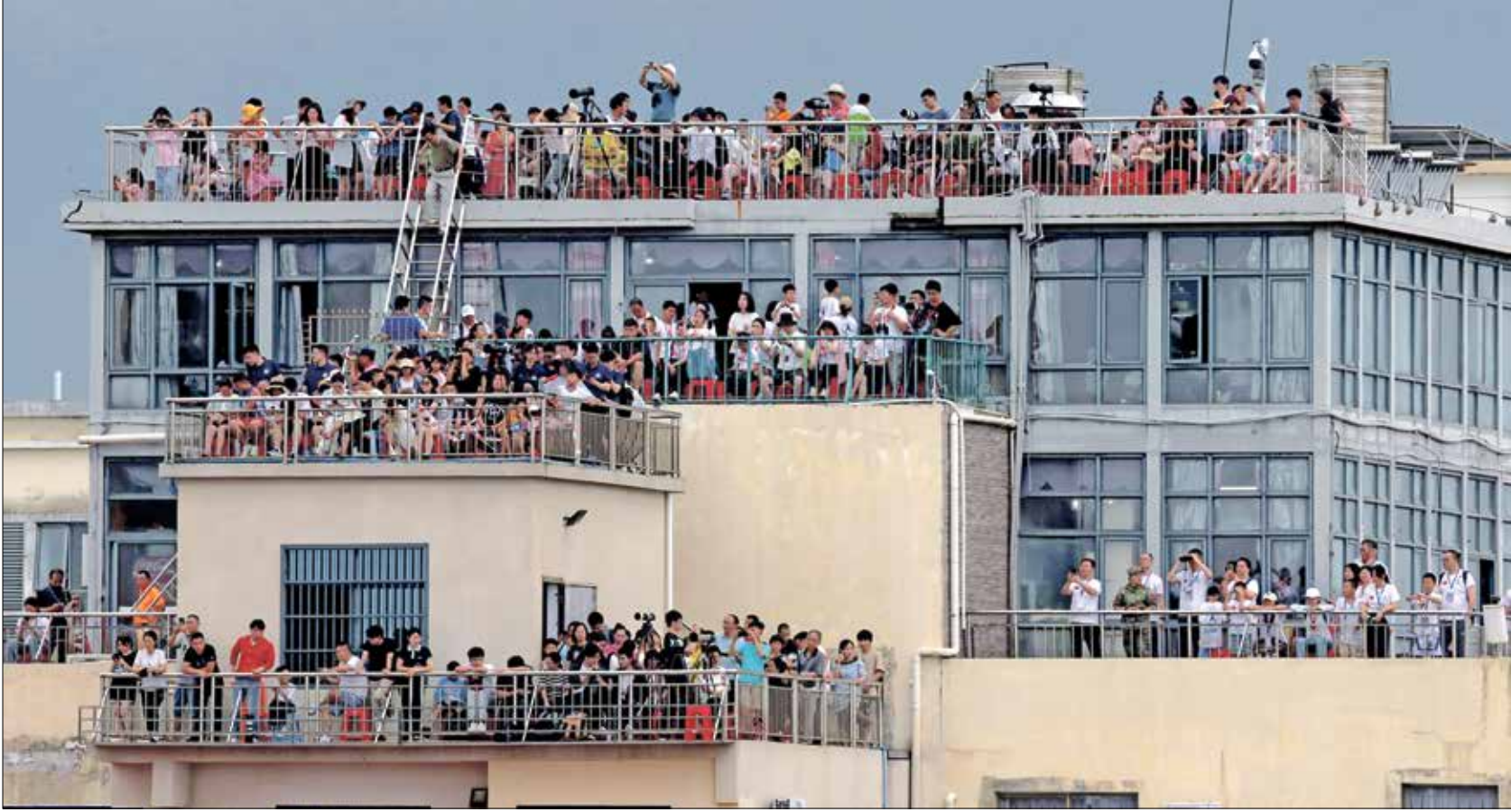
سائحون يرددون اصطاف المسبار الصيني الذي جمع عينات من الجانب البعيد للقمر

يشكل القطاع الفضائي الخاص محوراً جديداً للتنافس بين الصين والولايات المتحدة، علماً أن كلاهما تتهم الأخرى بالرغبة في إخفاء أهداف عسكرية وراء تطوير هذا المجال