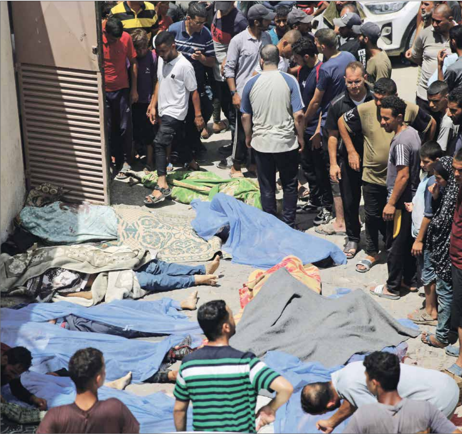
عشرات الشهداء في مجزرة مخيم النصيرات

عدد ضحايا المجزرة الإسرائيلية في مخيم النصيرات إضافة إلى وقوع أكثر من 400 مصاب.