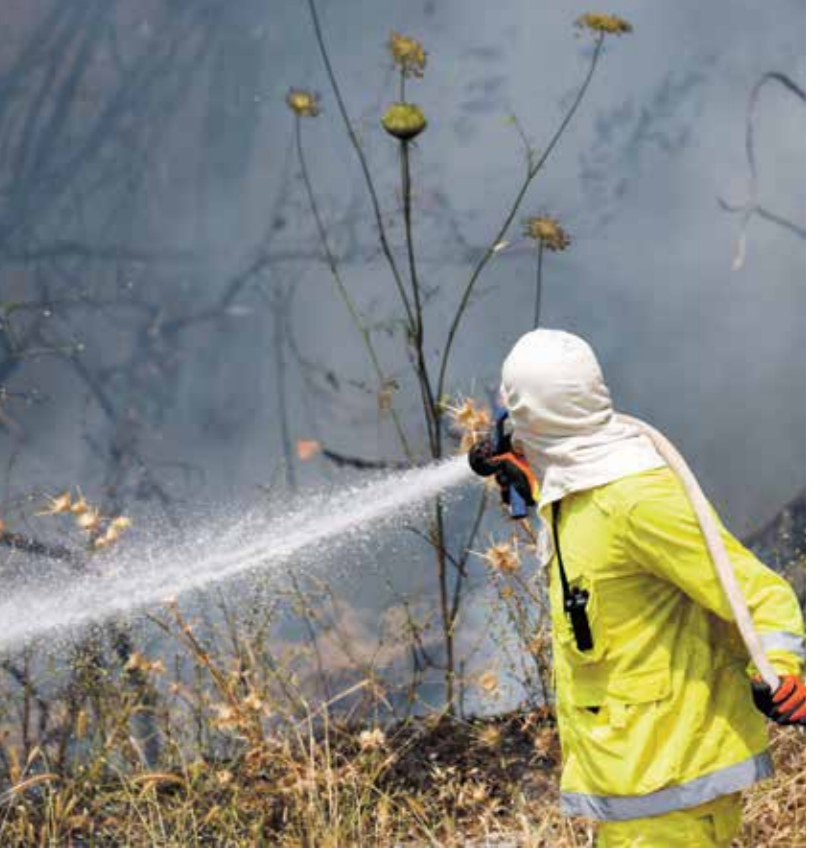
إسرائيلي يحاول إطفاء حريق اندلع بعد هجوم لحزب الله في الجولان، امين اجراء حريق

الدخيل، نينوى لسمع الله العلي ملف اللروح الصربي (الجدد)