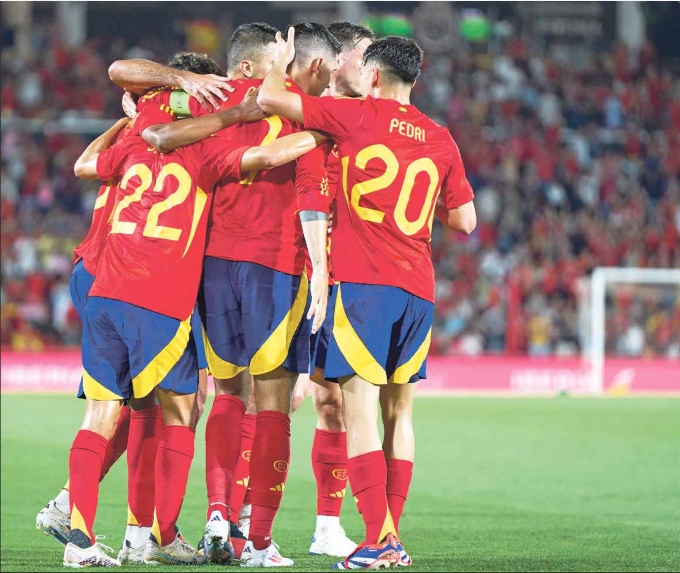
حصد منتخب إسبانيا لقب البطولة الأوروبية من ثلاث منافسات

تحصل مباريات المنتخب الإسباني على اهتمام شعبي كبير في البلاد، إذ إن معظم المشجعين لا يكتفون بمتابعة المباريات المحلية في كأس العالم أو البورو عبر الشاشات الصغيرة في المنازل، بل يخرجون إلى الشوارع لمتابعة اللقاءات، مما يصنع أجواء جماهيرية كبيرة في الشوارع، وترفع