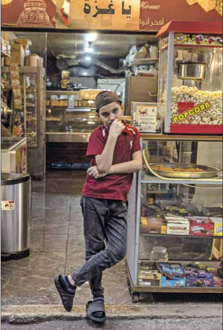
نشطاء المقاطعة كالمخيمات الفلسطينية في لبنان