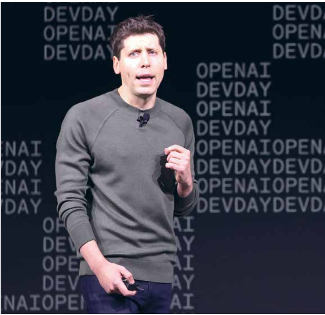
الرئيس التنفيذي لـ«أوبن إيه أي» سام ألتمان (اليمين) خلال «ديف داي»

استقالة اثنين من كبار موظفي «أوبن إيه أي» الشهر الماضي، احتجاجاً على توجه الشركة نحو إطلاق «منتجات برائة» على حساب ثقافة السلامة التي يفرض أن تحافظ عليها، كما أن الشركة لا تزال تتعافى من محاولة الانقلاب داخلها العام الماضي، تابين دعوى قضائية ضد شركتي أوبن إيه أي ومايكروسوفت. وقالت تاقطة باسم صحيفة نيويورك تايمز حينها: «كما ورد في الشكوى، فإن مايكروسوفت وأوبن إيه أي استخدمتا علناً لتطوير وتسويق منتجاتهما للذكاء الاصطناعي من دون أخذ إذن»، وأضافت: «يعتمد الذكاء الاصطناعي التوليدي الخاص بالشركتين المهتمّين على نماذج تعليمية ضخمة أنشئت عن طريق نسخ واستخدام الملايين من مقالات صحيفة نيويورك تايمز المحمية بحقوق الطبع والنشر»، وأشارت إلى أن