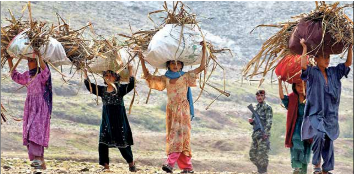
الوضاع مزرية في منطقة البالك النكستانية