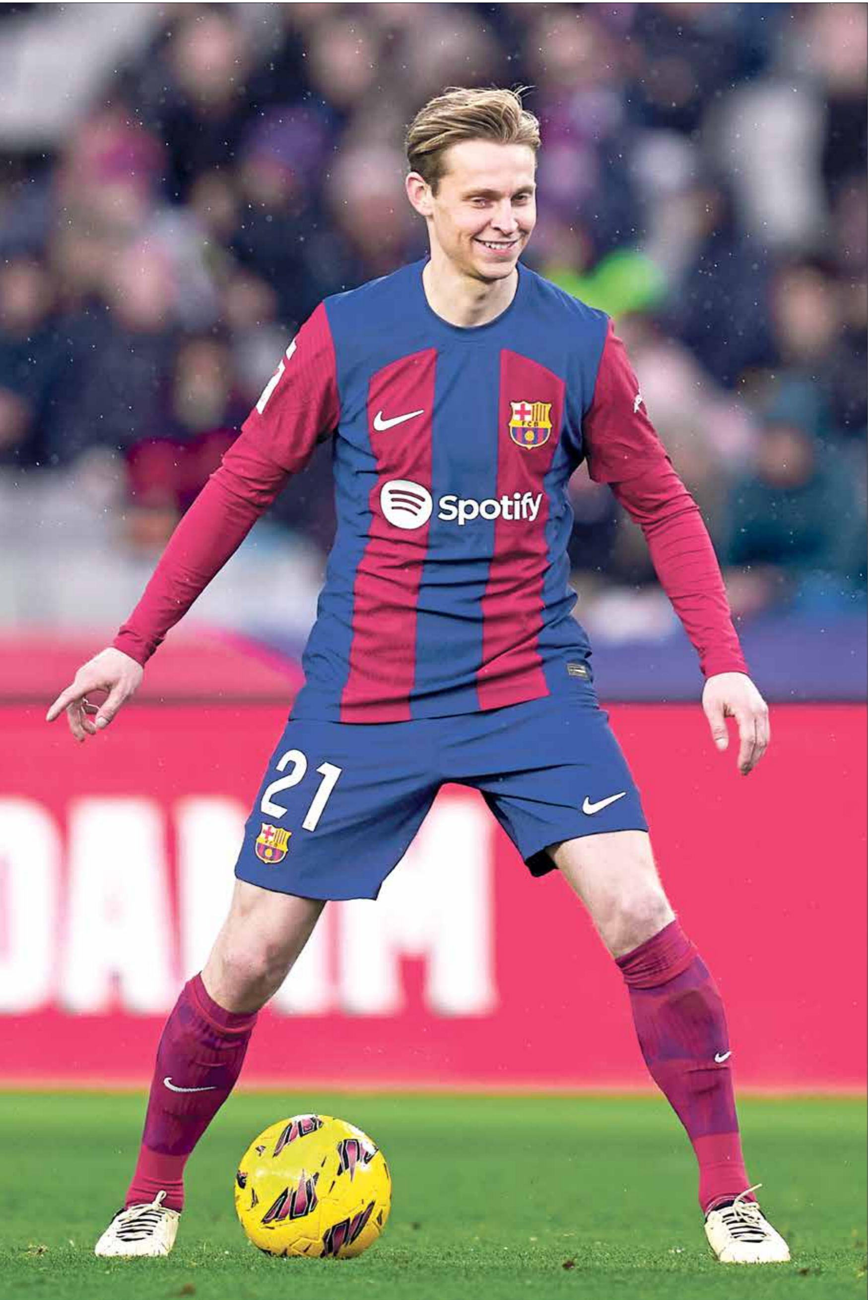
تُعتبر فرينكي ديب يونغ من أبرز نجوم نادي برشلونه الإسباني