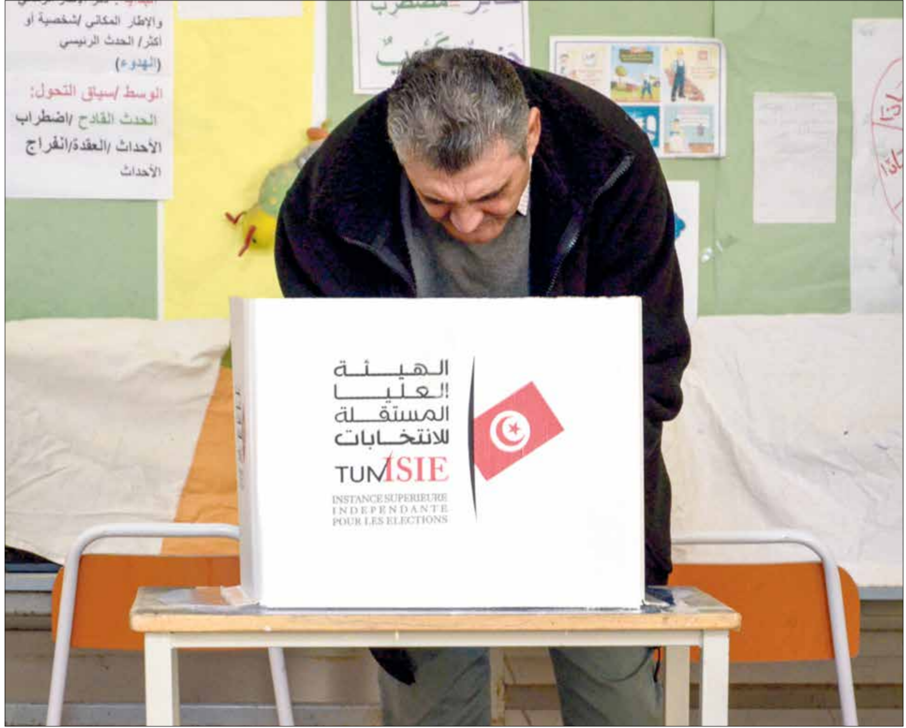
خلال الدورة الثامنة من الانتخابات المحلية، بنزت، فبراير 2024

ويلفت الفريضي إلى أن الهيئة تتحدّث اليوم عن إضافة شروط في عملية التزكيات للانتخابات الرئاسية التونسية «في حين