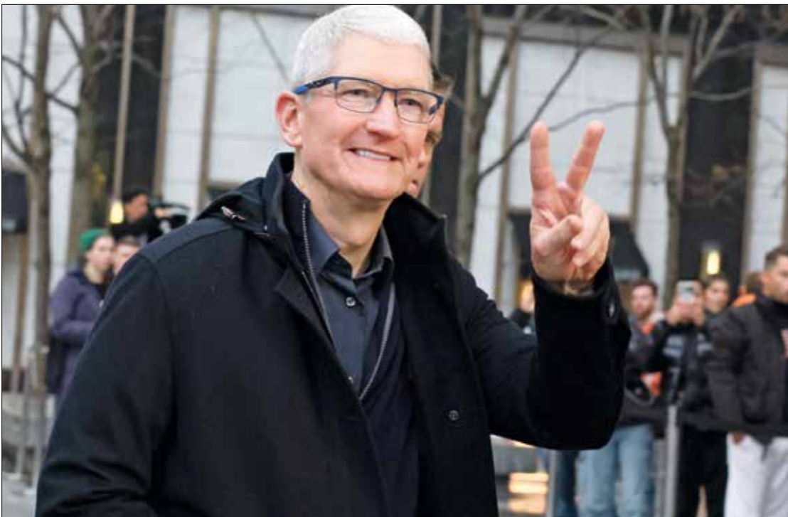
الرئيس التنفيذي لشركة أبل تيم كوك (اليمين) مع «أبل ديف داي»

على أسئلة تُطرح باللغة الشائعة. وتشير كارولينا ميلانيس، من شركة كرييفت استراتيجيم، إلى أنّ هذه التحسينات والهزات الجديدة يُفرض أن تساعد في تعزيز رغبة الزبائن بمنتجات «أبل»، وخصوصاً أجهزة «أيفون» وتوكّد أنّ الهدف من إطلاق هذه الخدمات التي استبدلت الحياة لنموها.