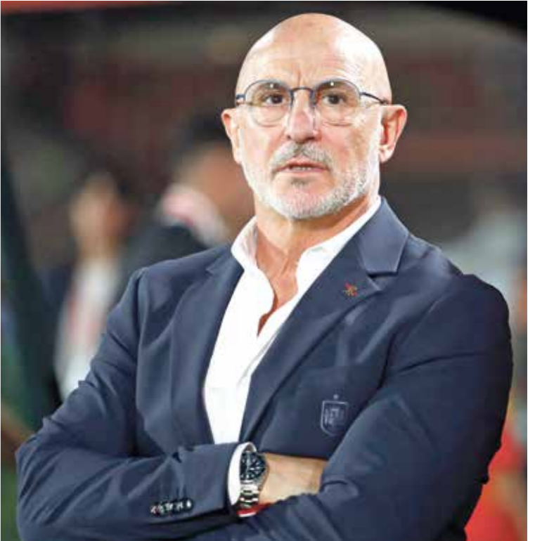
يستعد المدرب لويس دل دي لا فويلتا للتلوّف هجوميا (تخسيس ريال)Getty)

بعد أن كان المنتخب الإسباني يتشكل من أبرز نجوم ريال مدريد وبرشلونة لسنوات طويلة، وتجاحه الكبير بتحقيق الألقاب بين سنوات