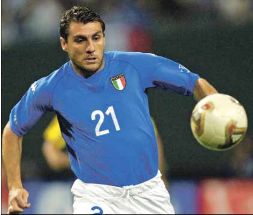
فيبيري حاك كأس العالم 2002 مع البات بمباراة امام الكوادور (تصاحب فيير فرانس روس)

ولّد فيبيري في إيطاليا عام 1973. كان والده لاعب كرة قدم محترفاً أيضاً، ومع ذلك، أدى الانتقال إلى استراليا في السبعينات إلى تغيير نظرة المحكرة للحياة، وكان مثاله الأعلى الآن بورد، قائد المنتخب الاسترالي في الكريكت، وبعد عودته إلى بلاده إيطاليا، قرر اختيار كرة القدم، من بوابة فريق أ سي سانتا لوسيا، لاحقاً دافع عن اللون العديد من الأندية الكبيرة في عالم كرة القدم، منها تورينو وإتالانتا، ويوفنتوس ولاتسيو، وميلان وإنتر، وكذلك موناكو الفرنسي، وأتلانتو مدريد الإسباني، وهو الذي كان مهاجماً متكامل وقويًا من الناحية البدنية، إلا أنه كان يفتقر إلى القدرة الفنية والمروعة، لكنه عمل حتى صقل موهبته وبت وات واحداً من أفضل مهاجمي جيله.