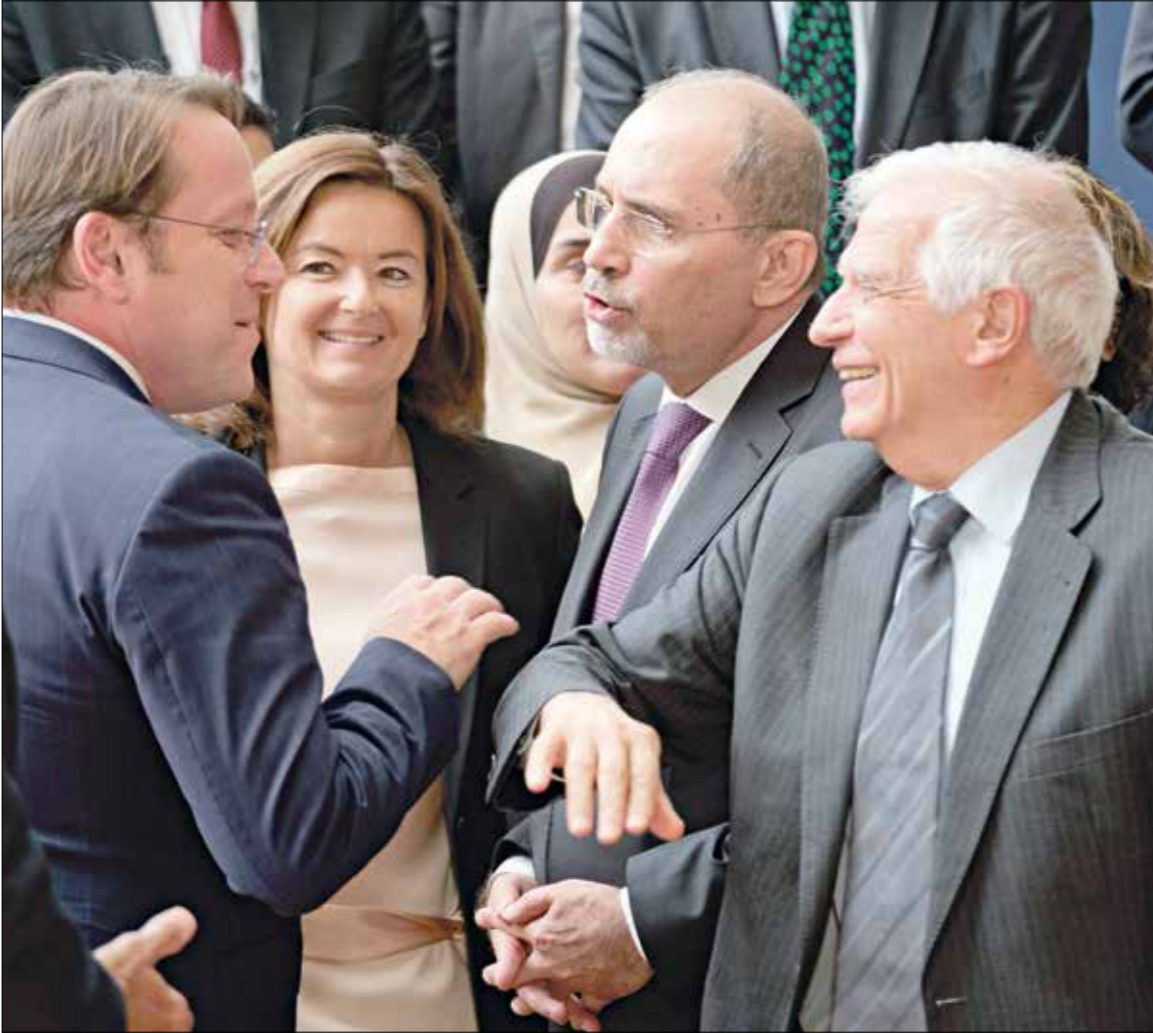
جوليب يورك، ليمينا، وبارت الصديقي، مع مؤتمر بروكسل، الة لدعم مشيئة سورية، والمطلشف،. 2024 /5 /27

استدماة التقسام بين «السوريات»، ومن «شريعة» قوى الأمر الواقع، قاصدين الفصل بين السياسي والجوّ، وهم لا يستهدفونه مُؤتمراتهم، والأقتصادي، وهو ما يعملون لأجله، يشارك مع الدول الداعمة عشرات المنظمات الدولية، والإنشافي الوطني، ومئات الناشطين المدنيين، وهذا جهد كبير، ولكنّه لا جدوى وضائع، بينما كان يجب