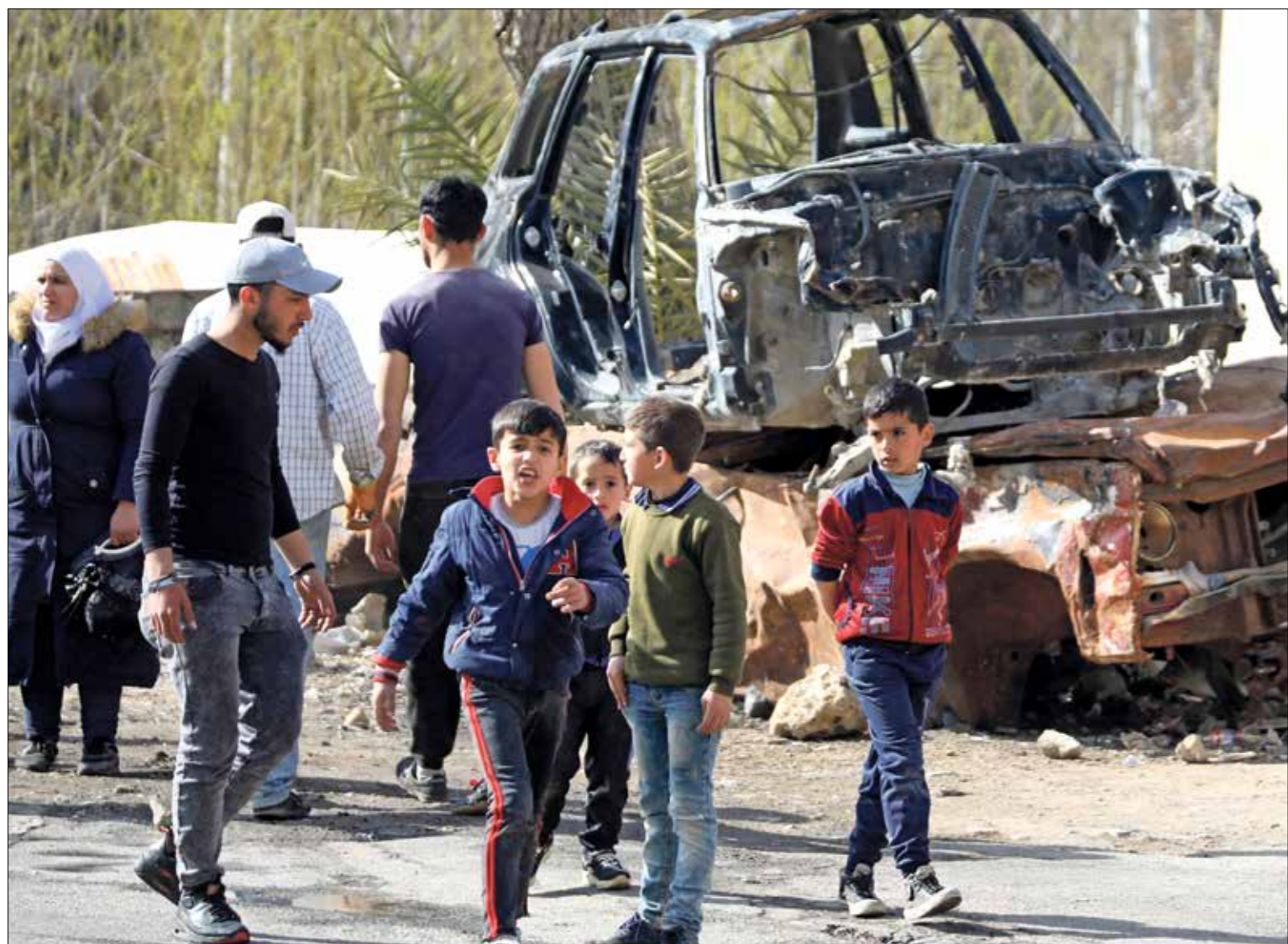
من كوايس مع وحدة وصف التصوير مسلكت التغطية، أريج بشارة، مراهب بربرا

في مختلف أنحاء العالم، حتى ظهور محرك الاحتراق في القرن التاسع عشر. يقول أورلاندو: «ممكناً أنّ نخشل انداك نوماً عن سياق التسلح الذي اجتاحت هذه الظاهرة» في كل أنحاء أوراسيا. سياق أوروا قبل 5000 عام.