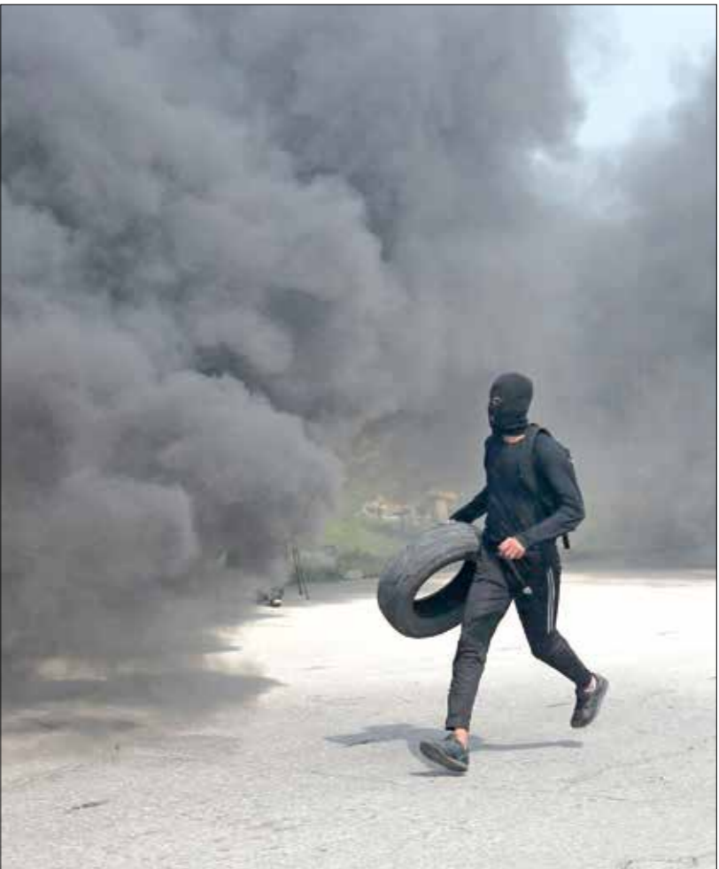
من أبنائك بين طالب جامعة بيرزيت وفوهات الاحتلال، مارس 2019