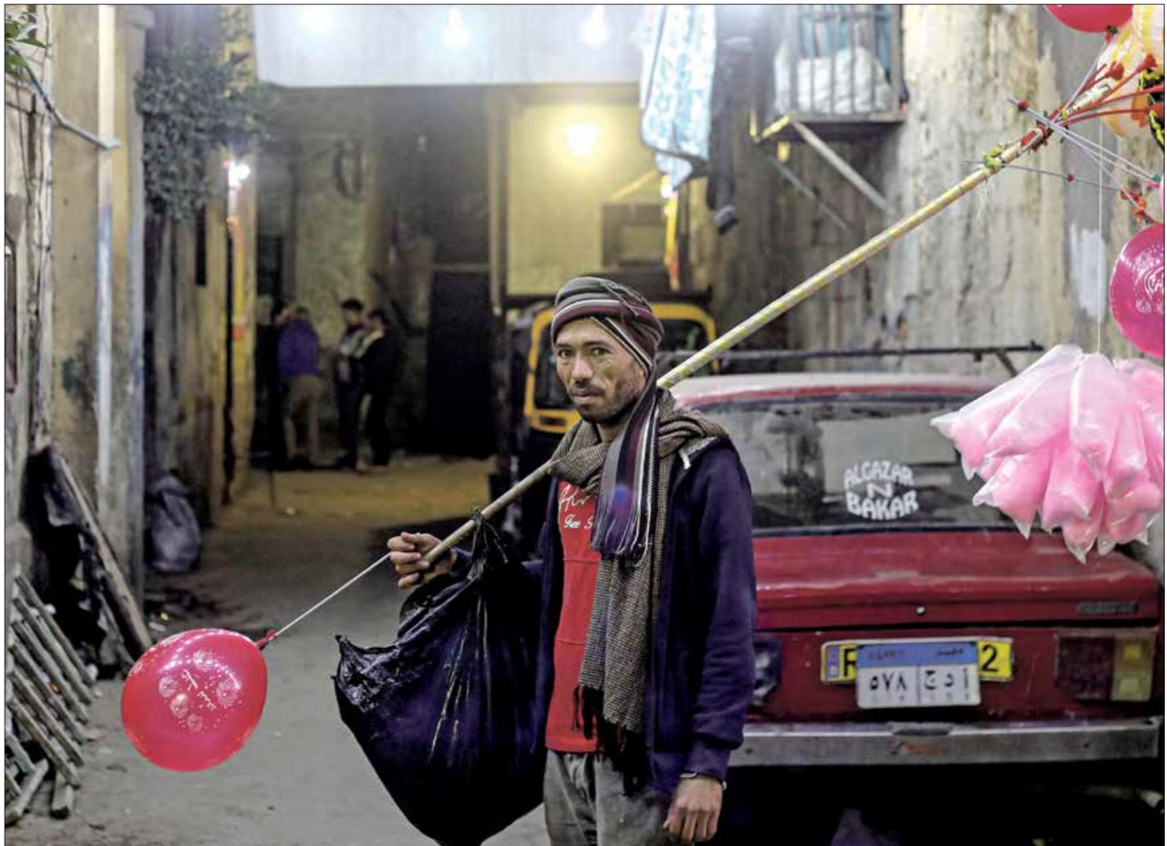
يلتقط الفنانة عن لونهاهم بينما الشارع المصري يعانى اقتصاديا

حاول بعض البرامج تقليد الشكل الخارجي للبودكاست، ولكنها وقعت في أزمة البرامج التلفزيونية نفسها لأنها عرضت على المتفرّج من الأساس، مثل تجربة بودكاست «بيج تايم»، وهربت هذه الخنازير من مآزق المحتويات المضحكة إلى فخ الترويج للخرافات والأفكار المحلّلة، بسبب الإصرار على استضافة غير المتخصصين والإعاء الجديدة، مثل ظاهرة حديث الفنانين عن الأمراض النفسية من دون دراسة، إذ تسبّب ترويج مزيد من المعلومات الخاطئة عن الصحة النفسية، وهي الموجة التي بدأت مع بودكاست رائد الأعمال الإماراتي أنس بوحش، في الحديث مع المشاهير عن طفولتهم وصعوبات حياتهم الشخصية. وتطورت الظاهرة بإصرار بعضهم على اختلاق قصص المعاناة من أجل الظهور في هذه النوعية من البرامج، أو من أجل تقديم صورة ذهنية مختلفة للجمهور عن أنفسهم، والحديث غير العلمي عن الأمراض النفسية كانها «موضة» أو مجرد نصائح حياتية، مثل ما قاله أحمد السقا في البودكاست نفسه عن علاجه للاكتئاب بالصفع على الوجه أمام المرآة»، وقد تصل أحياناً إلى الترويج للخرافات مثل حديث شيرين عبد الوهاب في بودكاست «بيج تايم» عن تعرضها لأعمال السحر والحسد، ما سبّب لها أزمات نفسية.