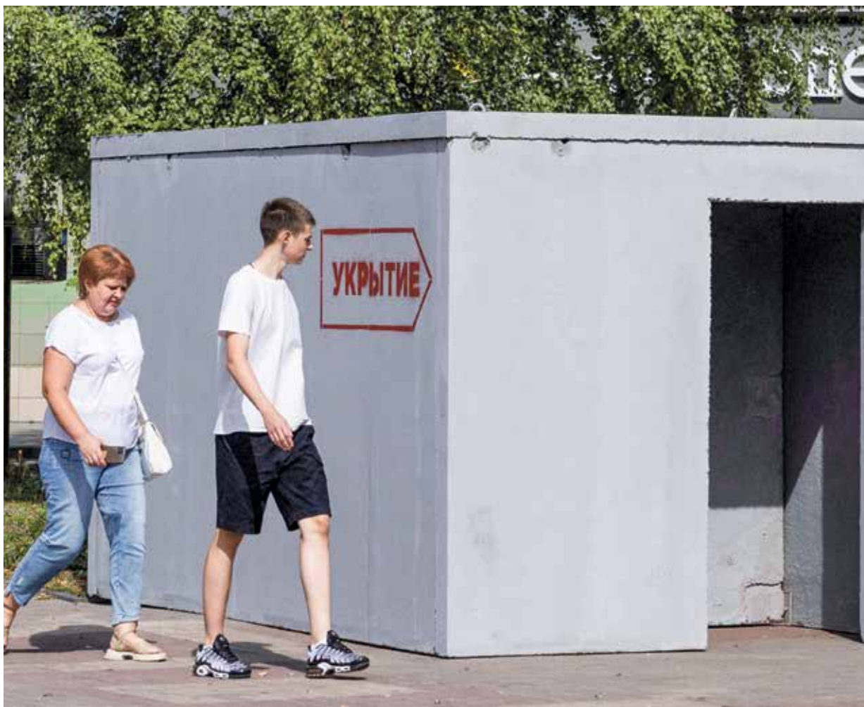
ملجأ في كورسك، 28 أغسطس 2024