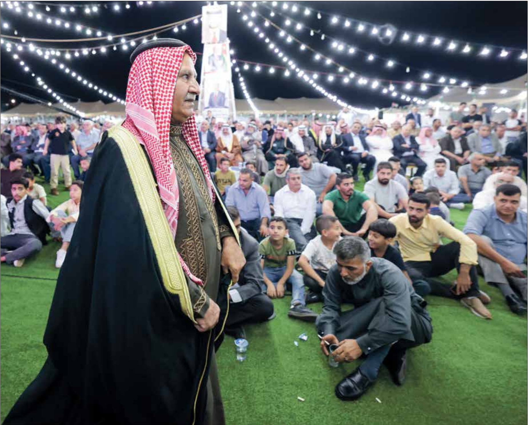
تجمع انتخابي في بلدة عيرا، 3 سبتمبر 2024

وأضاف: نحن على معرفة بأن الانتخاب على أساس عشائري وليس برامجي يخدم الشارع العام، لكن ولعدم وجود برامج واضحة، وما نراه فقط شعاعات اعتدنا عليها للنتيجة واحدة، لذا استأنخت لرفضها القريبين. وأشار إلى أن العديد من الأصقاء والأقارب لديهم نفس التوجه، وعدد منهم ليس لديه رغبة بالخروج من منزله والانخراط بعملية الاقتراع بقولهم (نحن بغنى عنها)، واعتادهم هذا اليوم عطلة للموظفين للراحة بنصف الأسبوع من ضغط العمل». وأشارت نتائج استطلاع مركز نماء للاستشارات الاستراتيجية الذي أعلن عنه أخيراً إلى أنه من المحتمل وصول نسبة الإقبال على الانتخابات الأردنية إلى 38,82%، أي حوالي 1,7 مليون ناخب