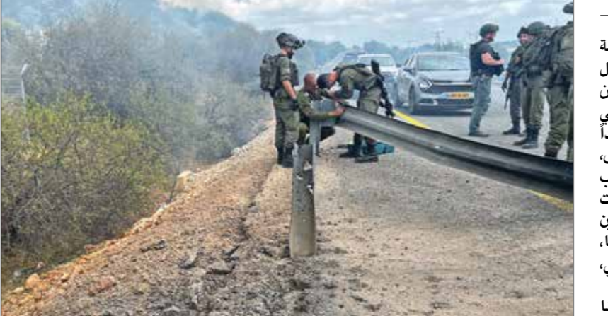
جند اسرائيليون على الحدود مع لبنان، 4 سبتمبر الحالي

تصاعد التوترات في المنطقة وتوسع الصراع بشكل أكبر، وفي هذا السياق قال رئيس جهاز المخابرات الخارجية البريطانية ريتشارد مور إنه يعتقد أن إيران لا تزال تعتمد النار لأعتبال رئيس المكتب السياسي لـ«محاس» إسماعيل هنية في طهران أواخر يوليو/تموز الماضي، وعندما سُئل مور، خلال فعالية صحفية فاينانشال تايمز أمس، عما إذا كانت إيران ستهدف سفننا لكن لاحقاً تبّين أن الكيان الصهيوني وراءها». وأضاف أن الاحتلال الإسرائيلي طلب وقف الهجمات على سفنه بعدما استهدفت سفينته الخامسة، لافتاً إلى أن القوات الإيرانية استهدفت 12 سفينة إيرانية وأخرى والبحر الأبيض المتوسط لمنع إيران من تصدير نفطها، مشيراً إلى أنه «في البداية لم تكن نعلم هوية الجهة التي