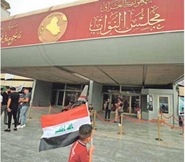
تظاهرة امام البرلمان العراقي، بغداد، أغسطس 2022