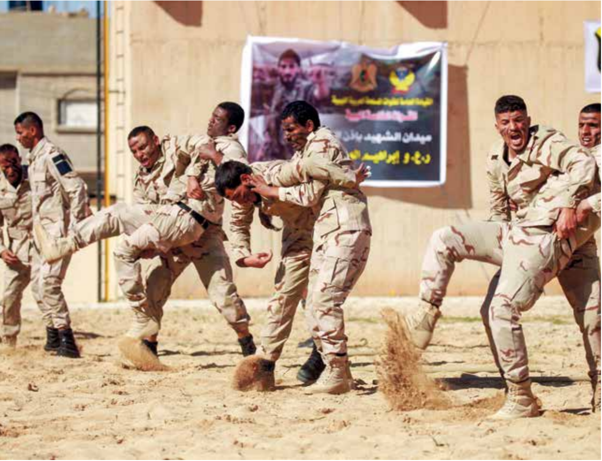
عناصر في مليشيات حفتر في بنغازي، 20 يناير 2022

رأى محللون أن تعزيز معسكر اللواء الليبي المتقاعد خليفة حفتر تحركاته في أقصى الجنوب الليبي أخيراً يأتي في إطار أوامر روسية للسيطرة على المنطقة الحدودية مع النيجر، والتي تمثل بوابة لنقل قواتها ومعداتها إلى دول المنطقة الأفريقي. علماً أن الهدف المعلن من جانب حفتر هو إعمار الجنوب، إلا أن الأخير المستشار السابق للقائد الأعلى للجيش عامل عبد الكافي، أكد أن الحدث الأهم في أنشطة حفتر في ليبيا هو تحركاته العسكرية الخفيفة أخيراً لتعزيز سيطرته على مناطق الجنوب، مشيراً إلى أن هذه التحركات جاءت في ثلاثة اتجاهات رئيسية، وحدد عبد الكافي في