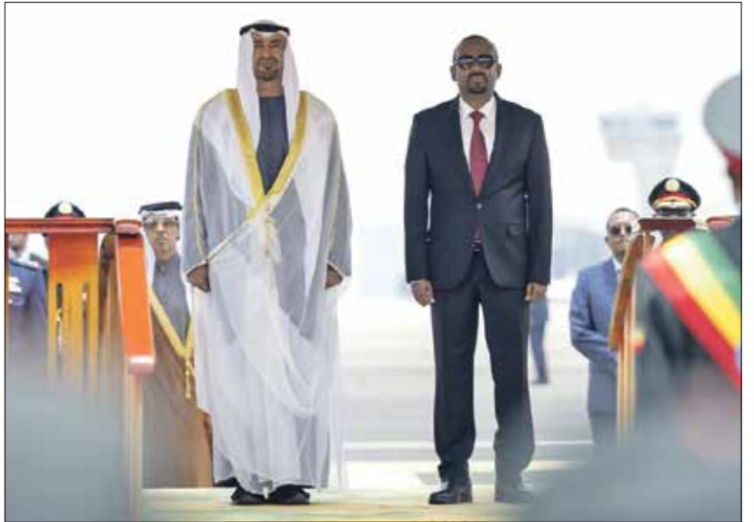
إبي احمد ومحمد بن عبد في اديس ابابا، 18 أغسطس 2023

حلقة جديدة من حلقات مسلسل التنافس الإقليمي والدولي الواسع في منطقة القرن الأفريقي تمثلت في زيارة وزيرة الدفاع الإثيوبية عائشة محمد موسى، الخميس من الجانب الأخرى، إلى الإمارات، ولقائها وزير الدولة الإماراتي لشؤون الدفاع محمد بن مبارك المناعي، في مختلف العلاقات المتطورة العسكرية والدفاعي بين البلدين، يأتي ذلك بعد أيام قليلة من تسليم مساعدات عسكرية للصومال، في 28 أغسطس/ آب الماضي، هي الأولى منذ أكثر من أربعة