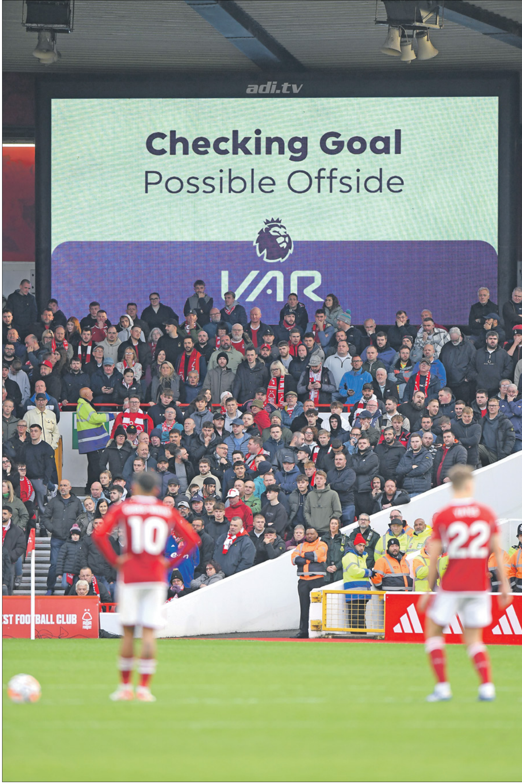
ستكون تقنية الفيديو حاضرة في الدوري الإنجليزي خلال الموسم القادم

صوتت اندية الدوري الإنجليزي الممتاز لكرة القدم (البريميرليغ)، لصالح استمرار العمل بتقنية حكم الفيديو المساعد (VAR)، في الموسم المقبل، وذلك خلال اجتماع خاص مع اندية الدوري. وتم تنفيذ التصويت، الذي جاءت نتيجته بإجمالي 19 صوتاً لصالح التقنية وصوت وحيد ضدها، بناءً على مبادرة من نادي وولفرهامبتون ووندرز، وهو الصوت الوحيد الذي رفض استمرارها والذي انتقد تقنية الفيديو بسبب أخطائها وعدم حياديتها وزيادة وقت المباريات.