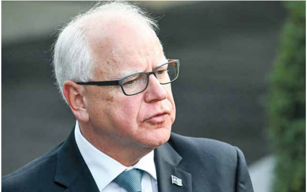
تيم والر في واشنطن، 3 يوليو الماضي

والرئيس ليس معروفًا شخصياً على نطاق الناخبين الأميركيين، لكنه يشتهر في ولايته بسنة قويتين «قديمة»، بما في ذلك الحماية الشاملة لحقوق الإهباض والمساعدات الصحية للأسر، وفي سيرته، أنه محارب قديم في قوات الحرس الوطني، ومدرب كرة قدم، وهو أول مرشح للمنصب منذ