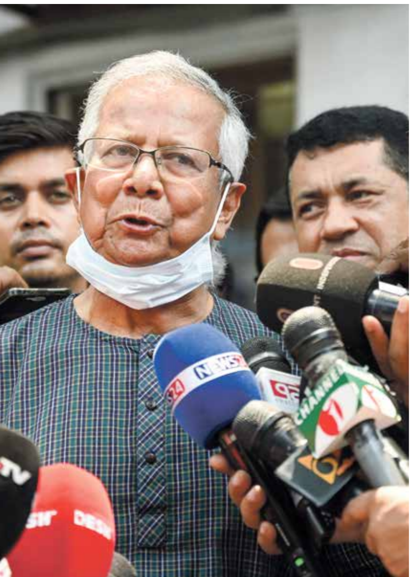
محمد يونس في دكا، البريك 2024

أعلنت نقابة الشرطة الرئاسية في بنغلادش، أمس الثلاثاء، أن عناصرها سيزامون اضرابا، عذاة سيطرة الجيش على البلاد. وأضافت النقابة عن بيان صادر عن «جمعية الشرطة بنغلادش»، التي تتلحق بالشرطة الوطنية، أنه «إنّ يونس ضمان سلامة كل من الشرطة، لعنت الاضراب».