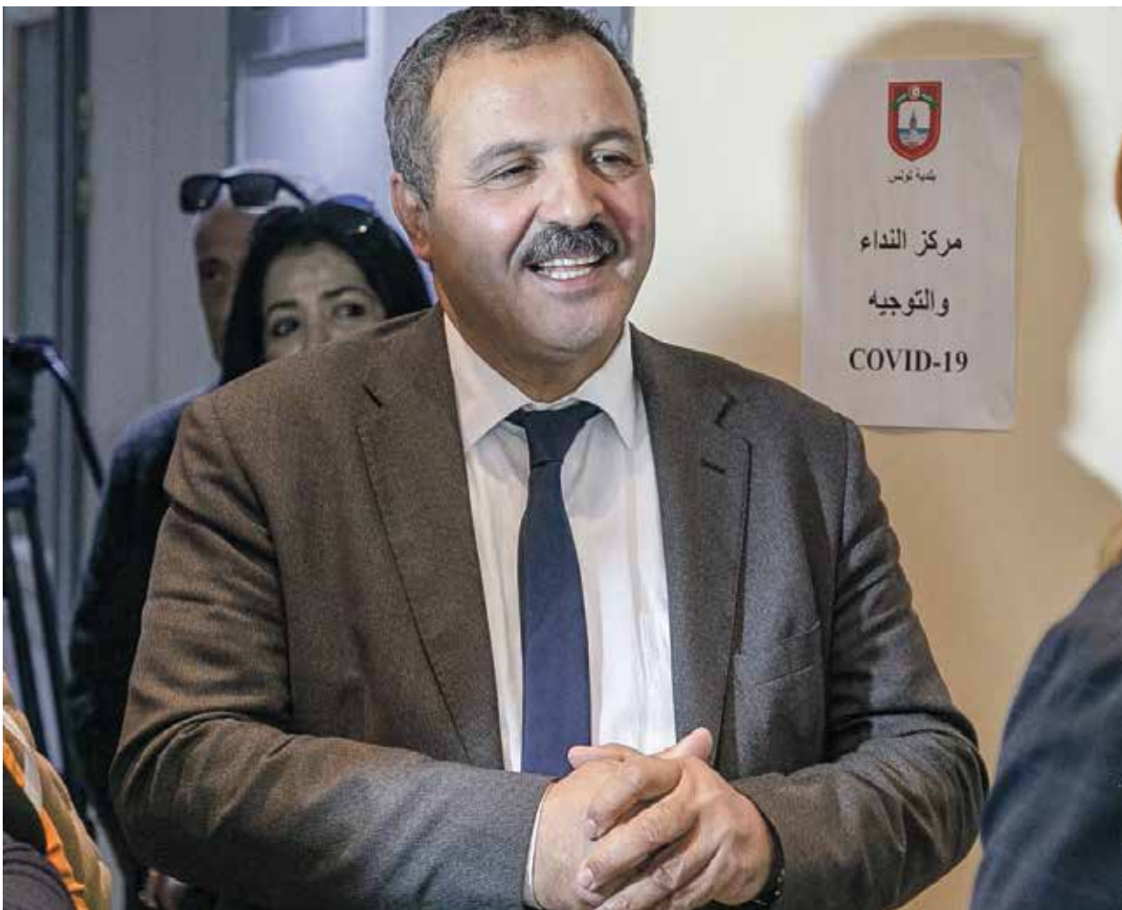
عبد اللطيف المكي في العاصمة التونسية، إبريل 2020

وصلت إليها إدارة الرئيس قيس سعيد لمنع من الترشح للانتخابات التونسية رغم استيفاء كل الشروط القانونية والمدنية التي ضبظها الدستور. ولم يواجه الزنايدي وحده إشكاليات في الحصول على البطاقة عدد 3، إذ فوجئ المرشح من وراء العزبان، الأمين العام السابق للتيار الديمقراطي غازي الشواشي برفض منحه البطاقة عدد 3 ووثيقة التزكيات إلى الانتخابات التونسية إلى جانب المرشح كمال العكروت. وقال المحامي نافع العربي، في تصريح له «العربي الجديد»، إن «هناك أحكاماً جزائية صادرة عن المحاكم، وهي وظيفة قضائية لكن الأحكام قاسية»، وأوضح أن «المنع من الترشح مدى الحياة لا يمكن