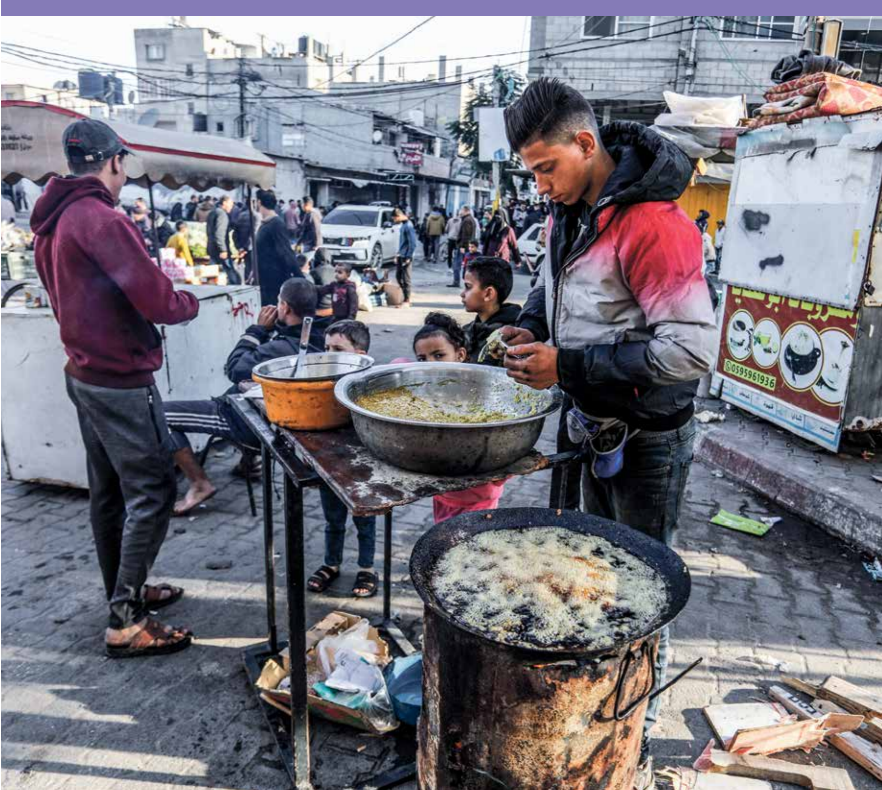
سوق في مدينة رجب يوم 8 يناير 2024 (بعد الهجوم الخطيف)