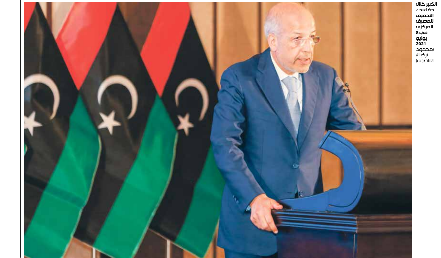
الكبير خلال خطابه للندف للمصرف المركزي يوم 2021 يونيو

وقال بيان للبعثة الأممية إنها استضافت في مقرها بطرابلس محادثات