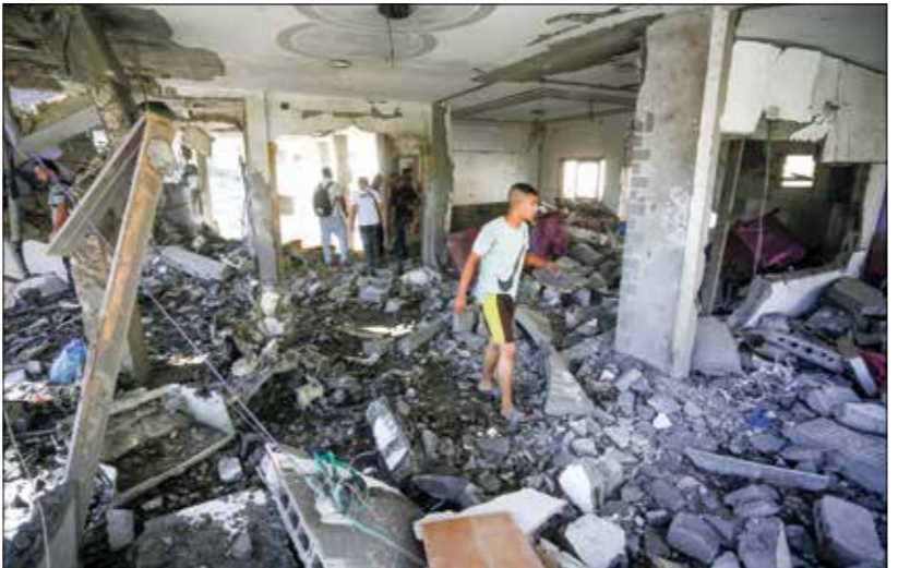
الاحتلال يواصل التحجير العائل لقرى 3 سبتمبر 2024 (فرانز هرون/ أفرانس برس)

وهو «كي أي بي KLP»، استثماراته من 16 شركة مسيبت علاقاتها بالاستوطنات الإسرائيلية في الضفة الغربية المحتلة. وقال مع سحب الاستثمارات والأموال منه ومن الشركات الداعة للإحتلال، وجاءت آخر هتاك خطر غير مقبول يتحمل في مساهمة بوضع الضغوط من الترويج ولمرة الثانية في أقل من يومين. فبعدما أعلن الصندوق السيادي النرويجي، أكبر صندوق سيادي في العالم، الإبقاء، أنه يبحث سحب استثماراته من إسرائيل، أعلن صندوق نرويجي آخر تبلغ أصوله حوالي 95 مليار دولار إقدامه على خطوة مماثلة. ووفق تقرير من اتحاد النقابات العمالية العالمي، «يوني» أمس الخميس، فقد سحب أكبر صندوق معاشات تقاعدية وياتي الاستعداد