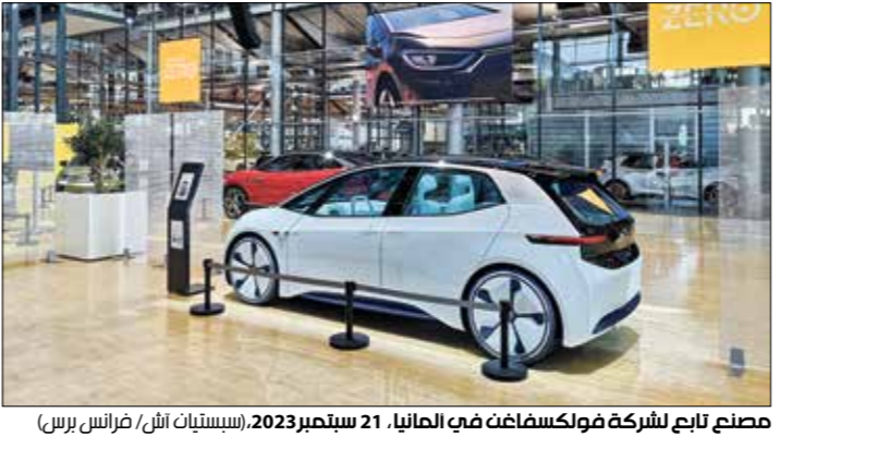
مصنع تابع لشركة فولكسفاغ في ألمانيا. 21 سبتمبر2023.