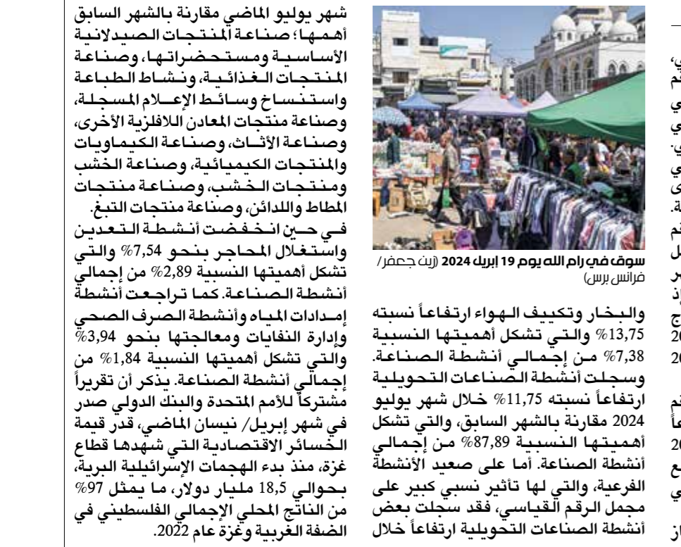
سوق في رام الله يوم 19 ابريل 2024

وبلغت قصار إلى أن «تحركات الكثير طيلة فترة قيادته للمصرف كان يتوخى فيها الخيل للسياسات الأميركية التي شعر بأنها تزيد قوة وحضورا في الملف الليبي على خلفية قلقها من التوغل الروسي، بل واعتبر أن القرارين الخاصين برفع الضريبة على بيع النقد الأجنبي كان الأميركيون يفتقون في ظلها، فالقرار الأول الذي وصل بالضريبة إلى ما يقارب الخمسة دنانير، بحسب رأي قصار، كان قبيل توحيد السلطة عام 2021 يدفع أميركي لكي تغطي الحكومة الموازنة وقتها ديونها التي كانت في شكل سلف من المصارف التجارية». والقرار الثاني الذي زاد الضريبة بنسبة 27%، حسب رأي قصار، كان من المقرر أن يغطي مصروفات حكومة مجلس النواب الكبيرة التي كانت تغطيها من العملة الورورة في المطابع الروسية قبل الذهاب إلى توحيد الحكومتين الحاليتين، فيما منتهى قصار إلى أن الكثير كان يحنق بالخطة الأميركية طيلة المدة الطويلة الماضية، يرى أن محاولات المجلس الرئاسي الأخير لإحصائه في مواجهة محاولة مجلس النواب دعمه للبقاء «لا تزال عاجضة ومجهولة المصير إن لم يتنازل عن موقف الأميركي، وباعتقادي أن بعض الموقف الأميركي، وإنشطن لن تتخلي عنه بسهولة»، ويتفق رأي المصرفي الليبي المتقاعد، المحي كريم، مع رأي قصار بشأن تمسك أطراف خارجية بمقائه في منصبه، لكنه في ذات الوقت يرى أن الأطراف الخارجية، حتى وإن كان يرى رأسها واشطن، لا خيار لها سوى إدارة