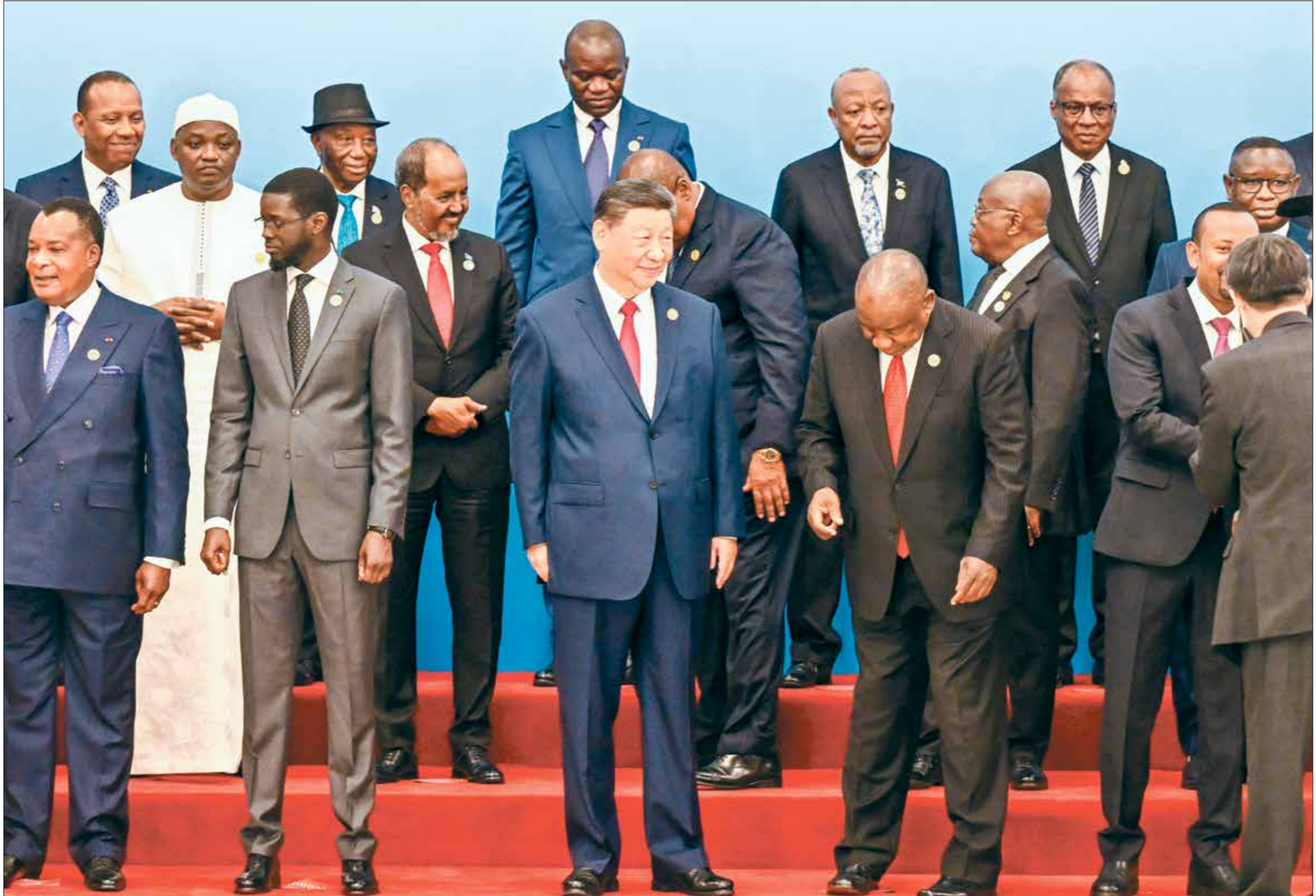
الرئيس الصيني شي مع الزعماء الأفارقة أمس الخميس

إلى سوق لمنتجاتها الصناعية، بينما تعمل أميركا على الهيمنة السياسية عبر إدارة النزاعات القبلية والإثنية واستخدام محالها مثل إسرائيل وبعض المبتنيات في تحقيق الهيمنة وهذا ما جعل بكين تتكسب أفريقيا على حساب واشنطن والدول الأوروبية. على الصعيد التجاري، تعد الصين الآن أكبر شريك تجاري لأفريقيا، حيث يتجاوز حجم التجارة الصينية الإفريقية 200 مليار دولار سنوياً. ووفق البيانات لجهة العلاقات الخارجية الأميركية الصادرة في 11 نوفمبر/ تشرين الثاني العام 2022، تعمل حالياً أكثر من عشرة الاف شركة صينية في مختلف أنحاء القارة الإفريقية، وتبلغ قيمة الأعمال الصينية في أفريقيا ما يقدر بنحو 53 سفارة في أفريقيا، ولعام 2021. وفي حين تم تقليص بعض التزامات مع استثمارات حالة تبلغ 300 مليار المنحدة، وقد وقعت 52 دولة إفريقية على