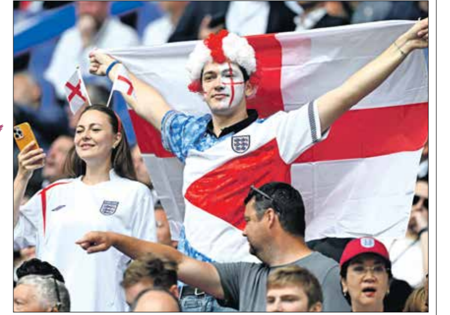
جماهير منتخب إنكلترا تلحم بحصد اللقب

يخوض منتخب إنكلترا اختباراً صعباً اليوم السبت (الساعة 19:00 بتوقيت القدس المحتلة)، عندما يواجه نظيره السويسري على ملعب مركز شتيل أربنا في مدينة نوسلدورف الألمانية. في الدور ربع النهائي من أمم أوروبا «يورو 2024»، وستشهد المواجهة تحدياً بين نجم كتيبة «الأسود الثلاثة» جود بيلنغهام (21 سنة)، وقائد سويسرا غرانيت شاكا (31 سنة)، في الوقت الذي يبحث فيه الأول عن لقب مع منتخب بلاده، بعد التتويج باللقب ودوري الأبطال مع ريال مدريد. ويتقابل المنتخبان للمرة الرابعة في مسابقة كبرى،