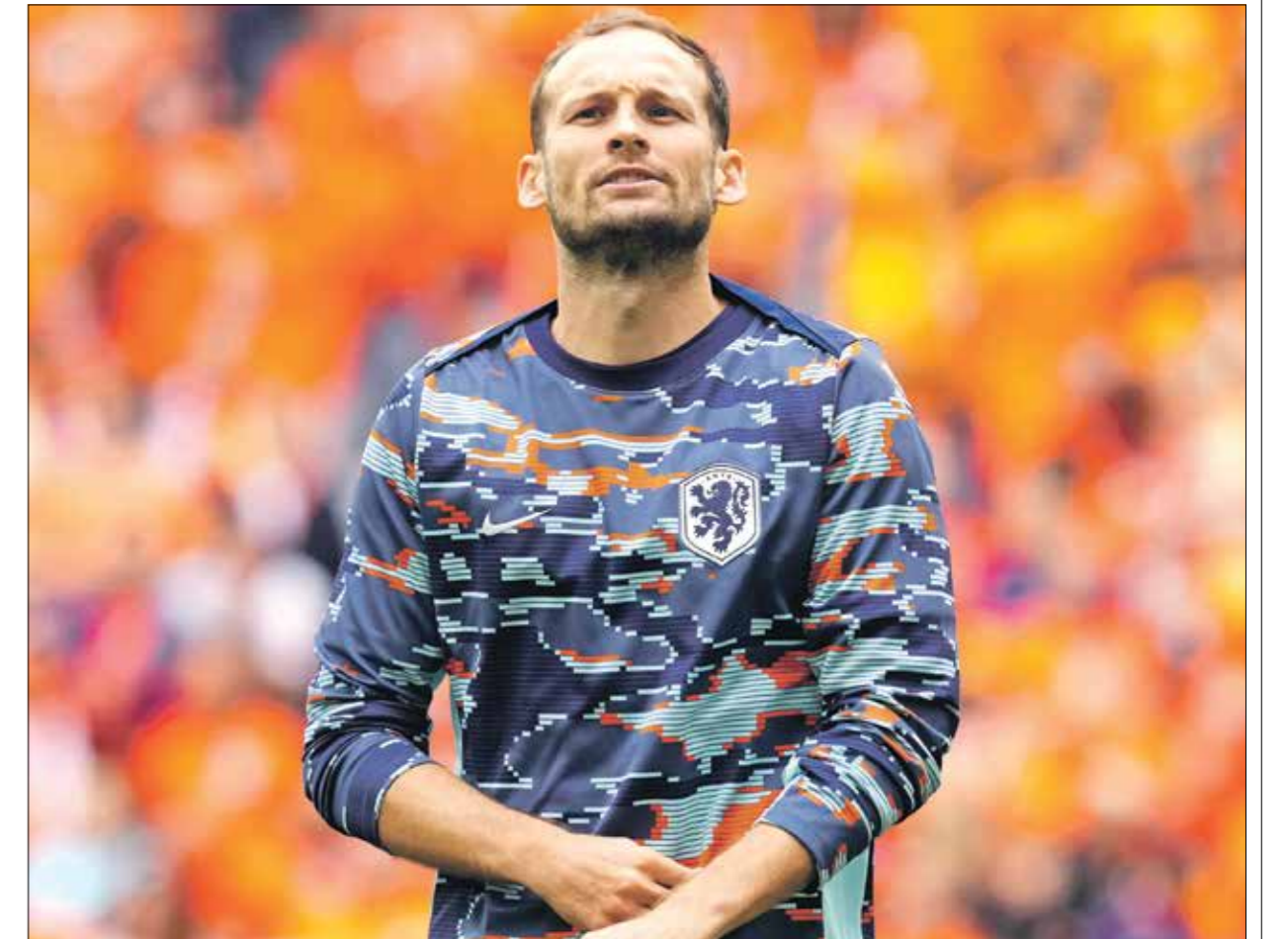
بليند أكد صعوبة مواجهة تركيا بحضر ملحقها

والثالثة في بطولة أوروبا، بعد أن فاز الإنكليز 0-2 في كأس العالم 1954، و3-0 في يورو 2004، وتعادلا 1-1 في يورو 1996. وخسرت إنكلترا مرة واحدة فقط من آخر 24 لقاء لها مع سويسرا في جميع المسابقات (فازت 17 مرة وتعادلت في ستة)، ولم تهزم في أربع، منذ الخسارة 1-2 في تصفيات كأس العالم في مايو/ أيار 1981. ووصلت إنكلترا إلى ربع النهائي في جميع بطولاتها الأربع الكبرى تحت قيادة المدرب غاريت ساونجيت، وهي المرة الأولى على الإطلاق التي تصل فيها إلى دور الثمانية في أربع نسخ متتالية من كأس الأم الأوروبية/ كأس العالم، فيما تاهلت في اثنين من مبارياتها الأربع في ربع نهائي أمم أوروبا. وبلغت سويسرا ربع نهائي بطولة كبرى للمرة الخامسة فقط (كأس العالم/ كأس الأم الأوروبية)، والثانية في بطولة أوروبا، بعد يورو 2020، وتم إقصاؤها في هذه المرحلة في جميع المناسبات الأربع السابقة؛ وهذا أكبر عدد شارك فيه أي بلد أوروبي في ربع نهائي لبطولة كبرى، من دون العبور إلى نصف النهائي. ويعد أن خسرت ستاً من أول ثماني مباريات (تعادلت مرتين) في بطولة أمم أوروبا، خُزمت سويسرا مرة واحدة فقط في آخر 14 مباراة لها في المسابقة (فازت في خمس وتعادلت ثماني مرات)، وأكد لاعب خط وسط سويسرا ستيفن زوير أنه يتوق لتترك بصمته في بطولة أمم أوروبا بعد أن غاب عن المباريات الأولى بسبب إصابة عضلية إلى إلقائه مكانه في تشكيلة المدرب مراد ياكين لصالح ميشال إيدرس. وكان لاعب وسط أوك ألتيا أحد أفضل لاعبي المنتخب السويسري في بطولة أمم أوروبا الماضية، حيث وصل فريقه أيضا إلى ربع النهائي. وفي ذلك الوقت، كان أفضل صانع ألعاب في البطولة، باريغ تمريرات حاسمة، ويعد ثلاث سنوات،