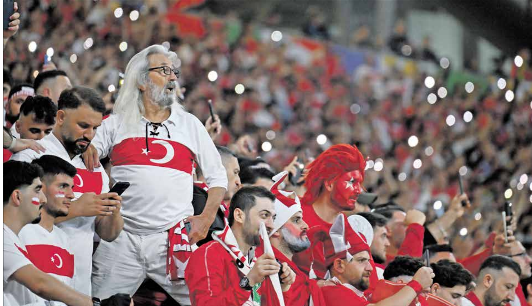
جماهير تركيا سكتوا حاضرة بقوة لدعم بلدها

أمم أوروبا) للمرة الرابعة، بعد يورو 2000، وكأس العالم 2002، ويورو 2008، ونجحت في بلوغ الدور نصف النهائي في البطولتين الأخيرتين، وفشلت فقط في ذلك بيورو 2000، بعد الخسارة 2-0 أمام البرتغال. وتاهلت هولندا ثلاث مرات فقط من آخر تسع مواجهات في الأدوار الإقصائية في بطولة أوروبا. ويعد الفوز على رومانيا 0-3 في دور الـ16 للنسخة الحالية، يتطلع المنتخب البرتغالي إلى الفوز بمبارتين بنظام خروج المغلوب في نسخة واحدة من النهائيات للمرة الثانية فقط، بعد عام 1988، عندما حصد اللقب.