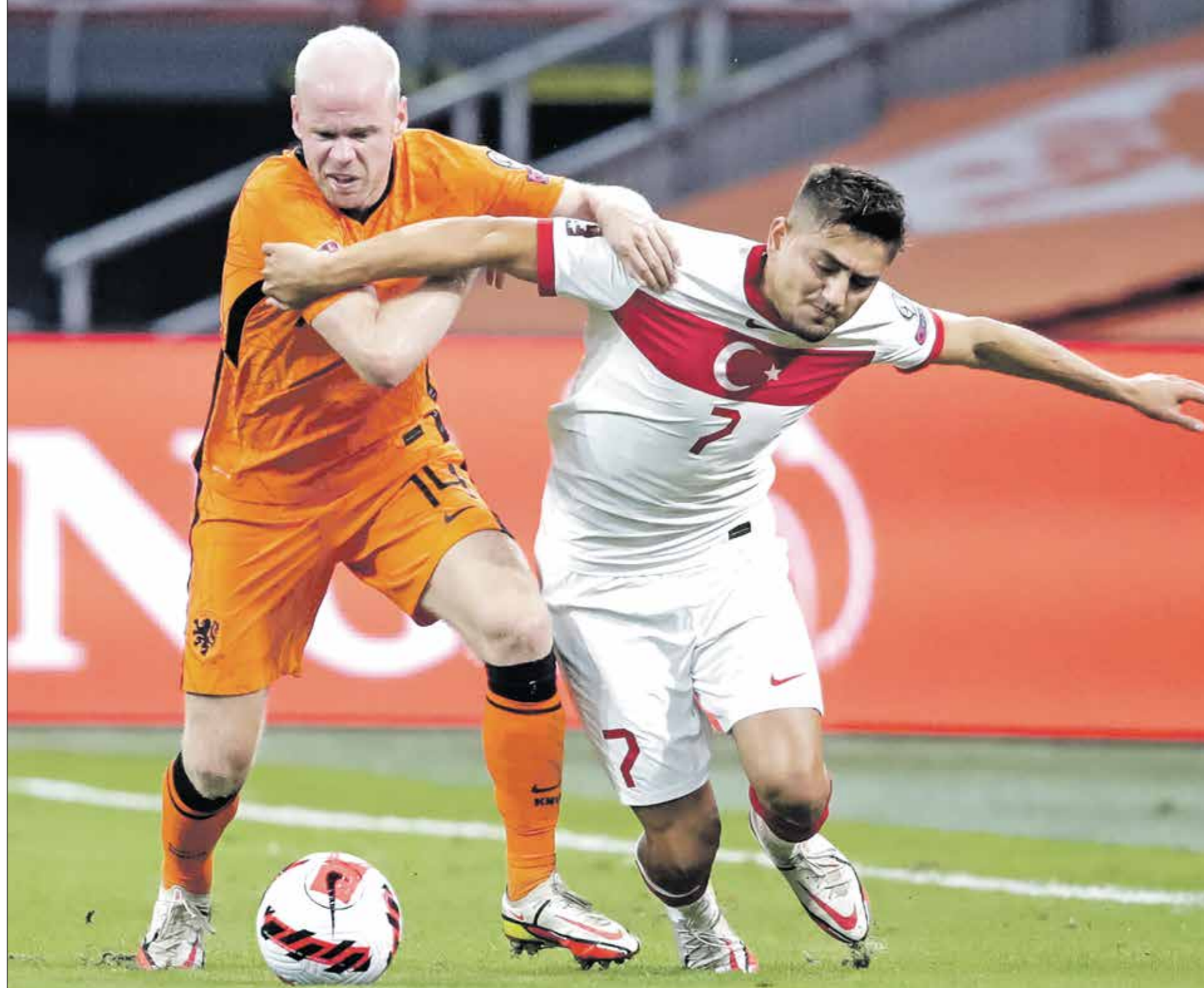
شهدت آخر مباريات بين هولندا وتركيا 13 هدفا

لم يتمكن سوى من المشاركة بضع دقائق في مباراة ثمن النهائي التي فازت بها سويسرا 0-2 على إيطاليا. وتتواصل مواجهات الدور ربع النهائي لبطولة أمم أوروبا لكرة القدم «يورو