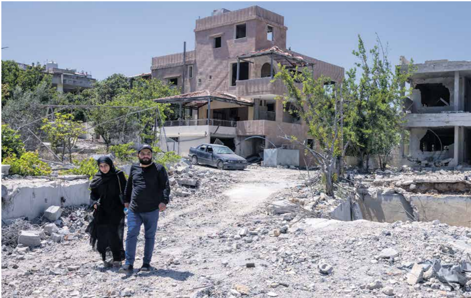
متدمار عينا الصليب، 29 يوليو 2024

وإسرائيل عام 2022) ولا يمكن مقارنة المسار اللبناني بالمسار الإسرائيلي في هذا الإطار»، مؤكداً أن «هذا الملف يحتاج إلى معالجة وسيتم العمل عليه بشكل جدي بعد الانتهاء من حرب غزة». وأمس الجمعة، استقبل الأمين العام لحزب الله، حسن نصرالله وفداً لبنانياً من حركة حماس برئاسة خليل الحية، حيث تم عرض التطورات الأمنية والسياسية في فلسطين وغزة وإوضاع جبهات الإسناد في لبنان واليمن والعراق، وذكر بيان عن