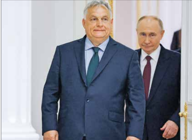
اوربان وبوتين في موسكو، 5 يوليو 2024

واعتبر أوربان، من جهته، أن «عدد الدول التي يمكن أن تتحدث للطرفين المتحاربين