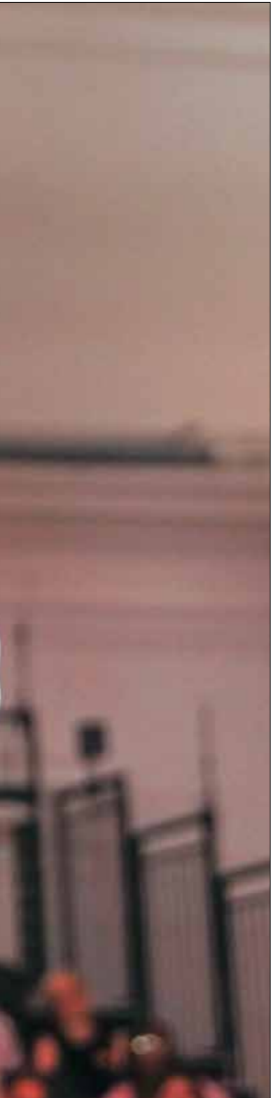
ستارمر ذلك تجمع انتخابي في لندن. 29 يوليو الماضي

من جهته، عُني حزب المحافظين باكثر الاحرار مكاسب كبيرة، بعد فوزه ب71 مقعدا، ليصبح بذلك ثالث أكبر حزب في البلاد. ويمكن اعتبار ليل الخميس، ليلة الأرقام التاريخية بأجسة من الانتخابات البريطانية، إذ سجلت مجموعة من الأرقام غير المسبوقة في التاريخ السياسي للمملكة المتحدة والتي تتكون من إنكلترا واسكتلندا وويلز وإيرلندا الشمالية، من بين هذه المعطيات، حصول المحافظين على أسوأ نتيجة في تاريخهم، وعدم فوزهم للمرة الأولى بأي مقعد في مقاطعة ويلز، وبعد مقاعدما حصل على عدد أصوات أكثر مما حصل عليه زعيم الحزب كير ستارمر في مسقط رأسه، كامدن، شمال لندن أيضا، بحسب صحيفه الإخبارية في تاريخ بريطانيا (12 أفضل نتيجة لحزب الخضر وحزب اليمين