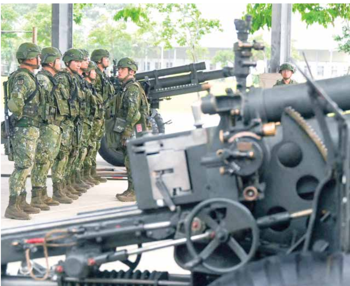
جنود تايوانيون وسط مدافع أميركية، هولاندا، 28 مايو الماضي

في المقابل، أجرى الجيش الصيني على مدار الأسابيع الماضية، تدريبات عسكرية