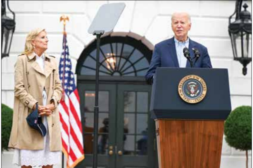
بايدن وولجعه جيك في البيت الأبيض، أول من أمس

من قبل أبرزهم بانهم سيواصلون دعم بايدن، وأنهم غير راغبين قبل أشهر قليلة على بايدن من الاستحقاق الانتخابي أختار جوجو جديدة، بحسب وكالات الأنباء العالمية، فمن تقرير جديد لها، نشر أمس، زادت صحيفة «نيويورك تايمز» من العديد من المناهضين الإثرياء للحزب يحاولون اليوم إسكان زمام الأمور بأيديهم، ضيفة أنه «مع تسخّر ثرواتهم في إطار سياسة الحزب والصفعة (الصعاب والجزرة)، فإن بعض المناهضين بدأوا بتراجع عدد من المبادرات للضغط على بايدن من أجل التراجع عن الترشح، والمساعدة في تعديد الطريق لإيجاد مرشح بديلا».