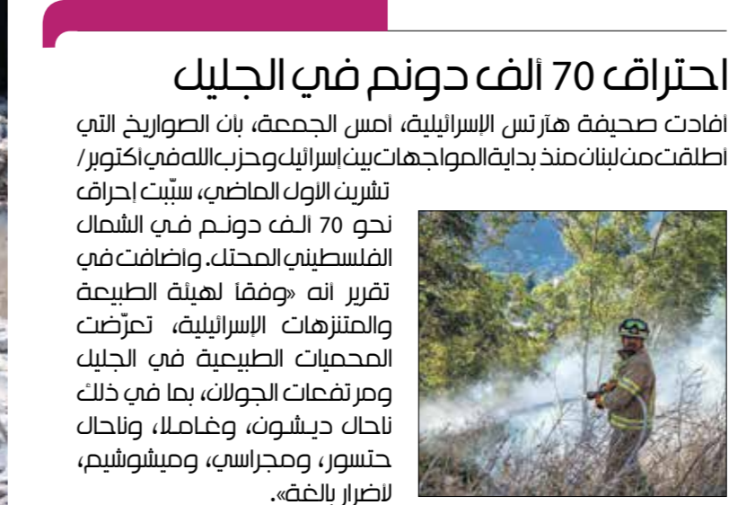
احتراق 70 الف دونم في الجليل

بيروت، رينا الحجاب حيفا، نايف زيداني استمر التصعيد الميداني على الجبهة اللبنانية، أمس الجمعة، بشأن برزخ تقديرات إسرائيلية جديدة بشأن الغارات بين هذه الجبهة وقطاع غزة، وذلك في ظلّ تشديد رئيس الوزراء الإسرائيلي على مواصلة الهجمات في لبنان. وأمس الجمعة، أشارت تقديرات إسرائيلية إلى أن التوصل إلى صفقة بين الاحتلال الإسرائيلي وحركة حماس، قد يقود إلى وقف لإطلاق النار على الجبهة اللبنانية، ولكن ليس إلى تسوية. ونقلت صحيفة يديعوت أخرونوت، عن مسؤولين أمنيين وسياسيين إسرائيليين، قولهم إن الآسئ الحام للحزب حسن نصر الله، لن يوافق على مقترح المبعوث الأميركي عاموس هوكتشاين، الذي يطرح بالأساس إبعاد الحزب عشرة كيلومترات عن الحدود الجنوبية للبنان مع فلسطين المحتلة مع العلم أنه في الوقت نفسه، أوضحت إيران لنصر الله، وفقاً للصحيفة العبرية، أنها لا ترغب توثق الحرب في حرب مع إسرائيل. وطالبت إسرائيل بإبعاد قوة الرضوان (نخبة حزب الله)، أكثر من عشرة كيلومترات عن الحدود بجمع مقاطعها، وكذلك أسلحة حزب الله الثقيلة، من صواريخ، ومضات وإطلاق، وقذائف شاون عيار 120 ملمبترأ وأكثر، وقذائف من نوعي بركان وفلق، وصواريخ مضادة للدبابات، وفسترات. وأشار «يديعوت أخرونوت»، إلى أن هذا الأمر هو محور اقتراح هوكتشاين، لكن إسرائيل أبدت اعتقادها أن نصر الله لن يوافق عليه، «ولهذا السبب سيكون من