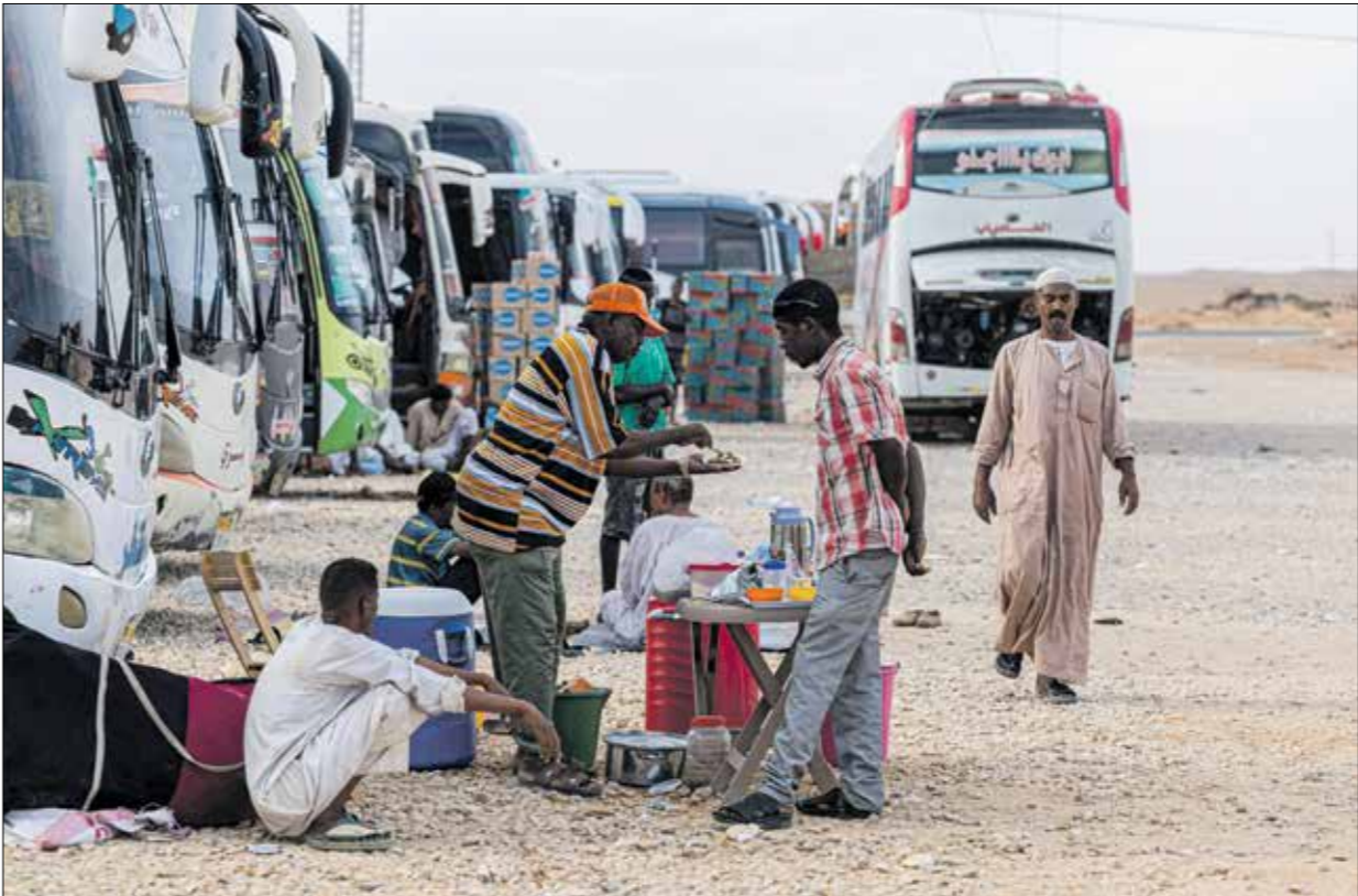
سائقو شاحنات سودانية في وداني بكر باسوات مايو 2023

وكانت مصر أعلنت في نهاية شهر مايو/ أيار الماضي، عزمها عقد المؤتمر، وحددت موعد له في نهاية يونيو/حزيران الماضي، لكنها أجلته، لعقد خلال يومي المساس السابع من يوليو/تموز الحالي (اليوم وعدا الأحد. وبدأت أحزاب وقوى سياسية، قبلت الدعوة المصرية، في التوافق خلال الأيام الماضية إلى الفاجرة للمشاركة في المؤتمر. ويقدّر عدد المشاركين فيه بنحو 18 حزباً وحركة مسلسلة، منها أحزاب فاعلة في تستيقف القوى الديمقراطية المدنية، مثل حزب الأمة القومي، والتجمع الاتحادي، والمؤتمر السوداني، وحركة تحرير السودان المجلس الانتقالي، وتجمع قوى التحرير. كما توافتت أحزاب نشطة في تحالف الكتلة الديمقراطية، مثل الحزب الاتحادي الديمقراطي الأصل - فصل جعفر المرعطي، وحركة العدل والمساواة، وحركة تحرير السودان - فصل منى أركو مناوي. في المقابل، اعتبرت عن عدم المشاركة في المؤتمر، الحركة الشعبية - شمال فضل عبد العزيز الحلو، والحركة الشعبية - الشمال الثوري بقيادة ياسر عثمان، وهي واحدة من أحزاب تنسيقية القوى الديمقراطية المدنية، فيما