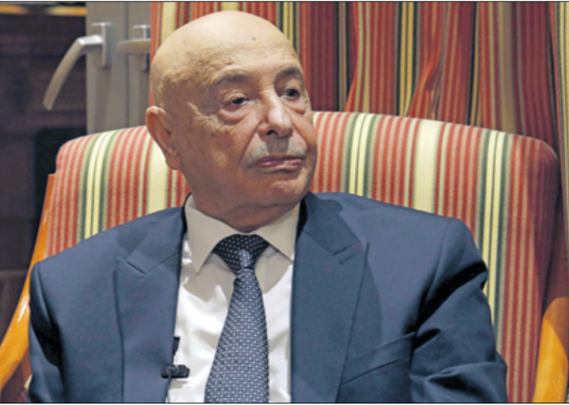
رئيس البرلمان الليبي قبيلة صالح، 2019

مستشار هاريس يلقى قيادات للمسلمين العرب في الاجتماع الذي جرى افتراضياً، إن جوران أبلغ القيادات في الاجتماع بدعم وقف إطلاق النار والاستقرار في المنطقة، فيما قال المحامي الأميركي المتقاعد ريتزر.