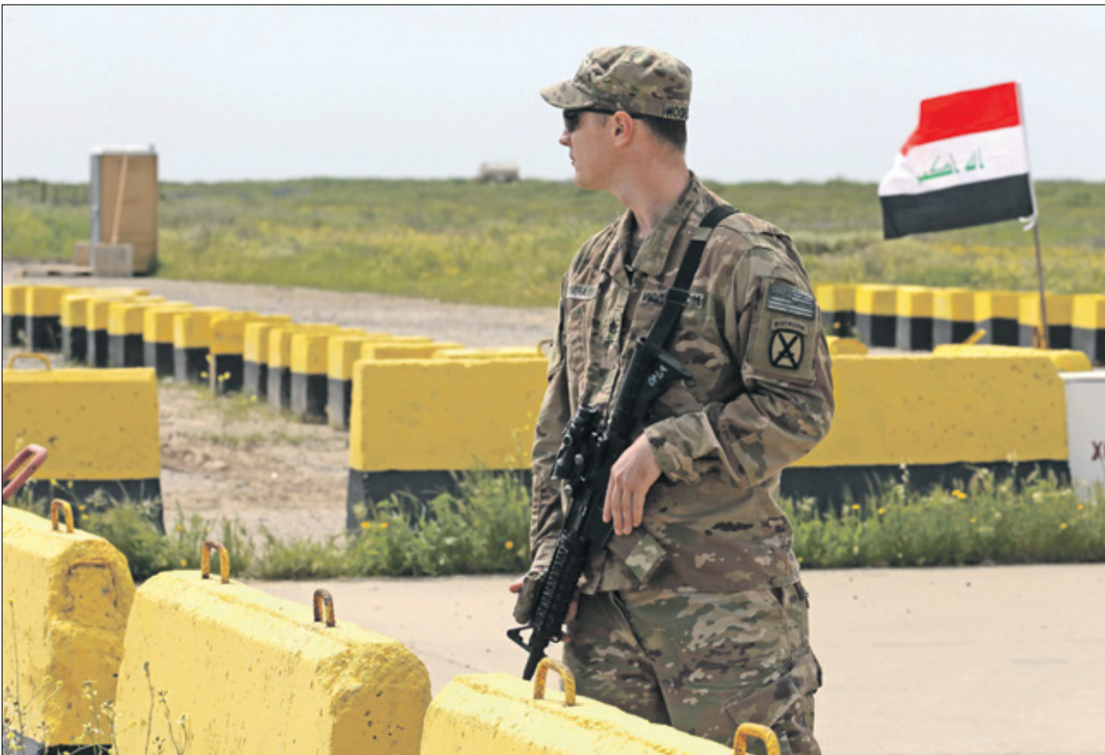
جندي اميركي في الموصل، مارس 2020

في حين يحرص بعض المسؤولين الإيرانيين من أن الشرق الأوسط قد يعثر من الحرب الشاملة، ونقلت الصحيفة عن مسؤولين كبار في إدارة بايدن، لم تكشف عن هوياتهم، أن المسؤولين الإسرائيليين يرغبون في تجنب اشتعال حرب جديدة في الشرق الأوسط، وأنهم يريدون تجنب أي تصعيد محتمل في المنطقة. وقال مسؤولون أمريكيون في وزارة الدفاع، إن الزيارة تهدف إلى تعزيز العلاقات بين البلدين، ولتأكيد الالتزام بالهدوء في الشرق الأوسط، وتعبير عن الدعم للجهود المبذولة لتحقيق السلام في المنطقة.