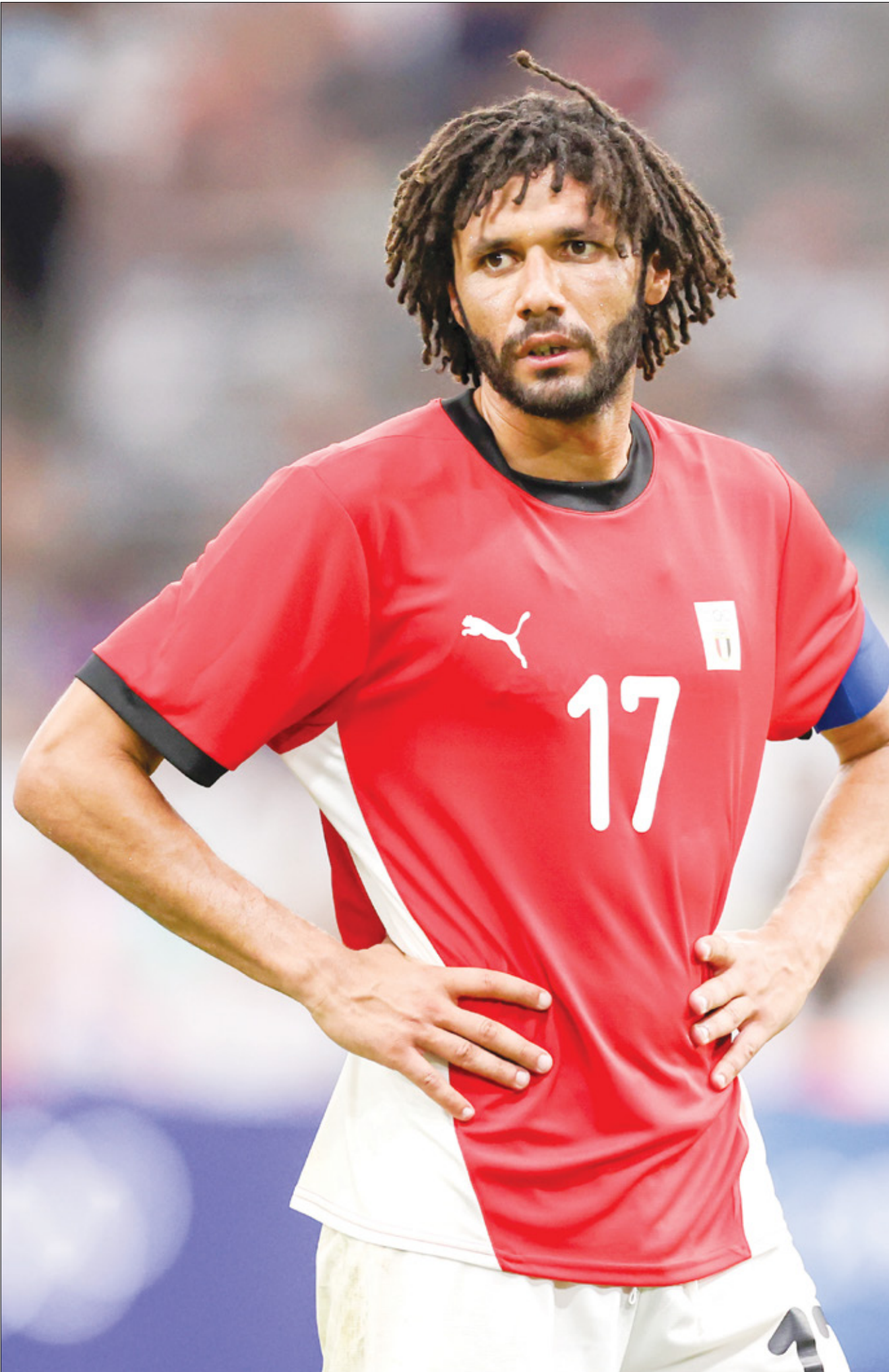
الشبان كان خارج التشكيلة رغم تالقته في الولىمبياد

وغير ذلك، فإن استبعاد لاعبي المنتخب المصري، وهو أمر غير معتاد، يثير انتقادات واسعة من الجماهير المصرية، ويثير تساؤلات حول مستقبل المنتخب في ظل غياب هؤلاء اللاعبين، خاصة وأنهم كانوا من اللاعبين الأساسيين في السنوات الأخيرة.