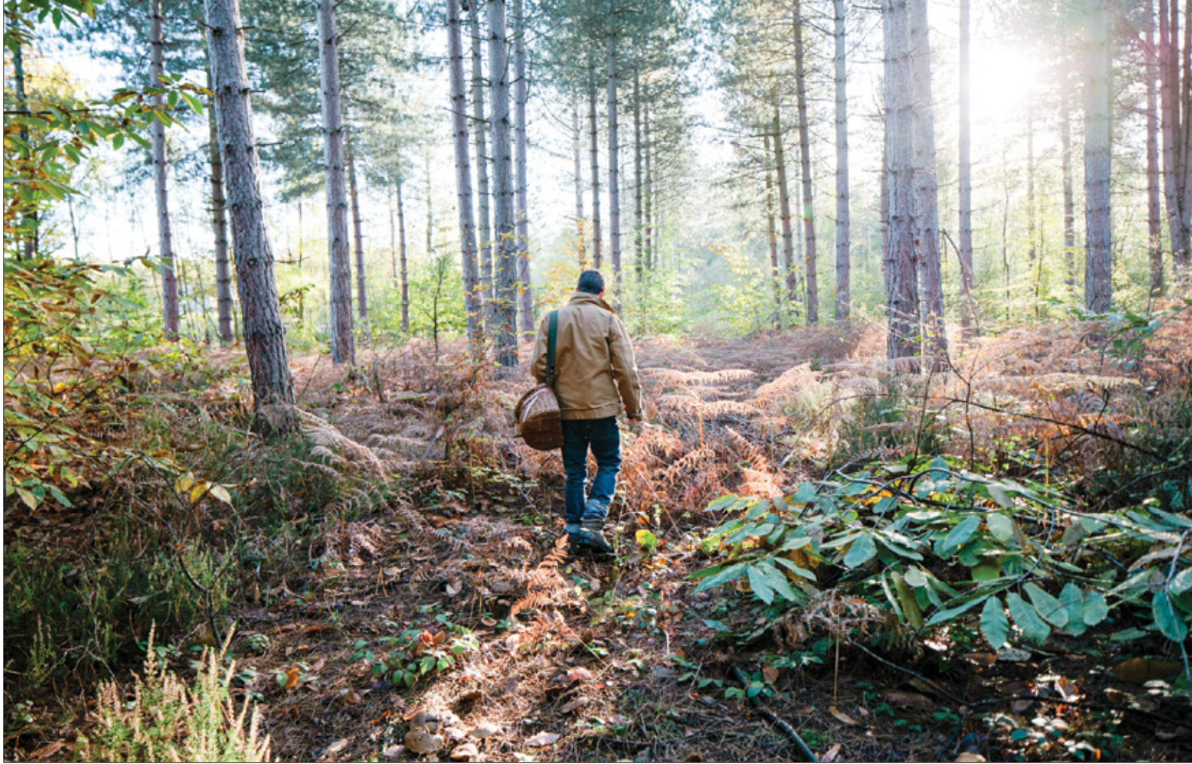
تشكل استعادة التربة تحدياً متنامياً للحفاظ على التنوع البيولوجي

في دراسة نشرت نتائجها في «رسائل علم الأحياء» التابعة للجمعية الملكية البريطانية، اكتشف باحثون أستراليون أن تشغيل صوت رتيب يحفز نشاط فطريات التربة المجهرية التي تساهم في تعزيز نمو النباتات