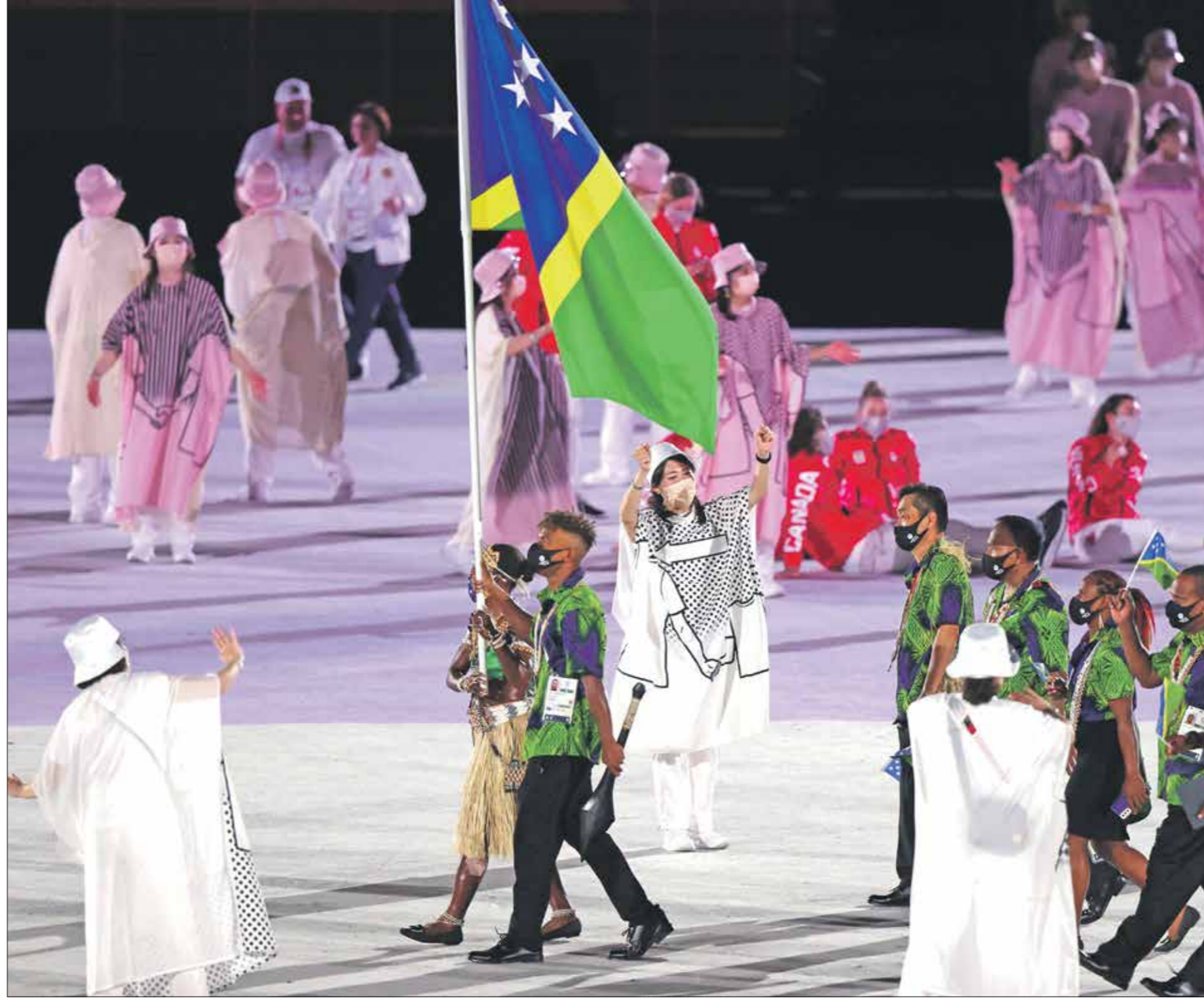
أختارت جزر سلیمان عدة مهراللون للتحفيزات 100 ملر (كليف/جور/جيتي)