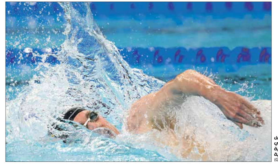
ويهن بات أول سائح إيرلندي يحصد ذهبية أولمبية