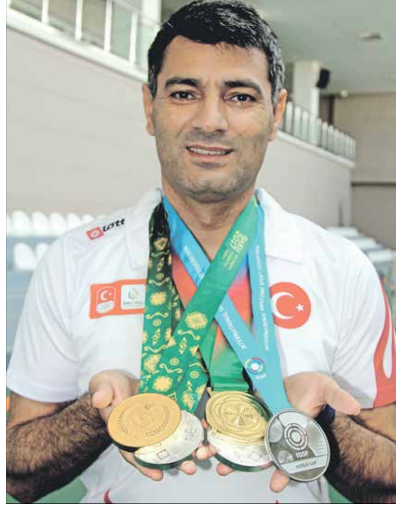
ديكيتش حصد العديد من الميداليات خلال مسيرته (الأضواء)