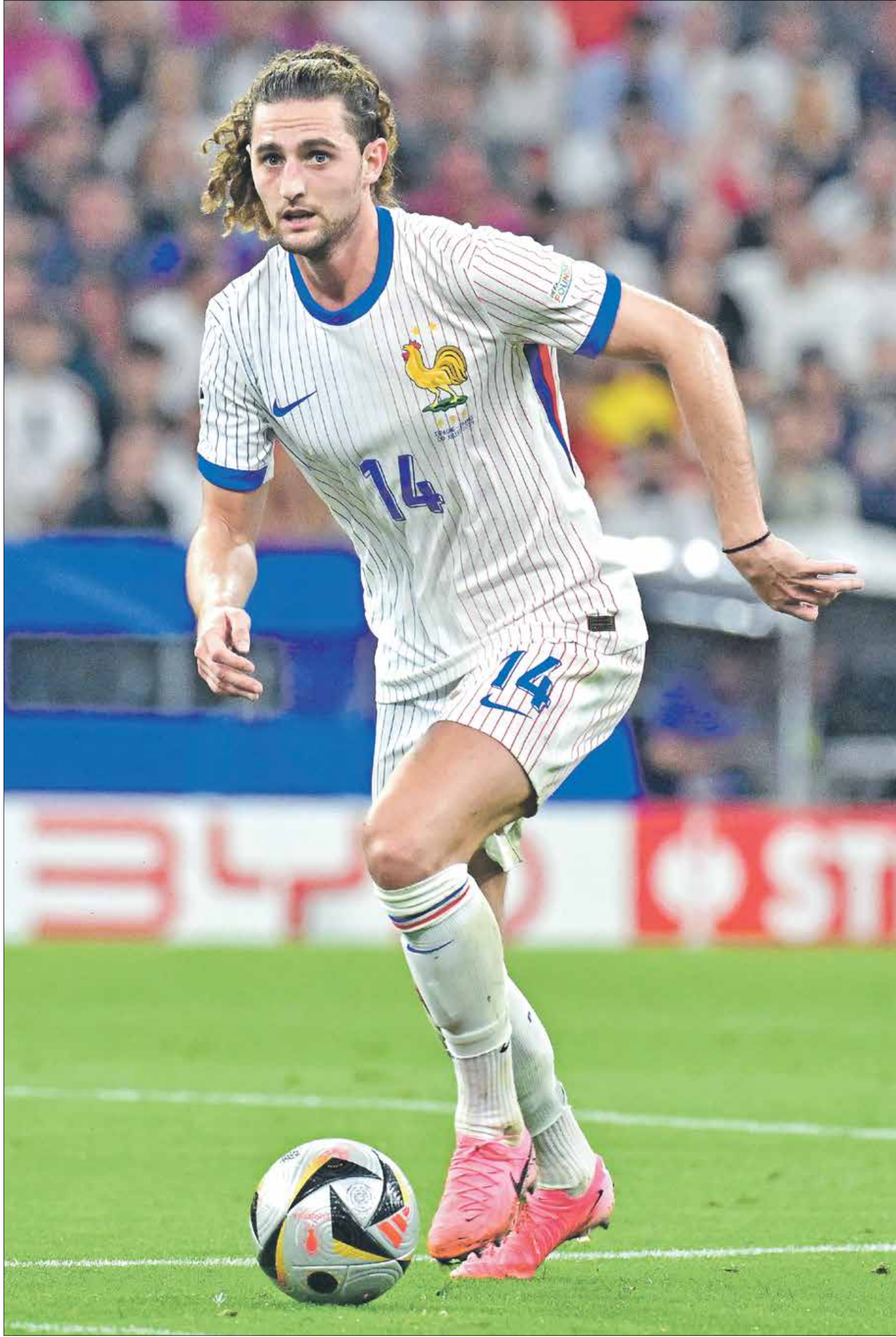
ادريان رابيو مع منتخب فرنسا على ملعب اليازر اربنا، 9 يوليو/تموز 2024

كشفت صحيفة لا غازيتا ديلا سبورت الإيطالية عن تفاصيل تخص لاعب خط الوسط الفرنسي ادريان رابيو (29 سنة)، بعد نهاية رحلته مع نادي يوفنتوس الإيطالي، حيث ستحاولندية كبيرة التعاقد معه في ميركاتو الصيف الحالي. ووفقاً للتفاصيل، فإنندية ارسنال الإنكليزي وريال مدريد والتليكو مدريد الإسبانيين دخلت في منافسة كبيرة من أجل محاولة التعاقد مع نجم خط الوسط الفرنسي، خصوصاً بعد أن ارتفعت أسهمه في سوق الانتقالات نظراً إلى المستوى الفني المتميز الذي قدمه في بطولة يورو 2024.