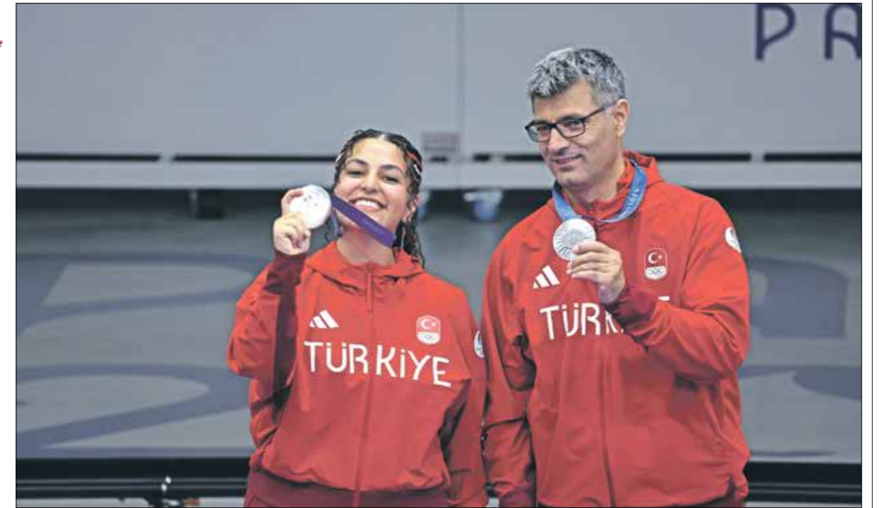
الرامي التركي توج بالميدالية الفضية (الأضواء)