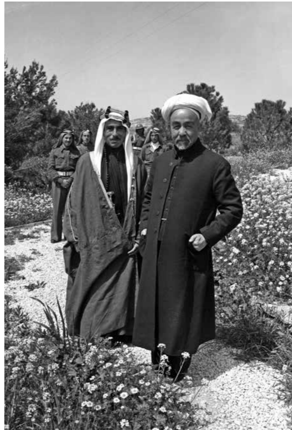
الملك عبدالله الثاني مع الأمير طلال عام 1948