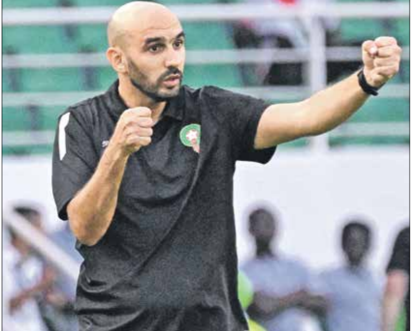
يصنع وايد الركراكي لحصيفة النتائج الايجابية مع منتخب المغرب

أخرى، يقرب الاتحاد المغربي لكرة القدم من كسب معركة استقطاب موهبة نادي ليل الفرنسي، أيوب بوعدى (١7 عاماً)، بعد أن حفظ الأبطال إليه، خلال مباراة ثابيه ضد ريال مدريد الإسباني، ضمن الجولة