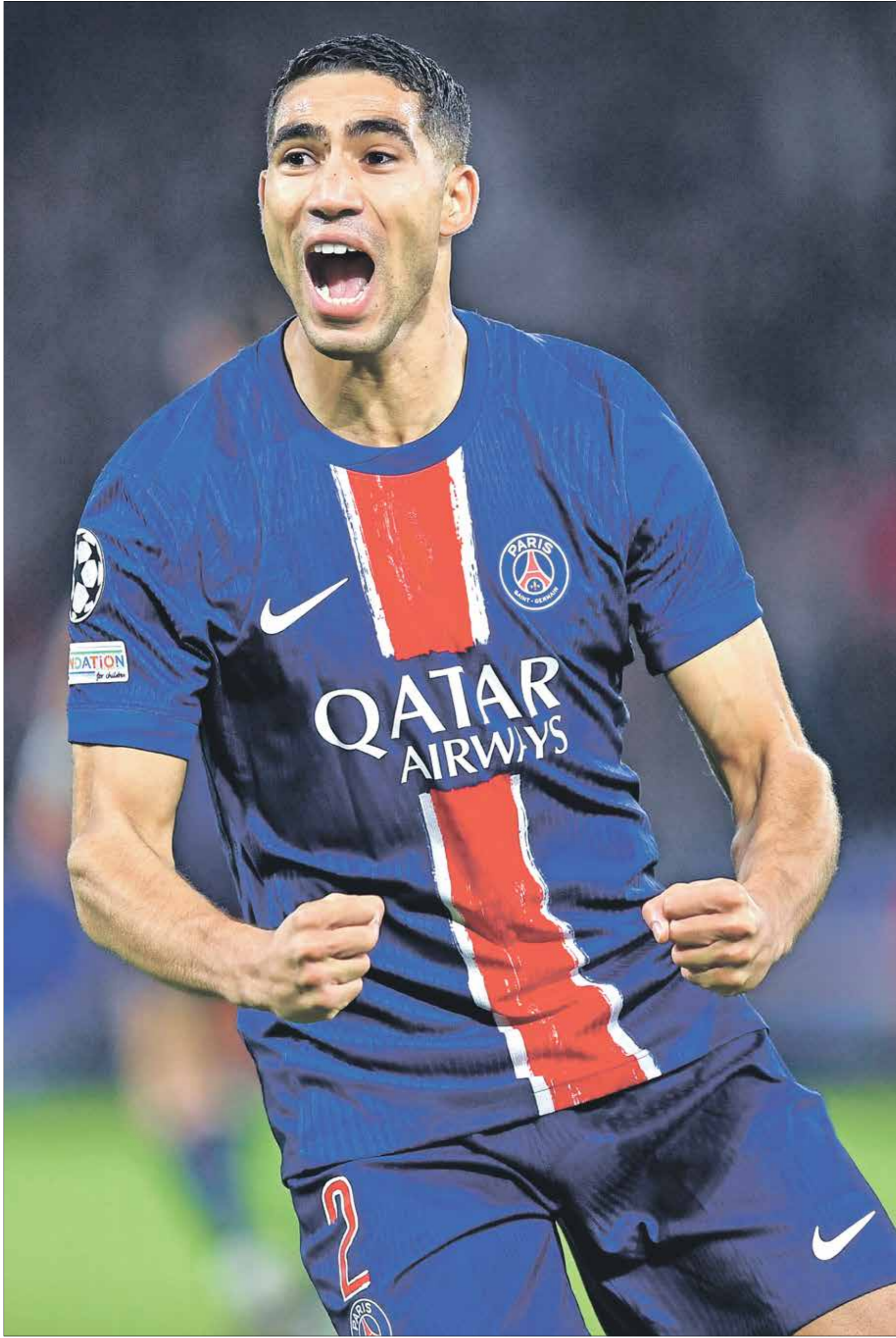
حكيمة، أحد أبرز نجوم سان جيرمان (مراهقو الرائد/الغد)

بات النجم المغربي أشرف حكيمة محط أنظار كبار الأندية في أوروبا، رغم أن عقده ينتهي مع فريق باريس سان جيرمان الفرنسي في صيف 2026. وأكدت صحيفة أس إس الإسبانية أن نادي ريال مدريد ومانشستر سيتي وليفربول، مهتمة بخدمات أشرف حكيمة بسبب قدرته على صناعة الفارق.