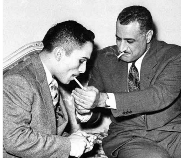
الملك حسين والرئيس جمال عبد الناصر