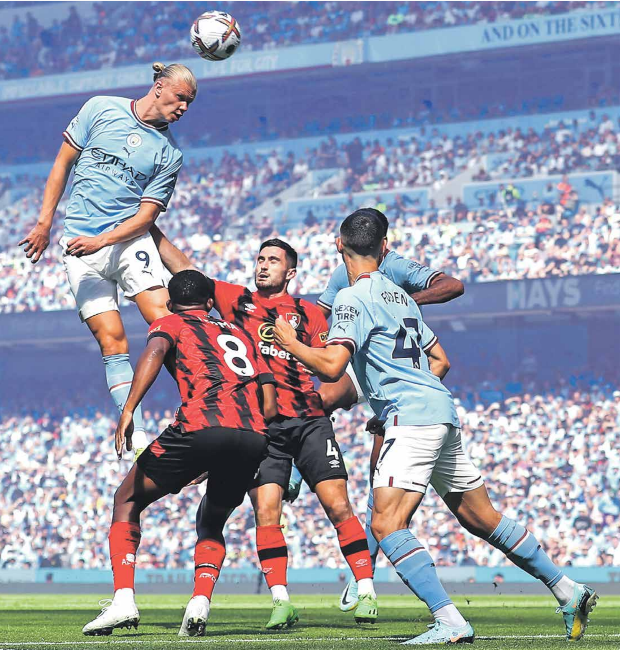
بريد مانستر على بولنموث

عندما يواجه لانس في الأسبوع العاشر من الدوري الفرنسي، ذلك أن حامل اللقب حقق نتيجة مميزة في الأسبوع الماضي، عندما انتصر على مرسييليا بنتيجة (03)، في واحدة من أهم المباريات بالنسبة إلى الفريق، ليؤكد نادي العاصمة الفرنسية حرصه على أن يحافظ على لقب الدوري