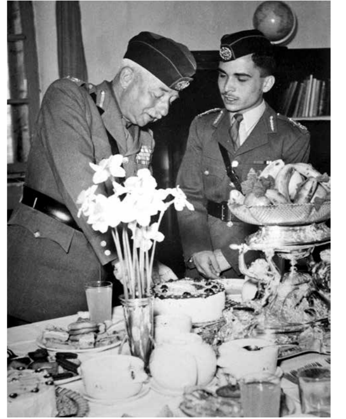
غلوب باشا مع الملك حسين

انخرط سليمان النابلسي في الحياة السياسية الأردنية وأصبح زعيماً وطنياً يمثل المعارضة للاتجاه الكوني للملك عبد الله الأول، ومن ثم للملك حسين، إلى أن فرض تشكيل أول حكومة برلمانية برئاسة أقالها الملك حسين عام 1957.