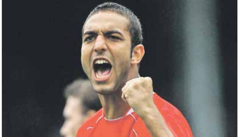
ميده اعزل بسبب صيطرة، وسيعود إلى الملاعب مجددا رغم لغمهم في السن