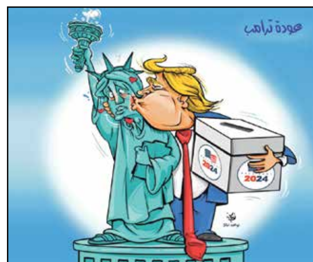
ترامب العائد ليحكم السيدة اميركا (نواف الملا، البلاد البحرينية)