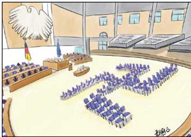
صليب النازية المعقوف سيرتسم قريباً في مقاعد البوندستاغ (زهرة عمر أوجلو، المصدر ذاته)

ما دار في خلد صاحبنا أن يكون كبلو البطاطا الذي اشتراه من ذلك البائع على الرصيف سبباً في نكته، لكن هذا ما حدث، لا لشيء سوى لأن سوء طالعته تزامن مع مرور موكب الرئيس في الشارع نفسه. هي لحظة غفلة، لا أكثر، جعلته لا يعير انتباهاً لما يحدث حوله، رغم أن الجميع في الشارع توقف للتصفيق «احتفاءً برؤية الرئيس» كما تقضي «التعليمات». وهكذا حل «الويل» بصاحبنا، فما كاد يلتقط آخر حبة بطاطا، حتى وجد نفسه محاصراً بأجهزة أمنية من مختلف الوحدات، من المخابرات حتى رجال الدفاع المدني الذين تقننوا أن غفلته تلك هي بمثابة «حريق» سيشتعل البلد، وينبغي «إطفاء» صاحبنا قبل أن تمتد السنة النيران إلى من حوله. أما العقوبة «الرادعة»، فلم تكن الحجز في زنزانة انفرادية لـ «إعادة التأهيل» فقط، بل فرض عليه أن «يصفق» طوال فترة سجنه، ليلاً ونهاراً، بل وحتى أثناء تناول الطعام والتبول. وما كان أصام صاحبنا من خيار، فقد اضطرر للامتثال؛ لأن عكس ذلك يعني بقاءه في الزنزانة مدى الحياة. صفق ثم صفق، ولم يتوقف رغم فترة سجنه الطويلة، حتى تأكد الجلادون أنه أصبح مؤملاً أن يكون «مواطناً صالحاً»، بل ازداد إعجابهم به وهم يرونه لا يتوقف عن التصفيق حتى وهو يغادر مبنى السجن. أما صاحبنا الذي فقد عقله، فما زال يشاهد مصفقاً عند قبر الرئيس.