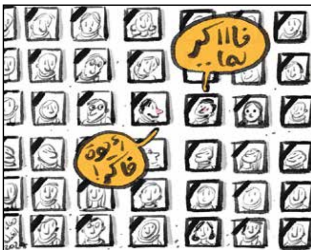
في ذكرى ثورة 25 يناير المصرية (دعاء العدل، المنصة)