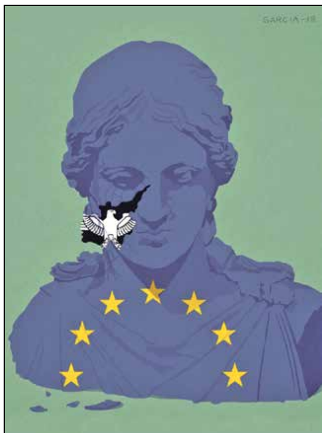
نسر النازية يشوه وجه أوروبا الموحدة (دانيال غارسيا، المصدر ذاته)

رعب سياسي وصدمة في برلين بعد حصول حزب البديل من أجل ألمانيا أو AfD على أرقام قياسية غير معهودة في استطلاعات الرأي تجعله منافساً حقيقياً لبقية الأحزاب الألمانية المتنافسة على الحكم وتندرج بتسلمه السلطة قريباً في ألمانيا، كما هو حال اليمين الهولندي والإيطالي الحاكمين الآن. انتفض كثيرون في ألمانيا ونزلوا إلى الشوارع وقرعوا جرس الإنذار، ومعهم الكثير من رسامي الكاريكاتير طبعاً.