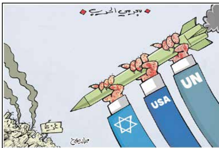
شركاء إسرائيل في جرائم حرب غزة (خالد صلاح، المصري اليوم)