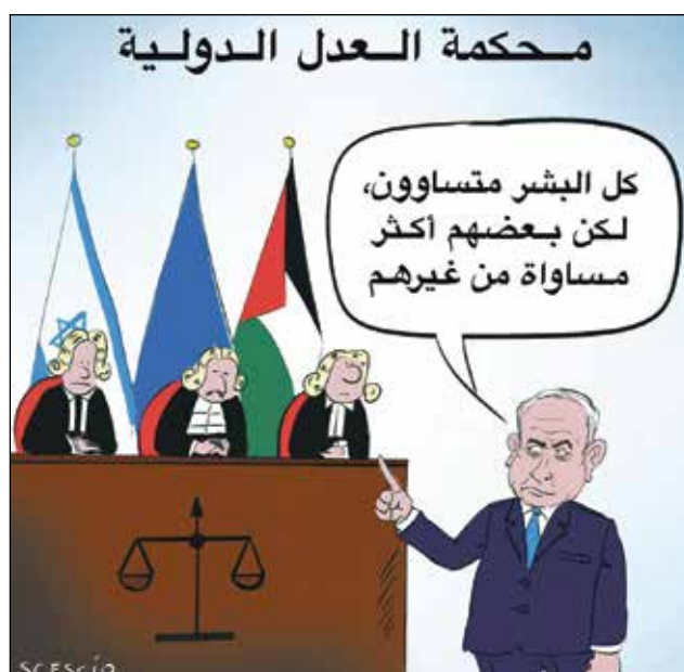
(سيسكيو، كار تون موفمنت)