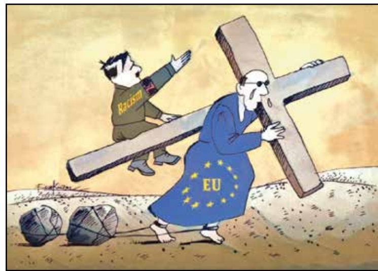
الاتحاد الأوروبي في درب العذاب مع اليمين الصاعد (فيروز كوثال، كار تون موفمنت)