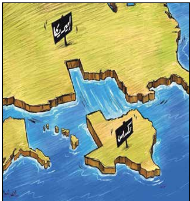
تكساس المنشقة عن اميركا (ماهر رشوان، الجريدة الكويتية)