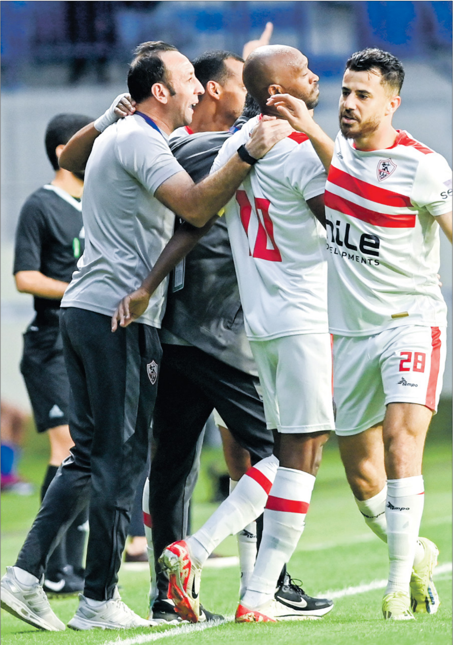
الزمالك في مهمة قوية ضد دريم الفاني

الزمالك يستضيف دريم الفاني وفي العاصمة المصرية القاهرة، يستضيف نادي الزمالك المصري نظيره دريم الفاني في جولة ذهاب الدور نصف النهائي، أملاً في نتحة طيبة عبر فوز كبير يضع من خلاله (بطل نسخة 2019) قدماً في النهائي. ولن تكون مهمة الزمالك سهلة، رغم فارق التاريخ بينه وبين دريمز في اللقاء، خاصة مع كثرة الغيابات التي ضربت صفوف الزمالك في الأيام الأخيرة، ومنها غياب منتظر لنجمه الكبير وهدافه الأول أحمد مصطفى زيزو الجناح الأيمن، بسبب الإصابة التي تعرض لها أمام الأهلي في قمة الكرة المصرية بالدوري المحلي. ويفتقد الزمالك إلى جانب زيزو، لاعبين آخرين مثل يوسف أوباما نجم الوسط الهجومي، الذي تعرض لإصابة قوية قبل فترة، وكذلك غياب ثنائي الوسط الكبير ناصر ماهر وعبد الله السعيد بداعي الإصابة، ويعتمد