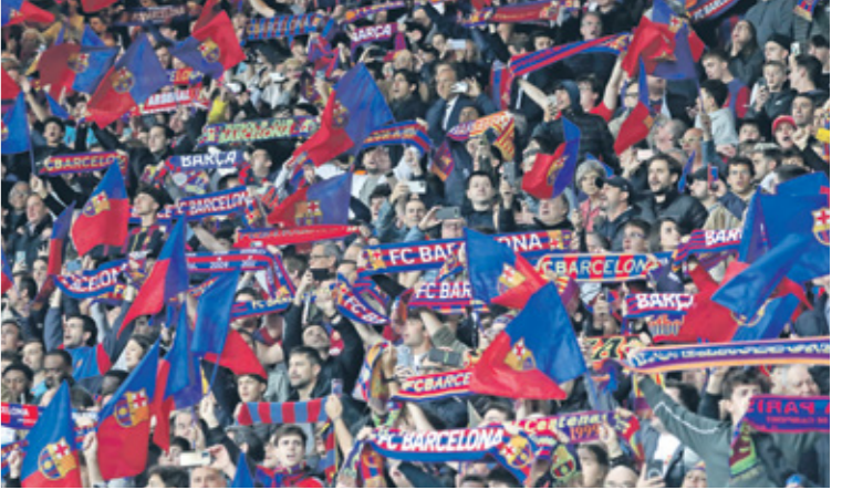
يبحث برشلونة عن مصالحة جماهير من بوابة الكلاسيكو (جون فلان) (Getty)

الغوز في 74 مباراة وتعادلا في 35، وسجل الريال 301 هدف مقابل 299 للبارسا، بحسب الأرشاب من حسم لقب الدوري الإسباني لكرة القدم، وذلك حينما يستضيف غريمه التقليدي برشلونة في مباراة الكلاسيكو، اليوم الأحد، في الجولة الثانية والثلاثين من المسابقة.