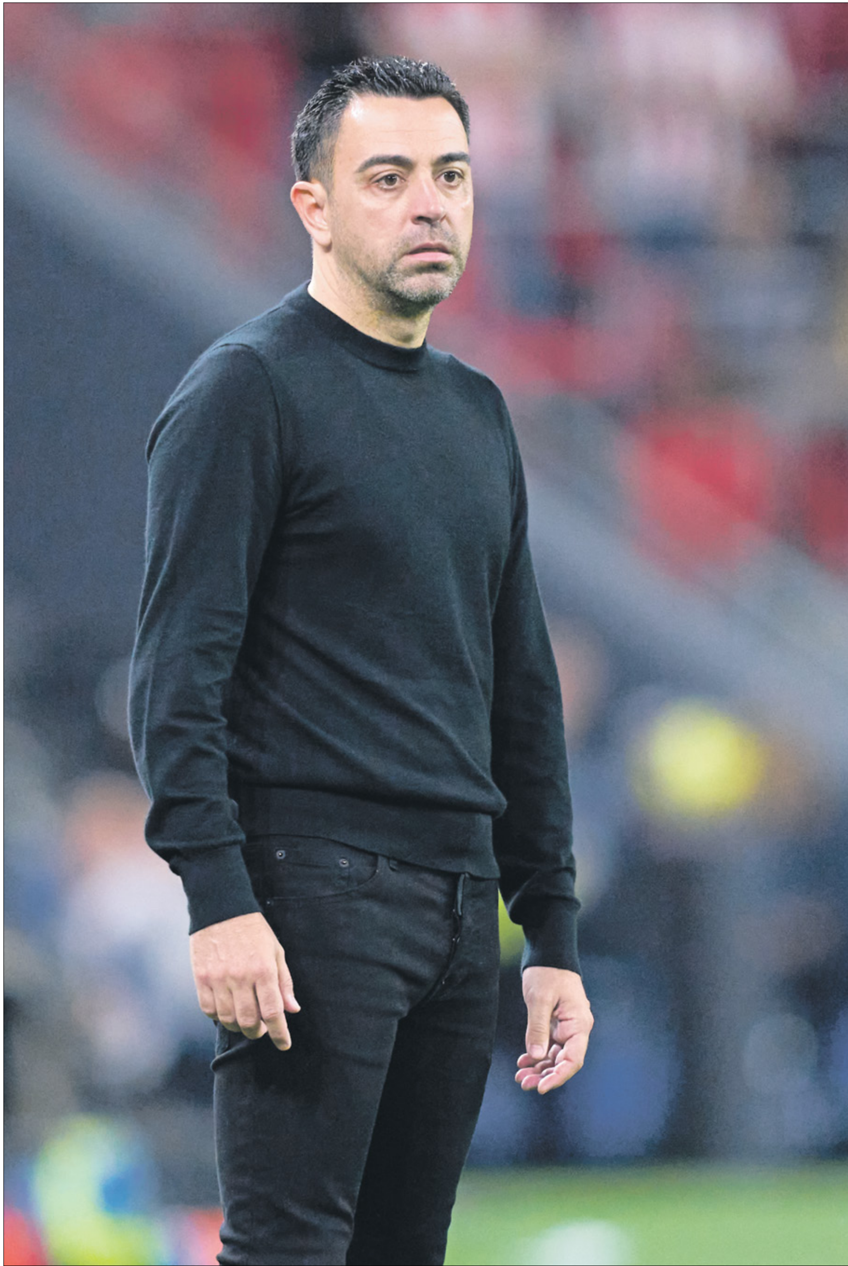
يريد تشافي الرحيل عن برشلونة في نهاية الموسم الحالي

أصبح مستقبلاً تشافي هيرنانديز، مدرب نادي برشلونة، حديث وسائل الإعلام العالمية، بعدما أكد مغادرته الفريق الكتالوني في نهاية الموسم الحالي. وكشفت صحيفة سبورت الإسبانية أن إدارة أياكس أمستردام تواصلت مع تشافي حتى يشرف على تدريب الفريق في الموسم المقبل.