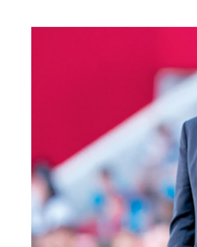
نجمشلونة في الثالث مع البراز زعم اصحاب (كريستيان رونالدو)

نقطة بفارق ثماني نقاط أمام برشلونة، الصيف، مع ثماني سبع مباريات على نهاية الدوري. إذ يدخل «الملك» المباراة بمعنويات مرتفعة بعد تأمله لتدور قبل النهائي في بطولة دوري أبطال أوروبا، عقب