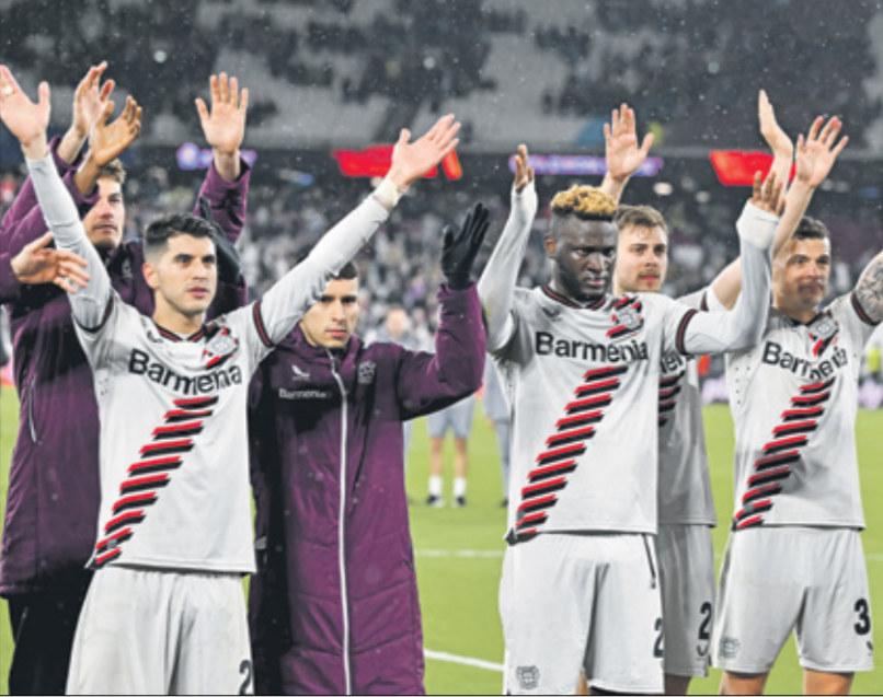
يسلم باير ليفركوزن لنهاء الموسم مع دون أي خسارة

متتالية في بطولة الدوري لإنهاء الموسم من دون خسارة، كما وتمكنه كسر الرقم القياسي لعدد النقاط في بطولة الدوري والذي يبلغ 91 نقطة وحققه فريق بايرن ميونخ في موسم 2012-2013. إذ في حال فوز النادي البافاري في آخر خمس مباريات وحصده 15 نقطة، فإن رصيده سيرتفع إلى 94 نقطة، وبالتالي سيجعل رقماً قياسياً غير مسبوq في كرة القدم الألمانية ويحطم رقم بايرن الذي بقي صامدا لعشر سنوات وأكثر. كما ويملك فريق ليفركوزن فرصة ذهبية لتحقيق الثلاثية في موسم 2023-2024، إذ بعد حسمه لقب بطولة الدوري ووصوله إلى الدور نصف النهائي في بطولة الدوري الأوروبي وتأهله إلى نهائي بطولة كأس ألمانيا، اقرب من الثلاثية التي سبق أن حققها فريق الماني واحد وهو بايرن ميونخ (ثلاثية عامي 2013 و2020، بتحقيق لقب الدوري والكأس ودوري أبطال أوروبا). ووصوله إلى الدور نصف النهائي في بطولة الدوري الأوروبي وتأهله إلى نهائي بطولة كأس ألمانيا، اقرب من الثلاثية التي سبق أن حققها فريق الماني واحد وهو بايرن ميونخ (ثلاثية عامي 2013 و2020، بتحقيق لقب الدوري والكأس ودوري أبطال أوروبا). ولن تكون مواجهة أمام بوروسيا دورتموند سهلة على طول البوندسليغا هذا الموسم، خصوصا بعد العرض الكبير الذي قدمه إمام أثلتكو مدريد الإسباني في إياب الدور ربع النهائي لدوري أبطال أوروبا، وتأهله إلى الدور نصف النهائي. وهذا التأهل سمحه دفعة معنوية كبيرة قبل مواجهة المتصدر، لمحاولة التتوق على ليفركوزن وإنهاء سلسلة المباريات من دون خسارة، مما سيصعب المواجهة كثيراً على