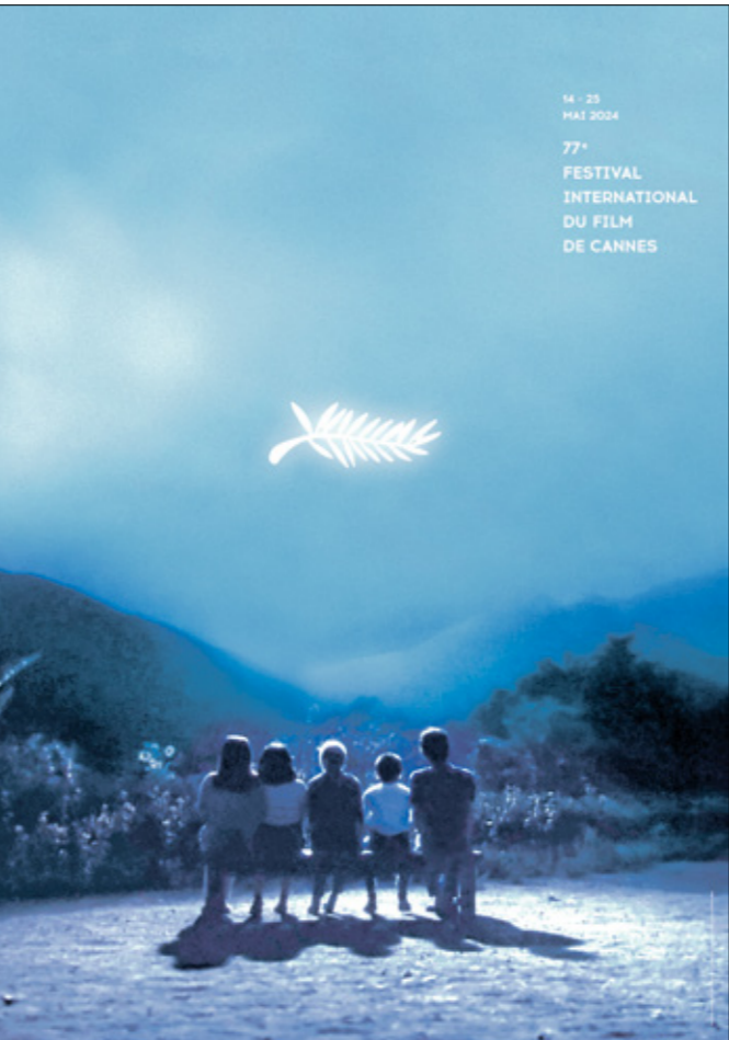
ملصق الدورة الـ77: «السود في الب» لكورسواوا (موضع المهرجان)

تحية خاصة من المهرجان له، بمناسبة الذكرى الـ90 لولادته (1924 - 1996). المهرجات الصناعة السينمائية البارزة ومونتجاتها حضور متفاوت في ملصقات المهرجان، أكثرها انتشاراً تلك الخاصة بتريط السيلولويد» والبكرات وملصق فيلم، كما بالكاميرا السينمائية بإطالاتهم على الملصق والاستنشاق الوحد لإيطالي ماريتشيلو ماسترواني، الذي صنَّع وجهه ملصق الدورة الـ67 (14 - 25 مايو/أيار 2019)، التي تزامن