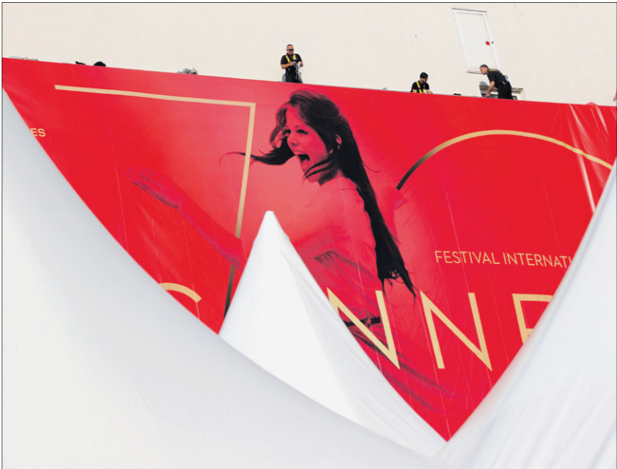
ملصق دورة عام 2017 تظهر على الشاشة كاترينا كاردينالو