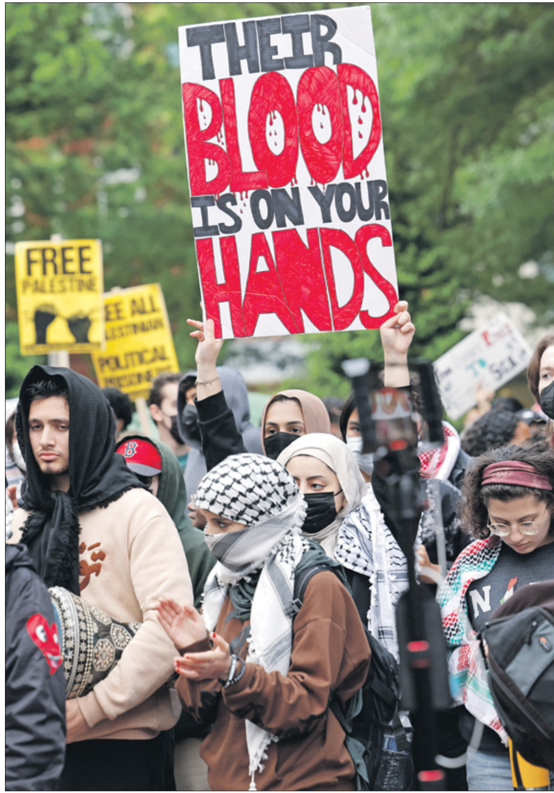
خلال تظاهرة مناصرة للفلسطينيين في جامعة جورج واشنطن، 25 إبريل، 2024